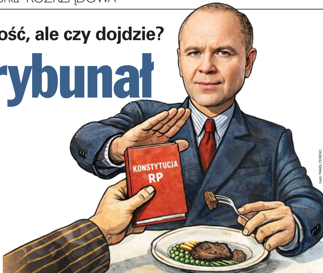
ILUSTR. PRAWEL FERENC

cji. W 2024 r. koalicja rządząca chciała wprowadzić możliwość skrócenia kadencji prezesa TK lub odwołania go w drodze uchwały Zgromadzenia Ogólnego. Ustawa została skierowana przez prezydenta Andrzeja Dudę do kontroli konstytucyjnej, TK zaś w 2025 r. uznał te przepisy (jakżeby inaczej) za niezgodne z konstytucją, wskutek czego nie weszły w życie.