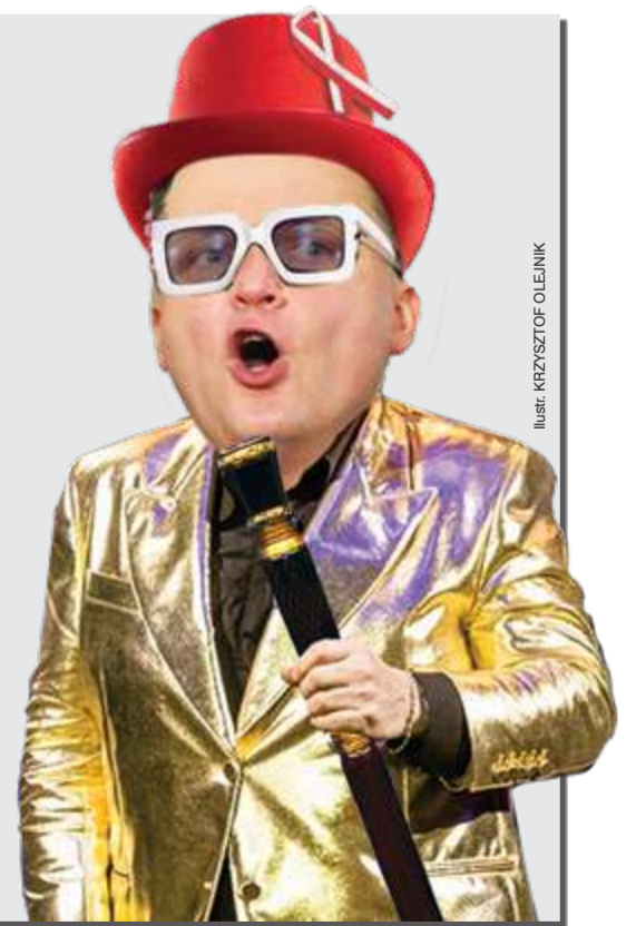
ILUSTRACJA: KRZYSZTOF OLEJNIK

Każdy taki kabotyn musi prędzej czy później skończyć w politycznym grobie.