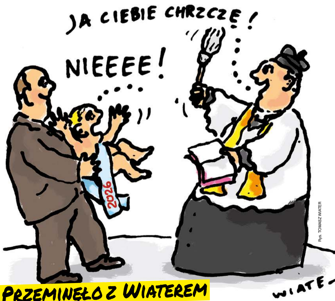
PRZEMINĘŁO Z WIATEREM