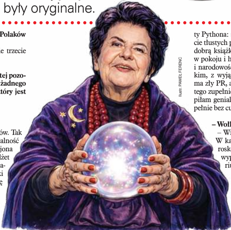
ILUSTR. PAMEL FERENC

– Prawda. Wracając do tematu: wobec tej powszechnej potrzeby poznania przyszłości przygotowałyśmy horoskop dla naszych Czytelniczek.