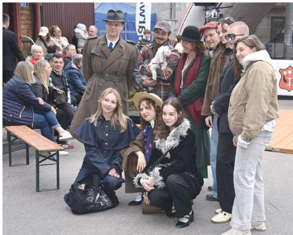
Tegorocznej imprezie przyświecało hasło „Jak w starym kinie”, co bezpośrednio nawiązywało do jubileuszu 70-lecia istnienia Kina „Wilga”

W niedzielę, 17 maja, z okazji jubileuszu 70-lecia Kina „Wilga” odbył się Festiwal Kultury i Tradycji Garwolina w filmowym stylu.