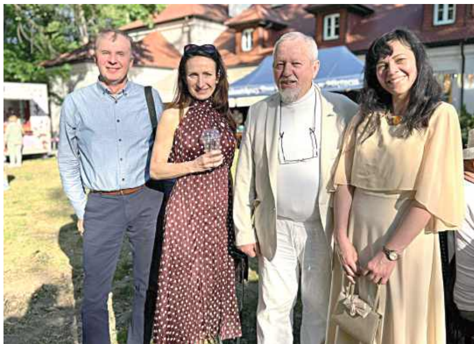
Festyn miał jednak nie tylko edukacyjny, ale i integracyjny charakter

Nie zabrakło również rękodzielników, którzy przygotowali kolorowe i różnorodne stoiska. Odwiedzający mogli podziwiać lokalne wyroby, kupić ozdoby i produkty regionalne, a także spróbować tradycyjnych polskich potraw i domowych deserów.