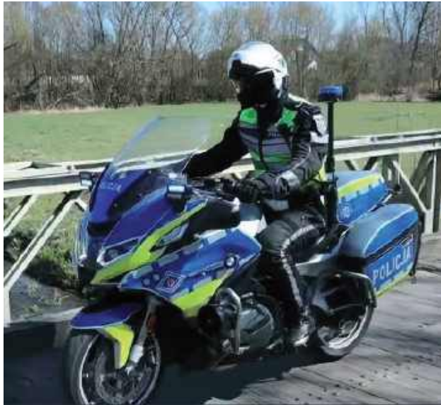
Policyjny motocyklista z Radomia dwukrotnie zatrzymał sprawców kradzieży sklepowych podczas pełnienia służby. Funkcjonariusz z Wydziału Ruchu Drogowego Komendy Miejskiej Policji w Radomiu wykazał się czujnością i szybką reakcją, dzięki czemu skradziony towar wrócił do sklepów

Do pierwszego zdarzenia doszło w weekend około godziny 11 na ulicy 25 Czerwca. Policjant, który wykonywał czynności związane z kolizją drogową, zauważył kobietę wybiegającą ze sklepu. Za nią podążył pra-