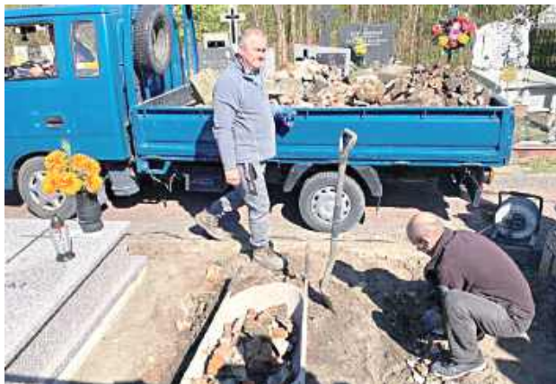
Dotychczasowy pomnik, naznaczony upływem czasu, został zastąpiony nowym monumentem, który będzie trwałym symbolem pamięci (Parafia Świętego Izydora Oracza w Marianowie)

W ostatnich dniach na cmentarzu parafialnym w Marianowie były prowadzone prace przy pomniku Żołnierzy Wojska Polskiego poległych w bitwie z okupantem niemieckim we wsi Rębków-Żwirówka w sierpniu 1944 roku.