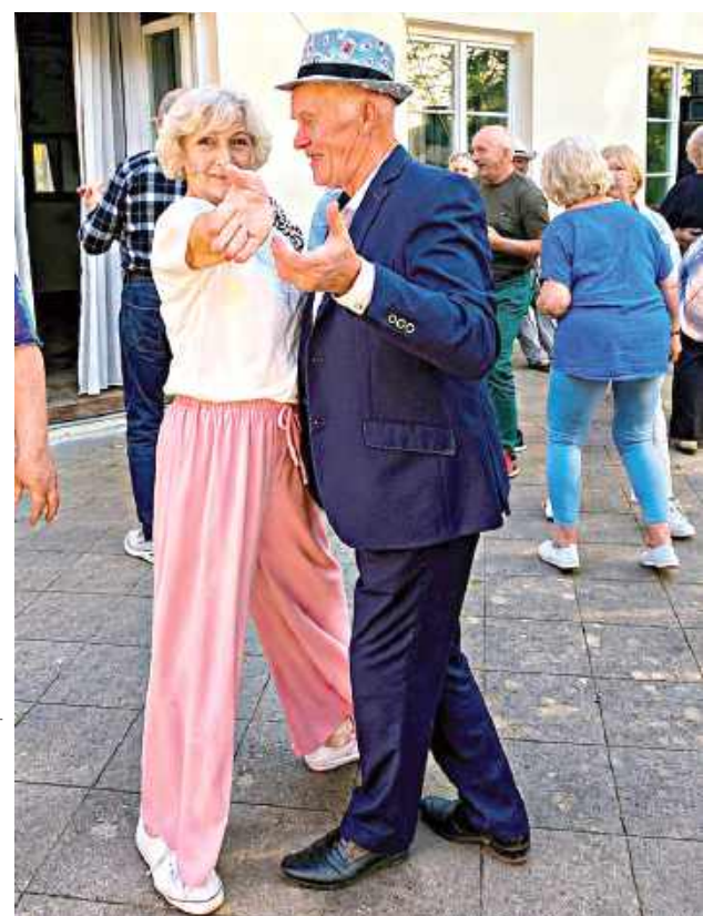
Dobra zabawa trwała do późnych godzin wieczornych

Galeria zdjęć z wydarzenia na portalu kuriergarwolinski.pl