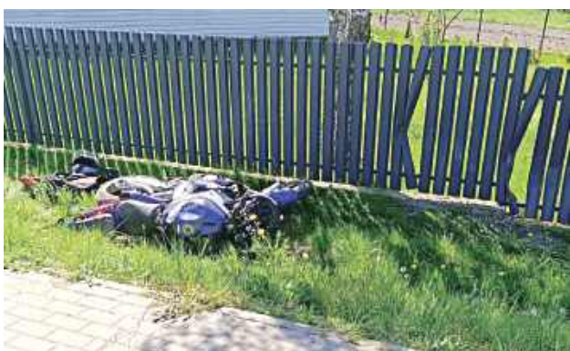
Wypadek, który miał miejsce w Samorządkach