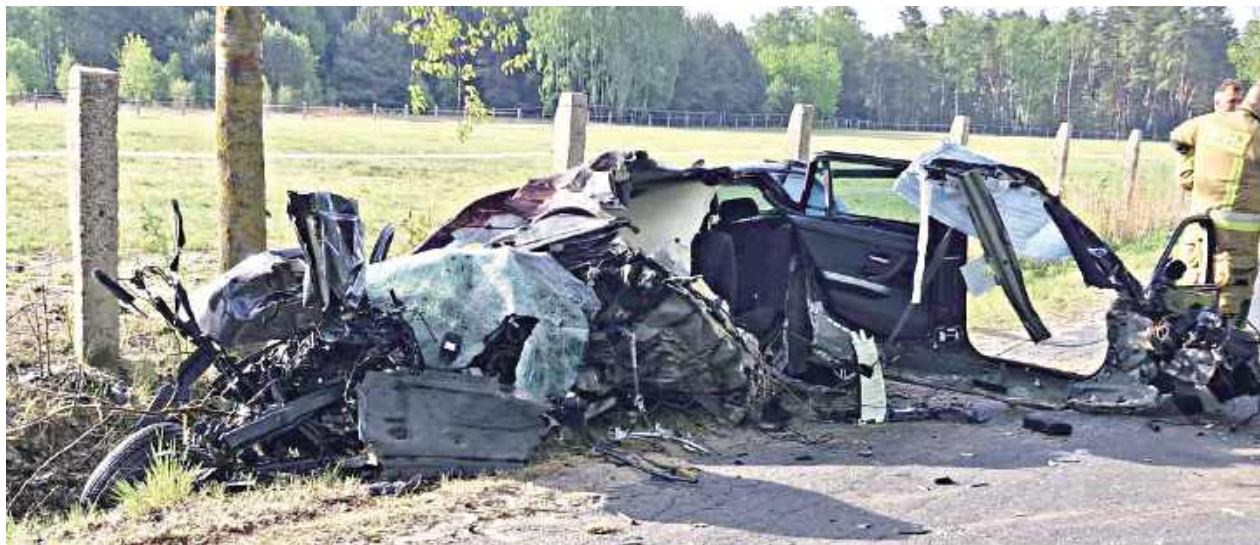
Tragiczny wypadek drogowy w powiecie wyszkowskim zakończył się śmiercią 40-letniego kierowcy BMW

Tragiczny wypadek drogowy w powiecie wyszkowskim zakończył się śmiercią 40-letniego kierowcy BMW. Do zdarzenia doszło nad ranem na jednej z dróg powiatowych.