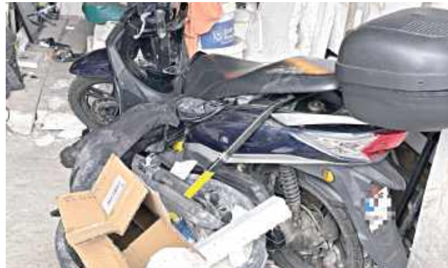
Podejrzanu usłyszał liczne zarzuty i trafił do policyjnej celi. Grozi mu do 10 lat pozbawienia wolności

Dzięki dalszym działaniom kryminalnych udało się odzyskać większość skradzionych przedmiotów. Łączna wartość odzyska-