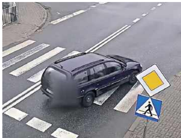
Kierowca zignorował polecenia do zatrzymania i rozpoczął desperacką ucieczkę

29-latek pędził ulicami miasta, łamiąc niemal wszystkie możliwe przepisy ruchu drogowego: wyprzedzał na skrzyżowaniu, jechał pod prąd i po chodniku, prze-