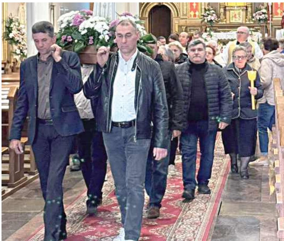
Podczas nabożeństwa odbyła się wspólna modlitwa różańcowa i procesja fatimska (Parafia Trójcy Świętej w Gończycach)

13 maja w parafii Trójcy Świętej w Gończycach po mszy świętej o godzinie 18 odbyło się pierwsze z sześciu tegorocznych nabożeństw fatimskich.