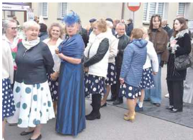
Uczestnicy przebrali się za gwiazdy wielkiego ekranu. Istniała możliwość przejścia po czerwonym dywanie. Zorganizowano konkurs na najlepszy kostium – nagrodą był karnet do Kina „Wilga” na cały rok!