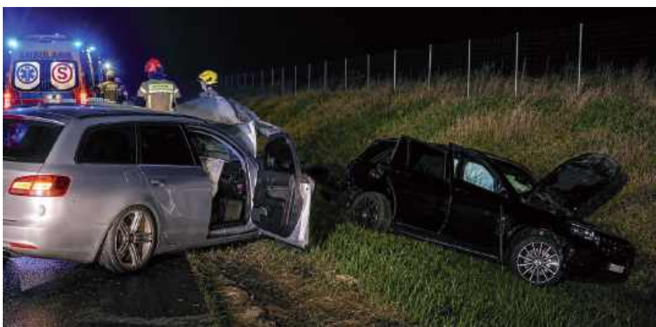
Ze wstępnych ustaleń policjantów wynika, że 50-letnia kierująca audi uderzyła w stojącego na pasie awaryjnym mercedesa, który wcześniej uległ awarii. Postępowanie w sprawie prowadzi Posterunek Policji w Trojanowie

Ze wstępnych ustaleń policjantów wynika, że 50-letnia kierująca audi uderzyła w stojącego na pasie awaryjnym mercedesa, który wcześniej uległ awarii. Mercedesem kierował 52-letni obywatel Ukrainy. W pojeździe znajdowało się pięciu pasażerów