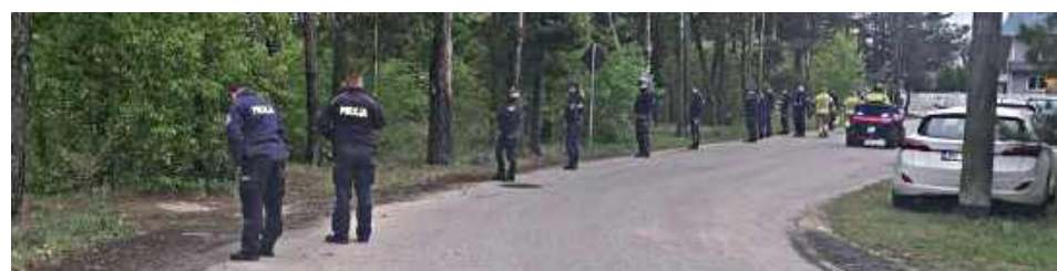
W działania włączyli się także cywili ratownicy i specjaliści działający w ramach grup poszukiwawczo-ratowniczych i organizacji pozarządowych

— Strażacy poruszający się na quadzie sprawdzali tereny trudno dostępne dla ratowników, takie jak lasy, mokradła i miejsca, do których nie da się dotrzeć samochodem. Pojazd pracował przez kilkanaście godzin i pokonał ponad 140 kilometrów — przekazali strażacy.