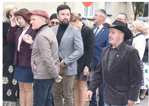
W czasie sentymentalnej podróży filmowej odbywały się koncerty i tańce na deskach