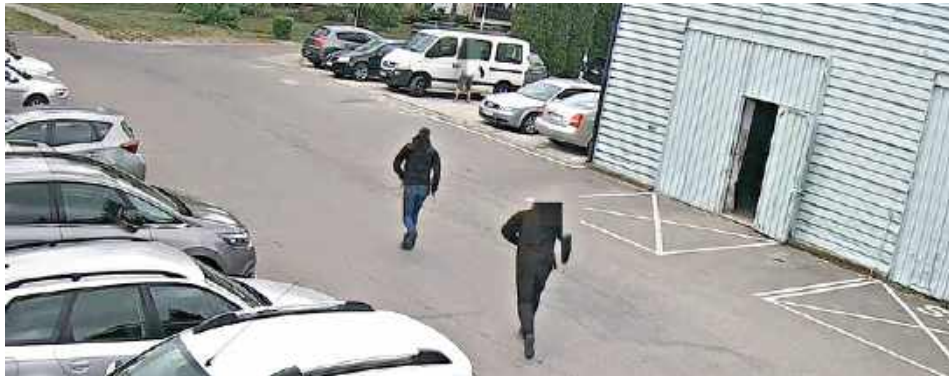
Zatrzymanie mężczyzny miało dynamiczny przebieg. 40-latek został obezwładniony i przewieziony do policyjnej celi

Jak ustalili śledczy, 40-latek między innymi 8 maja włamał się do jednego z garaży na osie-