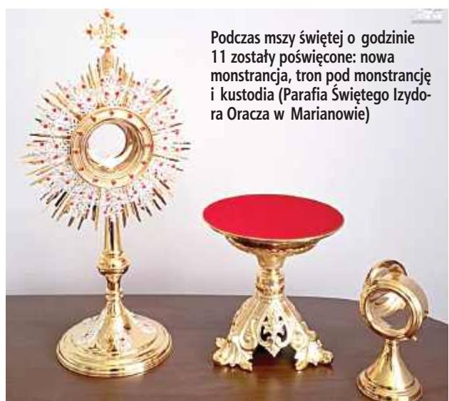
Podczas mszy świętej o godzinie 11 zostały poświęcone: nowa monstrancja, tron pod monstrancję i kustosia (Parafia Świętego Izydora Oracza w Marianowie)

W minioną niedzielę w kościele parafialnym Świętego Izydora Oracza w Marianowie podczas mszy świętej o godzinie 11 zostały poświęcone nowa monstrancja, tron pod monstrancję i kustosia.