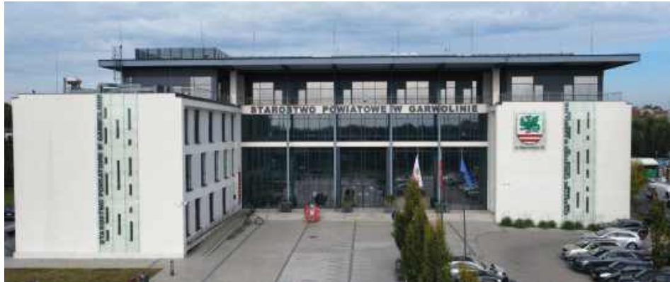
Nowa siedziba Starostwa Powiatowego w Garwolinie została oficjalnie otwarta 27 stycznia 2018 roku

– Zabezpieczono 400 tys. zł, a w przetargu zabrakło ponad 451 tys. zł. Problemem nie jest jednak sama kwota, tylko to, że to już chyba czwarty przetarg na to samo zadanie – mówiła radna. W jej ocenie problem może wynikać z niedoszacowanego kosztorysu. – Według mnie bazujące państwo na starych wycenach. Od tego czasu ceny wzrosły i ktoś