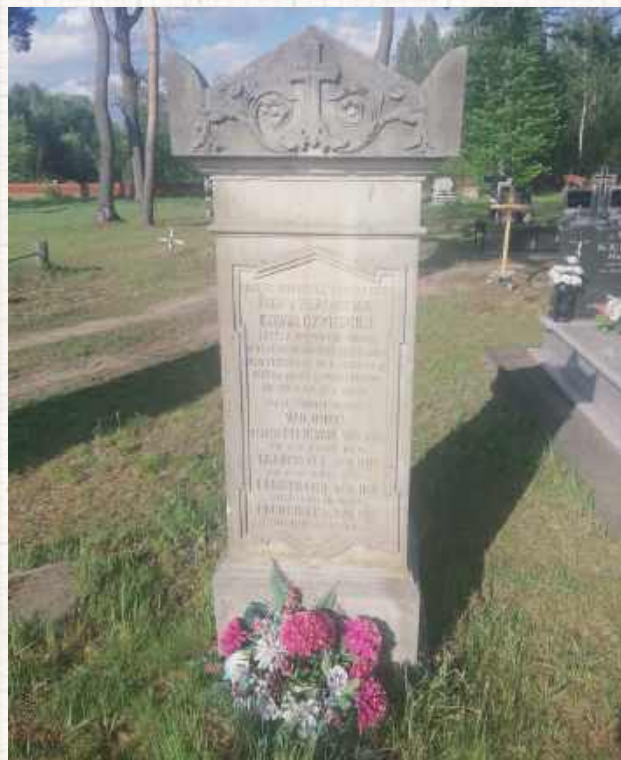
Ksiądz Felicjan Woyno odszedł z tego świata 18 czerwca 1877 roku w Samogoszcz. Został pochowany na tamtejszym cmentarzu - nagrobek rodziny Woynów w dobrym stanie przetrwał do dnia dzisiejszego