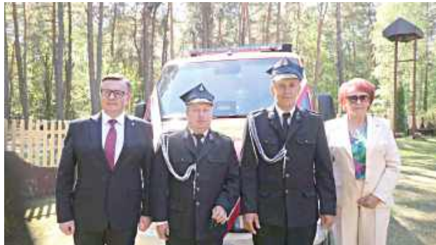
Jednym z najważniejszych momentów wydarzenia było oficjalne przekazanie lekkiego samochodu ratunkowo-gaśniczego marki Mercedes Sprinter

ko okazją do podziękowania strażakom za ich codzienną gotowość do niesienia pomocy, ale również do integracji lokalnej społeczności i podkreślenia roli, jaką ochotnicze straże pożarne odgrywają w życiu mieszkańców gminy Trojanów.