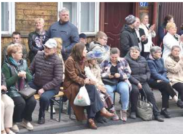
Festiwal Kultury i Tradycji Garwolina odbywa się od 13 lat. Jak co roku zdeterminowały go taniec, muzyka ludowa, zabawy znane z dzieciństwa oraz wzmacnianie lokalnej wspólnoty