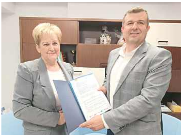
Mieszkańcy Puznówki doczekali się długo wyczekiwanej inwestycji