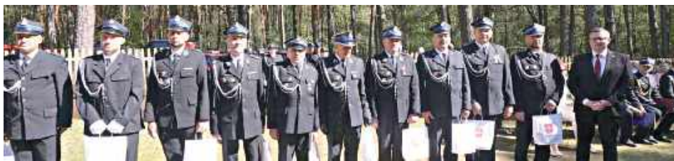
W uroczystościach udział wzięły jednostki Ochotniczych Straży Pożarnych z terenu gminy, zaproszeni goście, mieszkańcy oraz druhnicy i druhnicy, którzy na co dzień stoją na straży bezpieczeństwa lokalnej społeczności

brakło również wyróżnień dla strażaków za ich wieloletnią służbę i działalność na rzecz ochrony przeciwpożarowej.