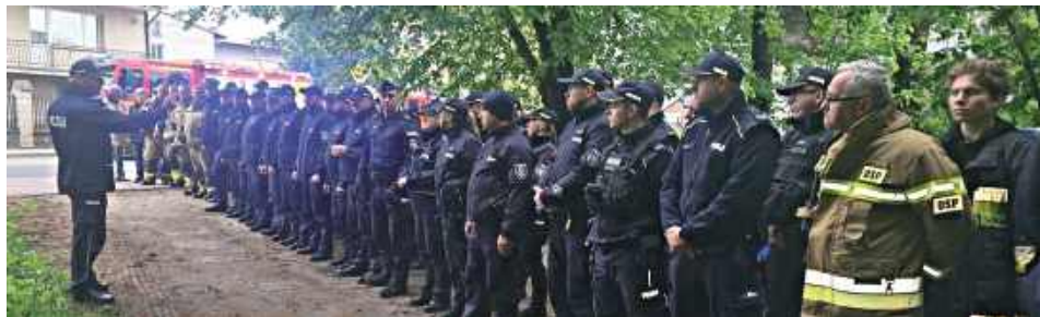
W akcji poszukiwawczej brali udział policjanci z Komendy Powiatowej Policji w Garwolinie oraz komórek podległych, a także funkcjonariusze Państwowej Straży Pożarnej i jednostki ochotniczych straży pożarnych