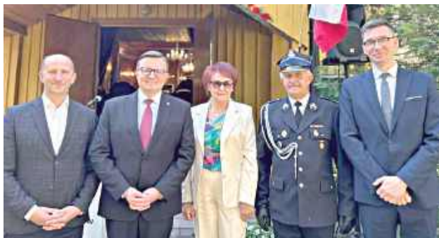
Obchody Gminnego Dnia Strażaka odbyły się w Babicach w gminie Trojanów