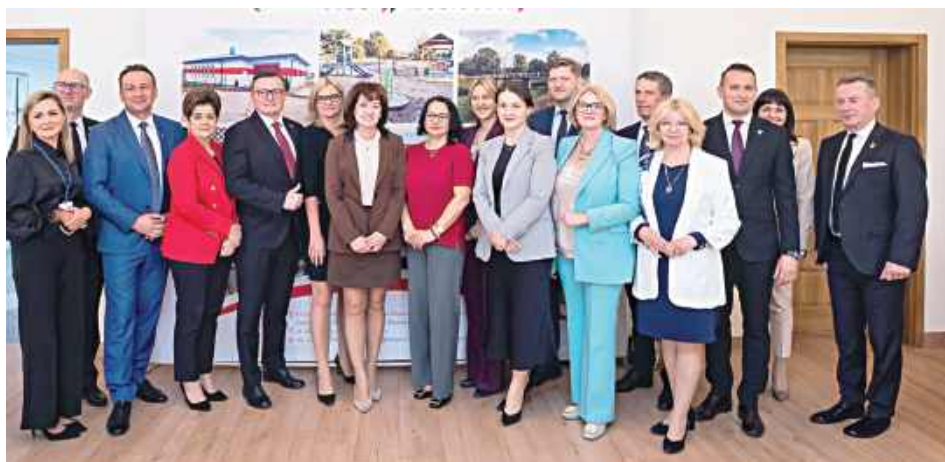
Samorządy z powiatu garwolińskiego skorzystają też z programu „Mazowsze dla sołectw”, z którego trafi do nich ponad 300 tys. zł

14 gmin z powiatu garwolińskiego otrzymało wsparcie z programu „Mazowsze dla straży pożarnych”. Łączna kwota dotacji na 21 zadań sięga