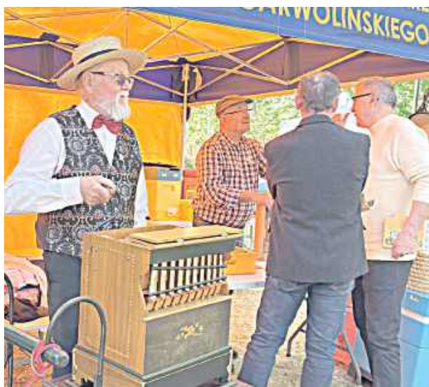
Zapach miodu, dźwięki katarynki, warsztaty tworzenia świec z wosku pszczelego i parkiet pełen tańczących gości – tak wyglądał II Rodzinny Festyn Pszczelarski

Festyn miał jednak nie tylko edukacyjny, ale i integracyjny charakter. Dobra muzyka, piękna pogoda i rodzinna atmosfera sprawiły, że wielu uczestników zostało w Dworku w Miętnej do późnych godzin wieczornych. Były wspólne rozmowy, śmiech