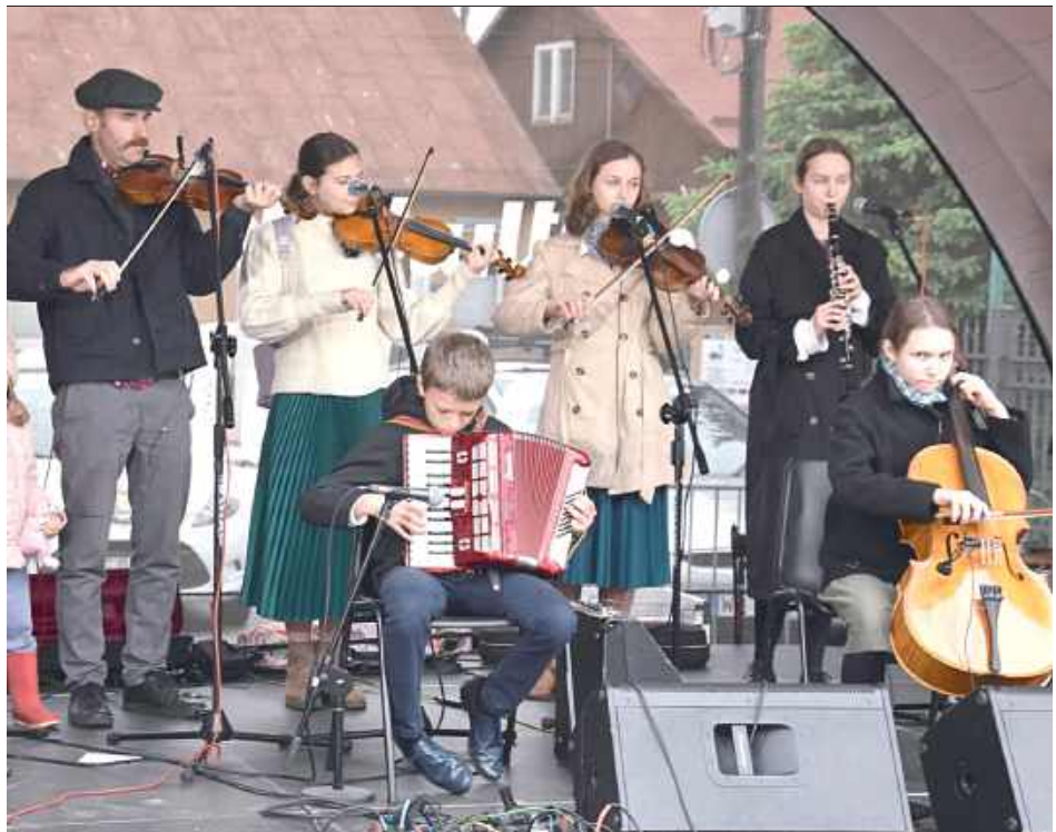
W czasie sentymentalnej podróży filmowej odbywały się koncerty i tańce na deskach. Na scenie wystąpiła m.in. Spółdzielnia Muzykantów