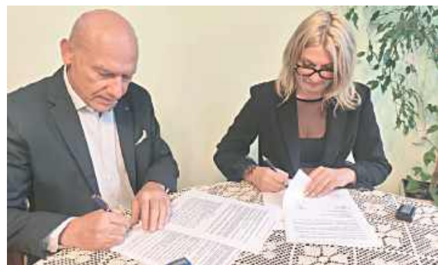
Władze miasta zaznaczają, że rozbudowa infrastruktury chodnikowej pozostaje jednym z ważnych elementów prowadzonych obecnie inwestycji w Garwolinie

Jak podkreślają władze miasta, inwestycja ma poprawić bezpieczeństwo pieszych oraz komfort codziennego poruszania się mieszkańców korzystających