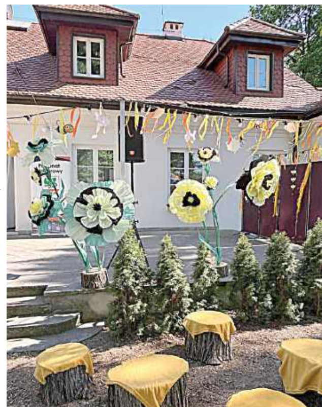
Dworek w Miętnej wyglądał pięknie!