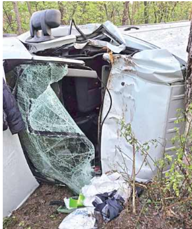
Ze względu na stan techniczny i uszkodzenia pojazdu funkcjonariusze zatrzymali dowód rejestracyjny auta

Do groźnie wyglądającej kolizji doszło na drodze krajowej nr 76 w gminie Borowie. W Jazwinach samochód dostawczy wypadł z drogi i uderzył w drzewo. Pojazd przewrócił się na bok, a siła uderzenia była na tyle duża, że doszło do poważnych uszkodzeń karoserii.