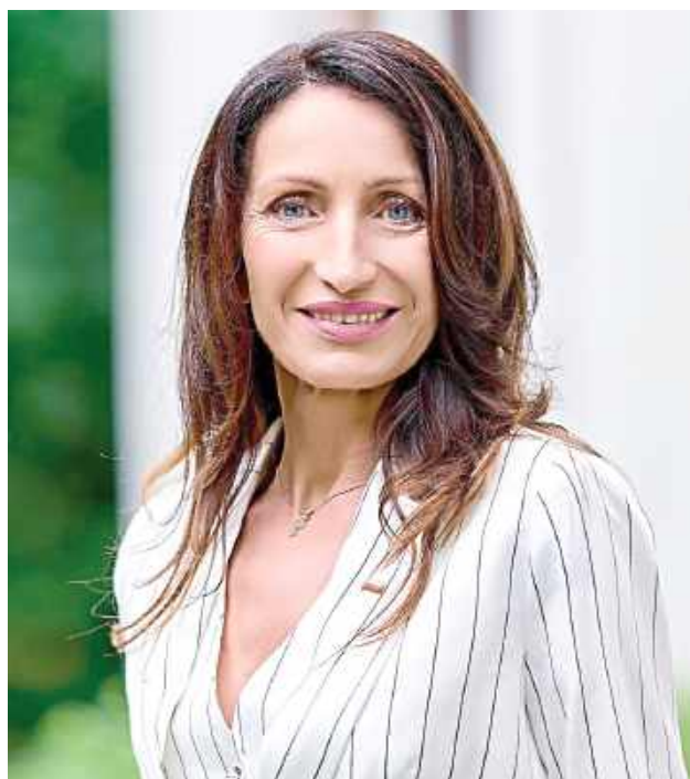
Za przyjęciem uchwały głosowało 14 radnych, przeciw było trzech, a sześciu wstrzymało się od głosu

Konflikt wokół wynagrodzenia starosty wybuchł w czerwcu ubie-