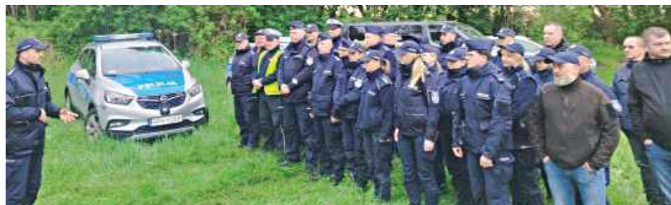
Mieszkańcy organizowali grupy poszukiwawcze, udostępniali informacje w mediach społecznościowych i zgłaszali każdy ślad, mogący pomóc w odnalezieniu zaginionej osoby

Przez kilkanaście godzin policjanci, strażacy, ratownicy i mieszkańcy przeczesywali lasy, pola i trudno dostępne tereny wokół Łaskarzewa. W poszukiwaniu 86-letniej mieszkanki miasta zaangażowały się setki osób. Niestety, finał akcji okazał się tragiczny — w środę rano odnaleziono ciało seniorki.