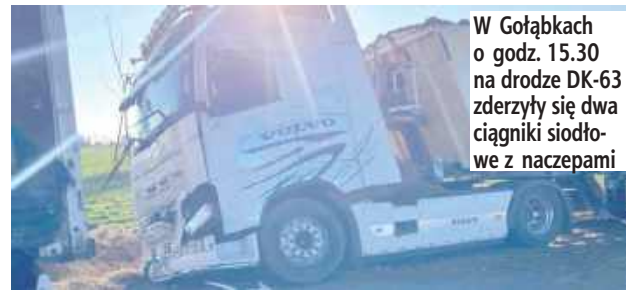
W Gołąbkach o godz. 15.30 na drodze DK-63 zderzyły się dwa ciągniki siodłowe z naczepami

W tym samym czasie doszło do pożaru sterty około