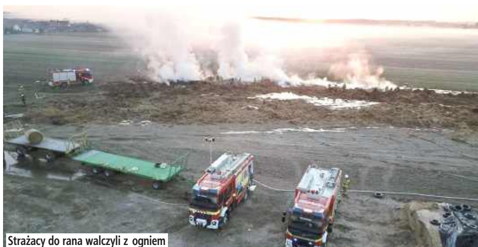
Strażacy do rana walczyli z ogniem