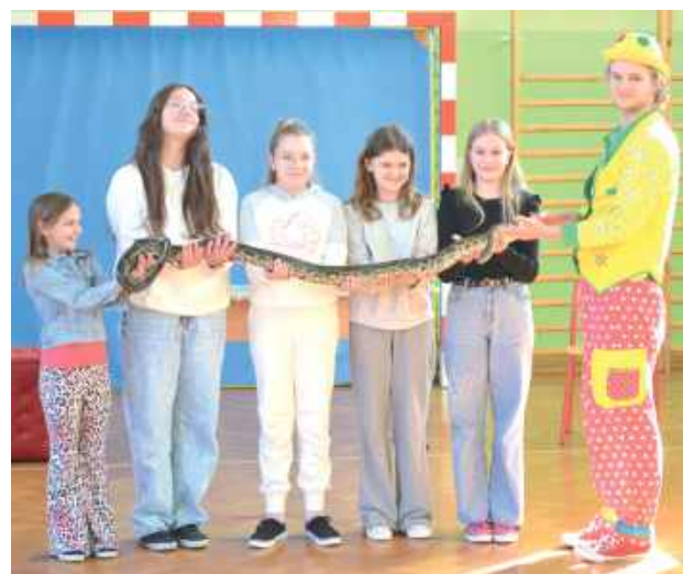
Spotkanie z żywym wężem

GMINA STOCZEK ŁUKOWSKI: 19 marca w Szkole Podstawowej w Kisielsku wydarzyło się coś niezwykłego - do placówki zawiązał Cyrk „Szok”.