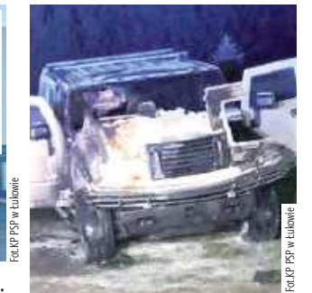
Pożar samochodu osobowego w gminie Stanin