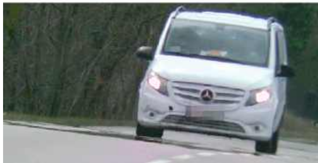
Niechlubnym rekordzistą był 42-latek, który jechał w Drożdżaku z prędkością 126 km/h

Data: 15/03/2025 Czas: 12:03:25 Manualny: Prędkość Lok: DROZDZAK Limit Prędkości: 50 km/h Prędkość: 126 km/h (Niejazd) Dystans: 288,7 m