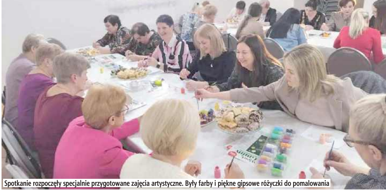
Spotkanie rozpoczęły specjalnie przygotowane zajęcia artystyczne. Były farby i piękne gipsowe różyczki do pomalowania

GMINA ŁUKÓW: W Aleksandrowie miało miejsce wyjątkowe wydarzenie zorganizowane przez Gminną Bibliotekę Publiczną w Aleksandrowie i Koło Gospodyń Wiejskich „Stokrotki” w Aleksandrowie.