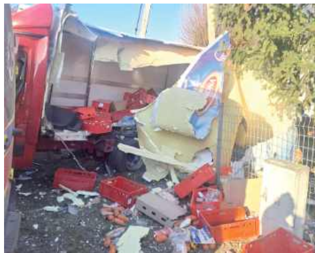
Artykuły spożywcze przewożone w samochodzie dostawczym wypadły z pojazdu i rozsypały się na jezdni

Policja prowadzi działania mające na celu ustalenie przyczyn oraz szczegółowego przebiegu zdarzenia.