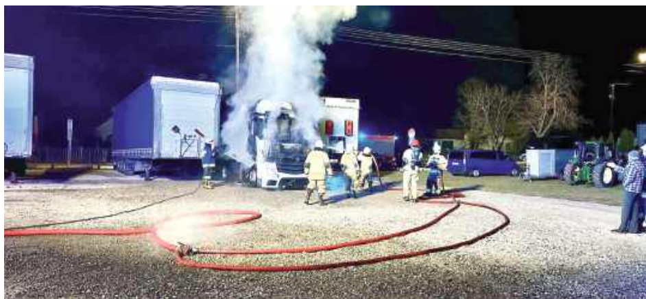
W akcji, oprócz OSP KSRG Tuchowicz, uczestniczyli strażacy z JRG Łuków oraz OSP Dąbie. Na miejscu obecna

Jak informują strażacy z OSP KSRG Tuchowicz – po dotarciu na miejsce zastali płonąca kabinę pojazdu. Dzięki sprawnej akcji strażaków ogień został szybko opanowany i nie rozprzestrzenił się na inne pojazdy zaparkowane tuż obok. Działania trwały kilkadziesiąt minut i zakończyły się sukcesem. Na szczęście nikomu nic się nie stało.