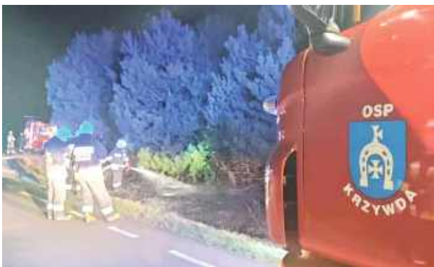
Pożar gasiły jednostki z OSP KSRG Krzywda, OSP Wola Okrzejska oraz OSP Drożdżak

We wtorek, 18 marca na drodze powiatowej z Krzywdy do Woli Okrzejskiej wybuchł pożar nieużytków. Ogień pojawił się w miejscowości Drożdżak. Zgłoszenie do straży wpłynęło o 20.33. Na miejsce skierowano jednostki OSP KSRG Krzywda, OSP Wola Okrzejska i OSP Drożdżak. Dzięki szybkiej interwencji pożar został opanowany, a ogień strawił około 20 arów traw.