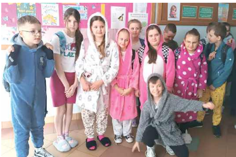
Mimo komfortowych i sennych stylizacji nikomu nie chciało się spać!

Tego dnia szkolne korytarze zapełniły się uczniami ubranymi w kolorowe piżamy, wygodne szlafroki i kaptcie. Nie zabrakło również ulubionych maskotek, które towarzyszyły uczniom przez cały dzień. W luźnych, domowych strojach wszyscy czuli się swobodnie, a wesoła atmosfera udzielała się zarówno uczniom, jak i nauczycielom.