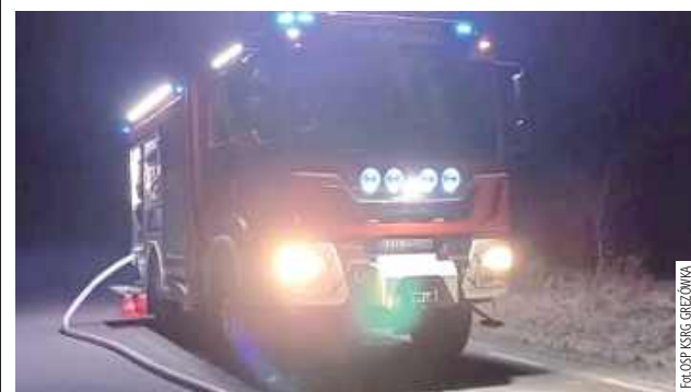
Nocna interwencja na drodze między Grzędówką a Biardami