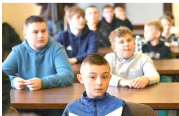
Pierwszym etapem turnieju były eliminacje pisemne, które zakończyły się wyłonieniem finalistów. Drugi etap, czyli finał, był przeprowadzony w formie ustnej

Pierwszym etapem turnieju były eliminacje pisemne, które zakończyły się wyłonieniem finalistów. Drugi etap,