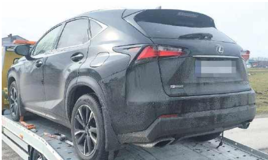
W ciągu doby od kradzieży Lexus wrócił już u właściciela

- Ze zgłoszenia wynikało, że mężczyzna ten chciał realizować płatności kartą, że miał problemy z autoryzacją transakcji. Z informacji wynikało też, że pozostawił na drodze samochód osobowy, że pieszo udał się w kierunku sąsiedniej miejscowości. Mundurowi, którzy przyjechali we wskazane miejsce, spotkali idącego drogą 38-latkę spod lubelskiej miejscowości. Mężczyzna początkowo twierdził, że nie ma nic wspólnego z pozostawionym na drodze samochodem marki Lexus, później mówił, iż samochód pożyczony od znajomego. Wewnątrz auta leżał portfel z dokumentami właściciela osobówki. Policjanci skontaktowali się z nim i dowiedzieli się, że pozostawił swój samochód z kluczykami i dokumentami przed domem, że nikomu nie pożyczał auta. Właściciel wartego ponad 130 tysięcy złotych Lexusa od policjantów ze Stoczka Łukowskiego