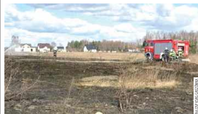
17 marca strażacy z Grzędówki gasili pożar nieużytków w swojej miejscowości na ulicy Sosnowej

We wtorek, 18 marca o godzinie 21.23 straż pożarna dostała zgłoszenie o pożarze traw wzdłuż drogi gminnej łączącej Grzędówkę z Biardami.