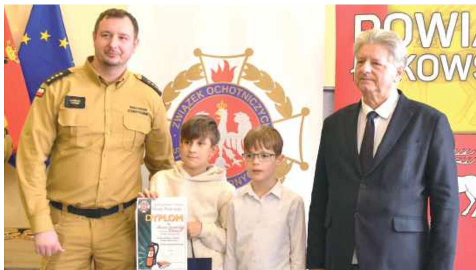
Uczestnicy rywalizowali w trzech kategoriach: Szkoły podstawowe klasy I-IV, klasy V-VIII i szkoły ponadpodstawowe

W Sali Konferencyjne Starostwa Powiatowego w Łukowie odbył się finał powiatowy Ogólnopolskiego Turnieju Wiedzy Pożarniczej „Młodzież Zapobiega Pożarom”.