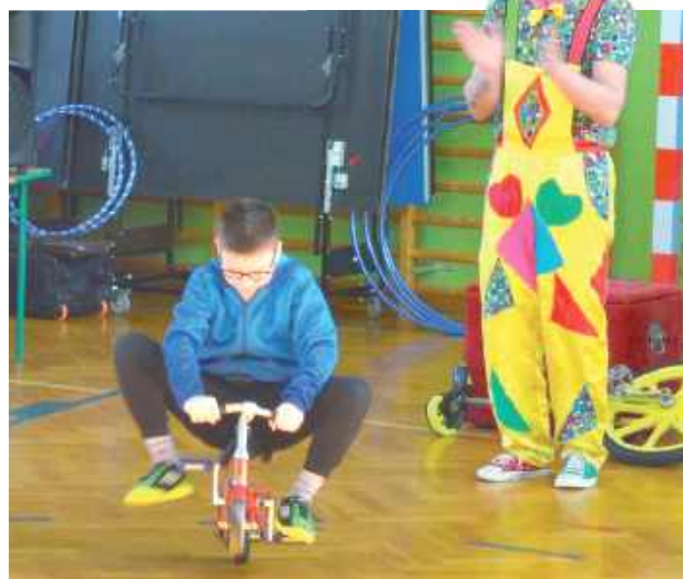
Udało mu się pojechać na mini rowerku

Na szkolnej „arenie cyrkowej” wystąpili utalentowani artyści, prezentując swoje umiejętności. Widowiskowe pokazy wzbudziły zachwyt zarówno wśród najmłodszych, jak i starszych uczniów.