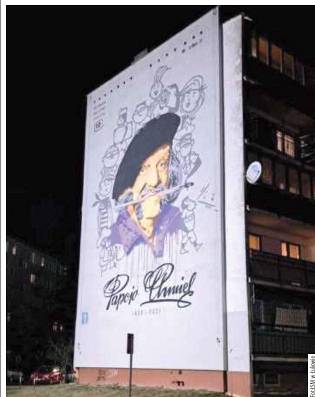
Mural Papcia Chmiela znajduje się na bloku nr 1 przy ul. Nowowiejskiego w Łukowie

Łukowska Spółdzielnia Mieszkaniowa zakończyła prace związane z podświetleniem muralu Papcia Chmiela, który znajduje się na bloku nr 1 przy ul. Nowowiejskiego.