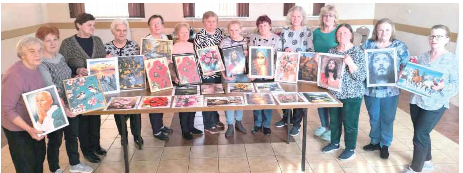
Seniorzy z Klubu „Druga Młodość” z dumą prezentują swoje piękne hafty diamentowe - efekt pasji, cierpliwości i talentu!

- Kilka spotkań zaowocowało pięknymi obrazami - prawdziwymi dziełami sztuki. Z każdym przyklejonym diamentem wkręcał się