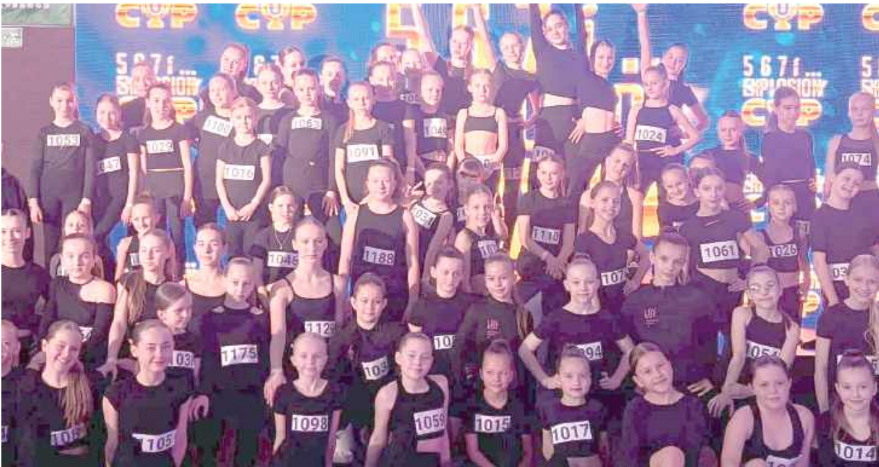
Dzięki ciężkiej pracy dziewczyny mogą cieszyć się znakomitymi wynikami

15-16 marca w Żyrardowie odbyła się 3. edycja Ogólnopolskiego Turnieju Tańca Explosion Cup 2025, w której uczestniczyły tancerki z Łukowskiego Ośrodka Kultury.