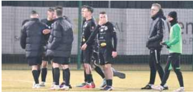
Bialczanie spełnili zadanie i wygrali na boisku ostatniej drużyny w tabeli

- W tygodniu poprzedzającym mecz wiele czasu poświęciliśmy na atak pozycyjny i tworzenie sytuacji strzeleckich. Nie wyglądało to do końca tak jak chcieliśmy, szczególnie przy dograniach z bocznego