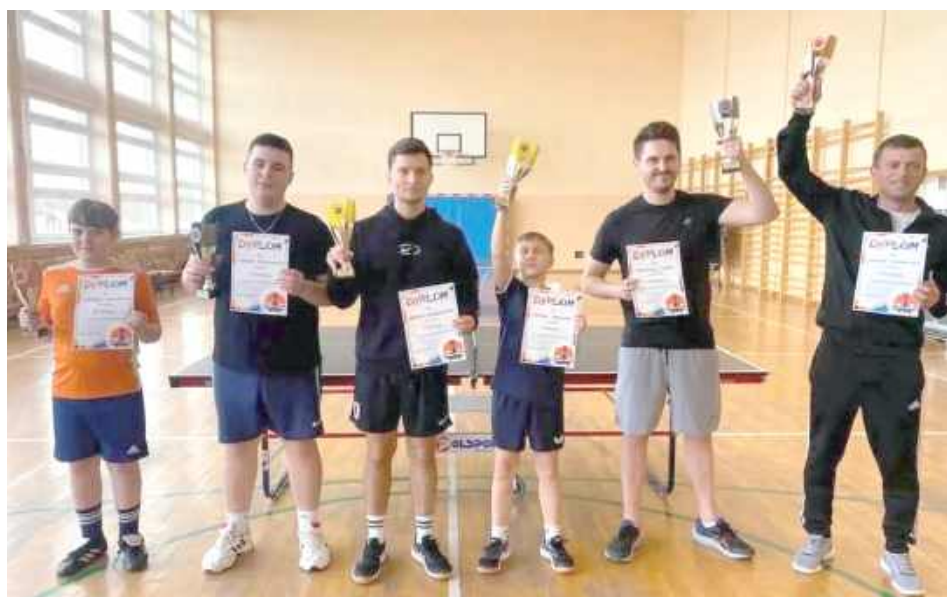
Pamiątkowe zdjęcie najlepszych!

W Aleksandrowie odbył się Turniej Tenisa Stołowego! Organizatorami imprezy była Rada Sołectwa w Aleksandrowie, a całe wydarzenie miało miejsce w Szkole Podstawowej w Aleksandrowie, dzięki uprzejmości dyrektora szkoły.