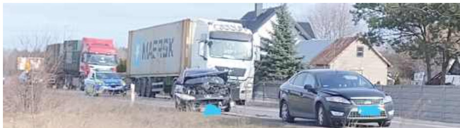
Dwie osoby zostały przetransportowane do szpitala na badania, jednak obrażenia, jakich doznały, okazały się niegroźne

Ze wstępnych ustaleń wynika, że 47-letni kierowca Peugeota, mieszkaniec Siedlec, najprawdopodobniej zasnął podczas jazdy, w wyniku czego najechał na jadący przed nim samochód marki Ford. Pojazdem tym kierowała 43-letnia mieszkanka Siedlec. Siła uderzenia sprawiła, że Ford wpadł na jadące przed nim Volvo, którym kierował 47-letni mieszkaniec gminy Wiśniew.