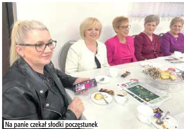
Na panie czekał słodki poczęstunek

Ile na sport, a ile na inne aktywności? Pieniądze na zadania publiczne w gminie Łuków podzielone