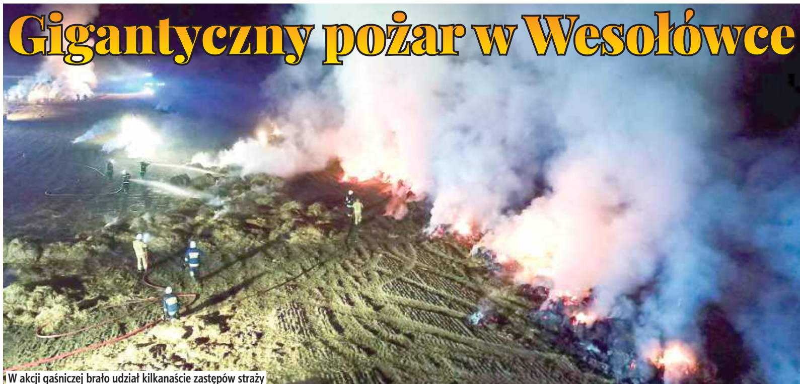
W akcji gaśniczej brało udział kilkanaście zastępów straży

20 marca w gminie Stanin doszło do pożaru sterty bel ze słomą.