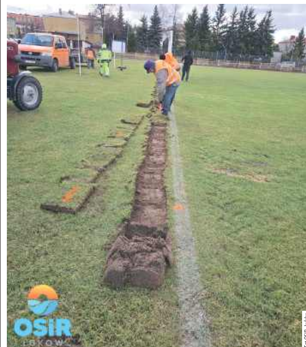
Boisko w Łukowie przy ul. Warszawskiej ma wreszcie system nawadniający

Miasto Łuków, Zarząd Dróg Miejskich oraz Ośrodek Sportu i Rekreacji w Łukowie wspólnie realizują inwestycję na Stadionie Miejskim w Łukowie.