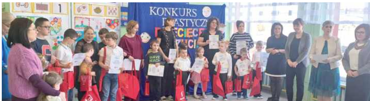
W konkursie chodziło o pokazanie, jak ważna jest komunikacja alternatywna i wspomagająca AAC, która służy osobom, które mają trudności z komunikowaniem się za pomocą mowy