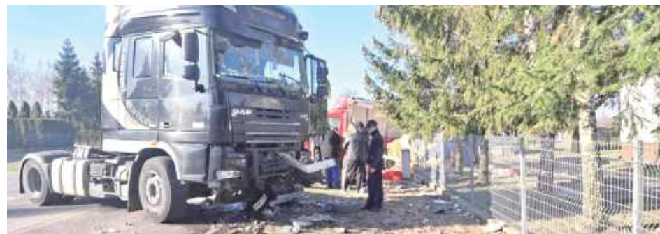
W samochodzie ciężarowym DAF uszkodzeniu uległa jego przednia część

W czwartek (20 marca) przed godziną 7 rano w gminie Krzywda doszło do groźnego zderzenia samochodu ciężarowego z busem przewożącym produkty spożywcze.