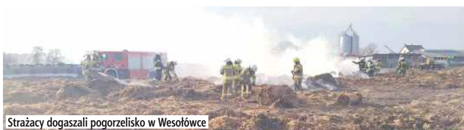
Strażacy dogaszali pogorzeliisko w Wesołówce

Apel o pomoc dla mieszkańca Wesołówki – potrzebne bele słomy!