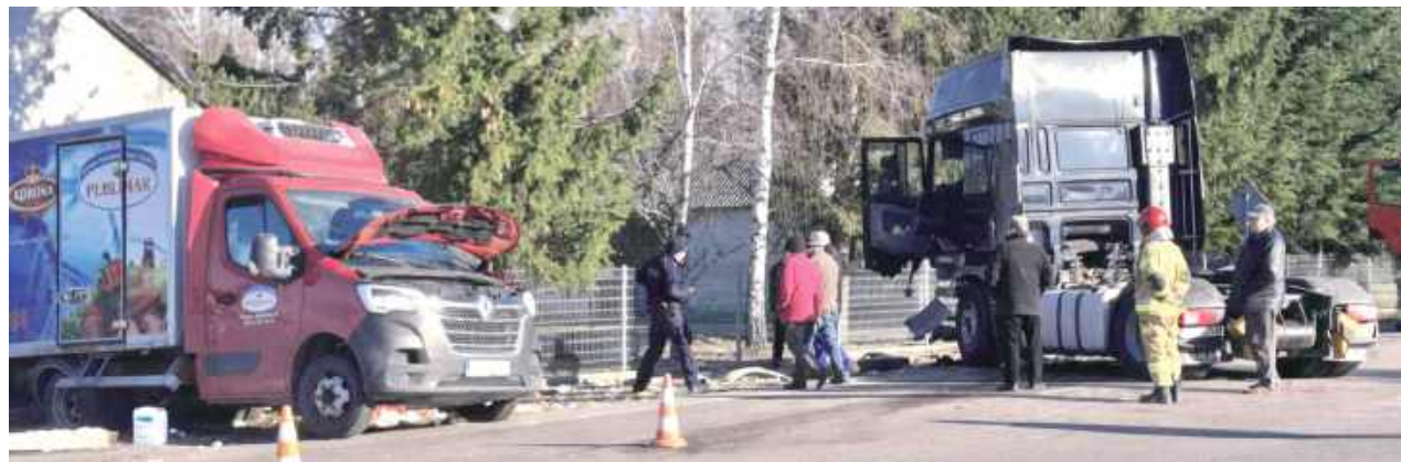
W czasie działań służb ruch na drodze był wstrzymany

W czwartek (20 marca) przed godziną 7 rano w gminie Krzywda doszło do groźnego zderzenia samochodu ciężarowego z busem przewożącym produkty spożywcze.