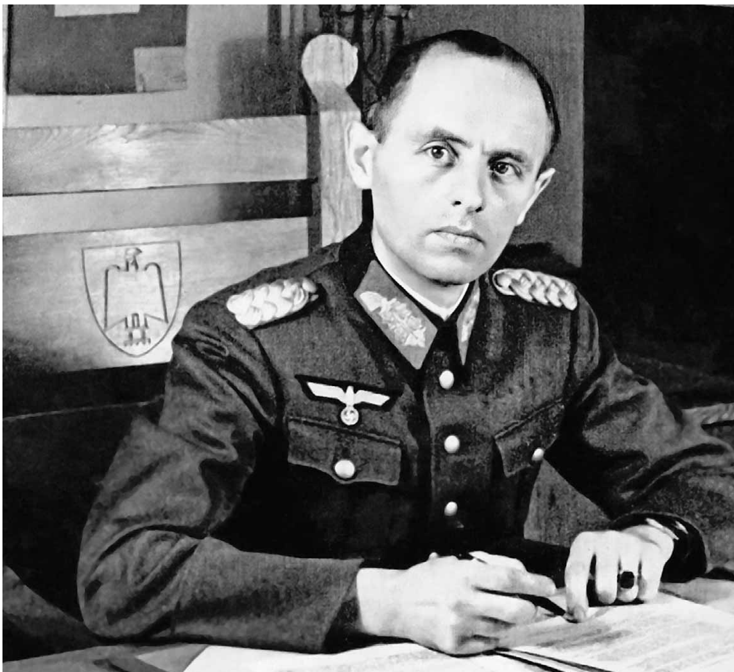
Reinhard Gehlen w czasie służby w sztabie generalnym Wehrmachtu

● Byli szpiedzy Hitlera przeszli po wojnie na usługi USA ● Na początku lat pięćdziesiątych organizowali swoje siatki wywiadowcze na terenie PRL ● W ten sposób przygotowywali się do wybuchu trzeciej wojny światowej