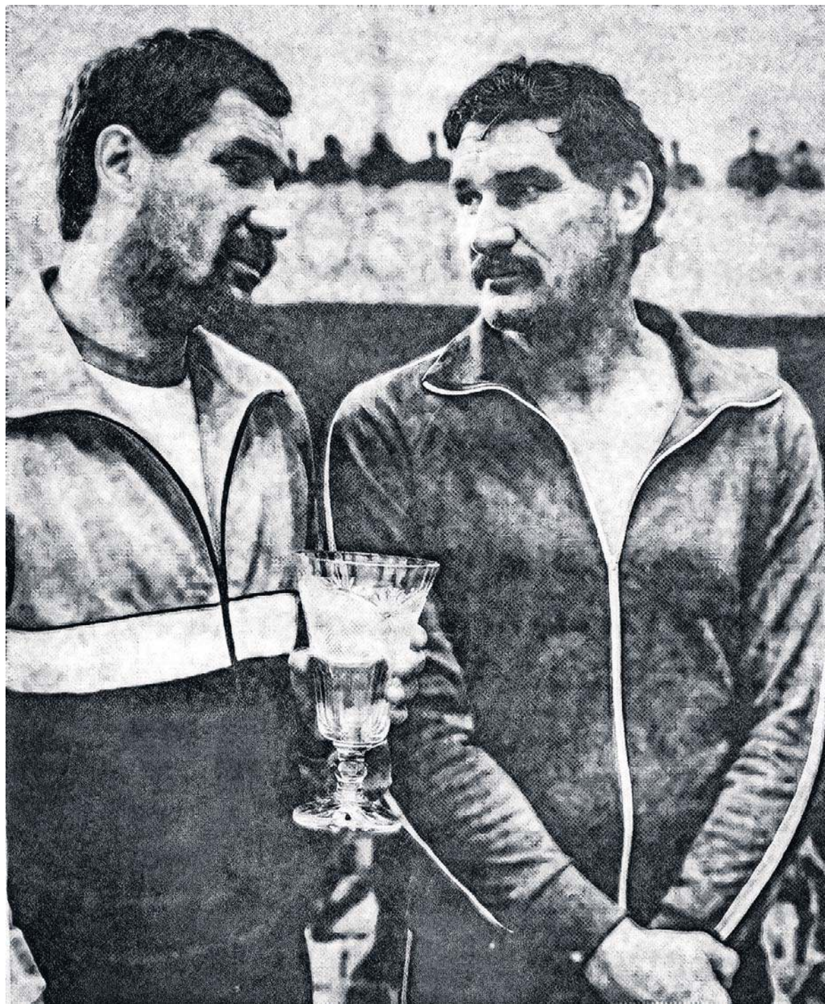
Pięściarstwo było ich pasją. Choć trafili do niego dość późno, szybko nadrobili zaległości i zaczęli dominować na krajowych ringach

Bliźniacy, jak to często w rodzinie bywa, poróżnili się o pienią-