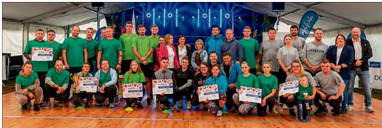
Przyznanie nagród zakończyło V Turniej Sołectw.