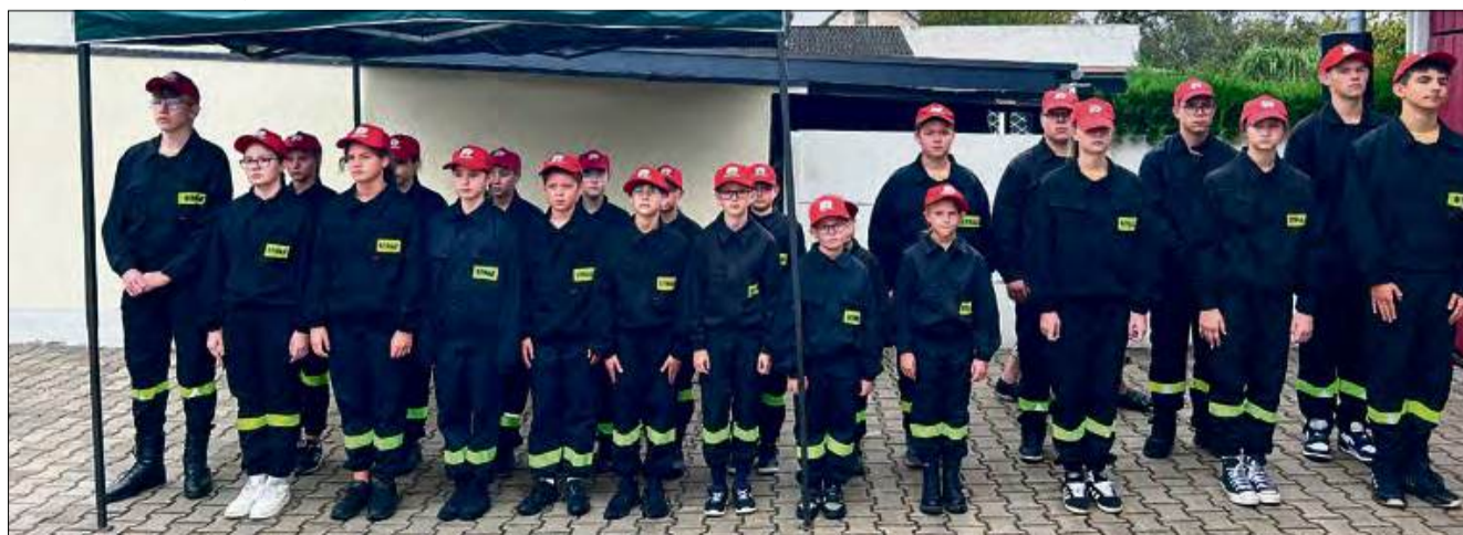
Prezes OSP złożył również szczególne podziękowania dla Młodzieżowej i Dziecięcej Drużyny Pożarniczej, dzięki którym strażacka tradycja w Raclawiczkach trwać będzie przez kolejne pokolenia.