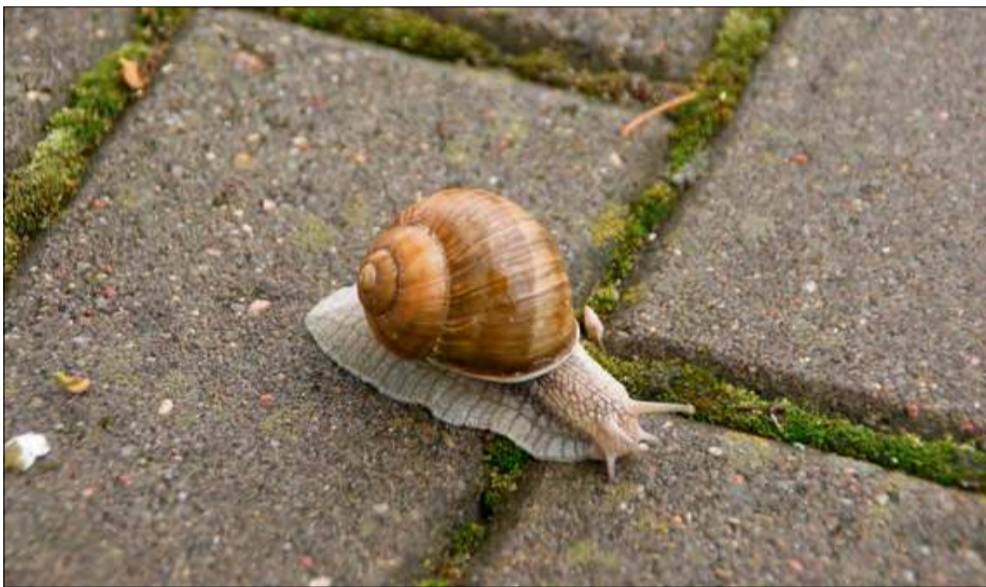
Ślimak winniczek ze względu na intensywny eksport podlega w niektórych regionach Polski częściowej ochronie gatunkowej.

drastycznie malały z powodu pozyskiwania futer i cennej wydzieliny gruczołów o właściwościach leczniczych, a nawet magicznych. Pierwszym dokumentem prawnym regulującym korzystanie z przyrody był Statut wiślicki z 1347 roku, przewidujący kary za wyrąb dębów i drzew owocowych w cudzych lasach. Za panowania Władysława Jagiełły wprowadzono natomiast zakazy eksportu drewna cisowego oraz ustanowiono okresy ochronne dla zwierzyny łownej – od 23 kwietnia do końca zniw. W 1523 roku Zygmunt Stary objął prawną ochroną m.in. tura, żubra, bobra, sokoła wędrownego i łabędzia, a Stefan Batory w 1578 roku zakazał połowów ryb w okresie tarła oraz stosowania sieci o zbyt drobnych oczkach. Nowoczesne podejście do ochrony przyrody pojawiło się dopiero w XX wieku. Ustawa z 1934 roku stworzyła fundamenty współczesnych regulacji, a akt z 1949 roku przyczynił się do dynamicznego rozwoju parków narodowych i rezerwatów. Obecnie podstawowym dokumentem prawnym jest Ustawa o ochronie przyrody z 2004 roku, która porządkuje zarówno ochronę ga-