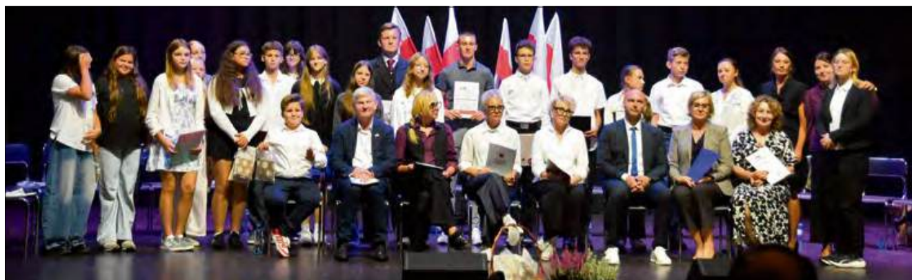
Tegoroczną odśłonę Narodowego Czytania poświęcono twórczości Jana Kochanowskiego – niekwestionowanego mistrza słowa z epoki renesansu.

To spotkanie z literaturą przerodziło się w coś więcej niż tylko lektura – stało się wymownym symbolem zaangażowania w ochronę czystości języka i kultywowanie narodowych tradycji. Wspólne czytanie okazało się bezcennym doświad-