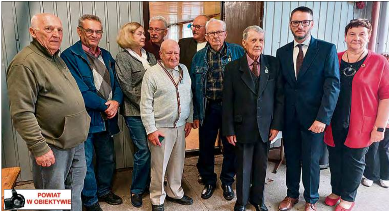
W sobotę 13 września w Krapkowicach miał miejsce „Dzień Działkowca i Jubileusz 75-lecia ogrodu”. Zdjęcia z tego wydarzenia można zobaczyć na stronie internetowej „Tygodnika Krapkowickiego”. W czasie jubileuszu wielu działkowców otrzymało odznaczenia. Więcej na ten temat w przyszłym wydaniu „Tygodnika Krapkowickiego”. (matt)