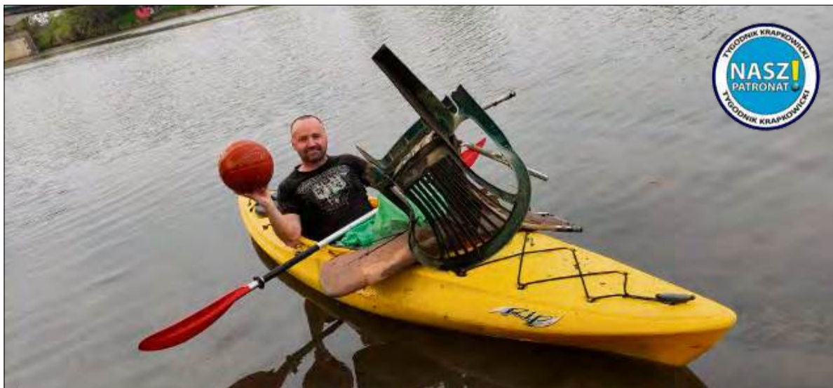
Wkrótce posprzątają Osobłogę – uczestnicy akcji „Czysta Osobłoga” będą porządkować brzegi rzeki.

J esień to czas porządków, nie tylko w domach, ale i w otaczającej nas przyrodzie. Już w piątek, 19 września, mieszkańcy regionu i miłośnicy przyrody będą mieli okazję wziąć udział w kolejnej, jesienniej edycji akcji „Czysta Osobłoga”. Spotkanie rozpocznie się o godzinie 16:00 w Osadzie Steblów.