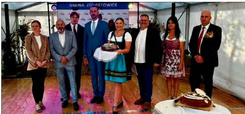
6 września obchodzono Święto Plonów w dzielnicy Stara Część Miasta w Zdzieszowicach.

Uroczysty korowód, msza święta i mnóstwo atrakcji dla najmłodszych i starszych - tak w sobotę 6 września, obchodzono Święto Plonów w dzielnicy Stara Część Miasta w Zdzieszowicach. Wydarzenie, będące wyrazem wdzięczności dla rolników, zgromadziło mieszkańców, lokalnych oficjeli i gości, tworząc wyjątkową, świąteczną atmosferę.