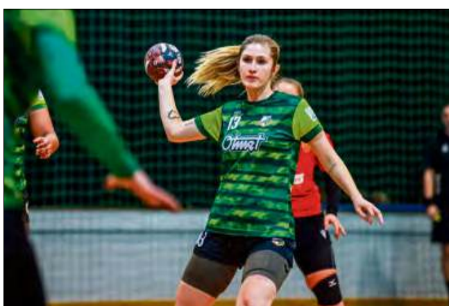
Na inaugurację rozgrywek I ligi krapkowiczanki wysoko przegrały.