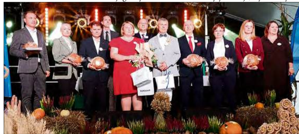
Chleb to nieodłączny element polskiej gościnności.

Po mszy świętej w kościele pw. św. Walentego w Walcach, barwny korowód dożynkowy przeszedł ulicami Zabierzowa, by dotrzeć na miejsce wspólnej biesiady. Pomysłowości uczestnikom korowodu nie brakowało – można było dzięki nim pojechać do „Majami” na wczasy, dobrze pojeść grocholubskiej grochówki, czy degustować złoty trunek z przyczepą „ze mną się nie napijesz?”. W