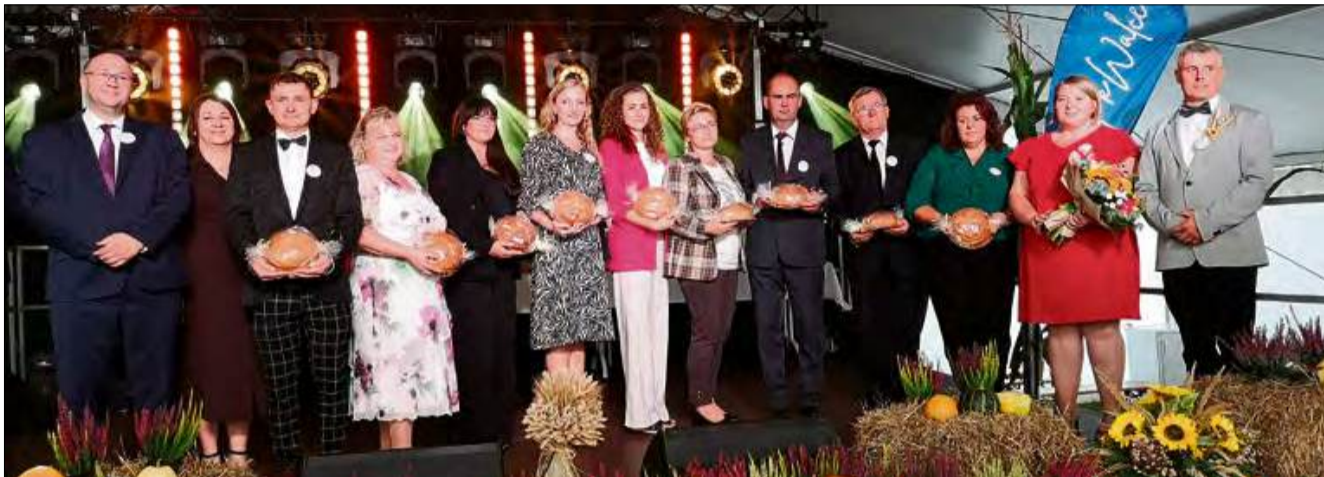
Żniwniok to przede wszystkim podziękowanie wszystkim rolnikom za ich trud.

Z pola na scenę, z modlitwy do wspólnej zabawy - tak przebiegały gminne dożynki w Zabierzowie-Ćwierciach. 13 i 14 września cała gmina Walce świętowała zakończenie żniw, okazując wdzięczność rolnikom oraz pielęgnując lokalne tradycje.