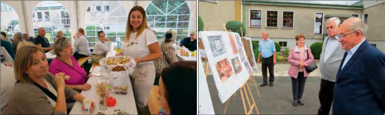
Mieszkańcy Choruli i goście spotkali się podczas tradycyjnego świętowania dożynkowego.

W Choruli uroczystość obchodzono Dożynki Sołectwo-Parafialne, które zgromadziły mieszkańców i gości przy tradycyjnym poczęstunku, atrakcjach dla dzieci oraz wyjątkowej wystawie zdjęć. Dożynki parafialne rozpoczęły obchody 40 - lecia istnienia kościoła w Choruli. Wydarzenie, połączone z obecnością rycerskiej wioski i pokazami, strzelaniem z łuku stało się żywym spotkaniem wspólnoty parafialnej i tradycji.