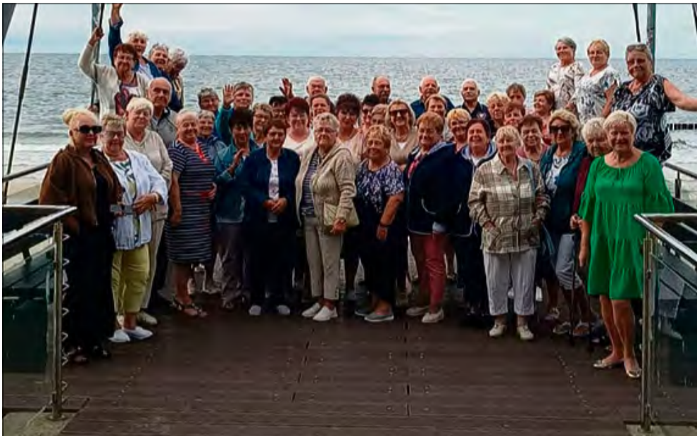
Seniorzy z Krapkowic spędzili wyjątkowy czas na wczasach w nadmorskim Dźwirzynie.

Pięćdziesięcioosobowa grupa członków Polskiego Związku Emerytów, Rencistów i Inwalidów w Krapkowicach spędziła wyjątkowy czas na wczasach w nadmorskim Dźwirzynie. Uczestnicy wypoczynku, pełni pozytywnej energii i niezapomnianych wrażeń, 6 września bezpiecznie powrócili do domu.