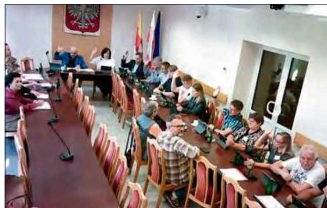
Strategiczna decyzja otwiera drogę do produkcji energii, obniżenia kosztów i dążenia do samowystarczalności energetycznej.