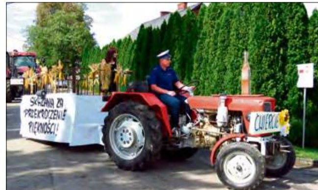
Pomysłów uczestnikom korowodu nie brakowało.

Uroczyste otwarcie dożynek, przekazanie chleba i tradycyjne obrzędy przypomniały, że święto plonów to nie tylko zabawa, ale przede