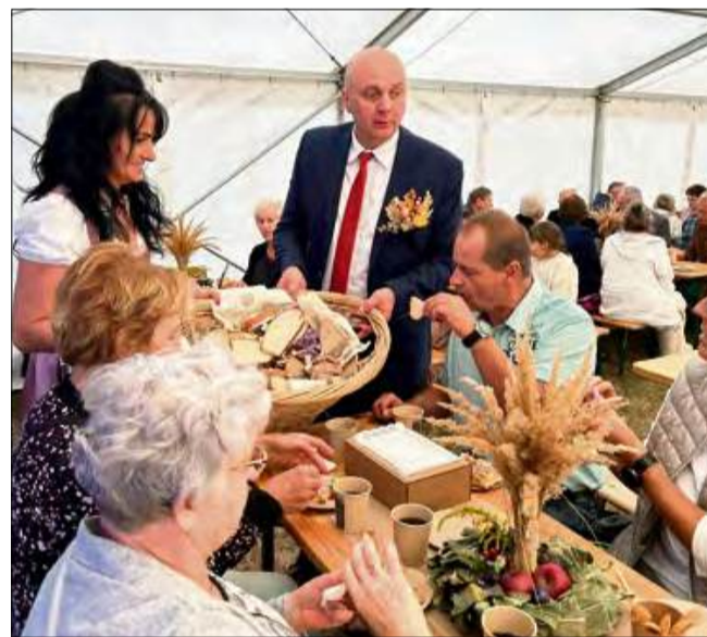
Tegoroczne dożynki w Zdzieszowicach upłynęły w radosnej i rodzinnej atmosferze.

Na mieszkańców czekała tam bogata oferta atrakcji. Dzieci mogły bawić się na dmuchańcach i korzystać z przejażdżek konnych, a wszystkim gościom serwowano bezpłatną wafel cukrową, popcorn oraz poczęstunek ze stołu wiejskiego. Wieczór umiliła wszystkim zabawa taneczna z DJ-em.