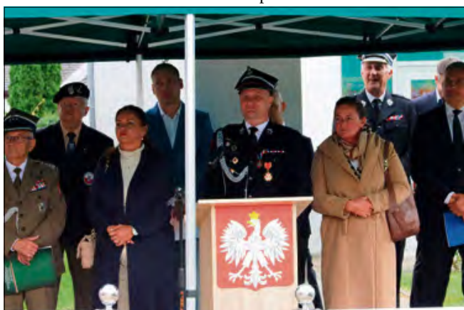
Nie brakowało też przedstawicieli władz.

nie tylko. Goście uczestniczyli również w prezentacji nowego samochodu. Ponadto były też dmuchańce, występy artystyczne i poczęstunek.