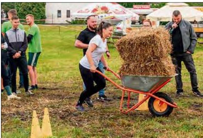
Turniej sołectw wzbudził ogromne emocje.

Dominika Bassek