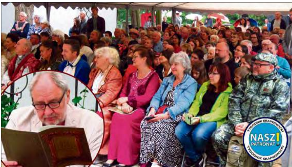
Aktor Andrzej Grabowski czyta dzieła Kochanowskiego podczas literackiego pikniku na zamku.

Zamek w Rogowie Opolskim zamienił się w sobotę, 13 września, w kulturalne centrum regionu. W ramach Narodowego Czytania fraszek Jana Kochanowskiego wystąpił między innymi aktor Andrzej Grabowski, a mieszkańcy mogli uczestniczyć w koncercie, warsztatach i literackim pikniku.