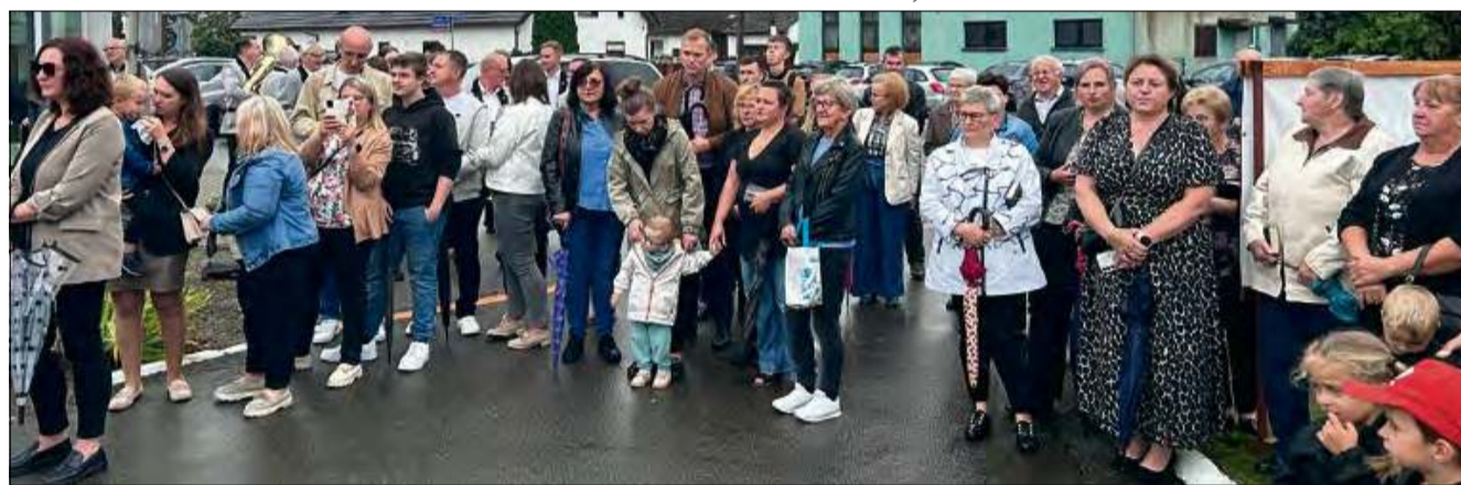
Tłumy gości przybyły na to wielkie wydarzenie.