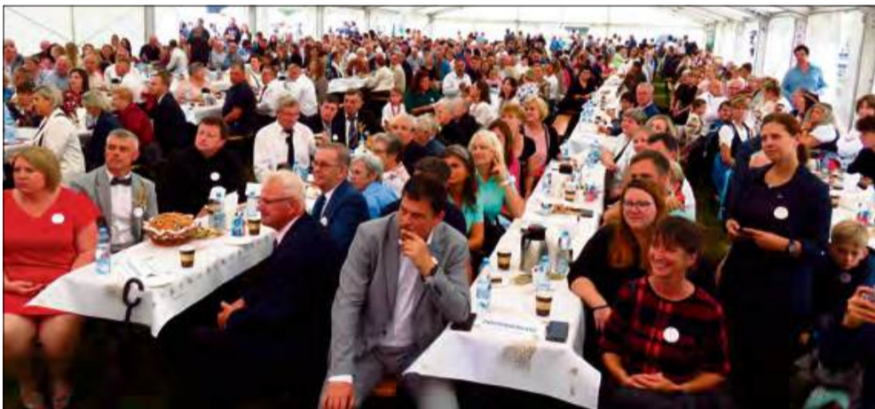
Z zaproszenia na dożynki skorzystały tłumy mieszkańców i gości.

Dni Partnerstwa w Zabierzowie-Ćwierciach po raz kolejny udowodniły, że tradycja i współczesność mogą iść w parze. Była rywalizacja, były emocje, była muzyka i