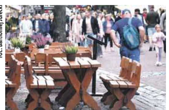
zjedzeniu całosci. W momencie zgłoszenia przez gości wątpliwości następuje zapytanie czy klient ży-

czy sobie innego dania, zrobienia raz jeszcze, czy anulowania zamówienia.