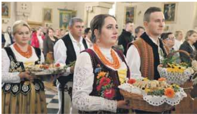
Tegoroczne plony górali z parafii w Miętustwie.

Druga część Dożynek Miętusiańskich miała miejsce w ogrodach plebańskich. Na plenerowej scenie publiczność mogła zobaczyć występ zespołu dziecięco-młodzieżowego pod przewodnic-