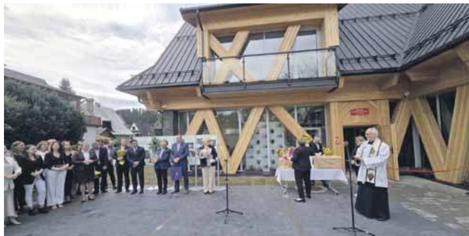
Uroczyste otwarcie ośrodka w poniedziałkowe popołudnie.