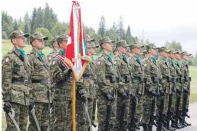
O oprawę uroczystości zadbali funkcjonariusze Kompanii Honorowej Karpackiego Oddziału SG w Nowym Sączu.

Już po raz drugi uczniowie wyruszyli na szlaki Fieldorfiady - historycznego zlotu upamiętniającego - szlak kurierski „Szkola” i generała Augusta Fieldorfa „Nila”.