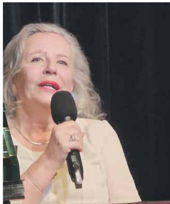
Zakopiańska publiczność miała nie tylko okazję zobaczyć Krystynę Jandę na scenie. Podczas spotkania po spektaklu mogła zadać aktorce pytania.