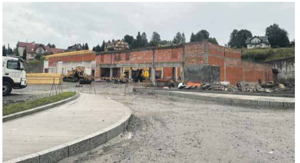
Budowę marketu wiele lat temu wstrzymał nadzór budowlany.