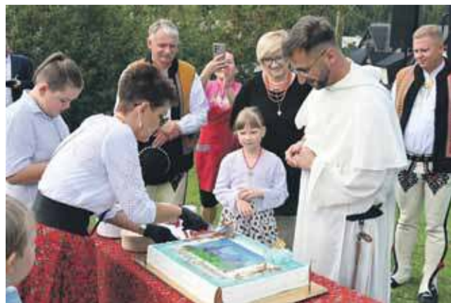
Nie zabrakło pysznego tortu.