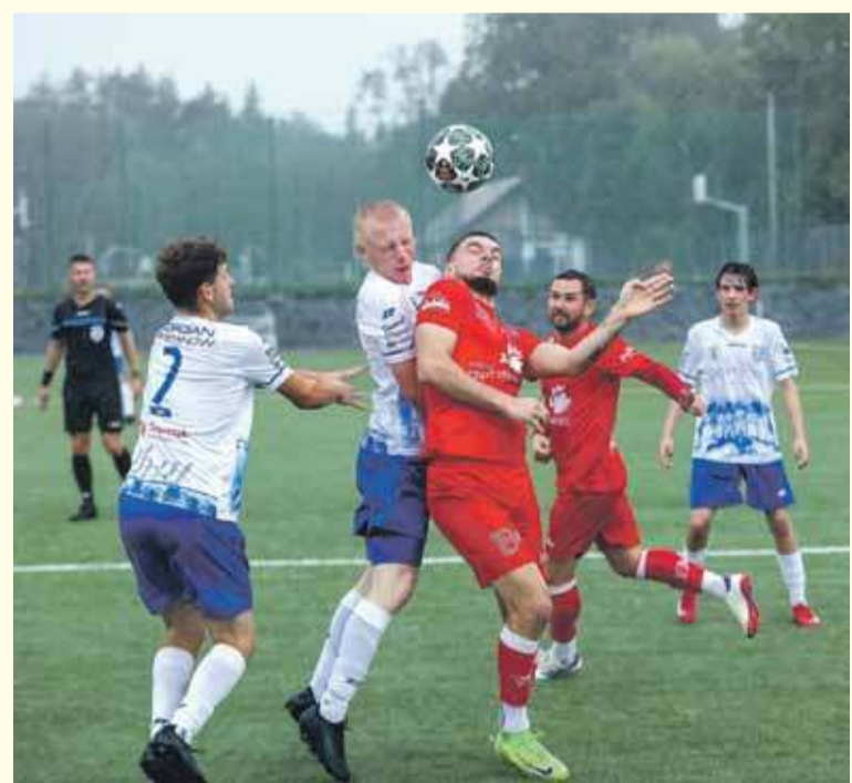
AP Wisła - Jordan Jordanów