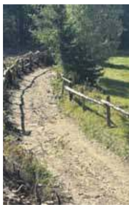
Czy płoty będą gwoździem do trumny słynnej w całej Polsce turystycznej atrakcji?