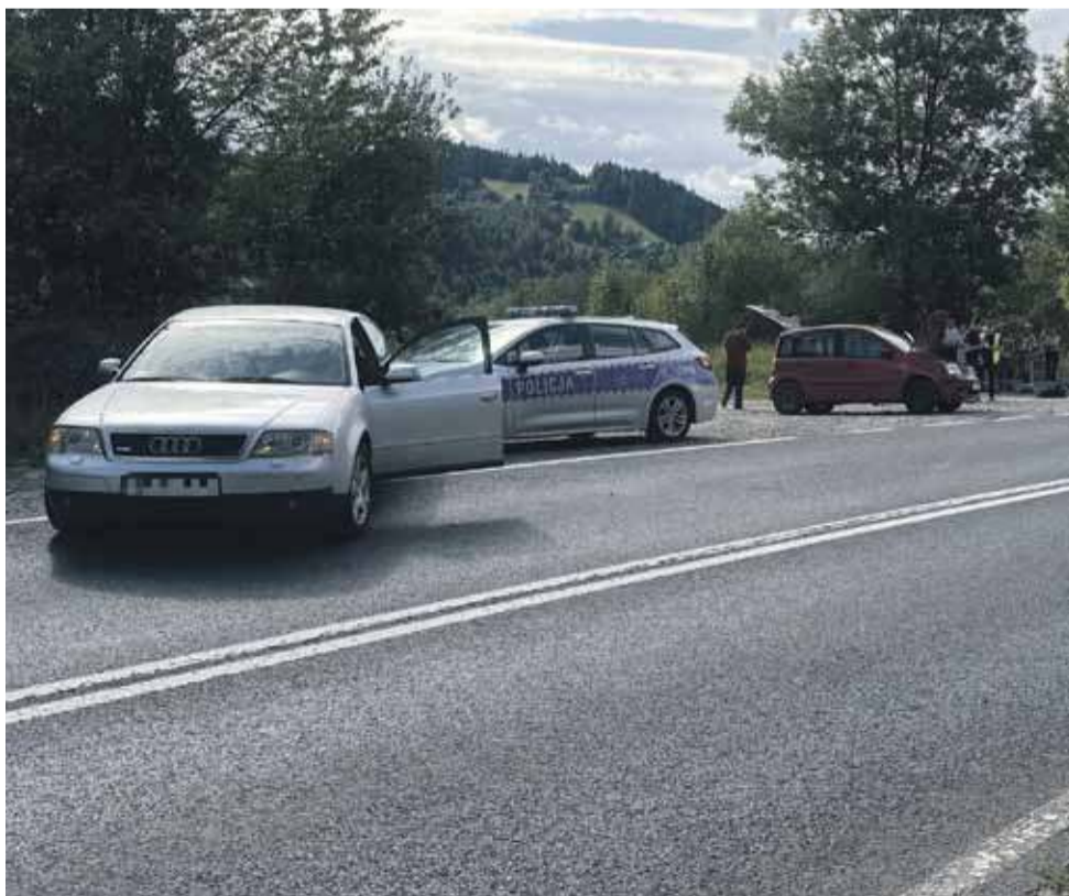
Piątkowy wypadek zdarzył się niemal w tym samym miejscu, gdzie pod koniec lipca doszło do tragedii - w zderzeniu ciężarówki z autem osobowym zginęła jedna osoba.