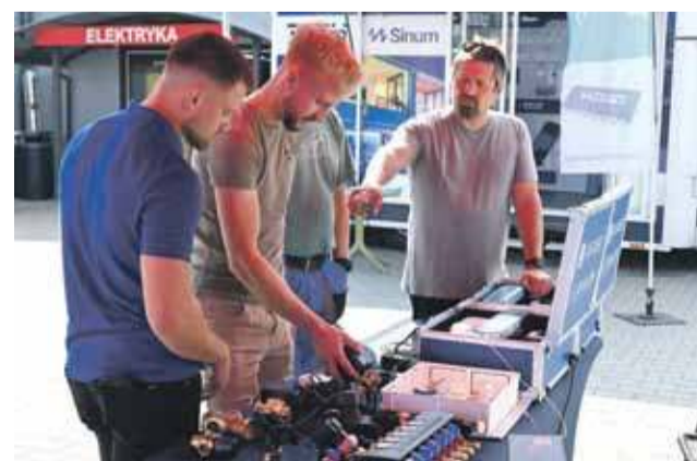
Na targach było kilkudziesięciu wystawców, z którymi chętnie rozmawiali budowlancy i majsterkowicze.

Odwiedzający nie tylko mogli kupić produkty, ale też uzyskać fachową podpowiedź i dowiedzieć się o najlepszych rozwiązaniach w branży budowlanej. Była też możliwość wypróbowania pro-