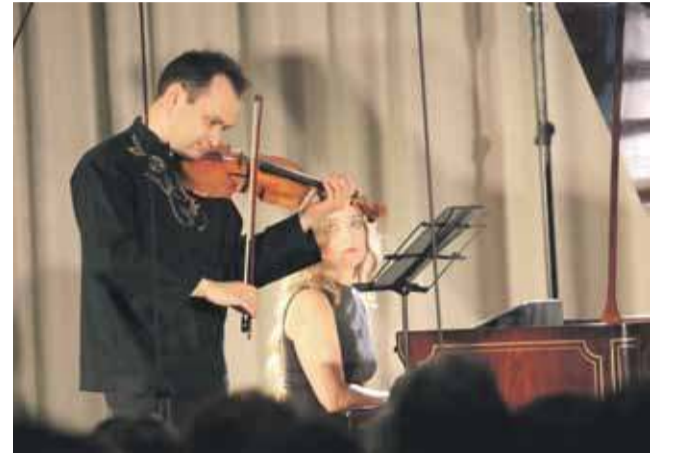
Koncert Janusza Wawrowskiego i Aleksandry Świąg zakończył Festiwal Muzyka na Szczytach.