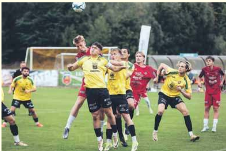
Luban Maniowy pokonał Watrę 3:1.

Po przerwie gospodarze rzucili się do odrobienia strat. W 47. minucie próbował Rudzki, ale Klag był na posterunku. W 62. minucie bliższy bramki był Pullen, który główkował po różnym