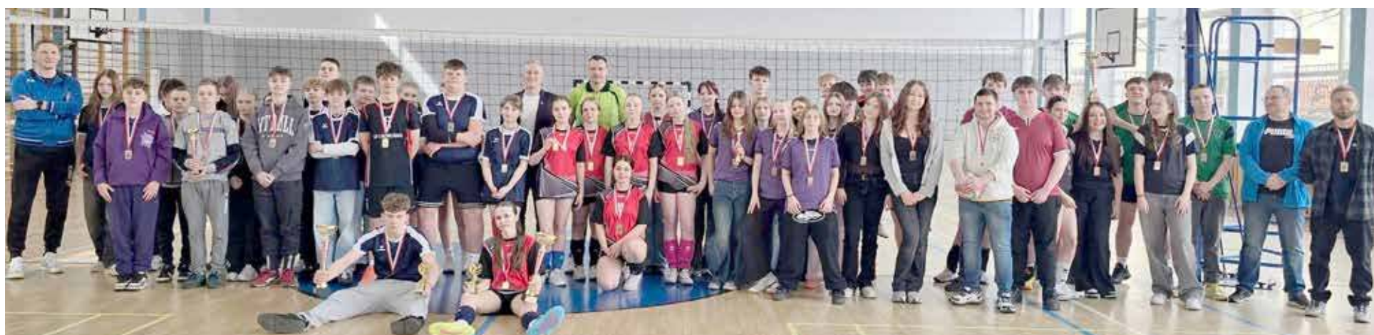
Do dekoracji uczestników doszło w piątek, 10 kwietnia