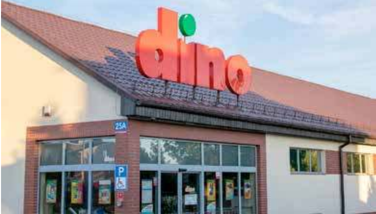
Zakończenie prac budowlanych możliwe jest jeszcze w tym roku

I u nas rośnie popularność sieci Dino. W najbliższych miesiącach ma bowiem powstać tu już trzeci sklep popularnej sieci supermarketów – tym razem przy ul. Tadeusza Kościuszki, w części miasta, gdzie do tej pory tak duży sklep handlowy nie funkcjonował.