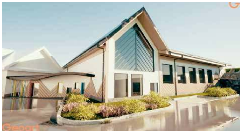
Sala sportowa SP w Rogoźnie. Kwota dofinansowania z programu Sportowa Polska do hali w Rogoźnie wynosi około 50% całej kwoty. Całkowity koszt inwestycji w Rogoźnie wynosi blisko 5 mln zł