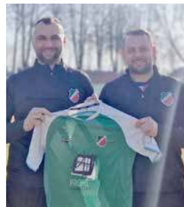
Trener pierwszego zespołu (po lewej) został zaprezentowany we wtorek na treningu

świeżym spojrzeniem pomoże naszej drużynie dalej się rozwijać, a co za tym idzie powrócić do odpowiedniego punktowania w meczach ligowych. Umowa została podpisana do końca czerwca bieżącego roku z możliwością przedłużenia na dłuższy okres.