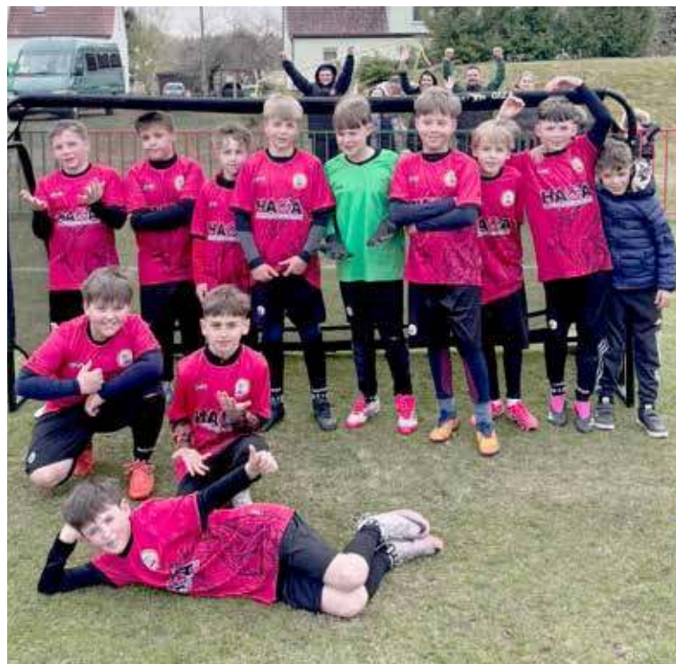
Drużyna rocznika 2015

(orlik starszy) wzięły udział w turnieju w ramach programu Pierwsza Piłka. Gospodarzem niedzielnych gier był klub Mewa Resko. W zawodach udział wzięły drużyny: MKS Sparta Gryfice, LKS Polonia Płoty, LKS Wicher Brojce, AMP Nowogard, Iskra Golczewo oraz Mewa Resko. To jak podkreśla trener zespołu, dużo grania, zaangażowania i