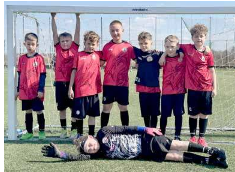
Drużyna z rocznika 2017