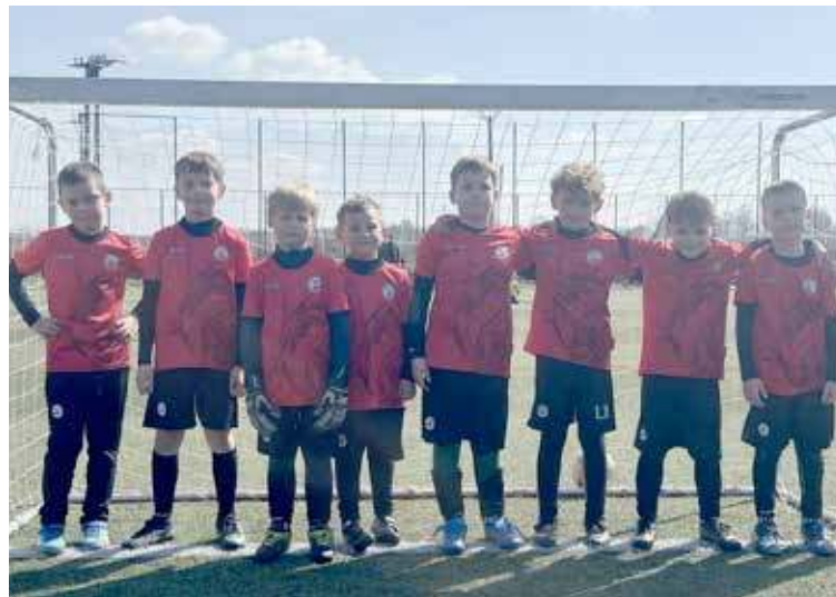
Drużyna z rocznika 2018