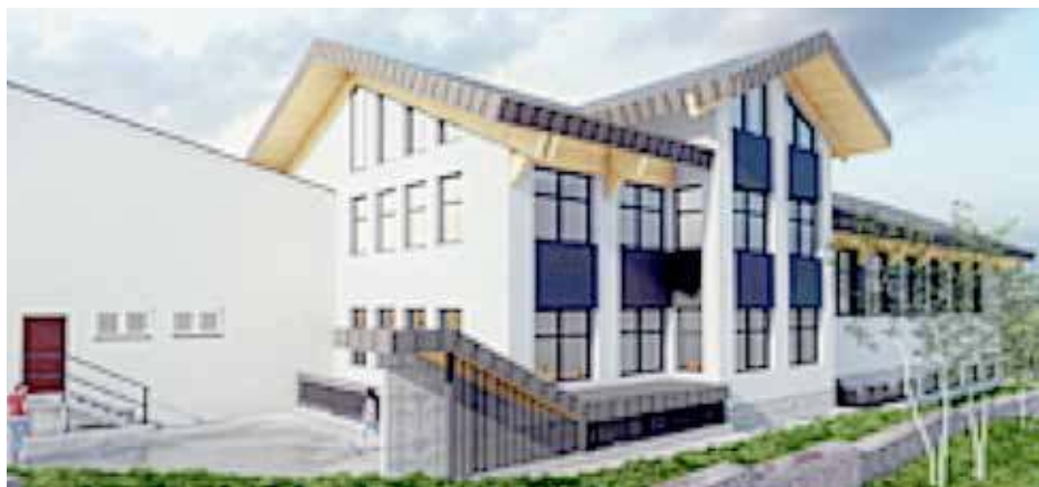
Zakopane - sala sportowa SP po prawej