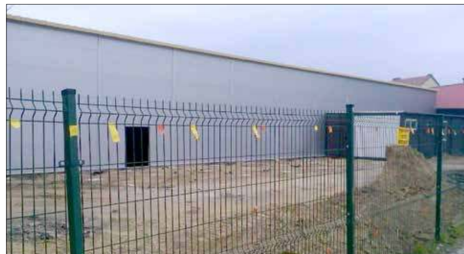
Nowogardzka Sala - jak magazyn nawozów