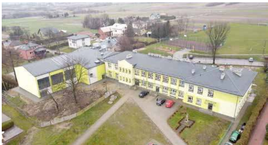
Nowa sala gimnastyczna w Danisz gmina Kościeliska będzie wyposażona w trybuny na 142 miejsca, salę fitness z siłownią, stołówkę, szatnie oraz zaplecze techniczne. Koszt ok 9 mln złotych