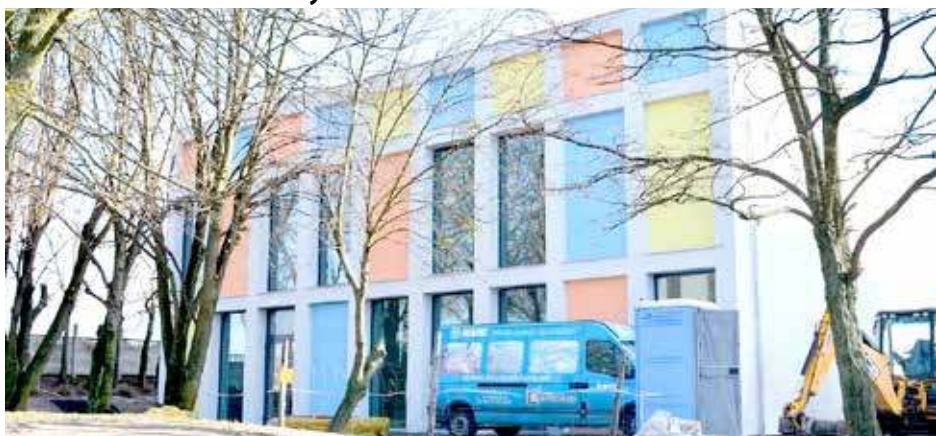
Sala gimnastyczna SP Głuszyno