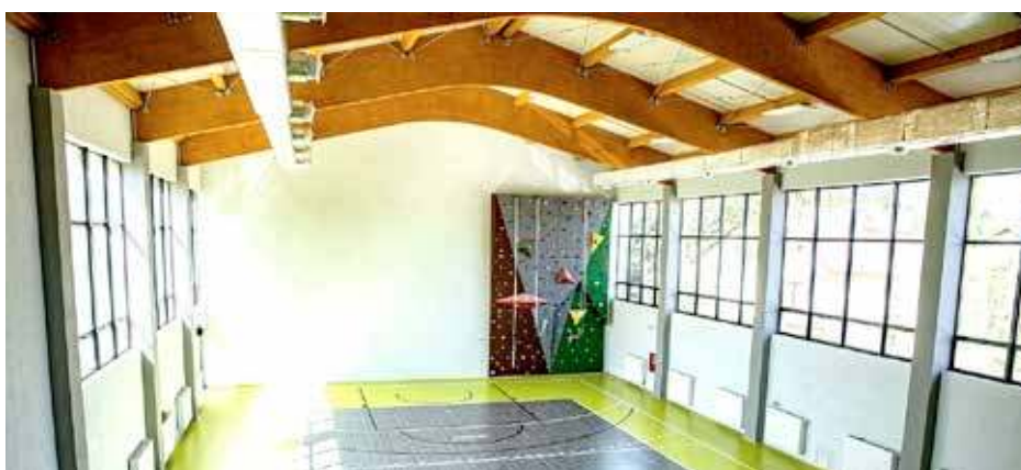
Sala w Rogoźnie - wnętrze