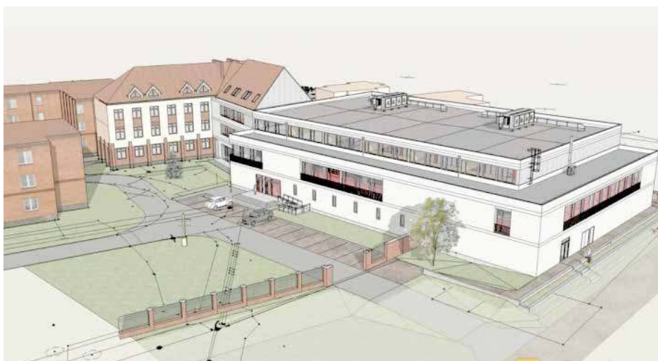
Sala Gimnastyczna szkoły w Kaliszu