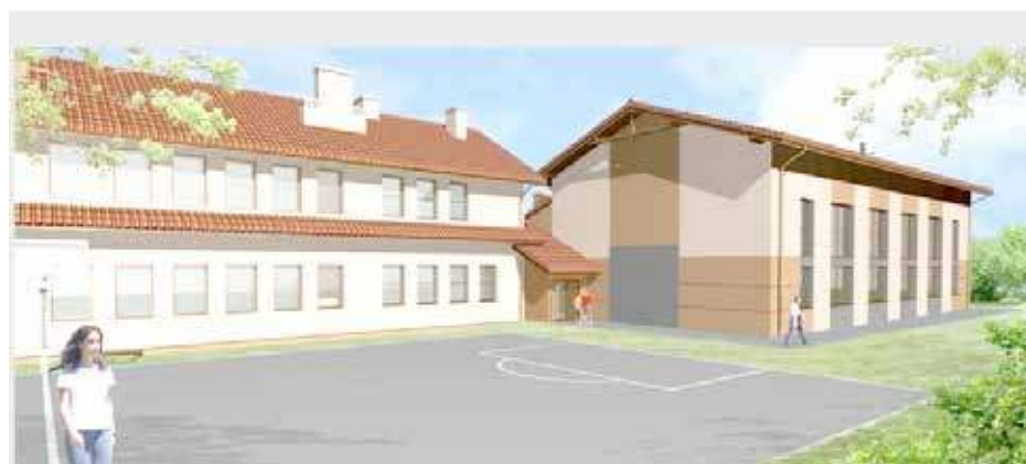
Sala gimnastyczna SP w Zabrzeże gmina Łącko