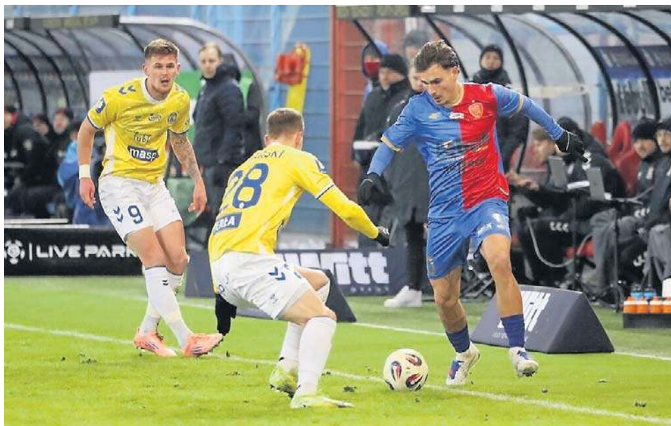
Ważne punkty w kontekście utrzymania Motor Lublin wywalczył w delegacji w Gliwicach