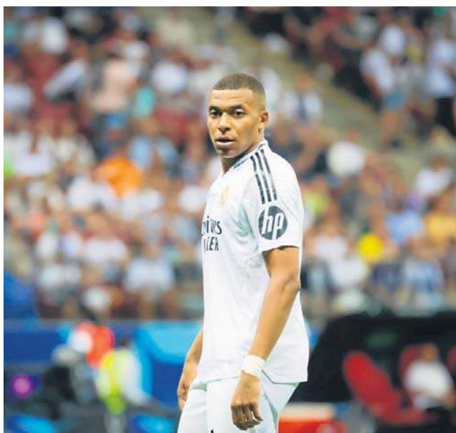
Królewscy zaraz po tym, jak wreszcie awansowali na fotel lidera La Ligi, zostali zatrzymani przez średniaka

Największym wydarzeniem eekendu na Półwyspie Iberyjskim była niespodziewana porażka Realu Madryt na wyjeździe z Osasuną Pampeluna. Królewscy po tym, jak wreszcie awansowali na fotel lidera La