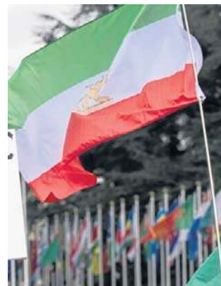
Demonstracje odbyły się na terenie kilku uczelni

Potem studenci starli się z funkcjonariuszami Basij, ochotniczej formacji paramilitarnej, która odegrała znaczącą rolę w stłumieniu poprzednich protestów politycznych. Na filmach