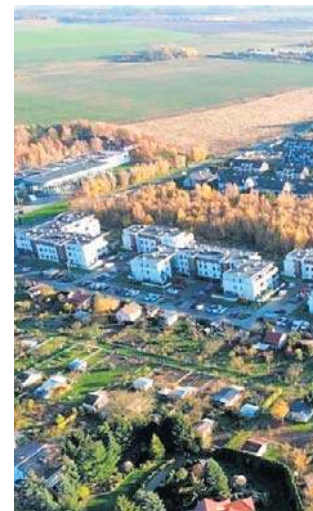
Na Osiedlu Bermudy w Wawrowie mieszka ponad siedemset osób

- Chcemy tego, by bardziej móc decydować o sobie. Fundusze sołectkie powstały po to, by być bliżej ludzi. A my od głównej części Wawrowa jesteśmy oddzieleni polami. W sytuacji, gdy - przykładowo