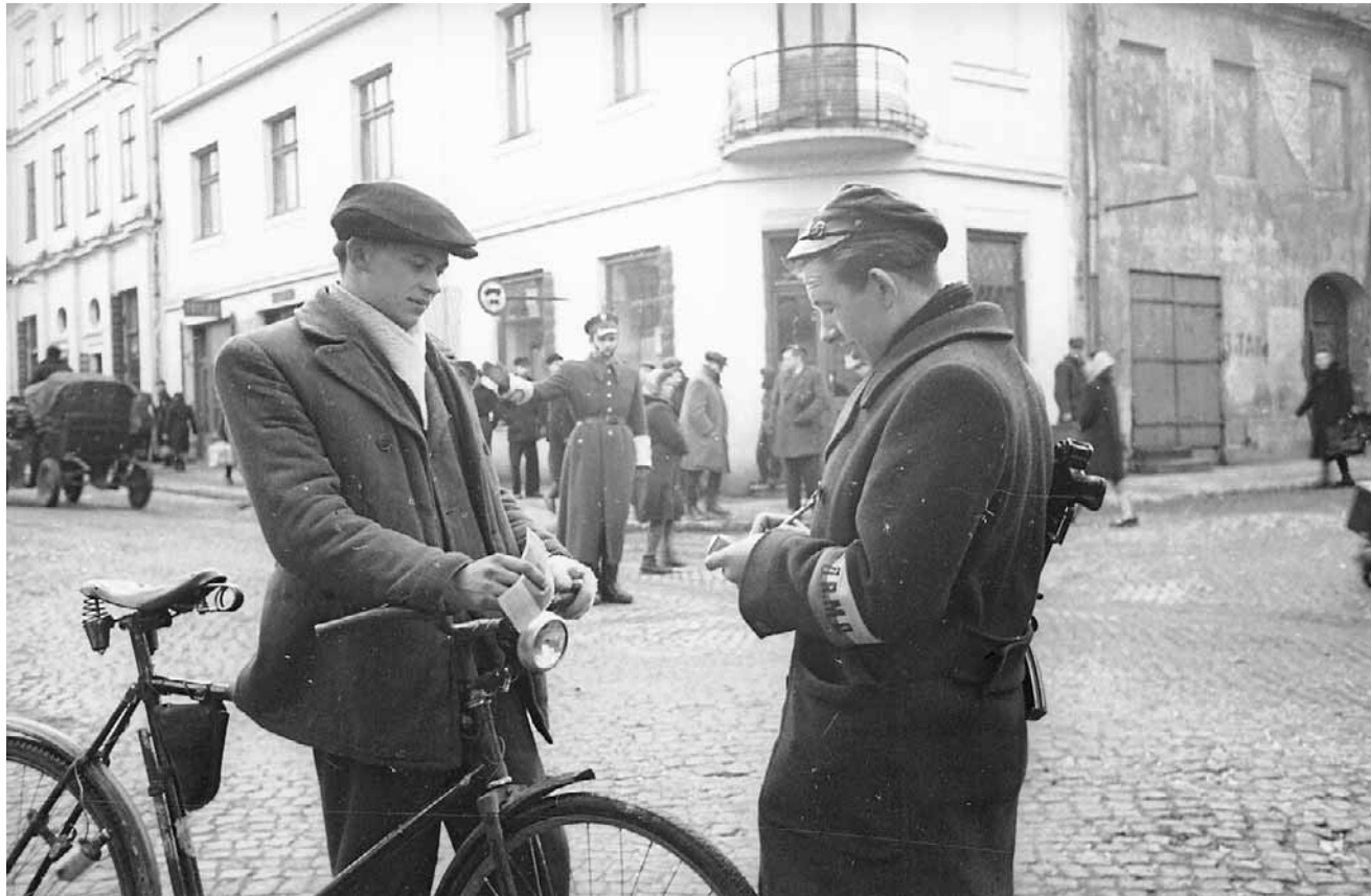
ORMO powstało w 1946 roku. W szczytowym okresie PRL-u liczyła 400 tys. ludzi. Rezerwę rozwiązano w 1989 r.