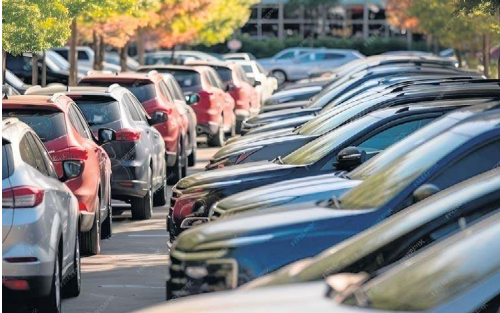
Gorzowski radny wraca do starego pomysłu koncepcji parkingów buforowych

Jeden z gorzowskich radnych postanowił wrócić do koncepcji parkingów buforowych. To rozwiązanie dobrze znane z większych miast. Specjalne miejsca postojowe, zlokalizowane na obrzeżach centrów miast, służą zmniejszeniu