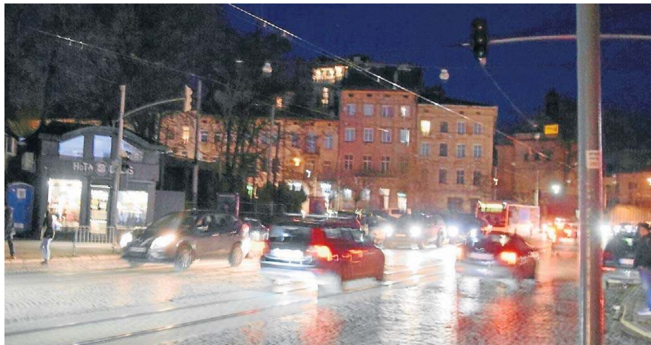
Ukraińskie miasta z reguły pogrążone są w ciemności. Utrapieniem dla Lwowa i mieszkańców wielu innych miejscowości są ciągłe przerwy w dostawie prądu, spowodowała atakami Rosjan na sieci energetyczne