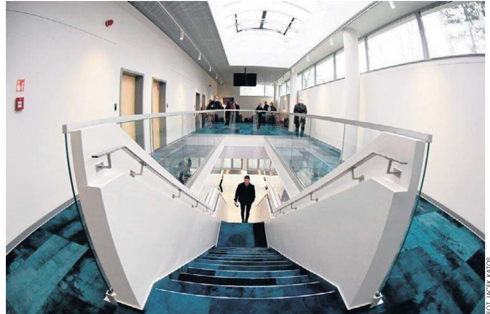
Zarząd Województwa Lubuskiego ogłosił m.in. konkurs na dyrektora Regionalnego Centrum Animacji Kultury