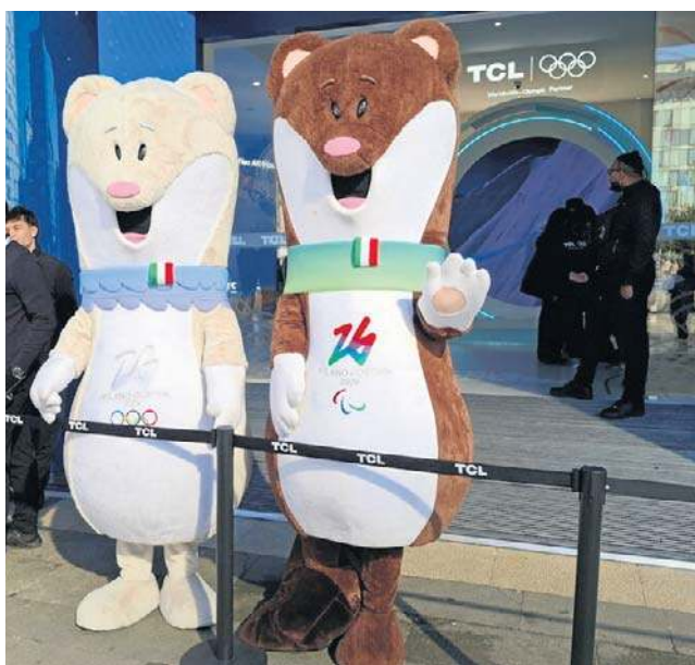
Maskotki XXV Zimowych Igrzysk Olimpijskich i XIV Zimowych Igrzysk Paralimpijskich – gronostaje Tina i Milo

- Skialpinizm miał fenomenalny start, w naprawdę niesamowitej atmosferze - wyjaśnił szef komitetu organizacyjnego.