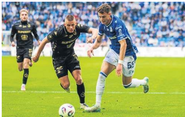
Jagiellonia zawiodła, a Lech dał radę w Lidze Konferencji

Co poszło nie tak w spotkaniu z Fiorentiną w Białymstoku? Początek mieliśmy dobry, kontrolowaliśmy sytuację, ale nie przełożyło się to na gole w pierwszej części, a zaraz na początku drugiej goście z Włoch objęli prowadzenie. Fiorentina pokazała jakość przede wszystkim przy stałych fragmentach, z nich uzyskała bramki. Na pewno jednak nie był to zespół nie w naszym zasięgu. W Białymstoku, tak mi