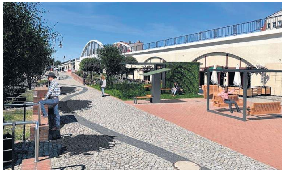
Jeśli miasto otrzyma dofinansowanie, a wykonawca zostanie wyłoniony w pierwszym przetargu, bulwar będzie mógł tak wyglądać już w przyszłym roku

Opis zmian zaczynamy od strony mostu Staromiejskiego. Znajdujący się na wysokości sport pubu teren zielony zachowa swój dotychczasowy wygląd, ale teren położony tuż obok przejdzie rewolucję. W miejscu gdzie przez wiele lat był przeszklony pawilon „grzybek”, a ostatnio był ogródek ga-