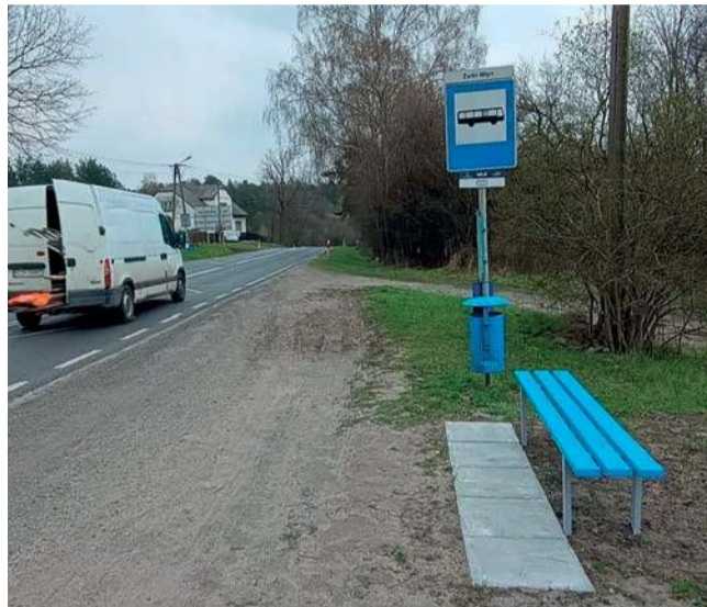
Nowa ławka na przystanku Żarki Młyn