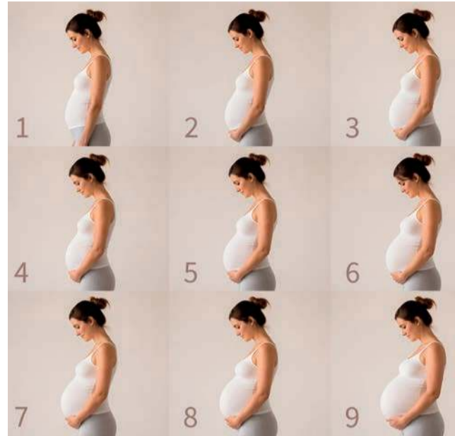
Brzuch kobiety w okresie ciąży

Poprzez odpowiednie ćwiczenia oraz techniki przygotowujące ciało do porodu, w tym m.in. pracę z tkankami krocza. Pomoże w tym fizjoterapeutka uroginekologiczna.