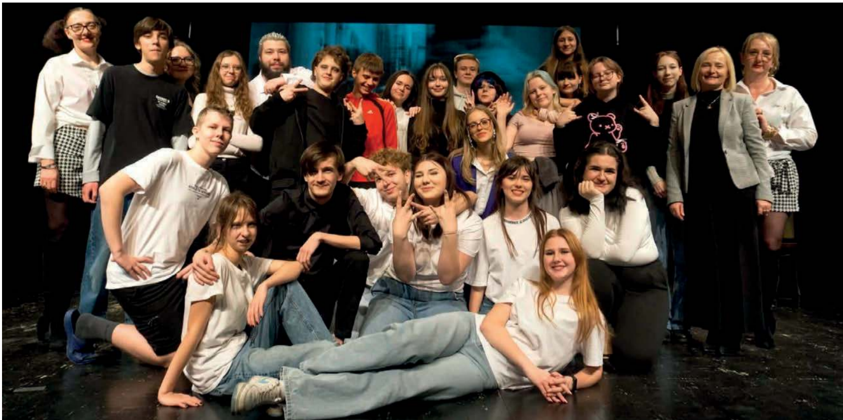
Grupa teatralna działająca przy ZSECh w Trzebini.