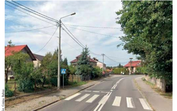
To przejście dla pieszych w Jankowicach zostanie doświetlone

Przejście dla pieszych w Jankowicach na ul. Wadowickiej (droga wojewódzka nr 781), niedaleko skrzyżowania z ul. Jabłonka, zostanie doświetlone. Prace zostaną dofinansowane z programu „Poprawa bezpieczeństwa na przejściach dla pieszych w ciągu dróg wojewódzkich Województwa Małopolskiego”. Udział gminy Babice w finansowaniu tej inwestycji wyniesie 30 procent kosztów całego zadania, ale nie więcej, niż 12 tysięcy złotych.