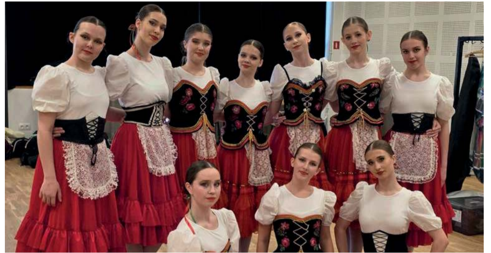
Juniorzy które tańczyły Tarantelle.