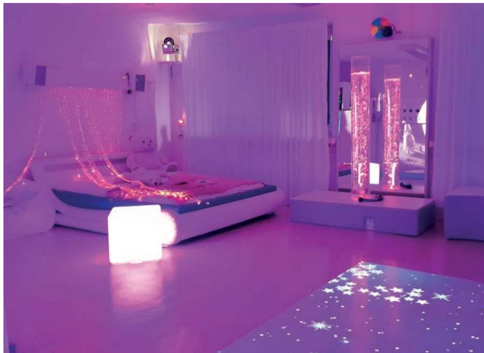
Sala doświadczenia świata w nowej odsłonie. Uczniowie bardzo lubią w niej przebywać