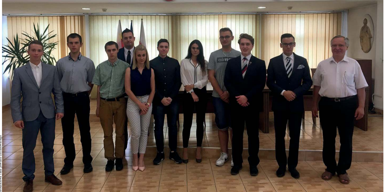
Młodzieżowa Rada Powiatu Chrzanowskiego - pierwszej i jednocześnie ostatniej kadencji

- Chcieliśmy zorganizować zajęcia, na których omawialiśmy potrzebę istnienia Młodzieżowej Rady Gminy we wszystkich szkołach. Skontaktowaliśmy się ze szkołą w Żarkach i tamtejszą opiekunką samorządu uczniowskiego i przeprowadziliśmy tam zajęcia. Niestety, potem wszystkie szkoły odmówiły nam możliwości prowadzenia prelekcji, co skutecznie ograniczyło możliwość promocji uchwały.