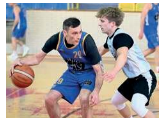
Zawodnik Last Dance próbuje odebrać piłkę przeciwnikowi z Projekt Basket (niebieska koszulka)

Więcej emocji przyniósł trzeci pojedynek, w którym Ragers pokonał Ekonom Ballers 84:66, utrzymując przewagę w kluczowych momentach meczu.