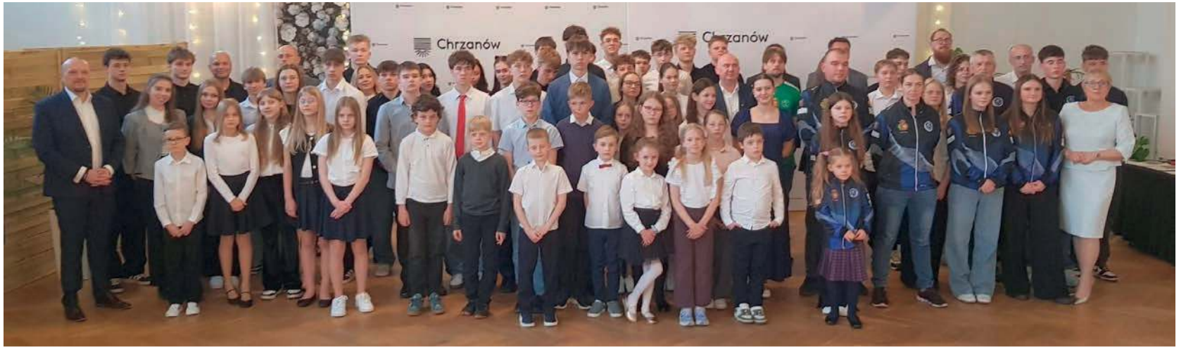
Uczestnicy Gali Sportu

- Waterpolo jest w Polsce jeszcze dość egzotyczną dyscypliną. Trafiałem do niej 21 lat temu przez mojego trenera pły-