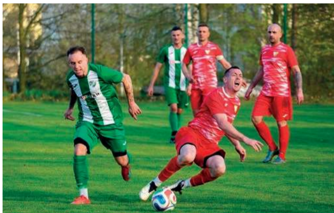
Faul zawodnika Gromca na rywalu z Żarek. Więcej zdjęć i wideo z meczu można obejrzeć na przelom.pl

Po trzech porażkach z rzędu piłkarze Gromca pokonali 3-0 Żarki. Gracze MKS Trzebinia wywalczyli punkt w Tarnowie. W Lusowicach lepszy w gminnych derbach okazał się Fablok.