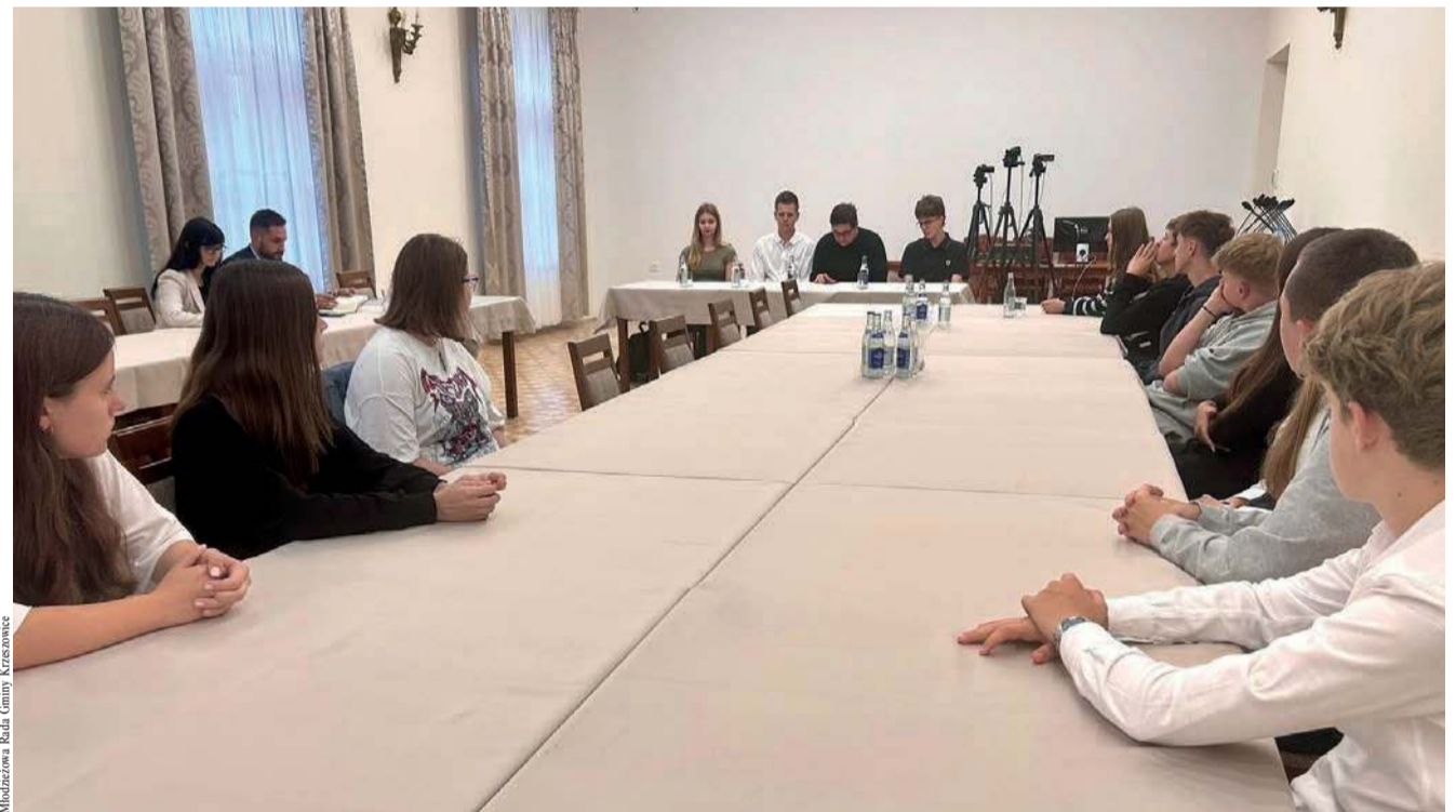
Obrady Młodzieżowej Rady Krzeszowice

Więcej mówi o tym jedna z uczennic szkoły w Żarkach: