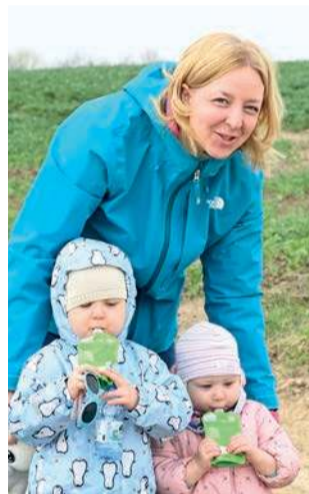
W wydarzeniu wzięli udział nawet kilkuletnie dzieci