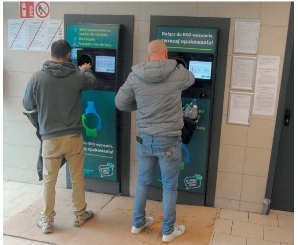
Lokalne butelkomaty pracują pełną parą