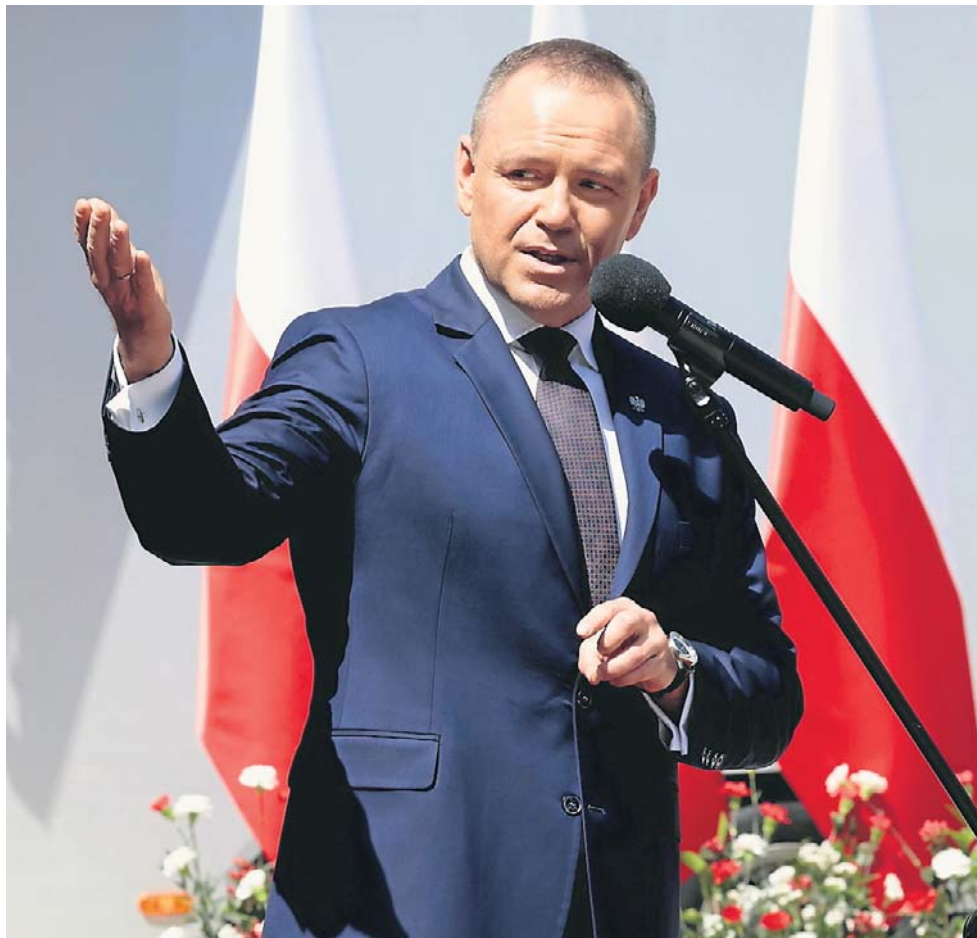
Prezydent Nawrocki i tak do Stanów Zjednoczonych polecał. Nie przejął się zanadto komentarzami prezesa, ale i polityków koalicji rządzącej

Prezydent Nawrocki ma ostatnio sporo na głowie: na jego biurku wylądowały nowe projekty ustaw, które mógł podpisać lub zawetować, i zaproszenia. Także to zza oceanu: od prezydenta Donalda Trumpa. Trump zaprosił Nawrockiego na UFC Freedom 250 w Białym Domu. To jedna z imprez towarzyszących obchodom 250. rocznicy powstania Stanów Zjednoczonych, nie bez znaczenia jest także fakt, że gala największej organizacji MMA odbyła się w dniu 80. urodzin prezydenta USA.