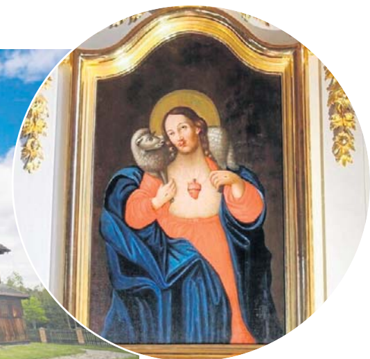
Obraz Najświętszego Serca Pana Jezusa w Milejczycach powstał na przełomie XVII i XVIII wieku

Potwierdzeniem tego kultu będą zaplanowane na piątek uroczystości w Milejczycach związane z ustanowieniem Sanktuarium Najświętszego Serca Pana Jezusa Dobrego Pasterza. Podniesienie kościoła św. Stanisława Biskupa i Męczennika w Milejczycach do rangi diecezjalnego sanktuarium będzie oficjalnym potwierdzeniem szczególnego znaczenia tego miejsca w życiu duchowym diecezji. To wyjątkowe wydarzenie będzie dniem wspólnej modlitwy, wdzięczno-