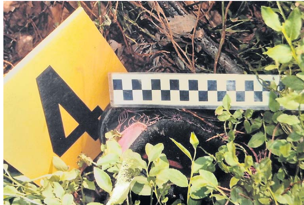
FOT. AKTA SPRAWY

swojego otoczenia. Od jednej z nich dowiedziała się o dziwnym zdarzeniu, które miało miejsce w noc, gdy zginęła 16-latką. Mieszkaniec jednej z nieodległych od Jasienia miejscowości, który pracował w Niemczech i woził pracowników do Polski, po przyjeździe nad ranem do domu zachowywał się nietypowo. Płakał i krzychał „Boże, jak to się stało?”. Była noc, więc zapewne sądził, że nikt go nie widzi. Sąsiedzi nigdy wcześniej nie widzieli go w takim stanie. Gdy następnego dnia media obiegła informacja o zwłokach znalezionych w Ładzy, osoba, która widziała tę sytuację, zaczęła się zastanawiać, czy nie miał on związku ze zbrodnią. Sąsiad miał dobrą opinię i wydawał się poza wszelkim podejrzeniem, dlatego nie podzieliła się wówczas tą wiedzą z policją. Rozmowy po latach na temat podcastu obudziły wspomnienia i dzięki temu dowiedzieli się o tym śledczy. Mimo że mężczyzna zmarł wiele lat temu, udało się przeprowadzić badania genetyczne, które wyklu-