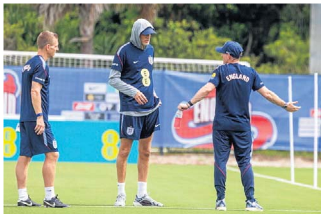
Reprezentację Anglii pod wodzą Thomasa Tuchela (w środku) odwiedzają w USA istne „plagi egipskie”

Makabryczną przygodę przeżyła reprezentacja Iranu przygotowująca się do meczów w USA w meksykańskiej bazie w Tijuanie. W pobliżu stadionu, gdzie trenują Persowie, policja odkryła w porzuconym SUV-ie rozkładające się ciało zapakowane w foliowy worek. Sprawcy morderstwa dotychczas nie namierzono. ©©