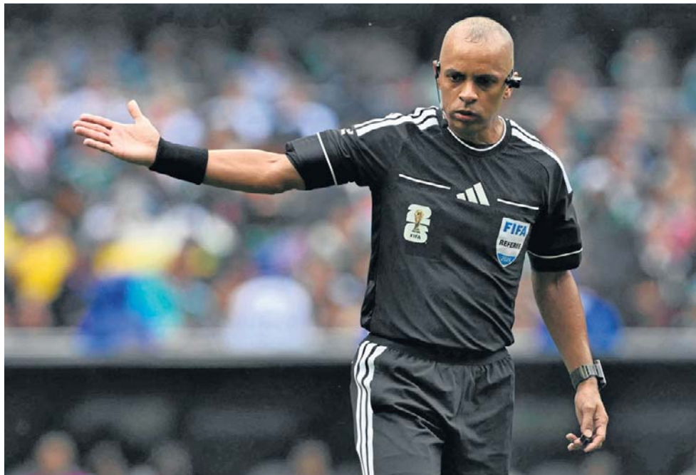
Sędzia meczu otwarcia, Brazylijczyk Wilton Sampaio, już zapisał się na kartach historii

Już w meczu otwarcia turnieju, w którym Meksyk zmierzył się z RPA (2:0), arbiter Wilton Sampaio z Brazylii pokazał, że sędziowie na mundialu po-