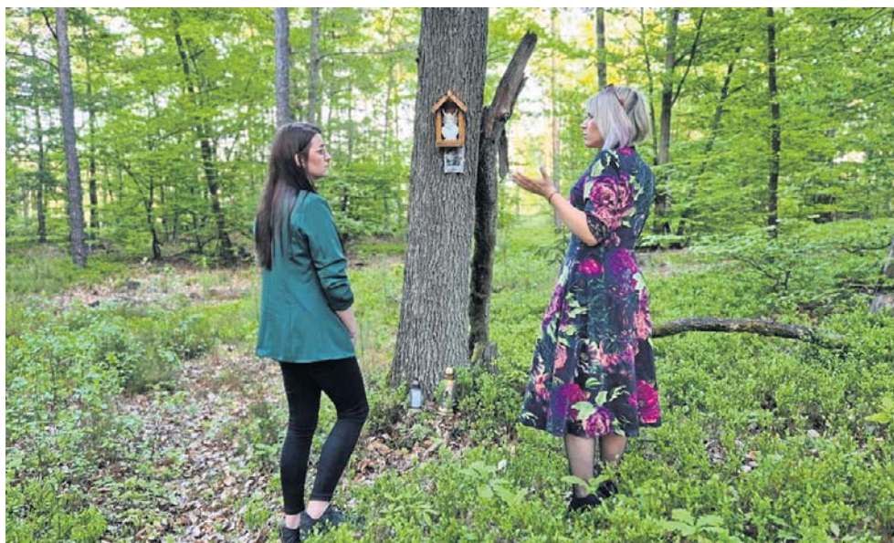
FOT. RADOSEAW DIMITROW

- Każdego dnia pytam: „Kto ci to zrobił, córeczko?”, ale odpowiedź na razie nie przyszła. Czasami śni mi się, że już, już mam się dowiedzieć, a wtedy sen się urywa. Ale ja wciąż wierzę, że poznam prawdę - mówi pani Barbara. ©©