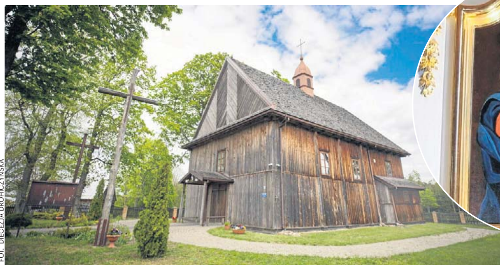
Kościół pw. św. Stanisława Biskupa i Męczennika w Milejczycach już w ten piątek zostanie podniesiony do rangi diecezjalnego sanktuarium

Wiernych i pątników do Milejczyc przyciąga obraz Najświętszego Serca Pana Jezusa. Wizerunek ten pochodzi z przełomu XVII i XVIII wieku i był in-