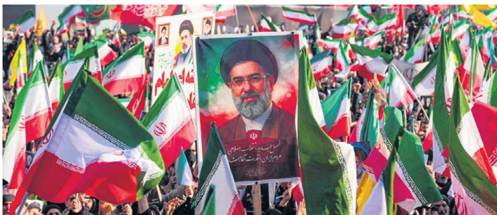
Porozumienie powinno zostać zatwierdzone rezolucją Rady Bezpieczeństwa ONZ

W zamian Iran ma uzyskać stopniowe złagodzenie sankcji i reintegrację z gospodarką światową. Przedstawiciel Białego Domu kategorycznie zdementował doniesienia o wypłaceniu Teheranowi konkretnych kwot