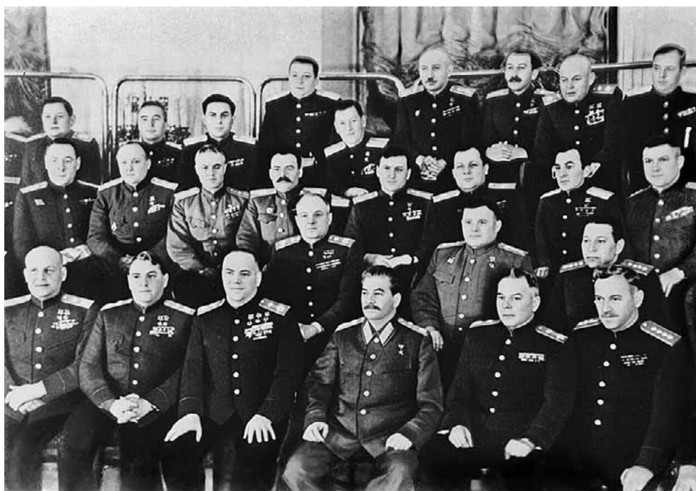
Generalissimus Józef Wissarionowicz Stalin w otoczeniu radzieckich marszałków i generałów, 1945 rok

Rok 1918 - w życie właśnie wchodzi dekret, który powołuje do życia Armię Czerwoną. Dokument wprowadza ponadto istotne zmiany: od tamtej chwili sowieccy oficerowie tytułowani są według pełnionych funkcji, znoszone zostają rangi, które obowiązywały dotąd w carskiej armii.