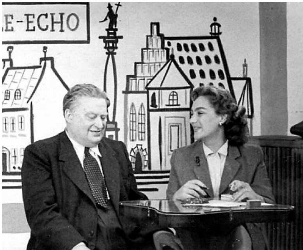
Cat szybko wskoczył w PRL-owskie realia. Zapraszano go nawet do telewizji. Romans z realnym socjalizmem skończył się w 1964 r., gdy został sygnatariuszem „Listu 34”