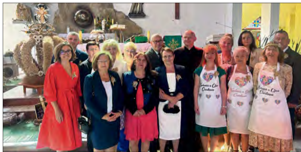
W Górażdżach już podziękowano za tegoroczne plony.

W kościele parafialnym w Górażdżach obchodzono doroczne święto plonów. W przystrojonej świątyni sprawowano uroczystą mszę świętą z licznym udziałem wiernych.