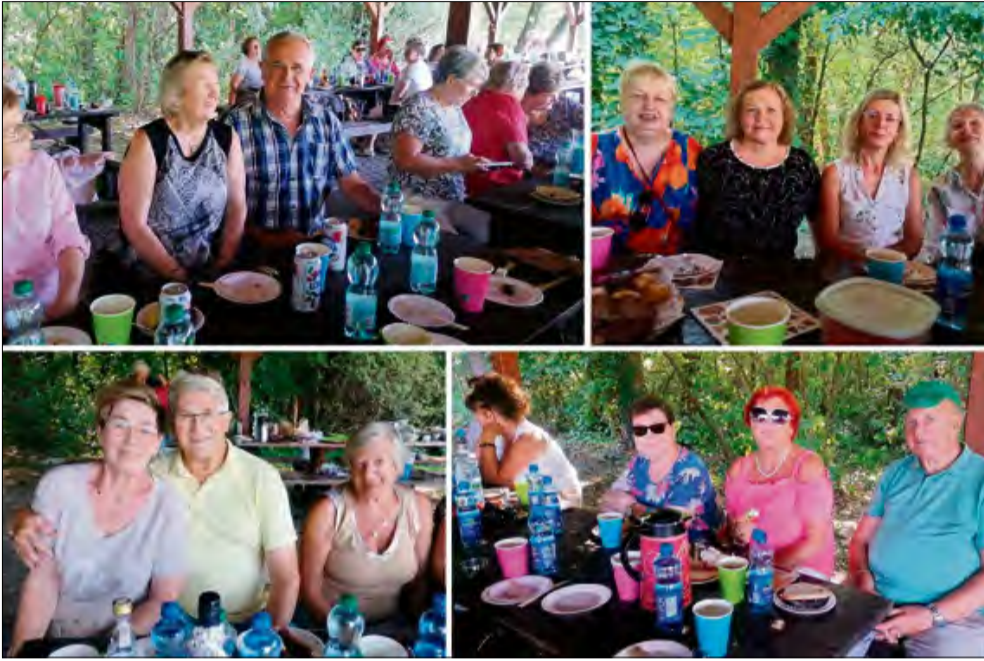
Ponad 80 seniorów zrzeszonych w UTW w Krapkowicach wzięło udział w Letnim pikniku nad stawem w Dobrej.

Przeszło osiemdziesięciu seniorów zrzeszonych w Uniwersytecie Trzeciego Wieku w Krapkowicach wzięło udział w Letnim pikniku nad stawem w Dobrej. Impreza przebiegła w niezwykle miłej i radosnej atmosferze, a uczestnikom dopisywały zarówno doskonałe humory, jak i piękna, słoneczna pogoda.