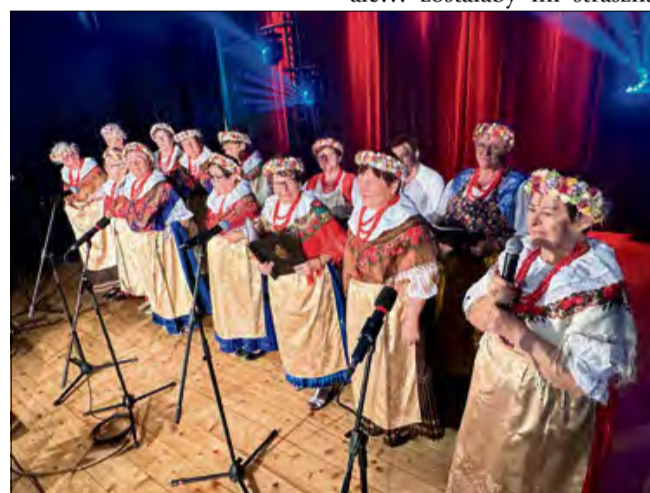
Nie mogło zabraknąć wspólnego śpiewu i anegdot.

na oraz krzewienie kultury ludowej. Zespół folklorystyczny „Walczanki” w swej karierze zdobył bardzo wiele znaczących nagród, pucharów, wyróżnień i dyplomów biorąc udział w przeglądach i konkursach.