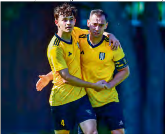
MKS Gogolin zasłużył na trzy punkty w starciu z Głucholązami.

ścił czwartą ekipę, która do tej pory zanotowała dwie wygrane i remis. Gospodarze z trzema zwycięstwami na koncie wywiązali się z roli faworyta, choć szalę na swoją stronę przechylili dopiero po przerwie. W