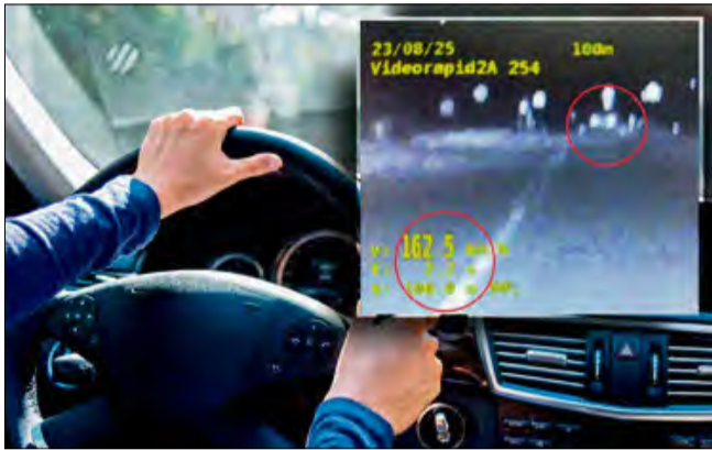
Kierowca pędził 162 km/h przez teren zabudowany.

Krapkowiccy policjanci zatrzymali dwóch piratów drogowych. Rekordzista przekroczył dozwoloną prędkość ponad trzykrotnie.