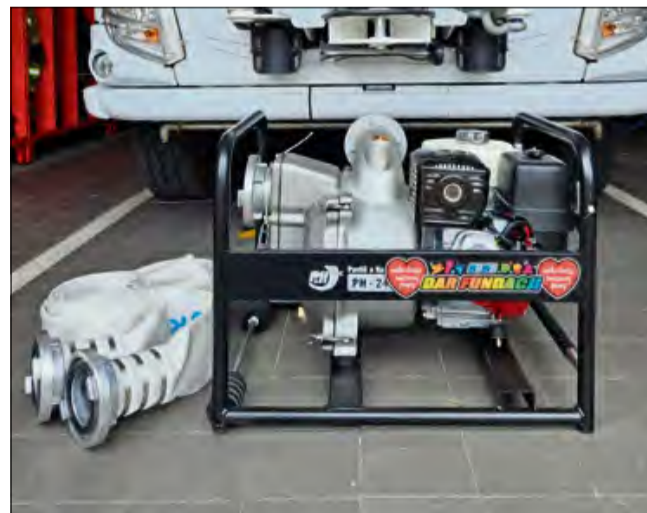
Przekazanie sprzętu było możliwe dzięki hojności darczyńców wspierających Wielką Orkiestrę Świątecznej Pomocy.

To strategiczne wyposażenie, szczególnie przydatne podczas działań ratowniczych w warunkach zagrożenia powodziowego lub podczas usuwania skutków innych lokalnych