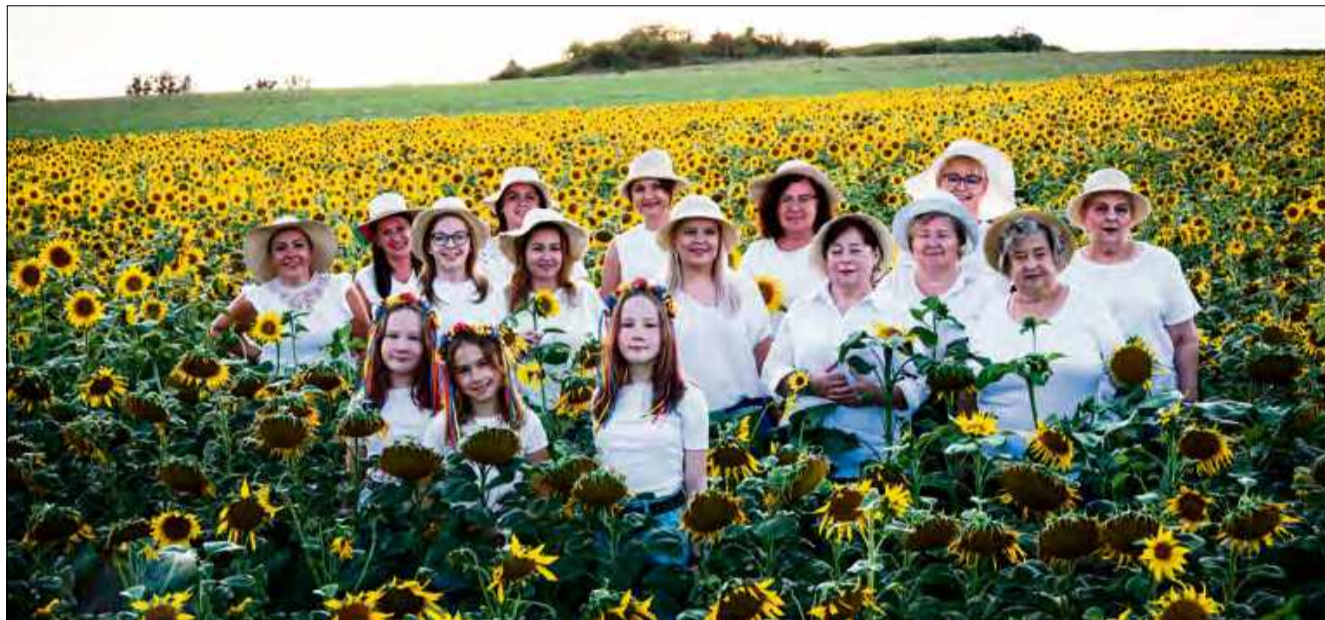
To właśnie ta różnorodność czyni, że koło „Chorulanki” jest tak wyjątkowe. Tu tradycja spotyka się z nowoczesnością.

Warto podkreślić, że grupa skupia w sobie panie w różnym wieku. Są zarówno młodsze, jak i starsze członkinie. Są także mieszkanki wioski od pokoleń, ale też i takie, które przeprowadziły