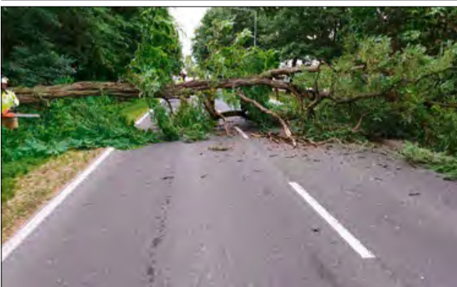
Do zdarzenia doszło w Otmęcie.

Dyżurny stanowiska kierowania KP PSP w Krapkowicach zadysponował jednostkę OSP Odrowąż do niebezpiecznie pochylonego drzewa nad jezdnią. To była błyskawiczna akcja.