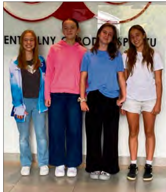
Reprezentantki UKS „Delfin” Krapkowice podczas przygotowań do sezonu w ramach Wojewódzkiej Kadry Młodziaków w pływaniu.

Po powrocie z obozu, pływaczki kontynuować będą przygotowania w Krapkowicach,