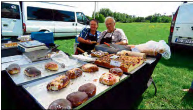
Krapkowicki plac Eichendorffa co dwa tygodnie zamienia się w miejsce pełne smaków i aromatów produktów regionalnych.

Miłośnicy regionalnych smaków i zdrowej żywności mogą ponownie szykować torby zakupowe. W czwartek, 28 sierpnia, w godzinach od 14.00 do 17.00, na placu Eichendorffa w Krapkowicach odbędzie się kolejna edycja „Straganka” - lokalnego bazarku z regionalnymi produktami.