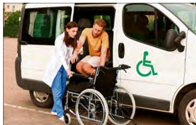
Asystent będzie wspierał także w prowadzeniu gospodarstwa domowego i w życiu rodzinnym.

Zakres oferowanego wsparcia jest bardzo szeroki. Obejmuje on pomoc w wykonywaniu czynności samoobsługowych i higienie osobistej. Asystent wspiera także w prowadzeniu gospodarstwa domowego i w życiu rodzinnym. Jego rolą jest również towarzyszenie w przemieszczaniu się oraz