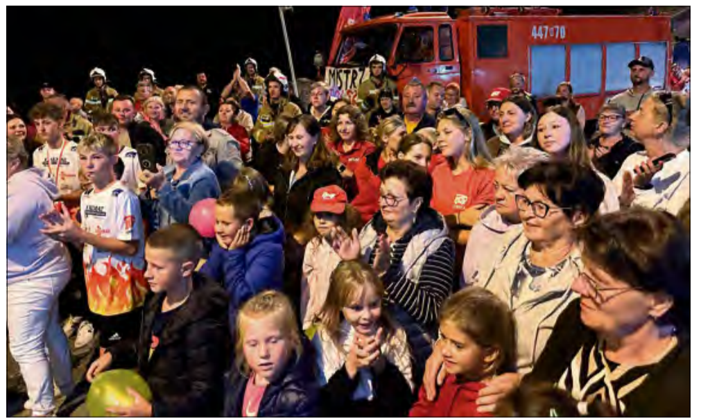
Przed remizą czekał na mistrzów tłum mieszkańców.

Gdy zegar wskazywał nieco po 21.00, ciszę Dobrej przerwał ryk syren i dźwięki orkiestry. Do wsi wjechał autokar, eskortowany przez wozy strażackie prawie z całej gminy Strzeleczyński. W środku – młodzi strażacy z Dobrej, którzy kilka dni wcześniej zdobyli w Steżycy mistrzostwo Polski. Cały konwój zafundował mistrzom emocje, których nie zapomną do końca życia. Przed remizą czekał na nich tłum – niemal cała miejscowość, od seniorów po najmłodszych.