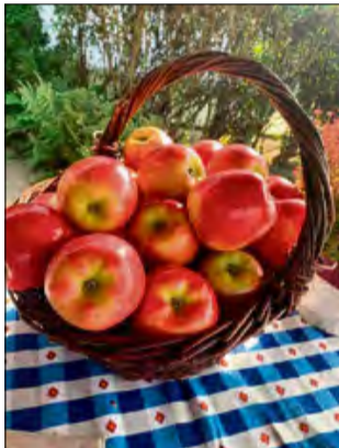
W tym tygodniu na „Straganku” po raz pierwszy pojawią się produkty wprost z sadu w Grudyni.

Sama inicjatywa gości w Krapkowicach od początku lipca i z każdym tygodniem zyskuje nowych zwolenników. Idea, która świetnie przyjęła się w sąsiednich powiatach, trafia także w gusta krapkowickiej społeczności. Na odwiedzających czekać będzie kilka stoisk wypełnionych naturalnymi produktami najwyższej jakości: złocisty miód prosto z pasieki, rzemieślnicze sery, domowe ciasta, warzywa z lokalnych pól, pachnące, naturalnie wędzone wędliny i ryby, a także kiszonki z różnych warzyw przygotowanych domowym sposobem. Nowością tej odsłony „Straganka” będzie stoisko z Grudyni, oferujące świeżo zebrane z tamtejszego sadu jabłka oraz naturalne soki i przetwory owocowe. Wszystko produkowane w krótkim łańcuchu dostaw, z poszanowaniem sezonowości i natury.