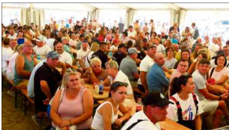
VI Konwój Charytatywny w Kórnicy i Głogówku przejdzie do historii. W trzy dni udało się zebrać aż 178 279,14 zł.

Jeszcze w ubiegłym tygodniu nikt nie przypuszczał, że VI Konwój Charytatywny pobije finansowy rekord. A jednak - mieszkańcy powiatu krapkowickiego i druhowie z całego regionu zrobili coś, co przejdzie do lokalnej historii: w trzy dni zebrali 178 279,14 złotych. A to jeszcze nie koniec!