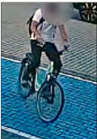
Badanie alkometem wykazało, że 31-latek miał w organizmie blisko 3 promile alkoholu.

31-letni mężczyzna przyjechał do Komendy Powiatowej Policji w Krapkowicach, aby zgłosić obawy dotyczące konfliktu ze znajomym. Okazało się, że sam zgłaszający przyjechał rowerem mając blisko 3 promile alkoholu, a dodatkowo swój pojazd zaparkował na miejscu dla osób z niepełnosprawnością.