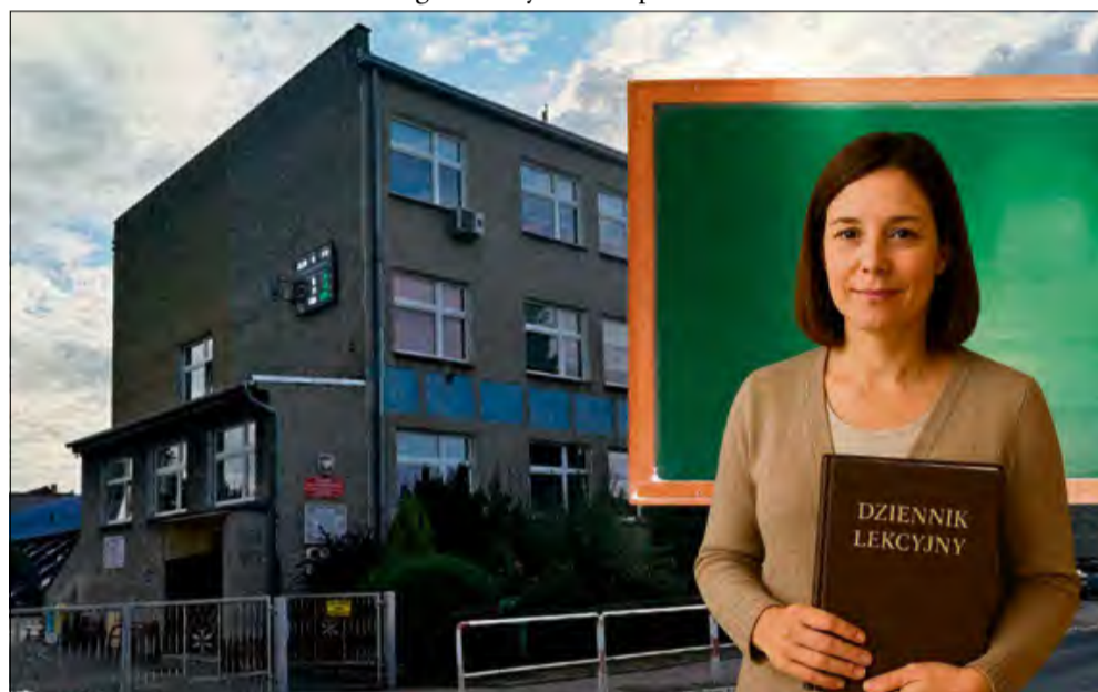
Nowe przepisy MEN mogą wprowadzić kary finansowe dla rodziców za nieobecności uczniów w szkole już od roku szkolnego 2025/2026.

— To zdecydowanie za dużo. W żadnym innym kraju nie ma tak liberalnego podejścia do nieobecności — zaznaczyła minister edukacji