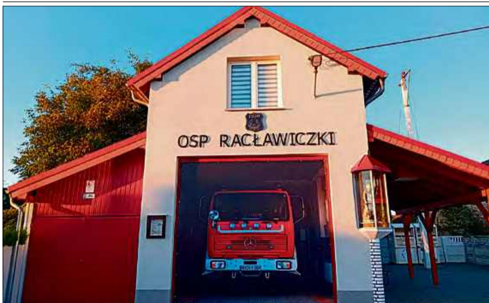
Ochotnicza Straż Pożarna w Raclawiczkach szykuje się do swojego święta.

W Raclawiczkach rozpoczęło się wielkie odliczanie do święta 105-lecia Ochotniczej Straży Pożarnej. W programie wydarzenia ważne uroczystości oraz solidna dawka zabawy.