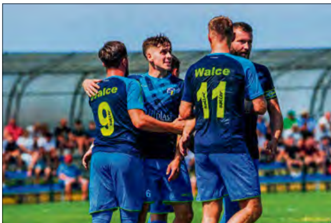
Po wygranej w Czarnowąsach walczenie zameldowało się w 1/8 finału pucharowych rozgrywek w naszym województwie.