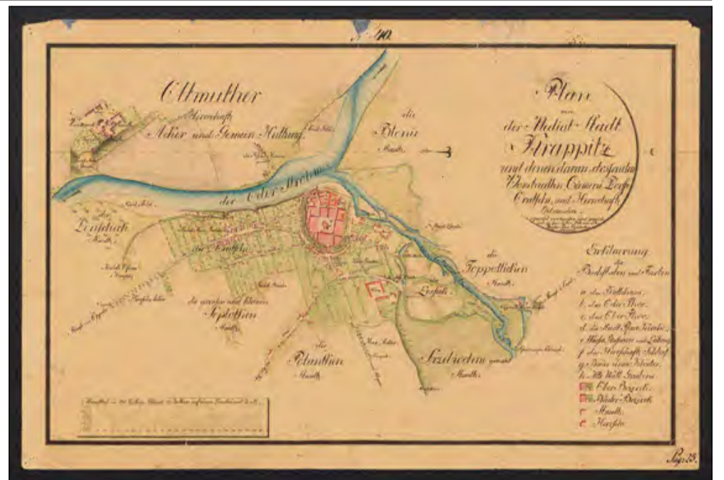
Plan Krapkowic z 1811 r. z zaznaczą nazwą Oracze (Oratsche) w rejonie dzisiejszej ulicy Opolskiej.

W samym centrum średniowiecznych Krapkowic, w