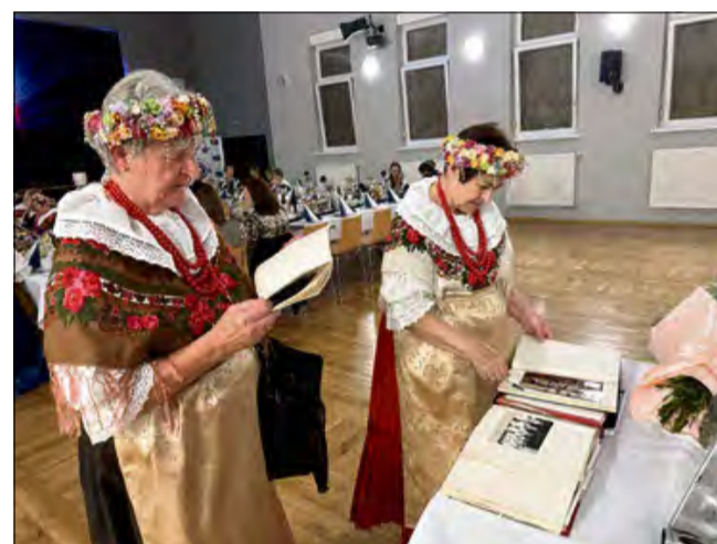
Podczas jubileuszu był czas na wspomnienia.

i publiczności, która wspólnie z zespołem tworzyła tę piękną historię.