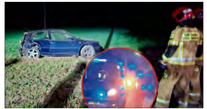
Zdarzenie miało miejsce około godziny 2.30 przy ul. Krapkowickiej w Pietnej.

Jak podają mundurowi, samochodem jechała tylko jedna osoba. 21-letni kie- rowca w chwili zdarzenia był trzeźwy. Z obrażeniami ciała przetransportowano go