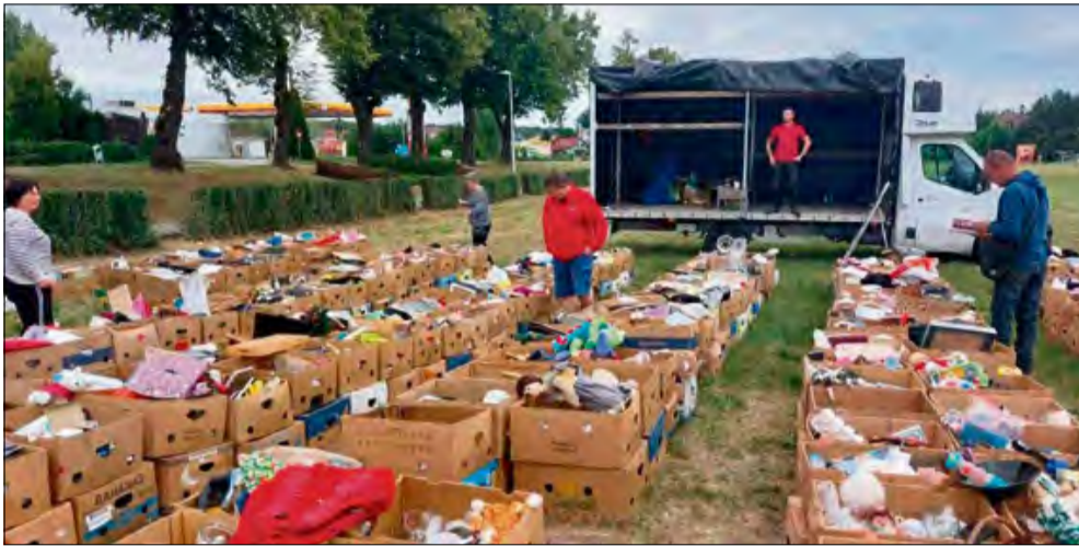
23 sierpnia plac Eichendorffa w Krapkowicach zamienił się w wielki pchli targ.

Ubrania, zabawki, antyki i bibeloty z duszą - w sobotę 23 sierpnia plac Eichendorffa w Krapkowicach zamienił się w wielki pchli targ. Mieszkańcy sprzedawali i kupowali przedmioty, które zamiast wylądować w koszu, dostały drugie życie.