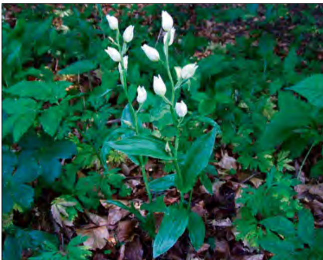
Buławnik wielkokwiatowy Cephalanthera damasonium należący do rodziny storczykowatych.