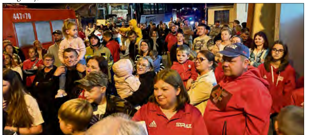
Drużyna postawiła na nogi całą wieś.