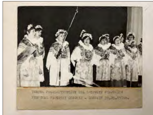
Jedno z pierwszych zdjęć Walczanek podczas występu w 1979 roku.