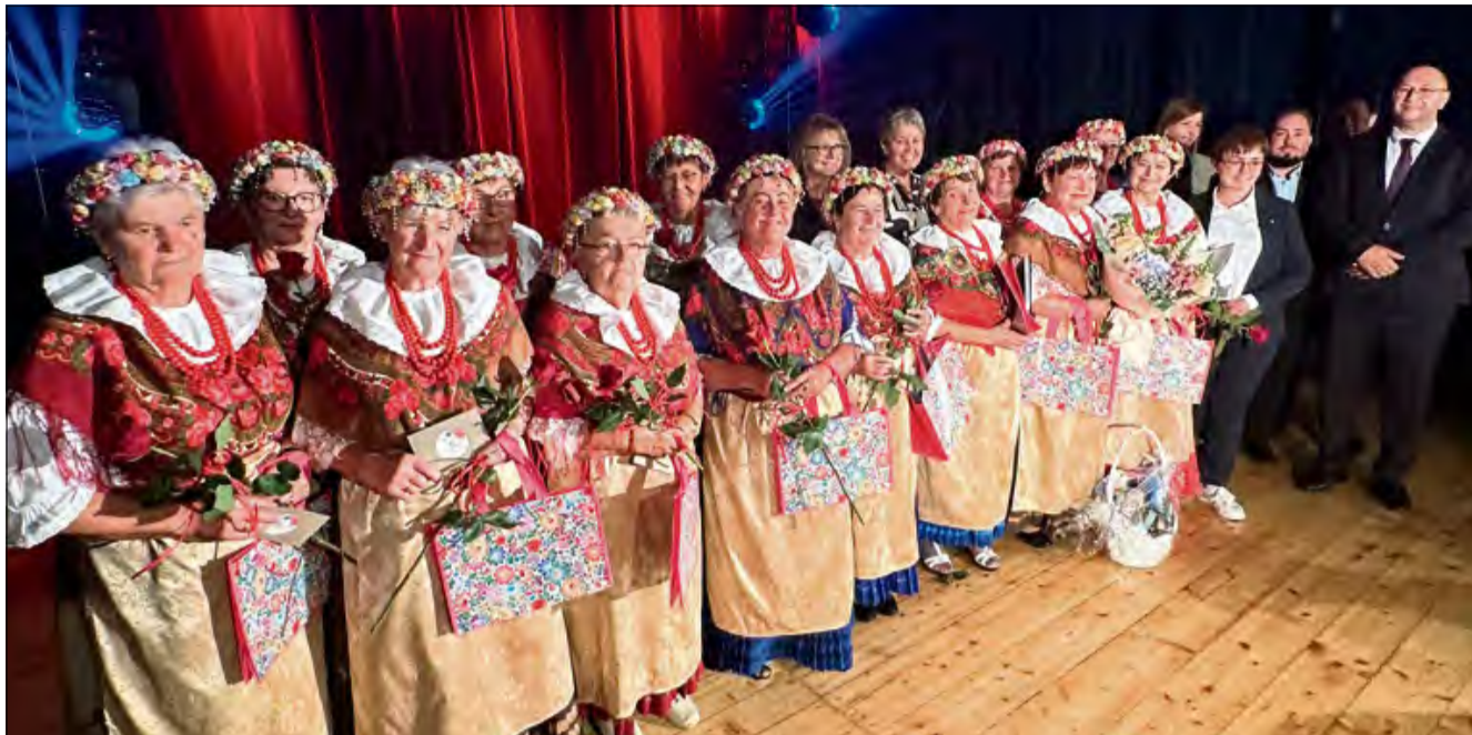
Walczanki śpiewają już od połowy wieku.

To była sobota pełna wzruszeń, muzyki i wspomnień. Zespół Folklorystyczny „Walczanki” obchodził swoje 50-lecie działalności - pół wieku wiernego trwania przy śląskiej tradycji, muzyce i śpiewie.