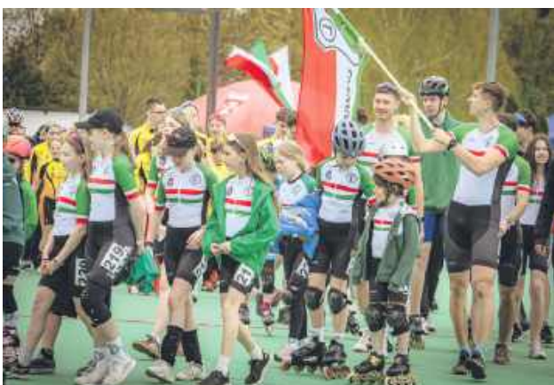
Mistrzostwa we wrotkarstwie.