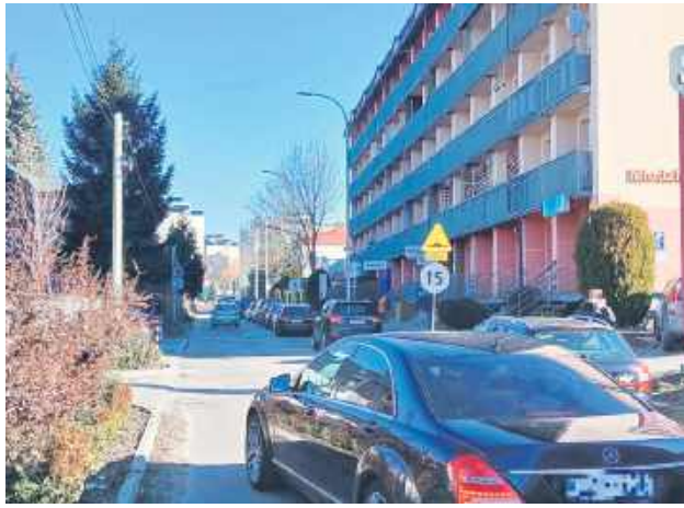
Mieszkańcy bloku przy ul. Młodziejowej 6 (na zdjęciu: po prawej) chcą otwarcia ulicy na ul. Bołtucia.

Sprawa ucichła, ale dwa lata temu do Budżetu Obywatelskiego zgłoszono projekt wymiany nawierzchni ul. Młodziejowej. Dzięki głosom mieszkańców projekt został wybrany do realizacji. Miasto przeznaczyło na opracowanie dokumentacji projektowej przebudowy ulicy 120 tys. zł. To wtedy mieszkańcy dowiedzieli się, że dokumentacja obejmuje nie tylko wymianę nawierzchni, lecz także otwarcie