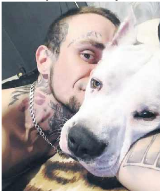
Pan Artur i jego „dzieciaczki”.

Przedstawiciele Fundacji Ochrony Zwierząt „Pańska Łaska” zrobili nalot na posesję mieszkańca gm. Sułów, odbierając mu dwa dogi argentyńskie – Snieżkę i Reyę. Podstawą interwencji miał być filmik przedstawiający właściciela znęcającego się nad psami. Do takiego zdarzenia faktycznie doszło, ale znacznie wcześniej, za co mężczyzna został zresztą skazany. Ale obrońcy zwierząt tego nie zwerifikowali i w asyście policjantów odebrali czworonogi. – To była zwykła kradzież! Policja powinna psy odzyskać, a złodzieja ukarać – denerwuje się 35-latek. Odślaniamy kulisy tej sprawy.