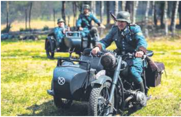
W inscenizacji historycznej wzięło udział blisko stu rekonstruktorów z całej Polski.