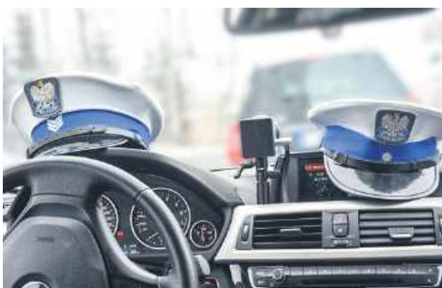
22-latek z Ukrainy pędził autem przez Liski o 70 km/h szybciej niż zezwalają przepisy, a dwaj pozostali przekroczyli prędkość prawie o 60 km/h. Wszyscy trzej przez najbliższe trzy miesiące będą mogli jeździć samochodami tylko jako pasażerowie.

Ciężka noga i kompletny brak wyobraźni – tak można podsumować „wyczyny” trzech kierowców, którzy 28 kwietnia pożegnali się ze swoimi prawami jazdy. Rekordzista pędził przez wieś ponad 120 km/h. Policja ostrzega: taryfy ulgowej nie będzie, a nowe przepisy uderzają w piratów drogowych jeszcze mocniej.