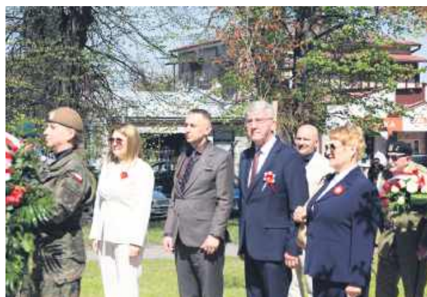
Uroczystości trzeciomajowe w Tomaszowie.

nia w duchu polskiego patriotyzmu, dlatego każde święto państwowe i uroczystość religijna