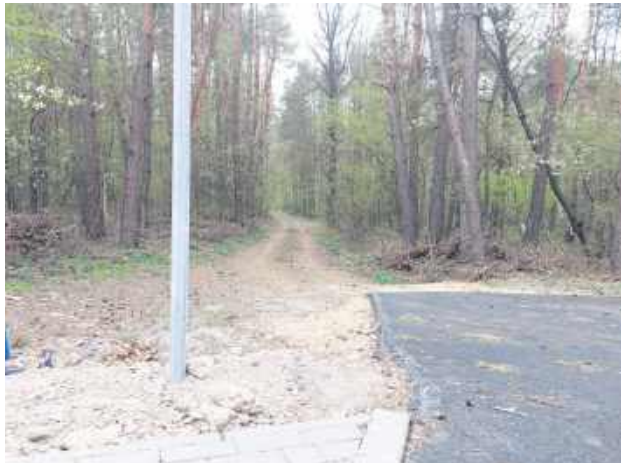
Jeden ze zjazdów w m. Deszkowice Drugie.