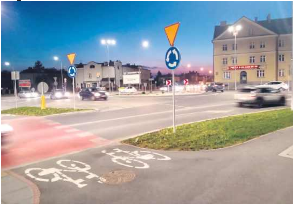
Skrzyżowanie ulic Piłsudskiego, Peowiaków i Sadowej w Zamościu.

Problemem pozostaje jednak sytuacja na osiedlach. „Brak miejsca na parkingach to już zmoza kierowców” – zauważa