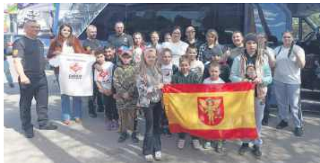
Wyjazd na tak prestiżową imprezę nie byłby możliwy bez wsparcia lokalnego samorządu. Gmina Werbkowice pokryła koszty transportu całej drużyny.

W Korzennej (powiat nowosądecki) zawodnicy z całego świata mierzyli się w wy-