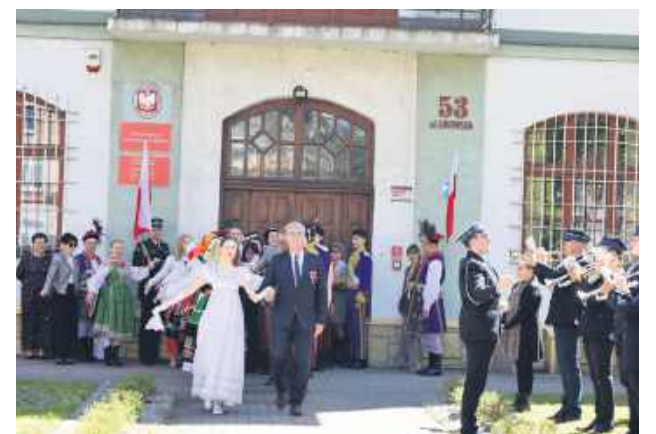
Poloneza czas zacząć.

W tegorocznych uroczystościach z okazji Dnia Flagi Narodowej i rocznicy uchwalenia Konstytucji 3 maja było wiele okazji do integracji mieszkańców oraz przypomnienia o historii Polski. Tomaszowianie 2 maja zatańczyli poloneza. W pierwszych parach