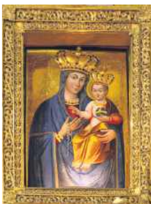
Obraz Matki Bożej Różańcowej w parafii w Lubyczy Królewskiej.

Przed nami wydarzenie, które od pięciu już lat przyciąga miłośników tradycyjnego śpiewu i klimatu majowych nabożeństw. W niedzielę 10 maja w Lubyczy Królewskiej odbędzie się Gminno-Parafialny Przegląd Pieśni Maryjnej i Matczynej. Zachęcamy do uczestnictwa.