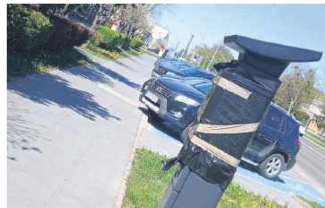
Parkomat pojawił się na tzw. alei bankowej przy ul. Piłsudskiego .

parking na ul. Piłsudskiego (od wjazdu na zielony ryneček do Apteki Zamojskiej ), część ul. Kiepury w sąsiedztwie ZUS oraz ul. Zamkowa .