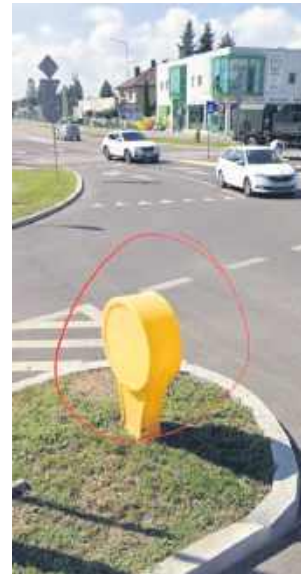
Zdaniem naszych Czytelników, takie elementy mogą ograniczać widoczność.

„Chodzi o studzienki na Sikorskiego czy Granicznej, czy w sumie na każdej ulicy, ale tu chyba najbardziej. Tak bardzo mnie ciekawi, czy jest jakiegokolwiek logiczne wytłumaczenie