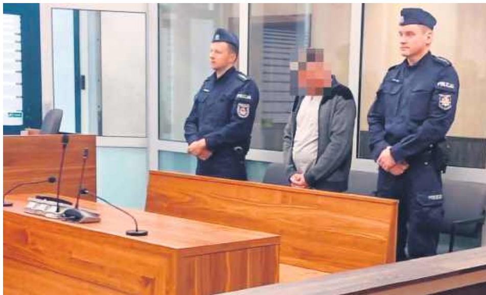
W pewnym momencie Bogusław P. wyciągnął nóż o 12-centymetrowym ostrzu i zniemacka zaatakował gospodarza.