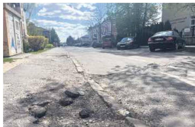
Zaplanowano między innymi kompleksową modernizację jezdni i zjazdów.