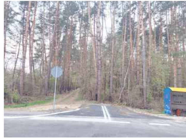
Zjazd wprost na drzewa. Jak tłumaczy ZDP, musiał być w tym miejscu.