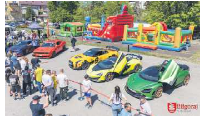
Biłgoraj zamienił się w arenę dla supersamochodów, których na co dzień nie zobaczymy na naszych drogach.

Największą sensację wywołała jednak motoryzacyjna niespodzianka, która przyciągnęła tłumy na plac przy Biłgorajskim Centrum Kultury. Biłgoraj zamienił się w arenę supersamochodów, których na co dzień nie zobaczymy na naszych drogach. Lamborghini, Ferrari, McLaren i inne techniczne arcydzieła stały się głównym punktem programu. Co najważniejsze, wydarzenie nie było tylko wystawą dla koneserów. Organizatorzy dali mieszkańcom unikatową szansę