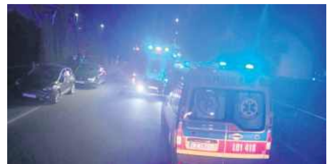
Sprawca zabójstwa najpierw zaatakował 61-latkę, a następnie wznicił pożar w budynku.

Do tragedii doszło 30 kwietnia w jednym z domów przy ulicy Partyzantów w Biłgoraju. Według wstępnych ustaleń śledczych, 42-latek miał najpierw zaatakować 61-letniego mężczyznę, a następnie wznicić pożar w budynku, prawdopodobnie w celu zatarcia śladów.