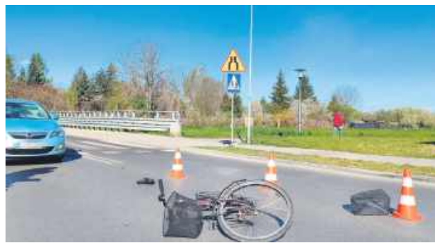
Potrącenie cyklistki na przejeździe dla rowerów.

– W okolicach skrzyżowania z ulicą Sienkiewicza nie ustąpił pierwszeństwa przejazdu i potrafił cyklistkę, która przejeżdżała przez jezdnię oznakowanym przejazdem dla rowerów – podaje podkomisarz Dorota Kru-