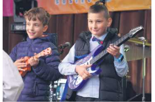
Swoj talent mieli okazję zaprezentować także uczniowie.