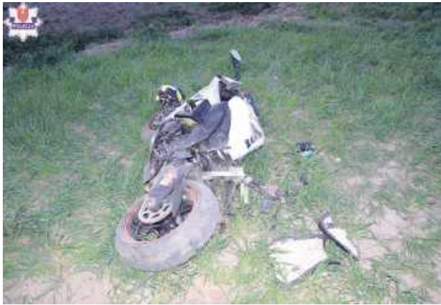
W Bodaczu motocyklista stracił panowanie nad pojazdem, zjechał na pobocze i uderzył w pień drzewa.

– Ze wstępnych ustaleń policjantów zamojskiego ruchu drogowego wynika, że 35-latek, poruszając się motocyklem marki