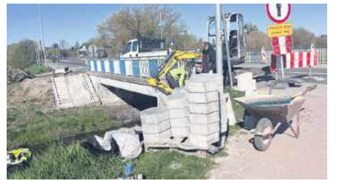
Most przy ul. Okrzei.