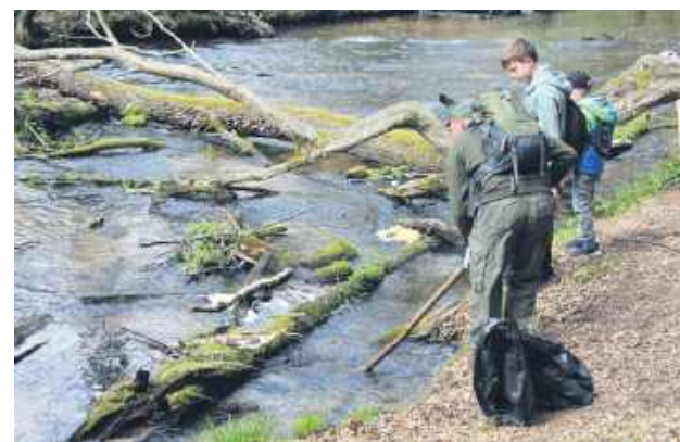
Piękne Szumy dzięki pływakom są czyste. Oby tylko turyści to uszanowali.

Do akcji tradycyjnie włączyli się również uczniowie i nauczyciele liccum z Łaszcz-