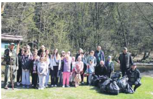
Klub Pływacki TSS Tomasovia po raz kolejny wziął udział w akcji „Czysta Rzeka”.