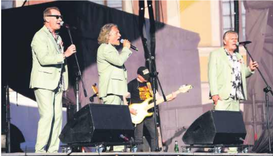
Koncert zespołu VOX.

3 maja – poza uroczystą sesją Rady Miasta Zamość i uroczysto-