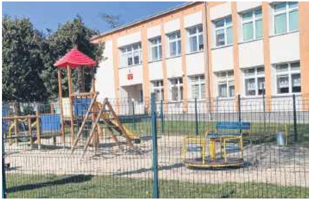
Szkoła Podstawowa nr 8 na os. Karolówka. To tutaj mają trafić przedszkolaki na czas budowy nowej placówki.

O ich obawach pisaliśmy już wcześniej. Przypomnijmy, że głównym argumentem jest groźba wprowadzenia nauki na dwie zmiany. – Szkoła nie jest z gumy, my się tutaj nie rozciągniemy ani