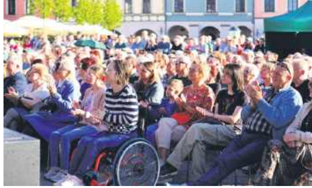
Publiczność na koncercie dopisała.