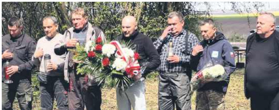
Pamięć i modlitwa należą się pomordowanym.

W sobotę 25 kwietnia, dzięki uzyskaniu zgody na czasowe otwarcie przejścia gra-