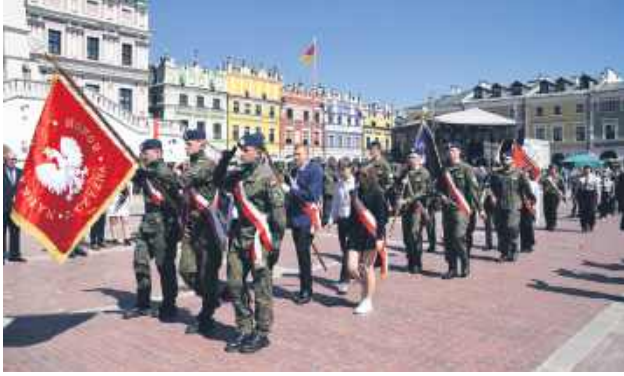
Uroczystości patriotyczne na Rynku Wielkim.