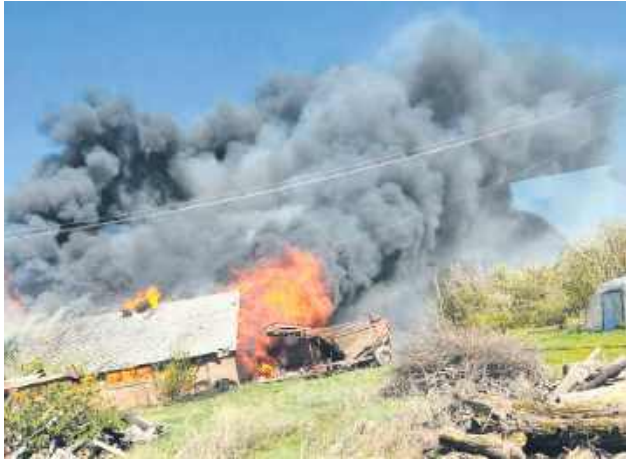
W kulminacyjnym momencie z ogniem walczyło aż 52 strażaków.

Ponad 6 godzin walki z ogniem, kilkunastu strażaków w gęstym, toksycznym dymie oraz 12 wozów bojowych w akcji. W poniedziałkowe popołudnie 27 kwietnia w Husynnem (gmina Hrubieszów) wybuchł pożar, który zagrażał okolicznym zabudowaniom inwentarskim.