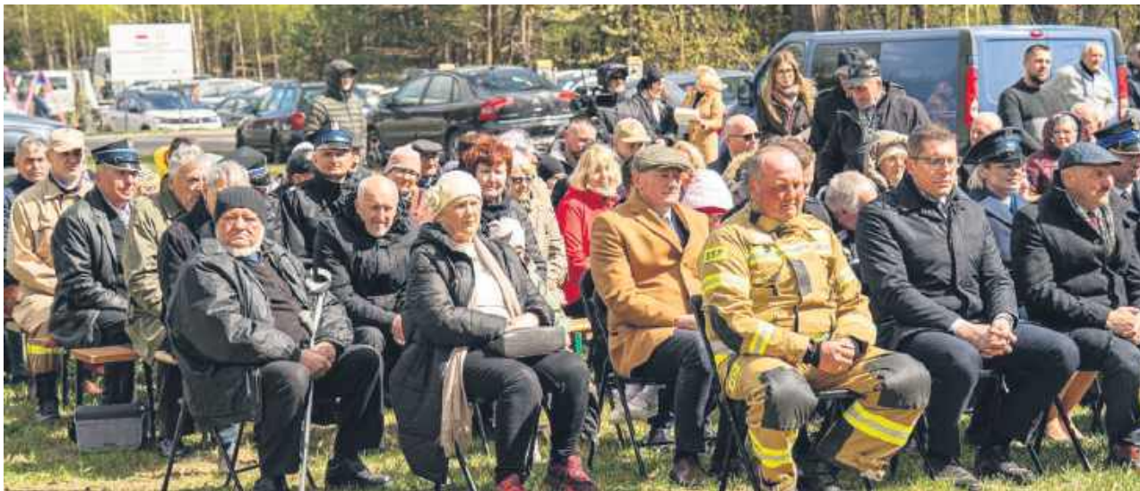
Zimno nie przestraszyło publiczności.