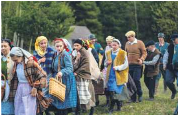
Wydarzenie miało wymiar edukacyjny i integracyjny. Przyciągnęło całe rodziny, młodzież i pasjonatów historii.