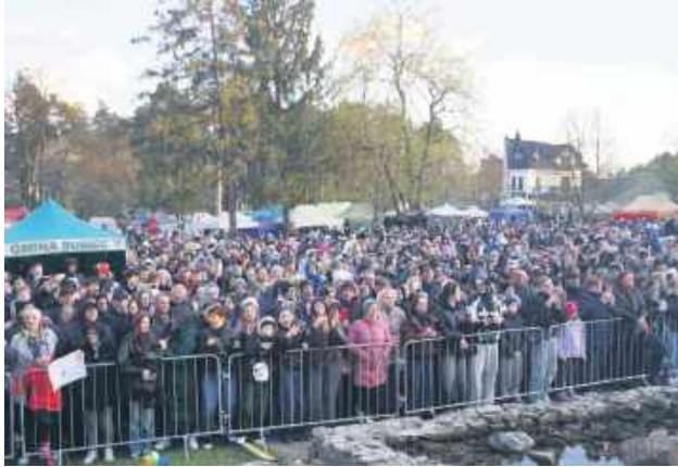
Na wieczorne koncerty przyjechało kilkaset osób.