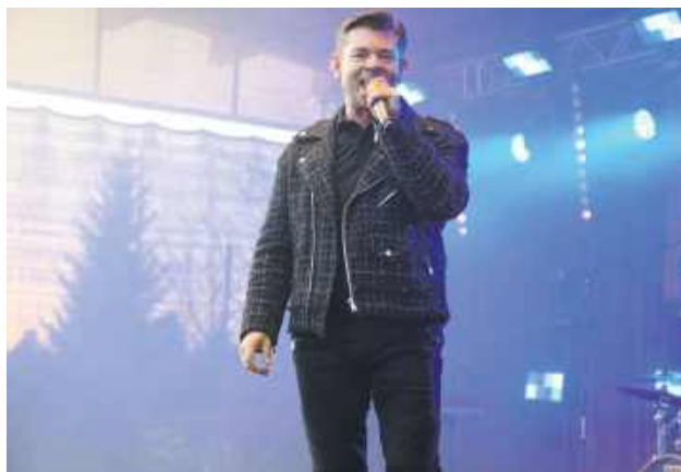
Gwiazdą tegorocznej edycji Jarmarku Susieckiego był Zenek Martyniuk.