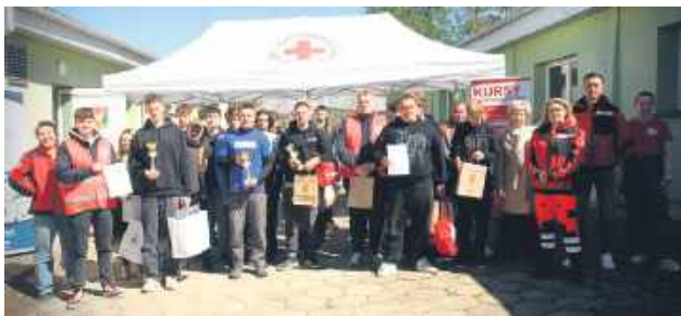
Zwycięska drużyna ze „Staszica” pojeździe na eliminacje okręgowe, które odbędą się 23 maja w Lublinie.

W minioną niedzielę, 27 kwietnia, teren Zespołu Szkół nr 1 w Hrubieszowie zamienił się w poligon ratowniczy. Rywalizacja była niezwykle zacięta, a zwycięzca mógł być tylko jeden – na okręgowe eliminacje do Lublina pojadą uczniowie z I LO im. ks. Stanisława Staszica.