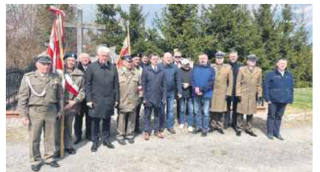
Uroczystości odbyły się 26 kwietnia.