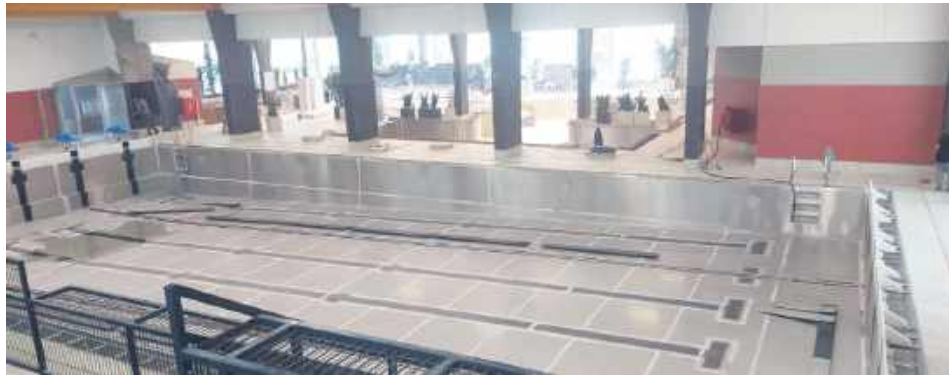
15 kwietnia, podczas testowego napełniania basenu wodą, na filarze pojawiły się pęknięcia, a na innych – zarysowania. Naprawa potrwa kilka miesięcy, w związku z czym otwarcie pływalni, wstępnie zaplanowane na 1 czerwca, zostanie odroczone.

Feralny test wody przeprowadzono 15 kwietnia. To miał być rutynowy sprawdzian szczelności nowej, stalowej niecki. Jednak pod ciężarem mas wody konstrukcja, która od 1988 r. służyła mieszkańcom, poddała się w najmniej oczekiwanym momencie. Jeden z 21 słupów