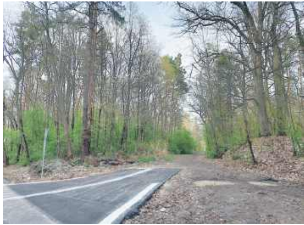
Zjazd z drogi powiatowej w Michalowie. Bardziej służy teraz jako utwardzony parking.