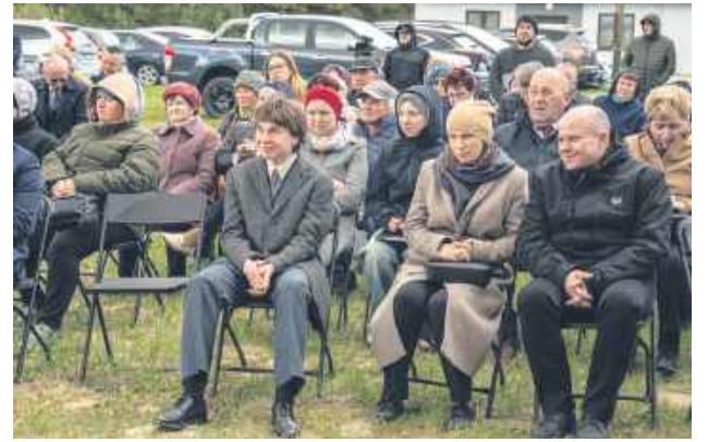
Dla wszystkich rekonstrukcja była niesamowitym przeżyciem.