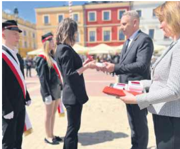
Przedstawiciele placówek oświatowych odebrali flagi.