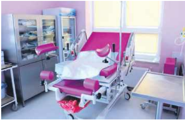
Sala porodowa w szpitalu w Hrubieszowie.

To nie są oceny urzędników ani ekspertów zza biurki. To wynik tysięcy ankiet wypełnionych w ramach akcji #GłosMatek. Fundacja Rodzić po Ludzku po raz kolejny wyłoniła placówki, w których standardy opieki okołoporodowej, szacunek i profesjonalizm nie