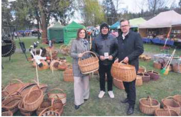
Jarmark to doskonała promocja dla ludowych twórców i rękodzielników.