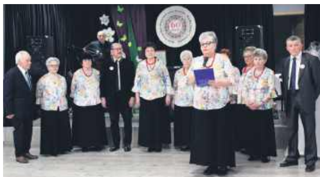
Nadal będziemy kultywować folklor rodzinny, nadal będziemy się spotykać, rozmawiać i wymieniać doświadczenia – podkreślają jubilatki z KGW Gołębie.