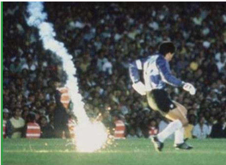
Petarda na Maracanie. Za chwilę bramkarz Chile Roberto Rojas padnie na murawę i przetnie sobie żyłką skórę na głowie!

W bardzo specyficznej atmosferze odbywały się igrzyska w Berlinie 16 lat później. W ćwierćfinale rewelacyjne Peru mierzyło