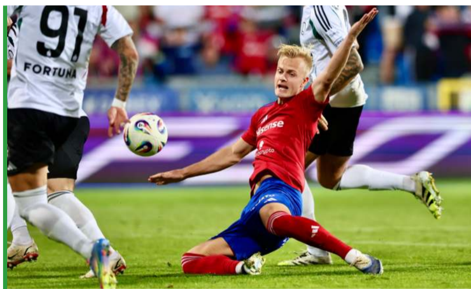
Jesienne starcie Rakowa z Legią zakończyło się remisem 1:1. Jak będzie tym razem?

W Rakowie bardzo kibicują temu, aby historia z zatrudnieniem trenera „stąd”, o Rakowskim DNA, zakończyła się pozytywnie, ale z drugiej strony dosko-