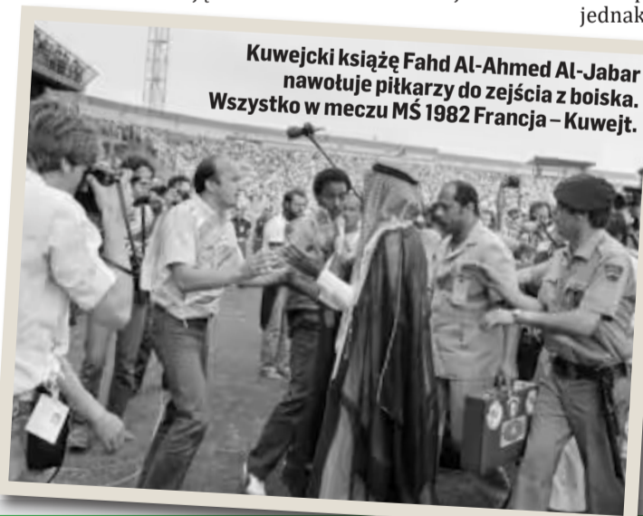
Kuwejcki książę Fahd Al-Ahmed Al-Jabar nawołuje piłkarzy do zejścia z boiska. Wszystko w meczu MŚ 1982 Francja - Kuwejt.