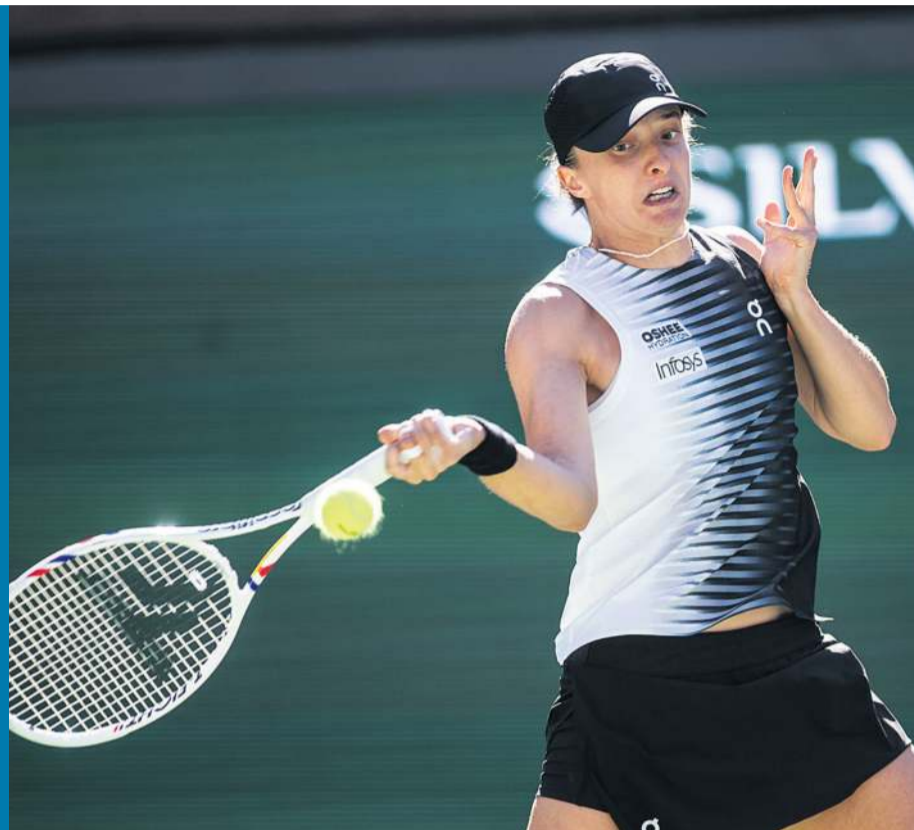
Nie tak ikona polskiego tenisa wyobrażała sobie początek roku.

W Melbourne odpadła w półfinale, a była o jedną piłkę od pierwszego w karierze finału Australian Open. W Dosze, także na półfinale, zatrzymała ją najbardziej dla niej niewygodna rywalka - Łożyska Jelena Ostapenko. W Dubaju w ćwierćfinale uległa Mirze Andriejewej. Rosjanka, która wiosną 2025 z przypupem wdarła