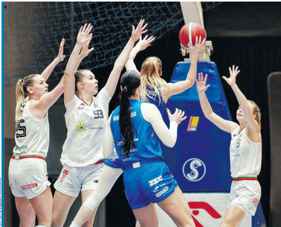
Zagłębie wkracza do play offu z serią meczów bez porażki.