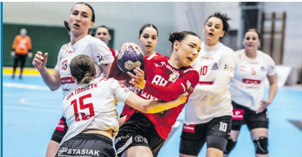
Demontaż siódemki z Kalisza pozwolił Gliwiczankom uniknąć bezpośredniego spadku do Ligi Centralnej.