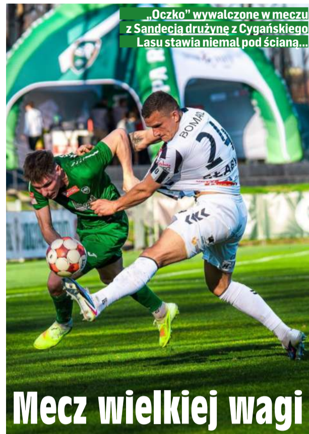
„Oczko” wywalczony w meczu z Sandecją drużyną z Cygańskiego Lasu stawia niemal pod ścianą...