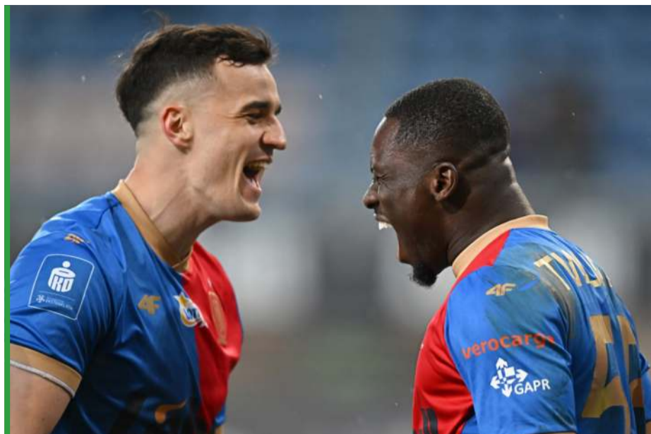
Piłkarze Piasta na myśl o trzech dniach wolnych, które dał im trener.