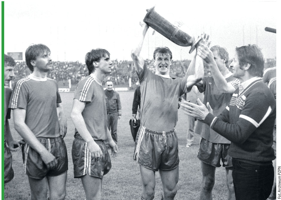
Po drodze do zwycięstwa w Pucharze Polski w 1985 roku Widzew pokonał w półfinale Górnika wynikiem 4:3 w dwumeczu.