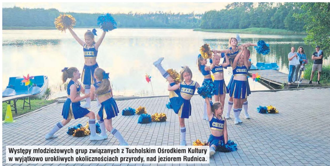
Występy młodzieżowych grup związanych z Tucholskim Ośrodkiem Kultury w wyjątkowo urokliwych okolicznościach przyrody, nad jeziorem Rudnica.