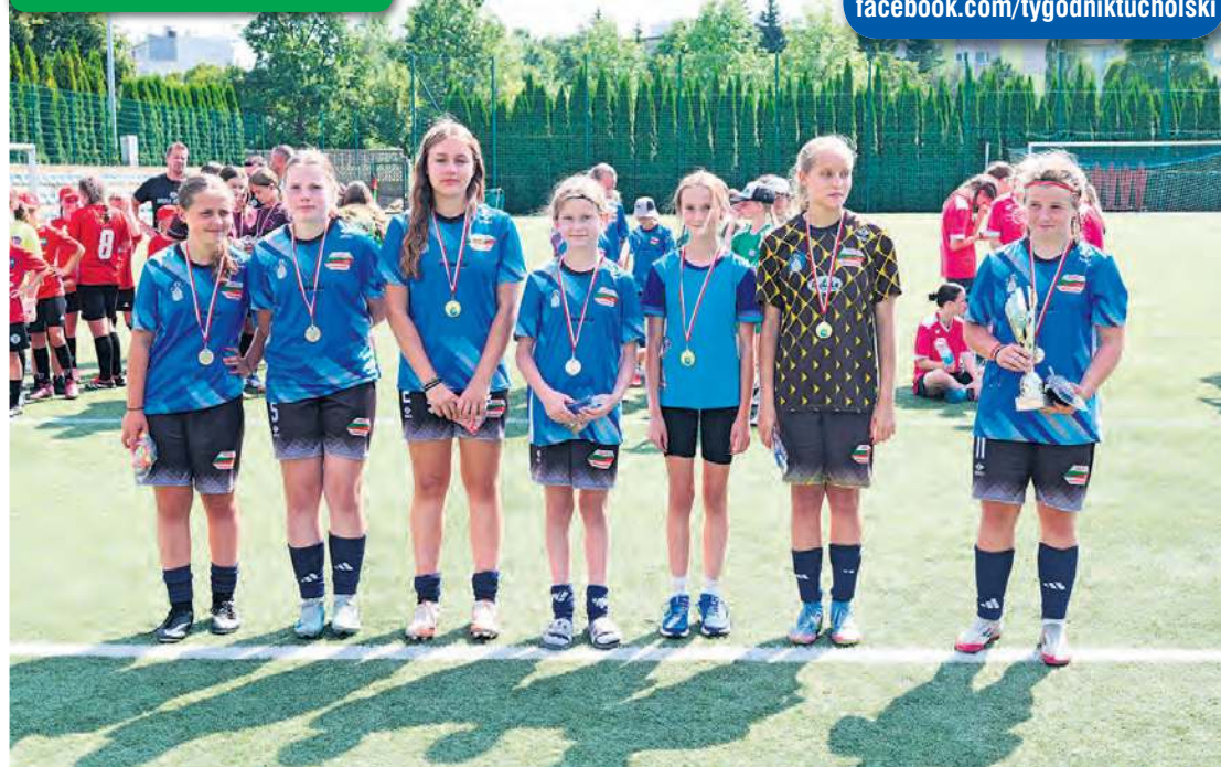
Drużyna Tucholanki wygrała starszą kategorię wiekową.

więcej zdjęć na tygodnik.pl filmy na facebook.com/tygodniktucholski