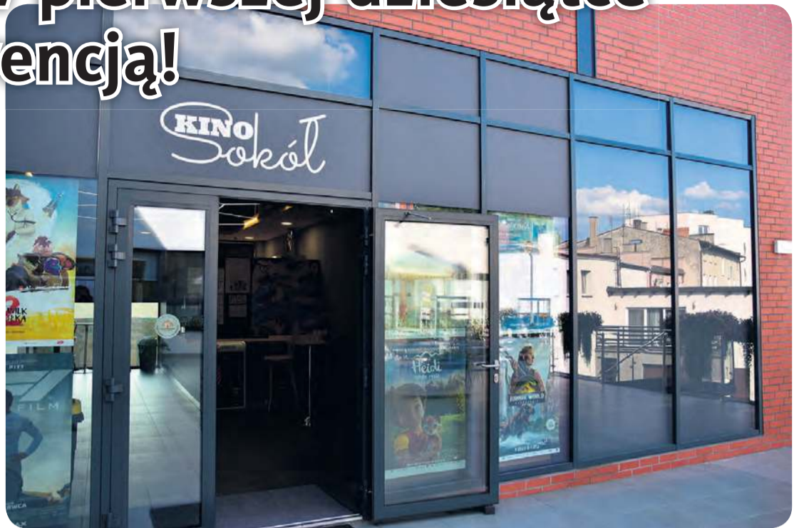
Kino Sokół w Tucholi mieści się na tyłach Tucholskiego Ośrodka Kultury, przy placu Zamkowym 8.

– Jestem bardzo szczęśliwy z wyniku osiągniętego przez nasze kino. Pracował na niego cały zespół, który kino obsługuje. Ludzie którzy go tworzą, między innymi