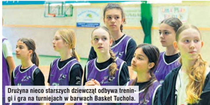
Drużyna nieco starszych dziewcząt odbywa treningi i gra na turniejach w barwach Basket Tuchola.

Trwa nabór do drużyny dziewcząt. Zapisywać można dzieci z klas I-III (roczniki: 2018, 2017, 2016). Treningi będą odbywały się w piątki w godzinach 17:15-18:30 – w hali tucholskiego Ośrodka Sportu i Rekreacji. Pierwsze zajęcia ruszą we wrześniu. Będą to ćwiczenia ogólnorozwojowe