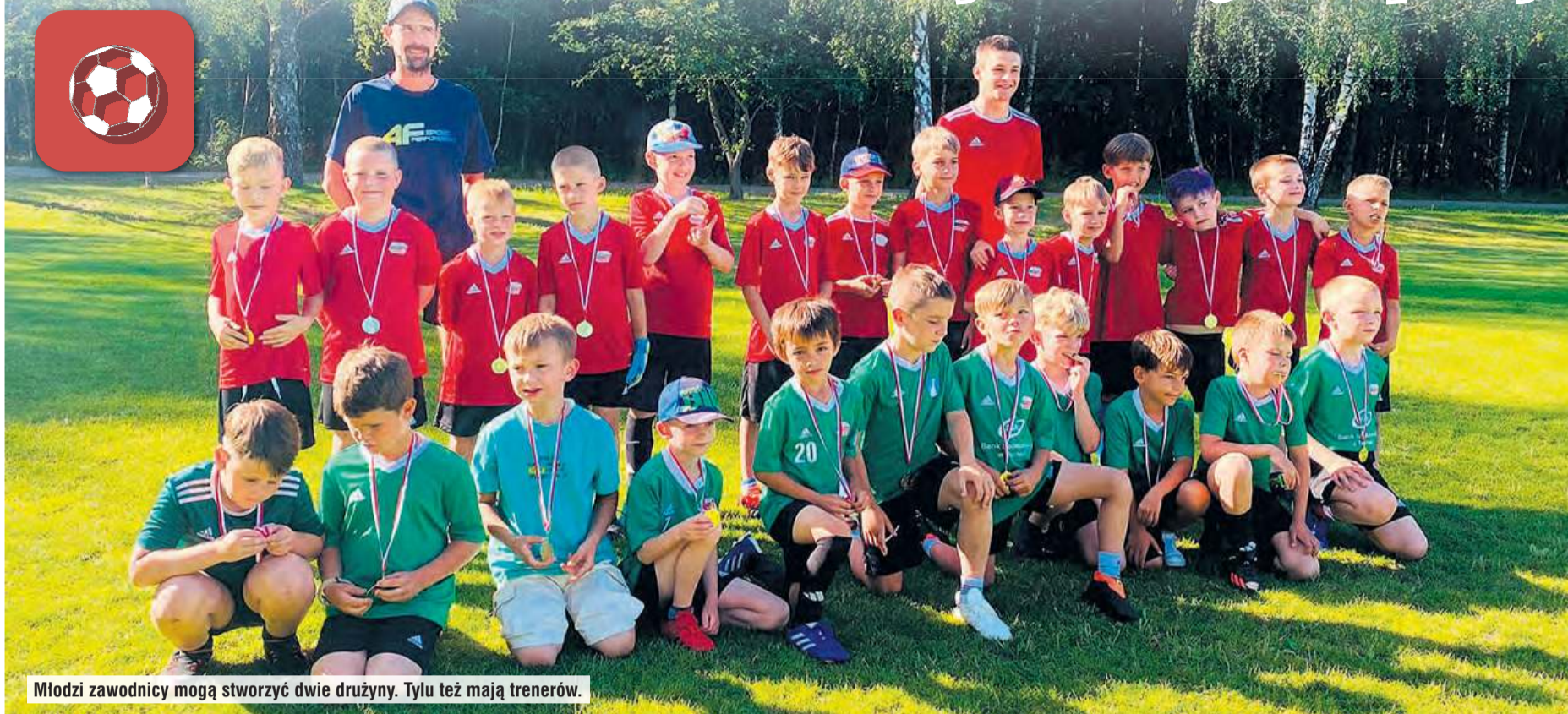
Młodzi zawodnicy mogą stworzyć dwie drużyny. Tytuł też mają trenerów.

Mali piłkarze potrafią zauroczyć i stworzyć warunki do tego, by ich gra wywoływała podziw. Chłopcy z rocznika 2017 dziarsko biorą się do grania w piłkę, czym dają satysfakcję i radość dorosłym – sztabowi oraz rodzicom. Drużyna zagrała w wielu turniejach, jest chętnie zapraszana do towarzyskiej rywalizacji.