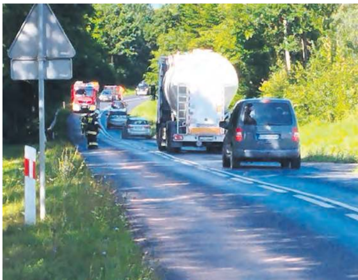
Sytuacja z pozoru drobna, ale powodująca duże niebezpieczeństwo na drodze. Strażacy z Tucholi i Łyskowa usuwali plamę oleju na długim odcinku drogi wojewódzkiej Tuchola – Gostycyn.

● 8 sierpnia (piątek) policja pocięła 73-latka z Tucholi, który przewrócił się jadąc jednoślądem marki Romet. Według mundurowych nie dostosował on prędkości do warunków na drodze i stracił panowanie nad pojazdem. ● 8 sierpnia, o godz. 3:30 w Małym Mędromierzu, kierujący fordem 32-latek z powiatu białogardzkiego zjechał z drogi i uszkodził ogrodzenia pobliskich posesji. Dostał mandat. ● W Tucholi tego samego dnia policjanci zatrzymali 27-latka z powiatu gryfickiego, który kierował samochodem pomimo orzeczonego przez sąd zakazu. Mężczyźnie za popełnione przestępstwo grozi do 5 lat pozbawienia wolności. Sprawa będzie miał swój finał w sądzie. ● 9 sierpnia (sobota) policjanci z drogówki zatrzymali 44-latka, który kierował rowelem pod wpływem alkoholu. Urządzenie pomiarowe wskazało, że w jego organizmie znajduje się blisko 0,5 promila. Mężczyźnie grozi grzywna