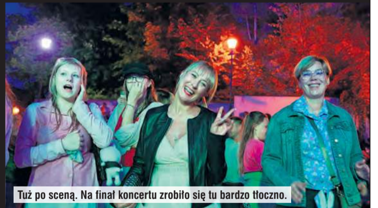
Tuż po sceną. Na finał koncertu zrobiło się tu bardzo tłoczno.

wać, że go nie wymyślił, bo... koncert przeszedł najśmielsze oczekiwania! Zarówno on jako organizator, jak i zespół Skazani na Dżem, a także sama publiczność, mogli być wyłącznie zachwyceni.