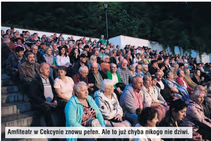
Amfiteatr w Cekcynie znowu pełen. Ale to już chyba nikogo nie dziwi.