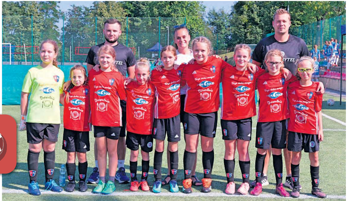
Zwycięzynie młodszej kategorii, które zaskoczyły wszystkich poziomem sportowym. Brda Ryteł skradła show na tucholskim turnieju.

Na boiskach zobaczyliśmy aż cztery różne składy Tucholanki, w tym specjalnie stworzoną ekipę Tucholanki/Kęsowo. Znalazły się w niej