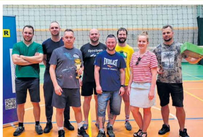
Letnia siatkówka na parkiecie jest lubiana i sprawdza się od kilku dobrych lat.