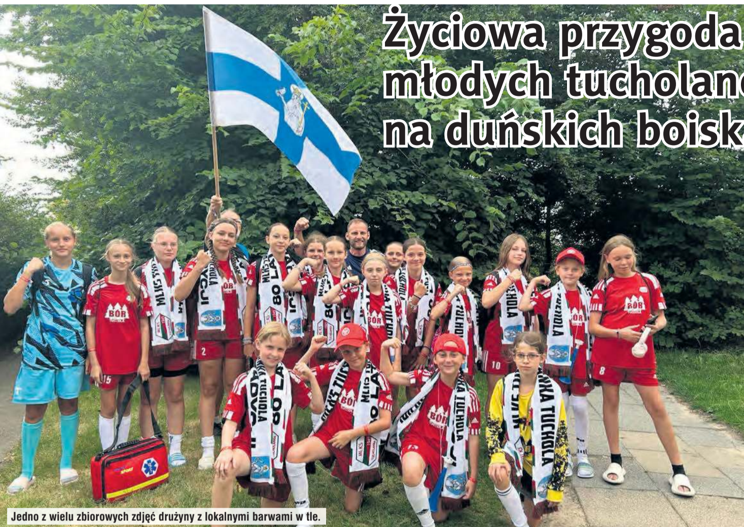
Jedno z wielu zbiorowych zdjęć drużyny z lokalnymi barwami w tle.

Rzadko zdarza się szansa, by uczestniczyć w jednym z największych turniejów młodzieżowych na świecie. Tucholanki taką szansę otrzymały i ją wykorzystały, w Danii zdobywając nie tylko nowe, sportowe doświadczenie, ale przeżywając też przygodę życia. Dziewczeta wystąpiły w finałach turnieju na boiskach Dana Cup 2025.