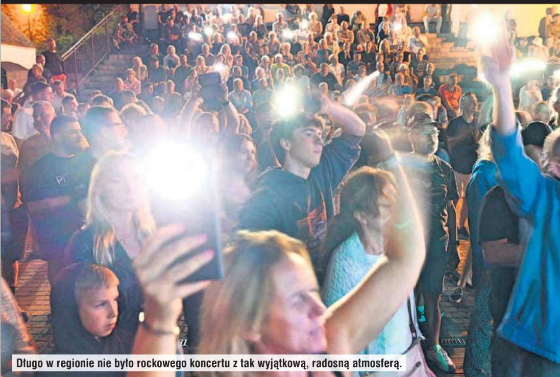
Długo w regionie nie było rockowego koncertu z tak wyjątkową, radosną atmosferą.

go wieczoru i powrót do tanecznego, radosnego charakteru Kotła. Wśród grup, które zapewnią pozytywne emocje będzie Majestic z Gdańska, bywający w Cekcynie regularnie i przyjmowany w Borach Tucholskich bardzo ciepło. Teraz można mieć tylko nadzieję, że w regularnym Kotle powtórzy się frekwencja z soboty i Skazanych na Dżem. Wakacje zamknie z kolei dwudniowy, Festiwal Moc Kwiatów w terminie 29-31 sierpnia.