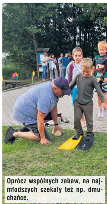
Oprócz wspólnych zabaw, na najmłodszych czekały też np. dmuchańce.

(pp)