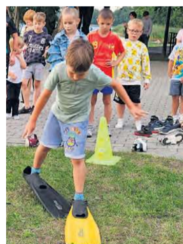
Popołudnie przeznaczono dla najmłodszych uczestników imprezy.