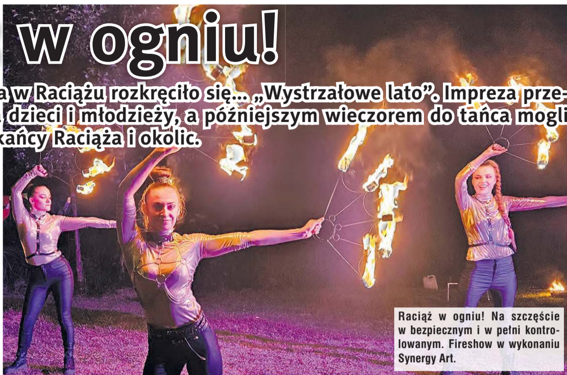
Raciąż w ogniu! Na szczęście w bezpiecznym i w pełni kontrolowanym. Fireshow w wykonaniu Synergy Art.

Tym razem wszystko się udało! Pierwsze podejście do „Wystrzałowego lata” było bowiem zaplanowane już na 12 lipca. Jednak jak wyglądała pogoda w lipcu, nie musimy specjalnie