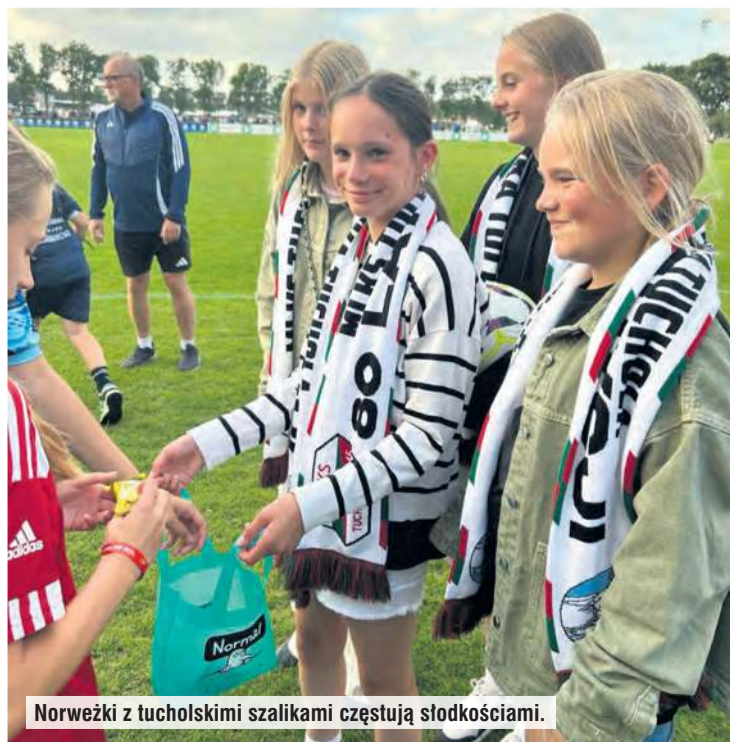
Norweżki z tucholskimi szalikami częstują słodkościami.

zastanawialiśmy. Skonsultowaliśmy wszystko z rodzicami i decyzja została podjęta: jedziemy.