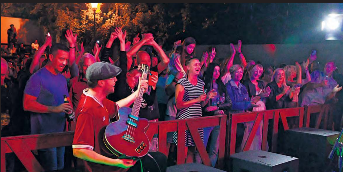
Skazani na Dżem bawili się dosłownie tak samo dobrze, jak liczna publiczność, która przybyła na koncert z całego regionu.

W sobotę (9 sierpnia) w amfiteatrze zabrzmiały kawałki legendarnej grupy Dżem. Do Cekcyna zjechali więc fani ciekawi, jak młodzi ludzie z Katowic – czyli regionu, z którego pochodzi Dżem – radzą sobie z repertuarem jednego z najważniejszych zespołów współczesnej historii polskiej