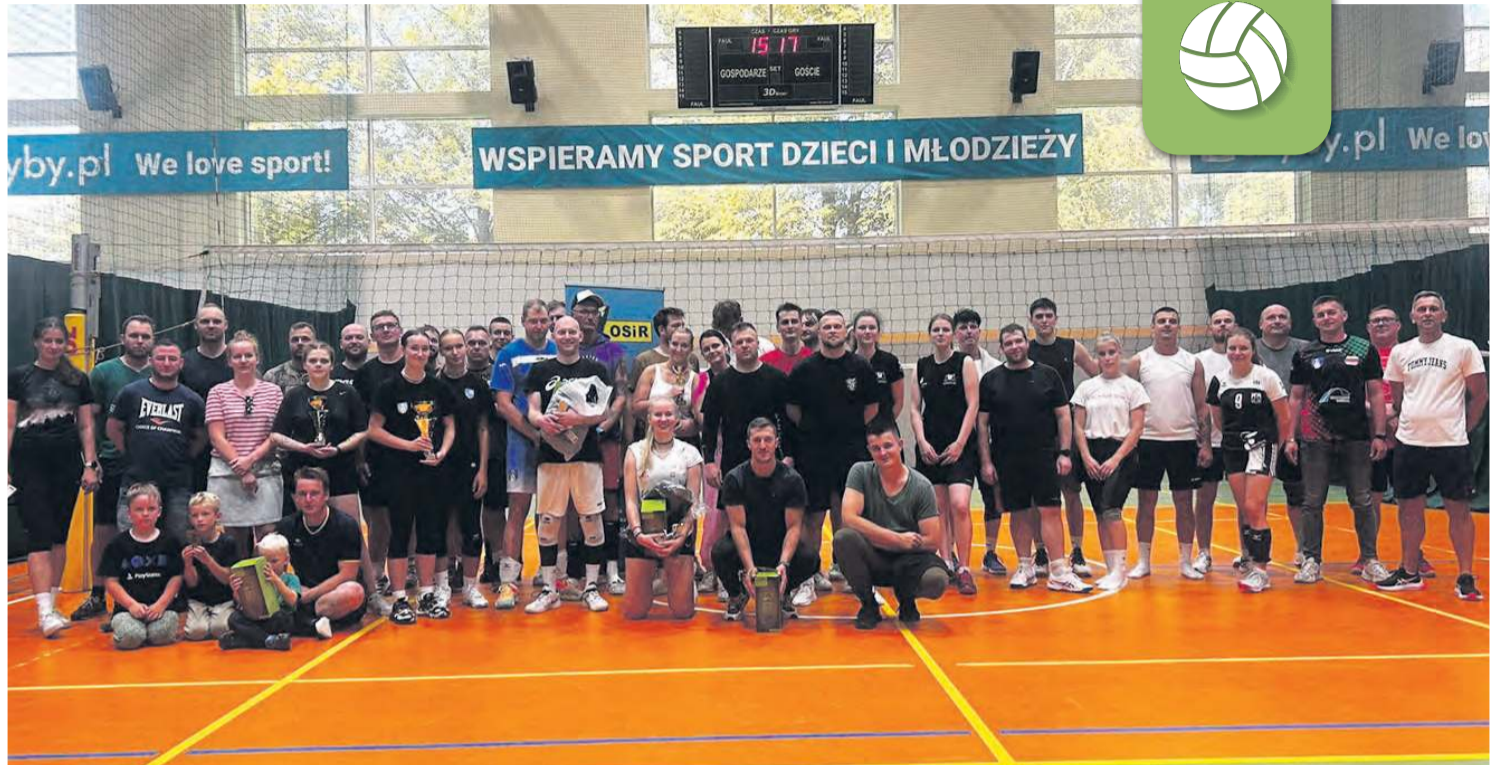
Wszyscy świetnie się zabawili i obiecali jak zwykle spotkanie za rok.

Sam Turniej Siatkarski Drużyn Mieszanych o Puchar 66. Dni Borów Tucholskich był rywalizacją drużyn, które poznały się już właśnie podczas spływu, a teraz stanęły po przeciwnych stronach siatki. Do Tucholi, wzorem poprzednich lat, zjechały się siatkarskie zespoły z okolic i bardziej odległych miejsc, w tym z Gdańska i jak co roku niezawodny team szczeciński.