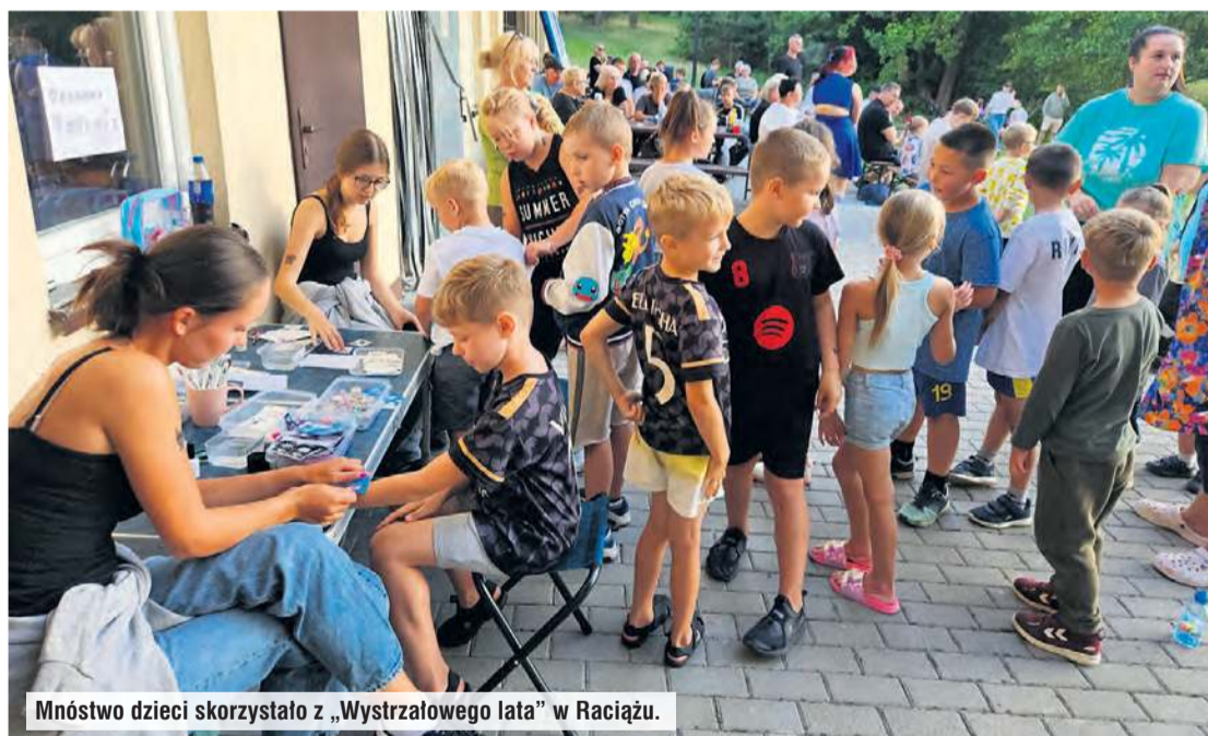
Mnóstwo dzieci skorzystało z „Wystrzałowego lata” w Raciążu.

przypominać... 1 sierpnia spragnieni imprezowania mieszkańcy mogli się zabawić.