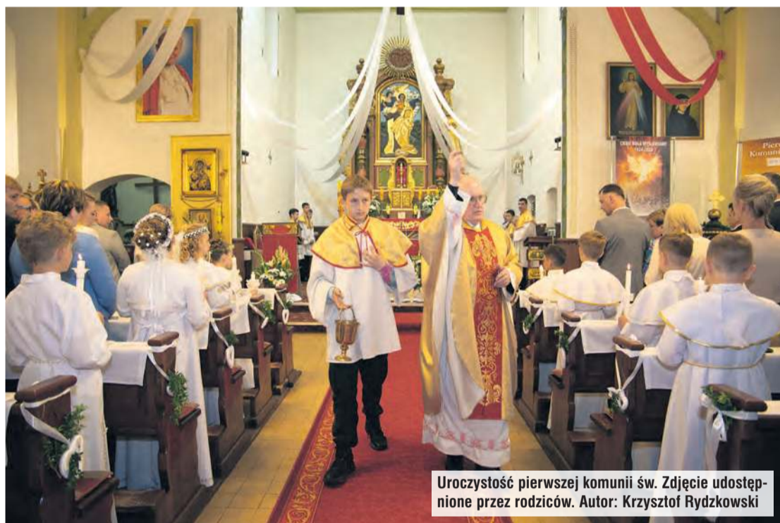
Uroczystość pierwszej komunii św. Zdjęcie udostępnione przez rodziców. Autor: Krzysztof Rydzkowski