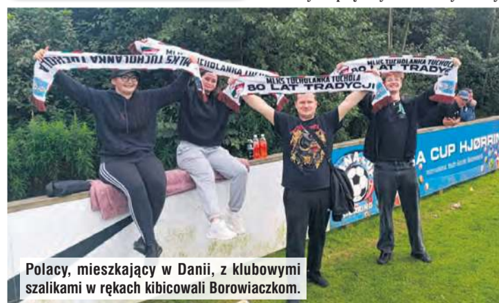
Polacy, mieszkający w Danii, z klubowymi szalikami w rękach kibicowali Borowiackom.