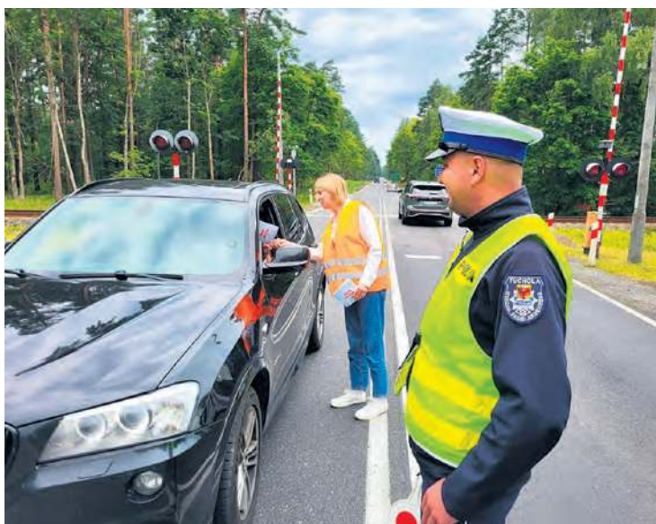
Wspólne patrole policji i przedstawicieli Polskich Kolei Państwowych mają na celu edukowanie kierowców, jak należy zachować się w pobliżu przejazdu kolejowego.

W piątek (8.08) kierowcy podróżujący trasą Tuchola – Świecie, w okolicach przejazdu kolejowego w Błędziniu, mogli natknąć się na policyjny patrol. Miejscowi funkcjonariusze, wspólnie z przedstawicielami Polskich Kolei Państwowych, prowadzili działania w ramach ogólnopolskiej akcji profilaktyczno-edukacyjnej „Bezpieczny przejazd – Szlaban na ryzyko!”.