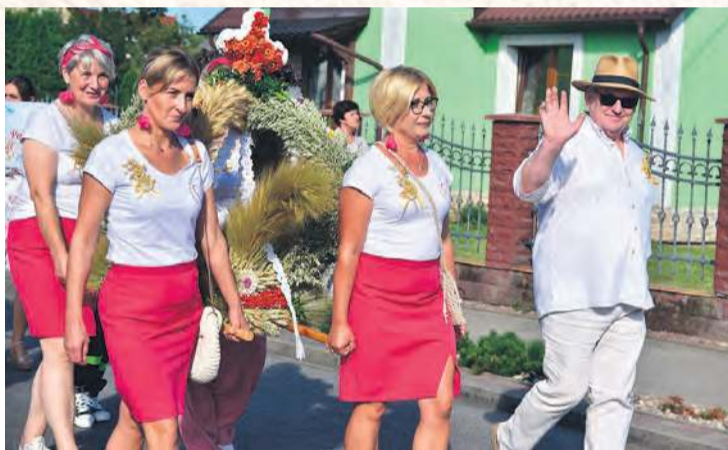
Jedną z czołowych konkurencji jest ta na najładniejszy wieniec dożynkowy. Na zdjęciu wykonanym podczas zeszłorocznych dożynek ze swoim wieniecem reprezentacja sołectwa Żalno.

W konkursie na najładniejsze stoisko wystawiennicze będą mogły rywalizować wszystkie podmioty prezentujące swoje wyroby w trakcie dożynek.