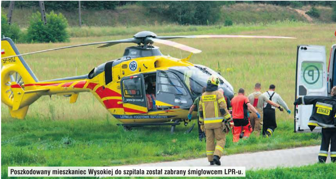
Poszkodowany mieszkaniec Wysokiej do szpitala został zabrany śmigłowcem LPR-u.

Żadnego upadku z wysokości nie można bagatelizować. Zespół Ratownictwa Medycznego i śmigłowiec Lotniczego Pogotowia Ratunkowego musiał być wezwany do osoby, która spadła z rusztowania.