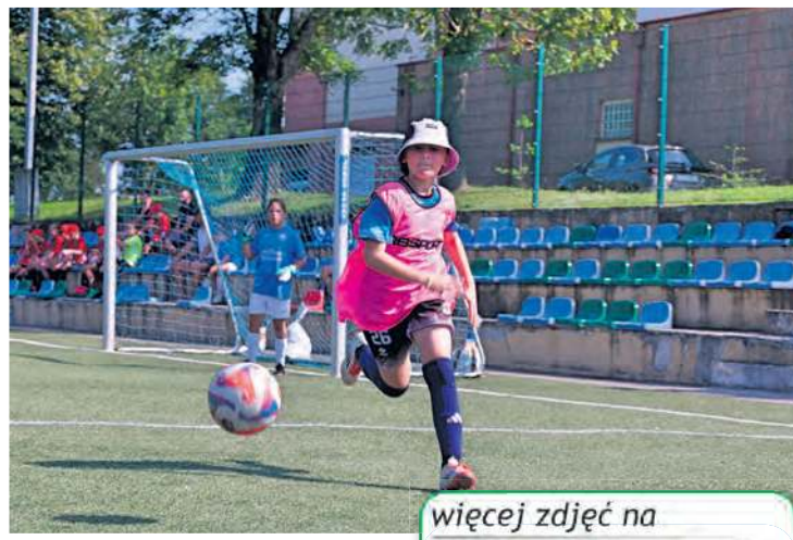
Na walkę młodziutkich piłkarek patrzyło się z przyjemnością. Tutaj pojedynkę drużyn z Tucholi i Grodziska Wlkp.

więcej zdjęć na tygodnik.pl filmy na facebook.com/tygodniktucholski