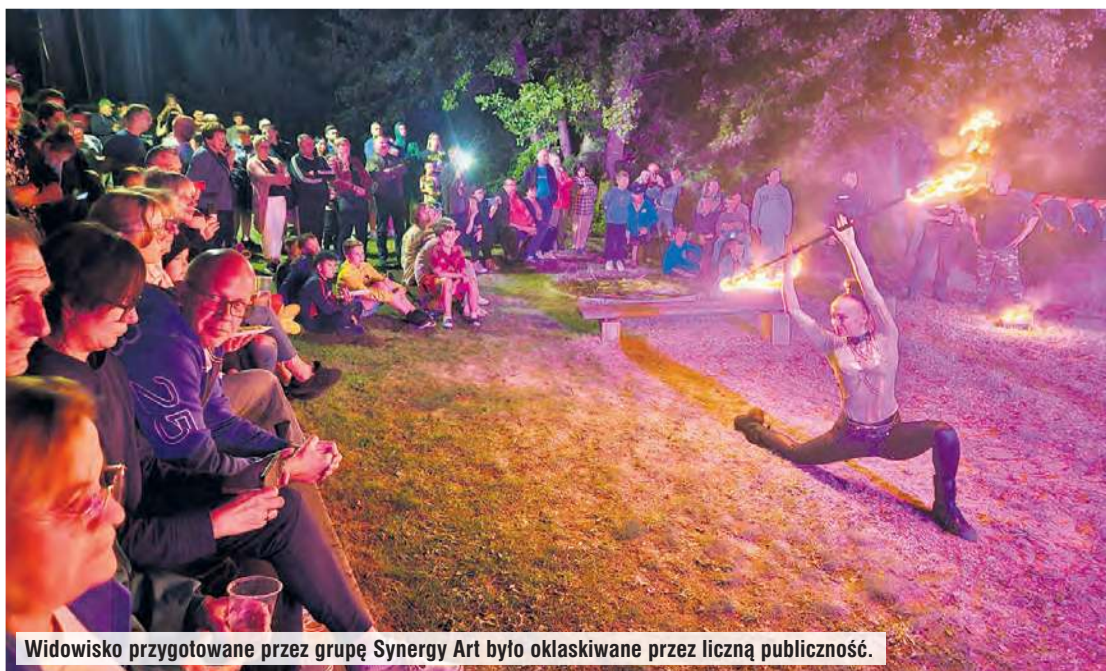
Widowisko przygotowane przez grupę Synergy Art było oklaskiwane przez liczną publiczność.