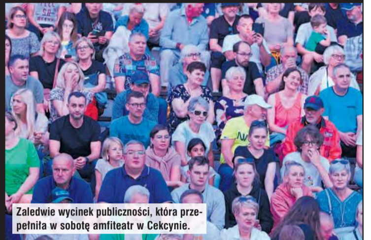
Zaledwie wycinek publiczności, która przepełniła w sobotę amfiteatr w Cekcynie.

cić zapowiedziom. W kolejne aż czterech zespołów jedne-