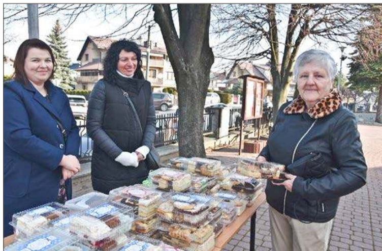
Przedstawicielki Rady Rodziców zachęcały do zakupu pysznych ciast.