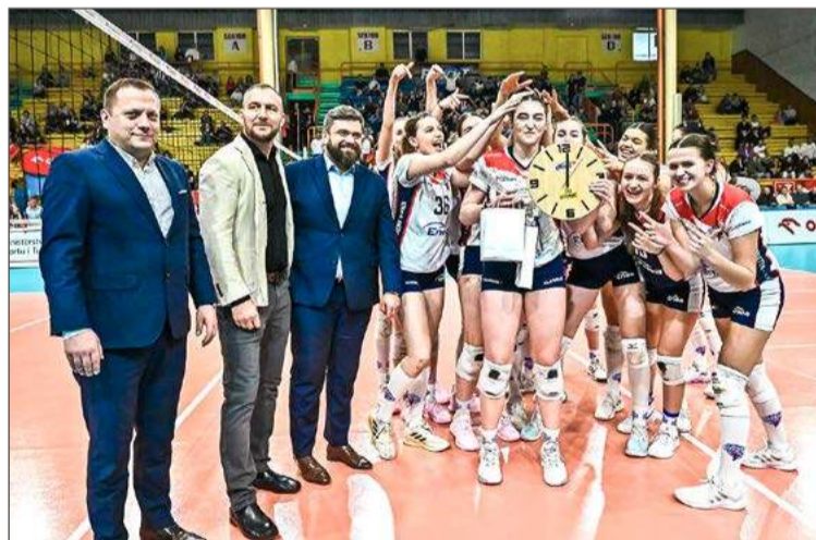
Drużyna z Poznania straciła w Dębicy tylko jednego seta.