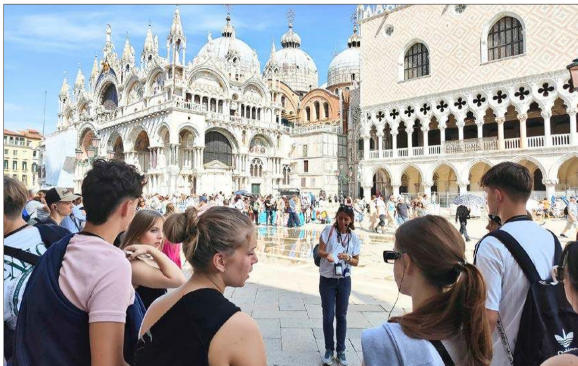
W zeszłym roku młodzież z Kwiatka zwiedzała m.in. Wenecję. W tym polecą jeszcze dalej.