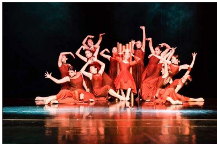
W sobotę na festiwalu wystąpią trzy grupy ze Szkoły Tańca Fame.

W weekend 15 i 16 marca w DK Mors odbywać się będzie XII Festiwal Tańca Złoty Gryf.