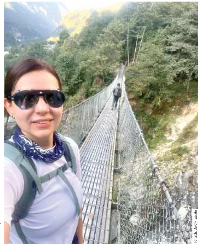
Pierwszy dzień trekkingu, pierwszy wiszący most na trasie