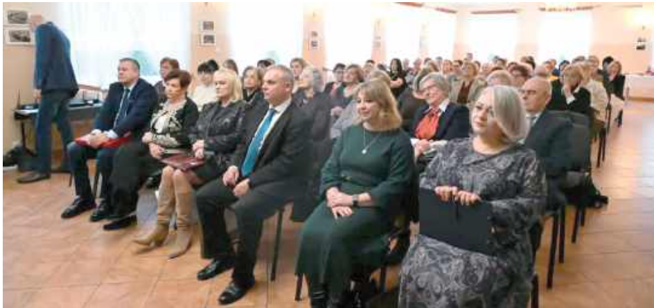
W Świątlicy Wiejskiej w Białej koło Radzyna Podlaskiego odbyła się uroczystość jubileuszowa z okazji 120-lecia Związku Nauczycielstwa Polskiego oraz 100-lecia powstania Oddziału ZNP w Radzynie Podlaskim. Wydarzenie zgromadziło liczne grono przedstawicieli środowiska oświatowego oraz zaproszonych gości

W Świątlicy Wiejskiej w Białej koło Radzyna Podlaskiego odbyła się uroczystość jubileuszowa z okazji 120-lecia Związku Nauczycielstwa Polskiego oraz 100-lecia powstania Oddziału ZNP w Radzynie Podlaskim. Wydarzenie zgromadziło liczne grono przedstawicieli środowiska oświatowego oraz zaproszonych gości.