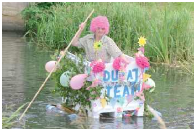
Spływ na byle czym, Święto sportu

Zaczął się od gali sportów walki, potem były nocna siatkówka, piłka nożna dla dzieciaków i starszawych dzieciaków, wygibasy, rowerowa włóczega, radosne taplanie się w spiętrzonych specjalnie na tę okazję Białce i kilka innych atrakcji. Radzyń pokazał, że sportem stoi i jeszcze ma ochotę na więcej. Cykl czternastu (o ile coś nam nie umknęło...) wydarzeń zaplanowanych od piątku do niedzieli, zorganizowanych przez Miejski Ośrodek Sportu i Rekreacji we współpracy z licznymi klubami, stowarzyszeniami i środowiskami udał się nadzwyczajnie, mimo że kilka razy pogoda wytrzymywała z pewnym trudem.