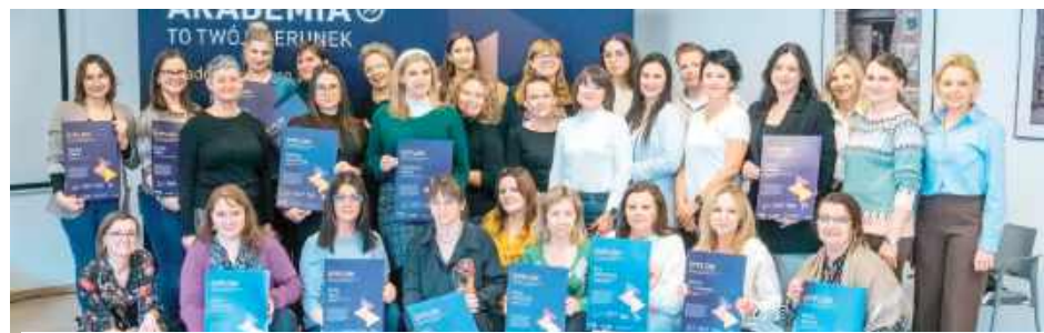
Już w marcu 2026 roku radzyńska biblioteka będzie gościła pięciogodzinne szkolenie „Cyfrowy szum i koncentracja: narzędzia dla edukatorów do zarządzania uwagą własną i uczestników zajęć”, które ma wspierać lokalnych bibliotekarzy w pracy z czytelnikami i uczestnikami zajęć

Już w marcu 2026 roku radzyńska biblioteka będzie gościła pięciogodzinne