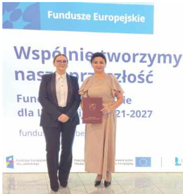
Umowa została podpisana w ubiegłym tygodniu

Rozbudowa Punktu Selektywnej Zbiórki Odpadów Komunalnych ma na celu usprawnienie systemu selektywnej zbiórki odpadów oraz poprawę warunków obsługi mieszkańców. Inwestycja wpisuje się w działania samorządu związane z ochroną środowiska oraz dostosowywaniem gminnej infrastruktury do obowiązujących standardów w zakresie gospodarki odpadami.