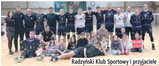
Radzyński Klub Sportowy i przyjaciele

Zima to czas, kiedy emocji dostarczają siatkarze. Oprócz corocznej ligi Miejskiego Ośrodka Sportu i Rekreacji (wygrał BestKomp przed Międzyrzec itd.) mogliśmy kibicować w III lidze Radzyńskiemu Klubowi Sportowemu. Debiutant zakończył rozgrywki na szóstym miejscu. Ale atmosferę na trybunach miał najlepszą w lidze.