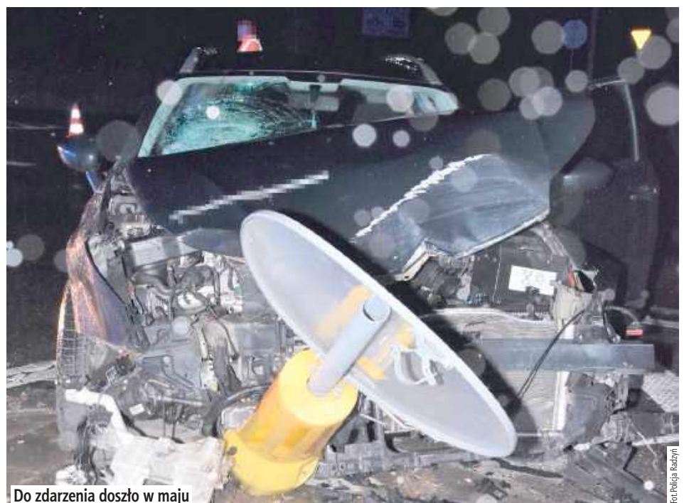
Do zdarzenia doszło w maju