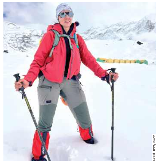
W trakcie wędrówki. W tle Base Camp pod Island Peakiem