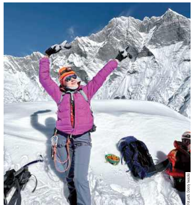
Na szczycie Island Peak. Mieści się on na wysokości 6 189 m n.p.m.