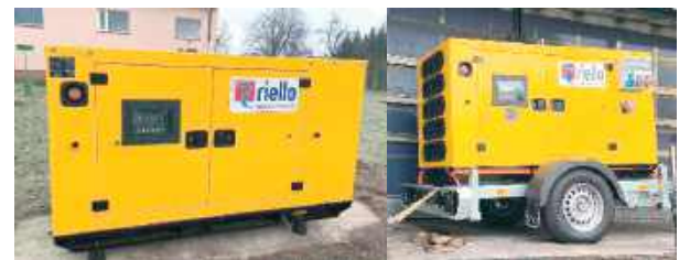
Zakupione agregaty prądotwórcze

Zakup nowego wyposażenia ma kluczowe znaczenie dla sprawnego reagowania na zagrożenia, takie jak klęski żywiołowe, awarie czy inne sytuacje nadzwyczajne. Nowy sprzęt pozwala służbom działać