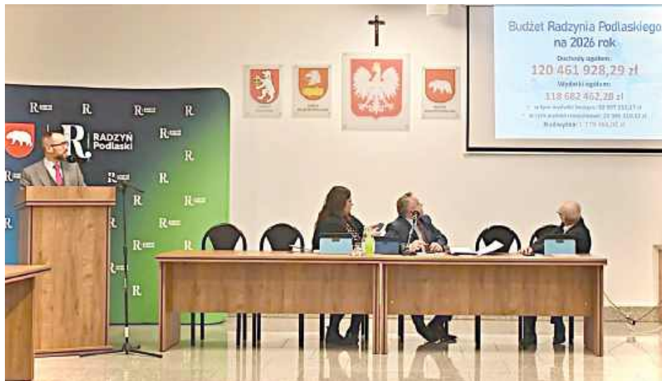
Radni przyjęli budżet jednogłośnie. W swoich założeniach ma on aż 26 mln zł na inwestycje, w tym remont słynnej Oranżerii

Podczas XXXI sesji Rady Miasta Radzyna Podlaski radni jednoznacznie przyjęli budżet miasta na 2026 rok. Jak podkreślają władze, dokument łączy stabilność finansową z ambitnym planem inwestycyjnym, a jego konstrukcja opiera się zarówno na kontynuacji rozpoczętych projektów, jak i nowych zadaniach odpowiadających na potrzeby mieszkańców.