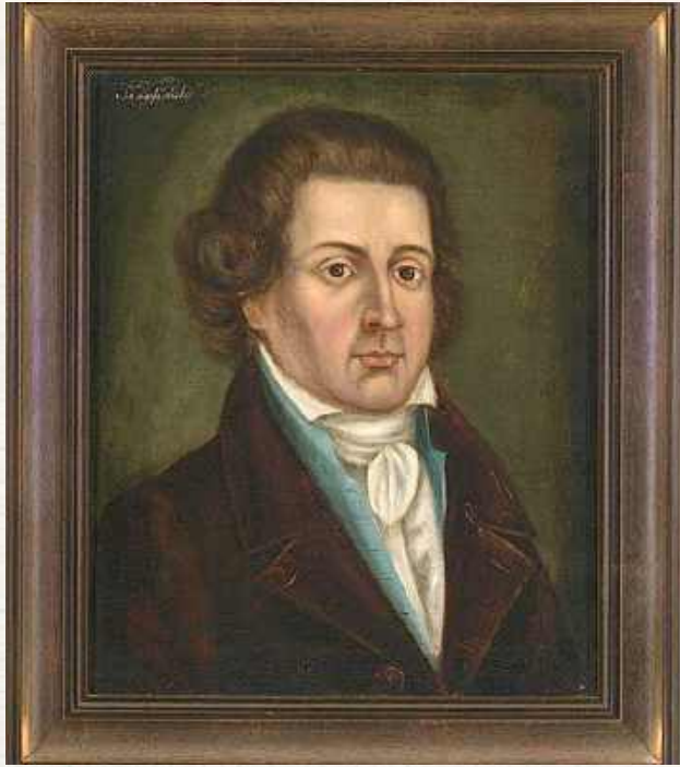
Portret Smuglewicza z początków XIX stulecia. Pod koniec życia wycofał się z życia dworskiego i artystycznego, osiadając w dworku na Białorusi, argumentując to (podobnie jak Książka...) żalem za utraconą Ojczyznę. Zmarł w 1825 roku

Pierwszy raz „Pieśń o Narodzeniu Pańskim”, znaną szerzej - tak szeroko, jak tylko się da... - jako „Bóg się rodzi”, wykonano w Białymstoku w kościele farnym w 1792 roku, wydano ją (razem z innymi „Pieśniami nabożnymi”) w niedalekim Supraślu. Autor, Franciszek Karpiński (1741-1825), był jednak przez długie lata związany z rodziną Czartoryskich i częstym gościem w Puławach.