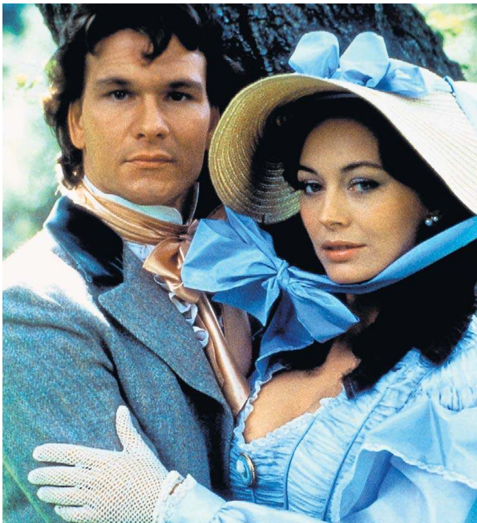
Nie bez znaczenia dla popularności produkcji był fakt, że zaproszono do niej także prawdziwe gwiazdy ekranu, takie jak choćby Patrick Swayze i Lesley-Anne Down.

Zresztą praca na planie najwyraźniej sprzyjała gorącej atmosferze – podczas kręcenia serialu „Północ-Południe” narodziły się aż cztery małżeństwa.