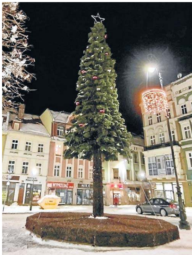
Wielka sosna - w tym przypadku już choinka - na placu Magistrackim jest centralnym punktem miejskich dekoracji.