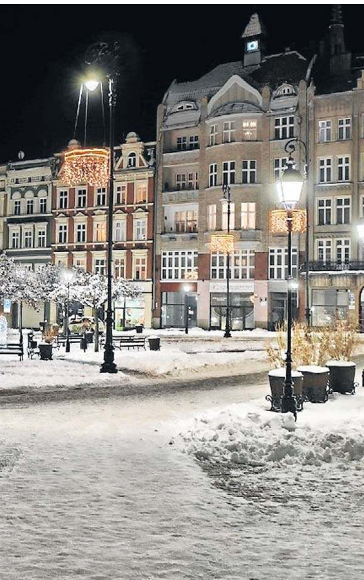
... z Koziegłowów w województwie śląskim. Już cieszą oczy!