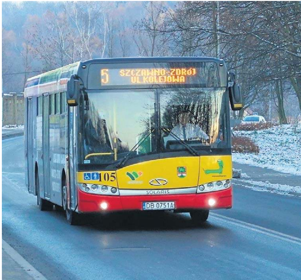
Autobusy z Wałbrzycha mają zastąpić na terenie gminy Walim trzy lokalne linie busów.

Na czym miałyby one polegać? Na rezygnacji z kursów linii nr 5 do Dzieńmorowic i do Walimia, a także z kursów linii 11 do Nowego Julianowa. Jak zaznacza wójt, chodzi o: wyniki kontroli NIK, wskazującej konieczność wyboru między komunikacją aglomeracyjną i gminną; spadek liczby mieszkańców, korzystających z autobusów z 17 do około 8 proc.; koszty (1,8 mln zł rocznie); także o konieczność skomunikowania innych gminnych miejscowości, jak Glinno, do których nie dojeżdża ani pociąg, ani wałbrzyski autobus.