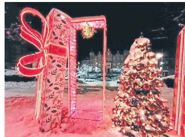
Święta bez prezentów? Niemożliwe! Przypominają nam o tym wielkie, świetne dekoracje na placu Magistrackim.