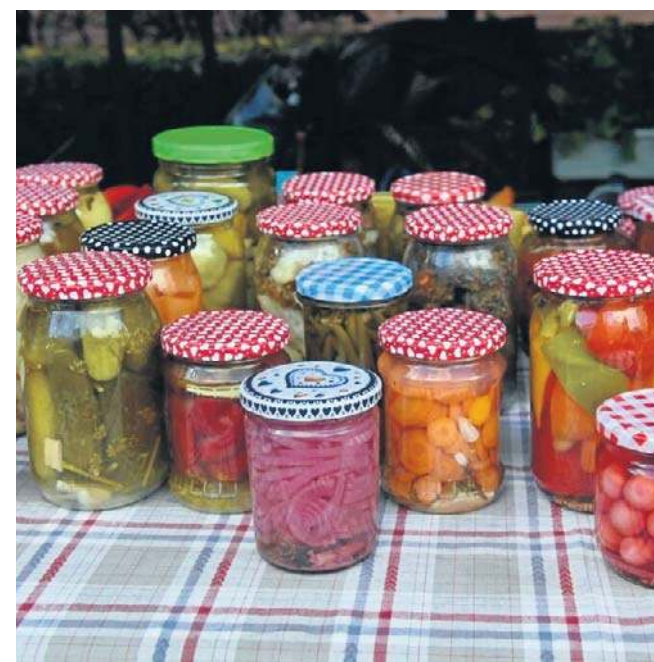
Kiszona kapusta czy ogórki więcej dobra uczynią nam swoimi probiotycznymi właściwościami niż modne koreańskie kimchi w słoiku, z terminem ważności na sto lat.

Oczywiście, kiszonki, miody, zbiteń, zakwas z buraków i inne lokalne produkty budują