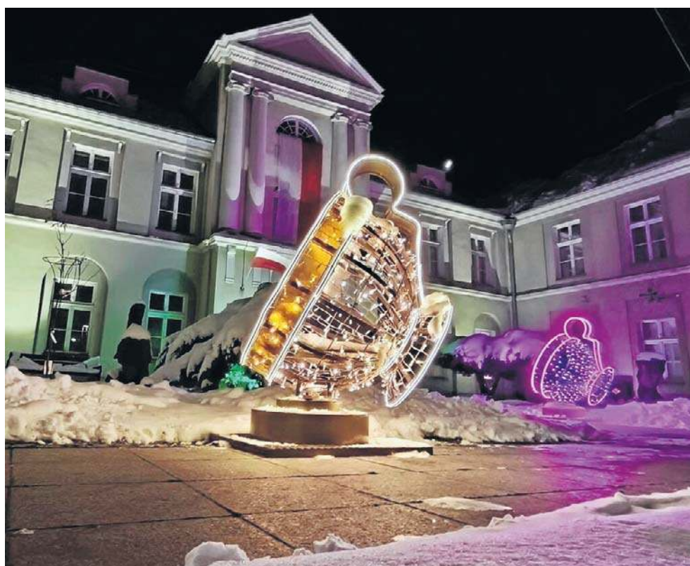
Wielkie, kolorowe filizanki przy Muzeum Porcelany przyciągają uwagę mieszkańców.