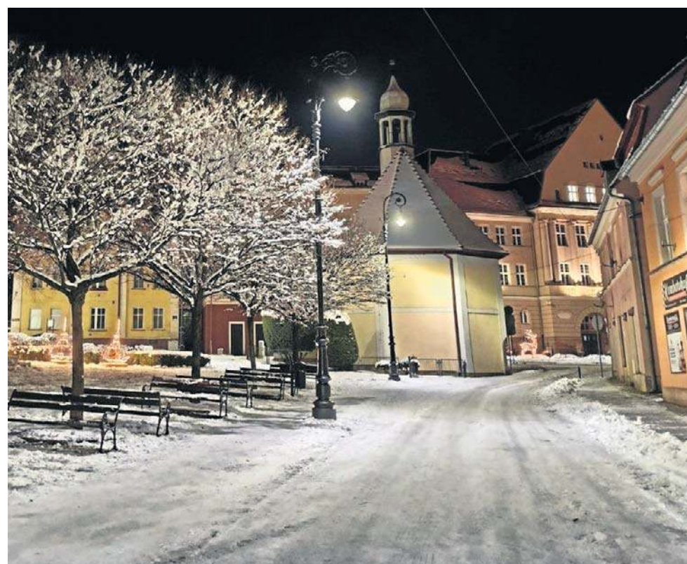
Wieczorny spacer w takiej scenerii to niezapomniane przeżycie. I wstęp do świąt!