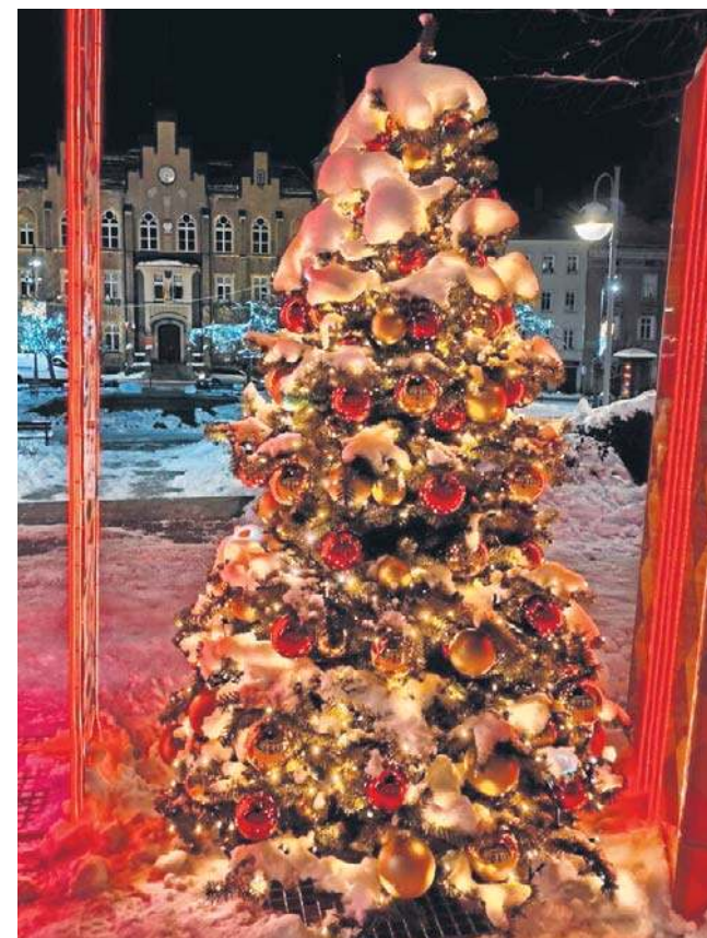
Pięknie udekorowane, przysypane śniegiem drzewka trafiły w ramki. Jakby same ustawiały się do fotografii.