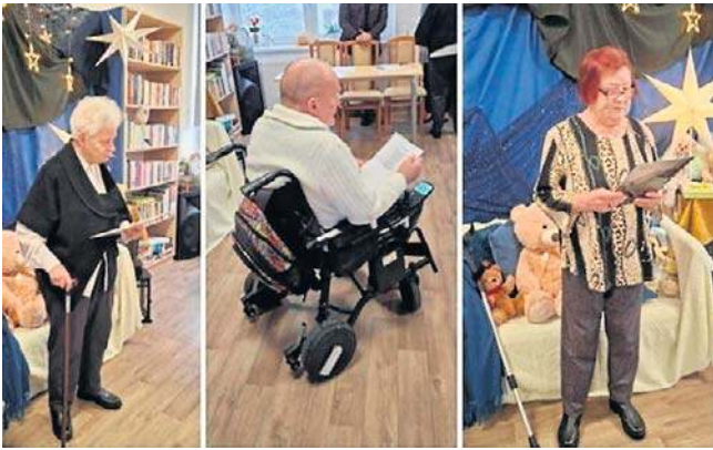
Seniorzy zachwycili swymi utworami. W sali nie było osoby, która by się nie wzruszyła, słuchając autorów.