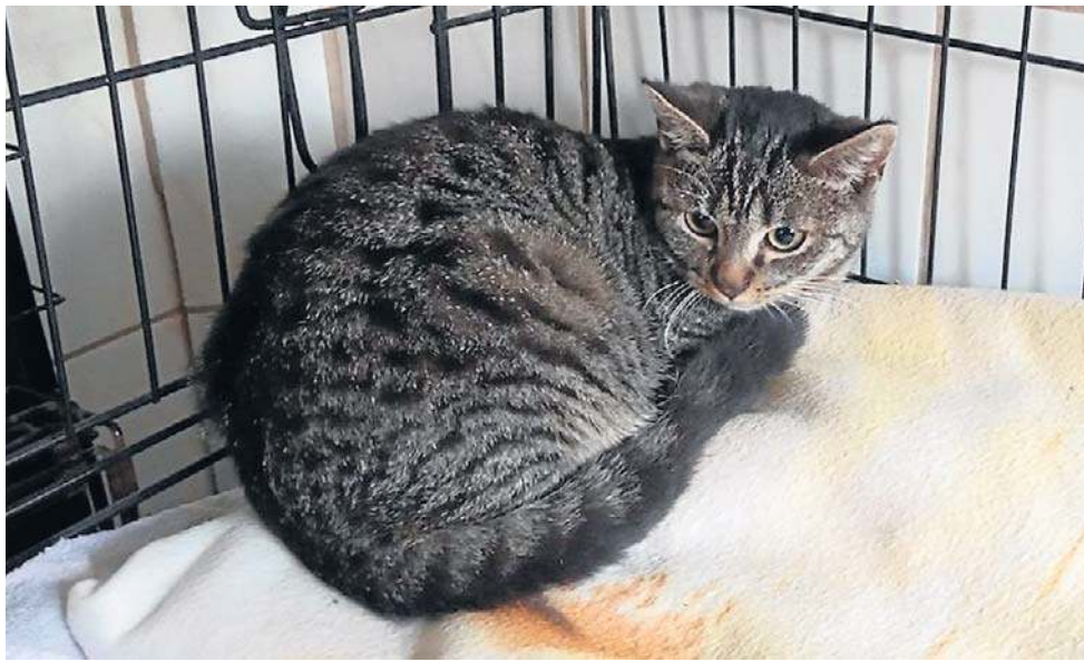
FOT. SCHRONISKO W WAŁBRZYCHU

- Z innymi gminami współpracujemy od wielu, wielu lat. Początkowo było to kilka gmin