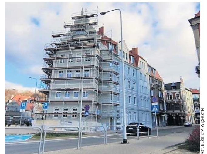
Budynek przy ul. Konopnickiej 5 w Wałbrzychu „wychodzi” z rusztowań. I prezentuje się naprawdę okazale.

Znacie podobne obiekty w mieście pod Chełmcem? Jeśli tak, podpowiedźcie nam. A my postaramy się o nich napisać i zachęcić władze Wałbrzycha do działania. Bo funkcjonalne, a przy tym piękne gmachy to bez wątpienia nasze wspólne dobro.©©