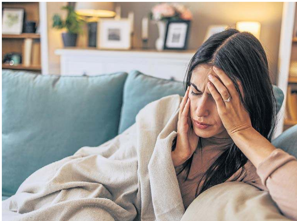
Migreny mogą być wywołane przez różne czynniki, także przez stres.

Koenzym Q10 (inaczej ubidekanon, a w skrócie CoQ10) występuje głównie w mitochondriach