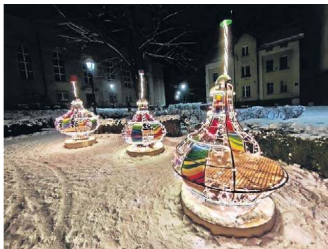
Na placu Kościelnym tańczą trzy kolorowe bączki. Nieodparcie wracają wspomnienia dziecięcych zabaw.