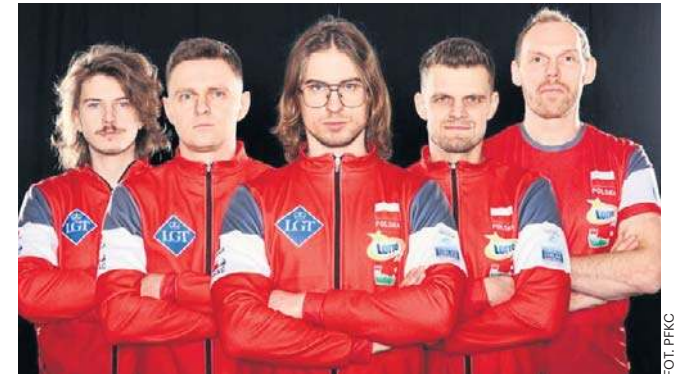
Wałbrzyscy curlerzy odnieśli historyczny sukces w mistrzostwach Europy. Teraz czekają ich mistrzostwa świata.

Reprezentacja Polski mężczyzn w curlingu, oparta na zawodnikach Wałbrzyskiego Klubu Curlingowego ma za sobą ogromny sukces. Przed kilkoma dniami po raz pierwszy zakończyła mistrzostwa Europy na znakomitym, 7. miejscu. To zapewniło jej nie tylko utrzymanie w elitarnej Dywizji A, ale przede wszystkim zagwarantowało pierwszy w historii awans na przyszłoroczne mistrzostwa świata. Odbędą się one na przełomie marca i kwietnia w amerykańskim Ogden City.