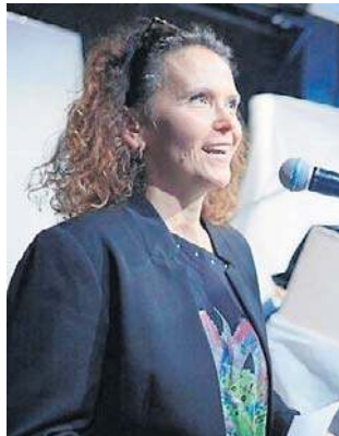
Finał konkursu zaowocował oryginalnym hasłem.

11 dorosłych, dla których Wałbrzych jest miastem urodzenia, miastem zamieszkania,