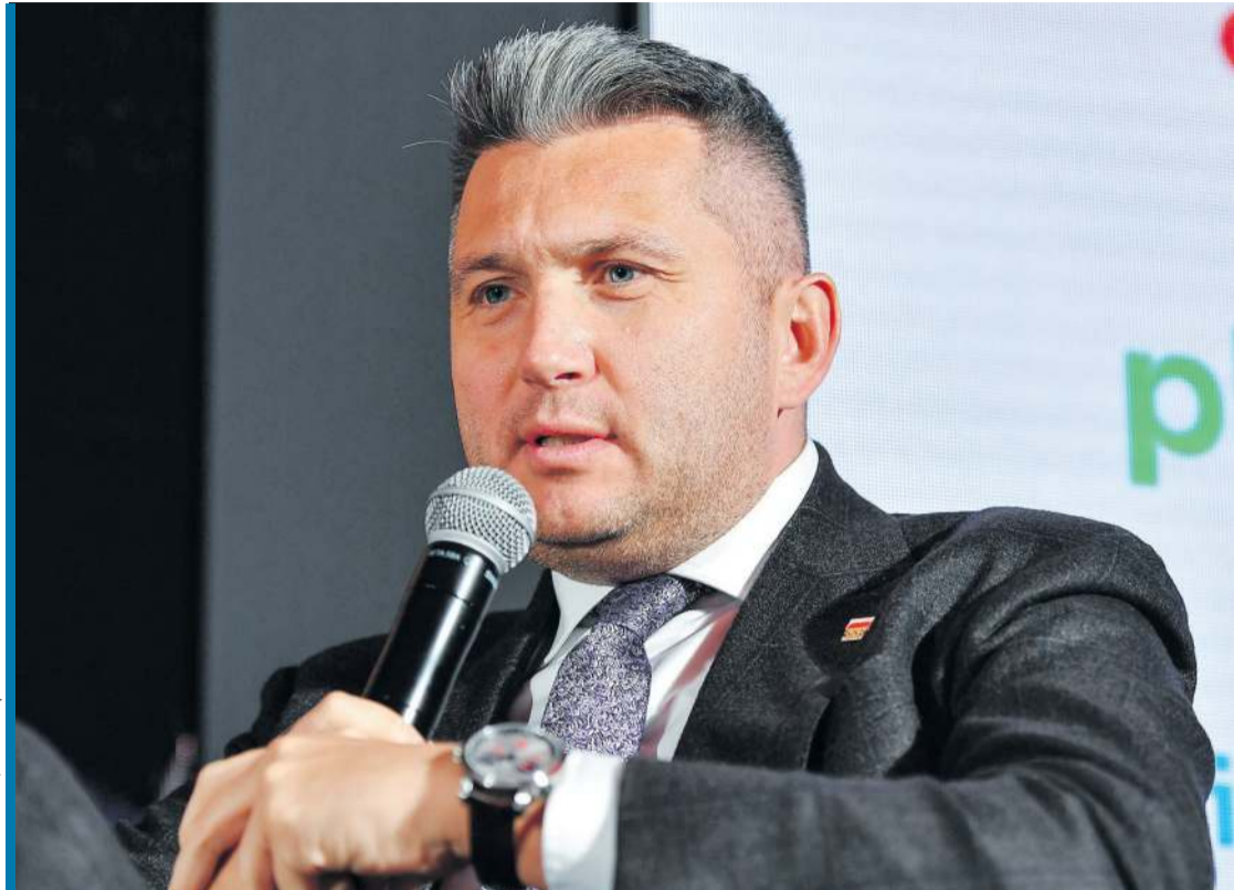
Prawie wszyscy prezesi związków sportowych chcą odejścia Radosława Piesiewicza.