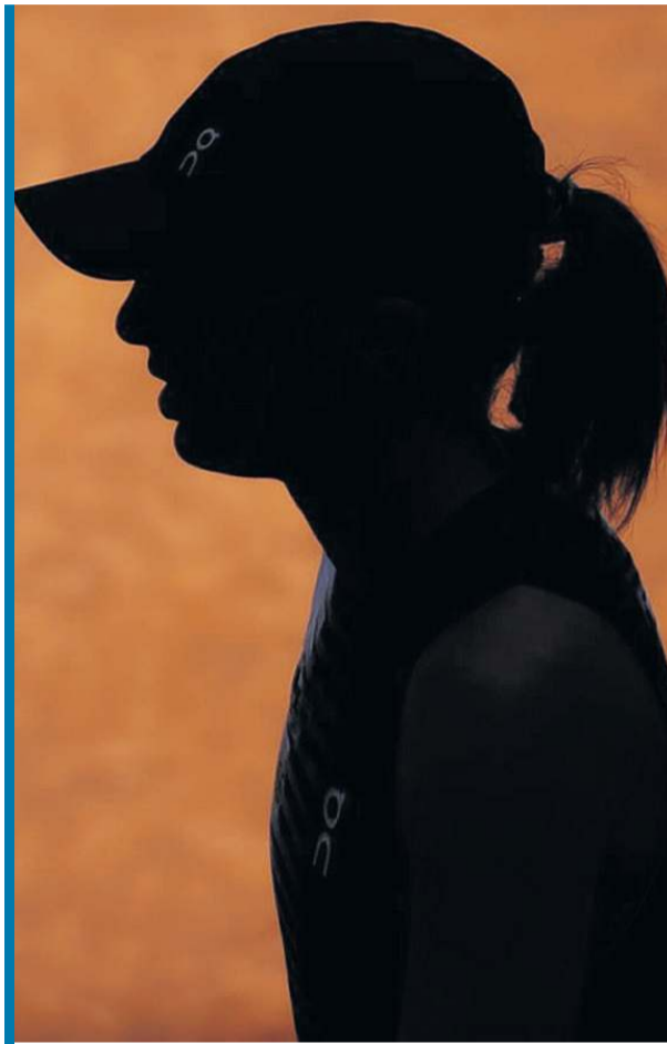
Iga Świątek potrzebuje jeszcze trochę czasu, by nabrać pełni życiowych kolorów...

W poniedziałek w Madrycie Coco Gauff przegrała z Czeszką Lindą Noskovą 4:6, 6:1, 6:7 (5-7). To dobra informacja dla Świątek, bo