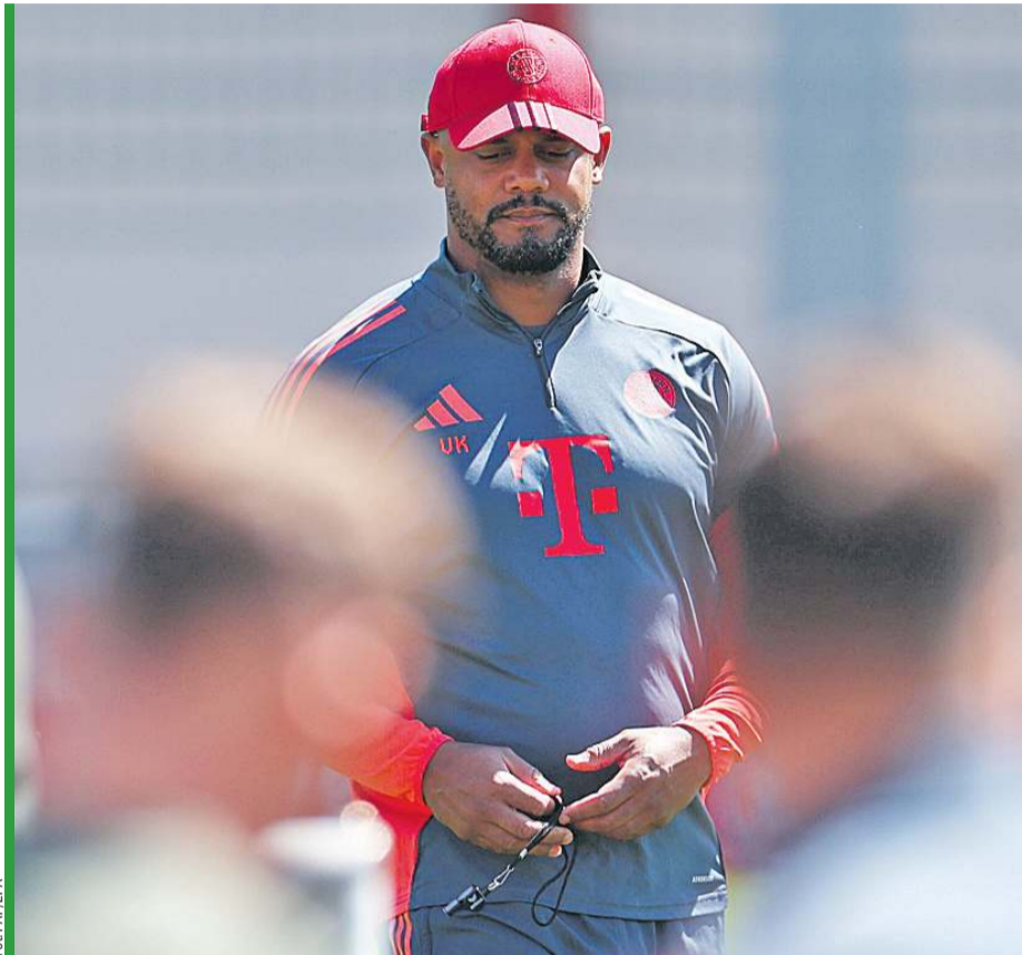
Vincent Kompany w tle, za to z bardzo wyrazistym wpływem na Bayern!

- Że choć zagrał już ponad 400 meczów dla Bayernu, pierwsza połowa w stolicy Francji to było najbardziej intensywne 45 minut w jego życiu! Więc proszę sobie z tego wywnioskować, na jak wielkie wyzwania