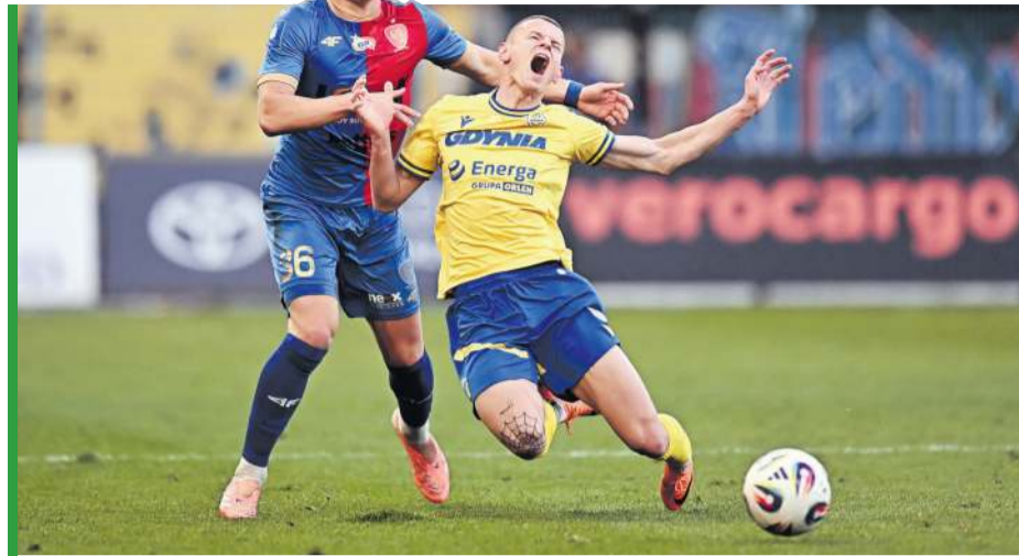
Arka na deskach. Trzy ważne punkty zostają w Gliwicach.