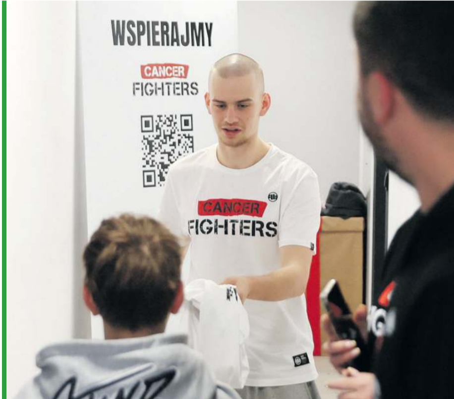
Łatwogang wręcza koszulkę akcji podopiecznemu Fundacji Cancer Fighters.

Zbiórka na platformie YouTube w formie long streamu - nieprzerwanej transmisji na żywo, trwającej dziewięć dni pobiła rekord Guinnessa w największej kwocie zebranej podczas transmisji na żywo na cele charytatywne. W ciągu dziewięciu dni udało się zebrać ponad 250 milionów złotych dla ogólnopolskiej fundacji Cancer Fighters, która pomaga osobom chorym na raka - dzieciom, młodzieży i dorosłym. Wspiera ona także rodziny i bliskich swoich podopiecznych. Działania fundacji nie ograniczają się jedynie do pomocy materialnej, ponieważ jak podkreślono na stronie, osoby walczące z chorobą nowotworową, każdego dnia potrzebują nie tylko leczenia, ale także siły i nadziei na lepsze jutro. Organizuje pomoc medyczną, psychologiczną oraz motywujące wydarzenia. Tym razem dzieci tak strasznie doświadczane przez życie, często bez wyjścia, z pomaganą chemią w młodziutkie ciała, dostały nadzieję, że wygrają z wyda-