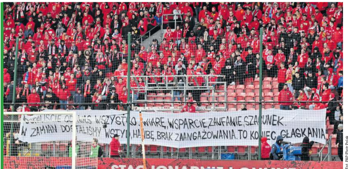
Czerwona Armia i jej niemy przekaz do piłkarzy Widzewa.