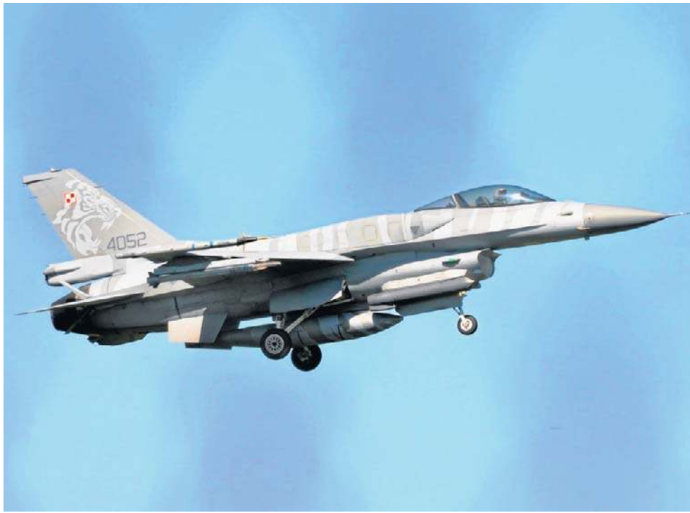
Dotychczas wojsko argumentowało, że te tereny są wykorzystywane przez lotnictwo.