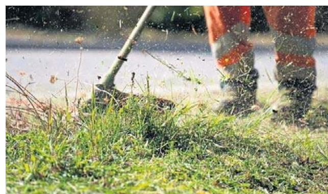
FOT. PEKELS/ZDJEŃ ILLUSTRACYJNE

Prezes Arkadiusz Kowara już przed godziną 11:00 odpowiedział nam, że koszenie ze