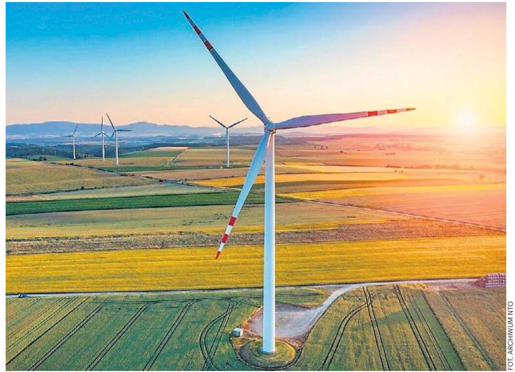
Nowe farmy wiatrowe są planowane na terenie powiatu kluczborskiego.