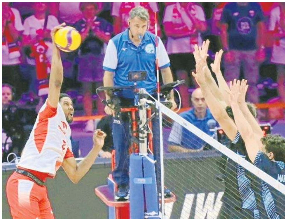
Wilfredo Leon w spotkaniu z Argentyną zdobył dla Biało-Czerwonych aż 28 punktów

- Najważniejsze, że wygraliśmy mecz. Po zwycięstwie łatwiej jest zaakceptować zmęczenie. Nigdy nie grałem w takim secie jak ten pierwszy. Coś niesamowitego, najdłuższy w historii rozgrywek. To było naprawdę wyczerpujące, ale mocno się podobać widzom.