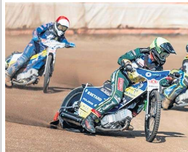
Kolejarz Opole poniósł niespodziewaną porażkę. Cały czas musi zaciekle walczyć o awans do play-off

Landshut: 1. Kim Nilsson - 12+2 (2,2*,3,2*,3), 2. Leon Flint - 9+1 (1,3,2*,2,1), 3. Jonas Knudsen - 8+1 (1*,3,2,1,1), 4. Lars Skupień - 2+1 (2*,0,0,-), 5. Kevin Woelbert - 10 (0,1,3,3,3), 6. Mario Hausl - 5 (2,3,0), 7. Janek Konzack - 7+1 (1*,3,3,0). © ©