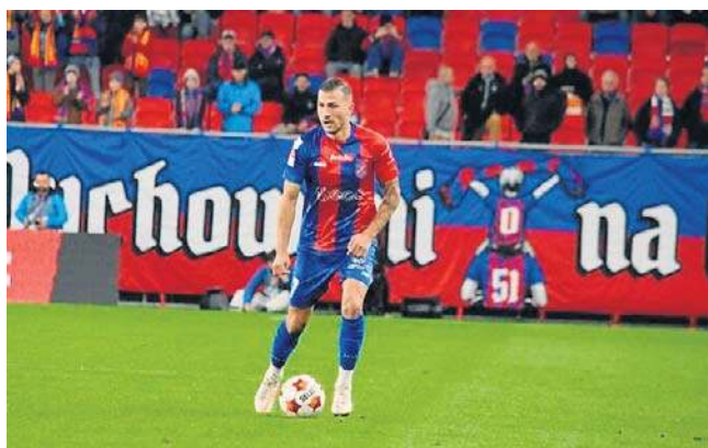
Ostatni mecz kontrolny w Austrii Odra rozegra w środę 1 lipca. Jej rywalem będzie wtedy czeski FK Pardubice

Ich potyczka z pierwszą z wymienionych ekip zakończyła się bezbramkowym remi-