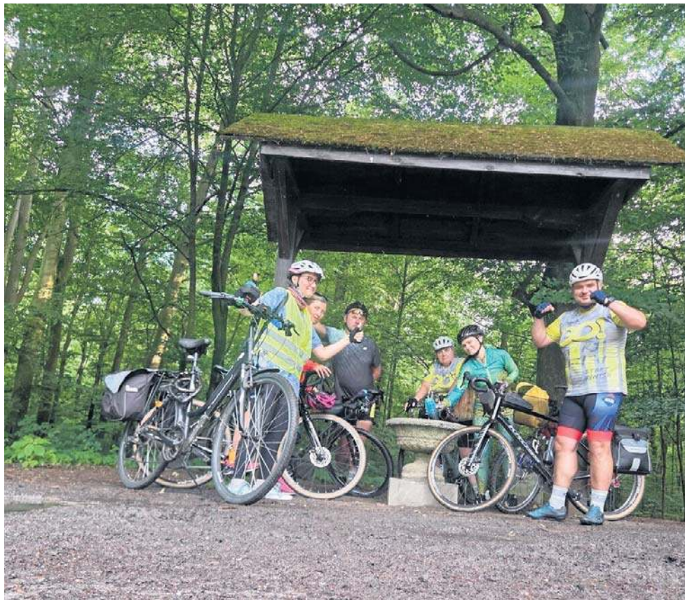
Wyprawa odbędzie się od 3 do 5 lipca, ale jej uczestnicy już trenują.

Zbiórka prowadzona za pośrednictwem portalu Siepo-