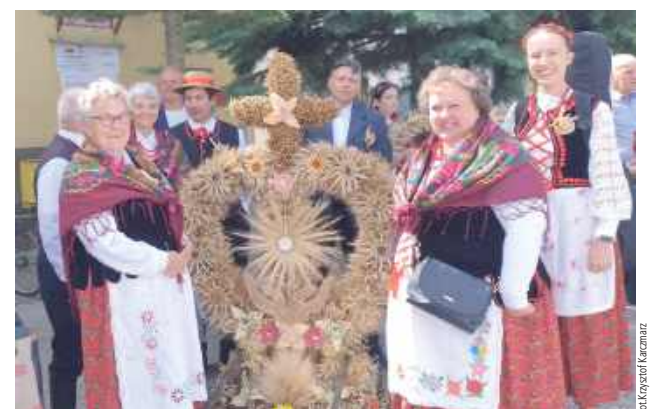
Gmina Jeziorzany kultuwyje piękną, dożynkową tradycję, w czym ogromny udział mają KGW