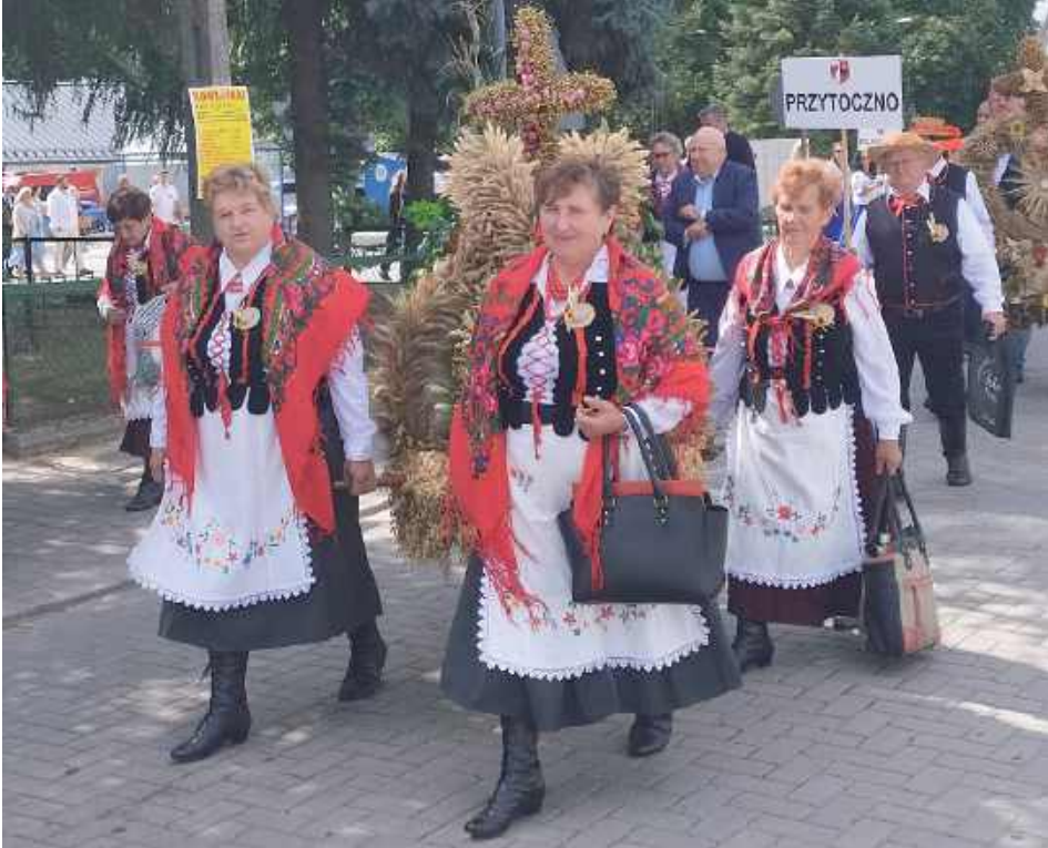
Nie mogło też zabraknąć reprezentantek lokalnych kół gospodyń wiejskich i tradycyjnych wieńców