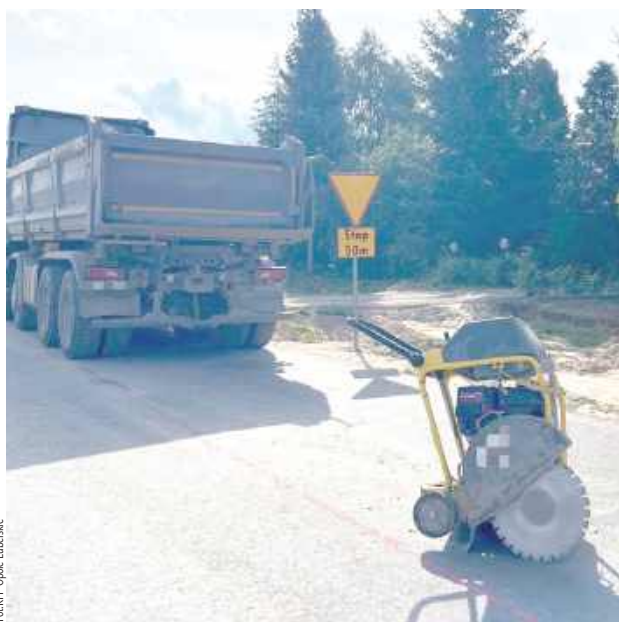
Podczas prac drogowych 25-letni kierowca ciężarówki marki Scania, cofając, najechał na 21-letniego pracownika, obsługującego maszynę do wycinania nawierzchni. Mężczyzna został przygnieciony do urządzenia

- Z przekazanych informacji wynikało, że w zdarzeniu brał udział samochód budowlany marki Scania oraz pracownik wykonujący prace na drodze przy użyciu maszyny służącej do wycinania nawierzchni - mówi kom. Sabina Piłat-Kozieł z Komendy Powiatowej Policji w Opolu Lubelskim.