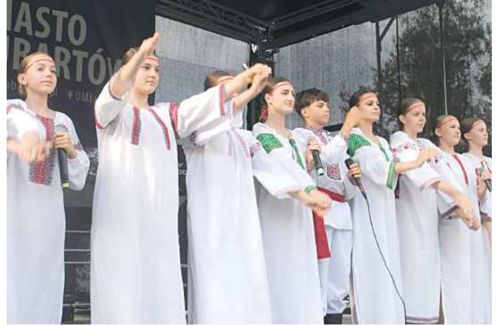
Piknik rozpoczął występ młodzieży ze Sławuty - partnerskiego miasta Lubartowa na Ukrainie

Piknik pod hasłem „Postaw na rodzinę” zorganizowała Miejska Komisja Rozwiązywania Problemów Alkoholowych.