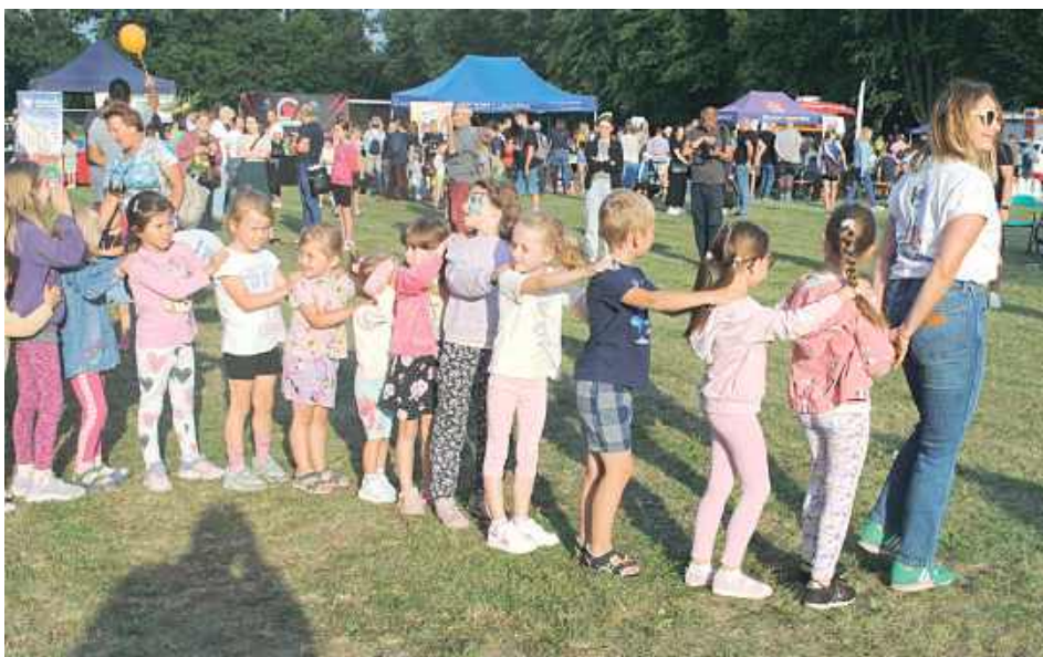
Dzieci dobrze się bawiły przy muzyce