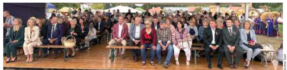
Goście oczekują na rozpoczęcie dożynek