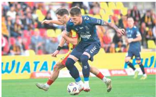
Motor czeka na wygraną od 20 lipca

Piłkarze lubelskiego Motoru zaliczyli czwartą z rzędu mecz w PKO BP Ekstraklasie bez wygranej. W 6. kolejce rozgrywek żółto-biało-niebiescy ulegli na wyjeździe Koronie Kielce.