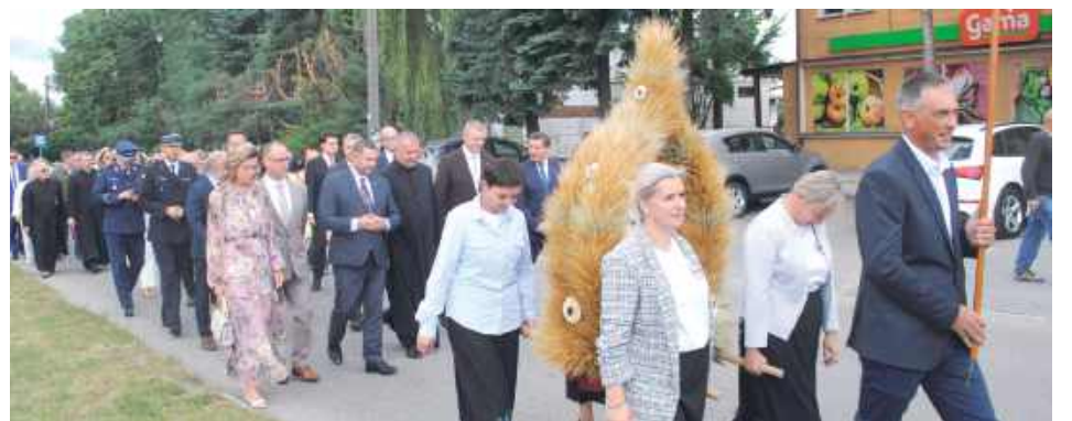
Korowód dożynkowy w przemarszu przez Serniki