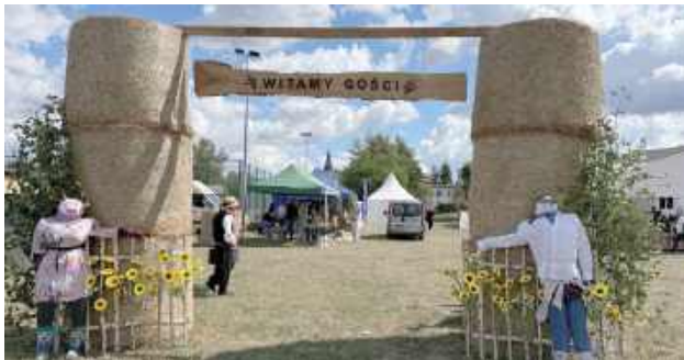
Piękna brama powitalna