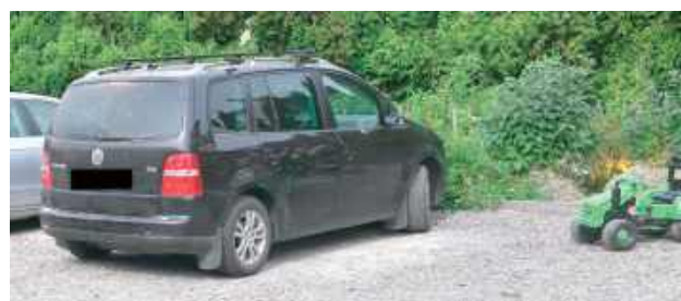
Dziecko wraz z matką zostało przetransportowane do szpitala, gdzie jego stan jest obecnie monitorowany

POWIAT OPOLSKI: Chwila nieuwagi mogła zakończyć się tragedią. W jednej z miejscowości gminy Opolo Lubelskie 63-letni mężczyzna, ruszając samochodem marki VW Touran, potrafił swojego 1,5-letniego wnuka.