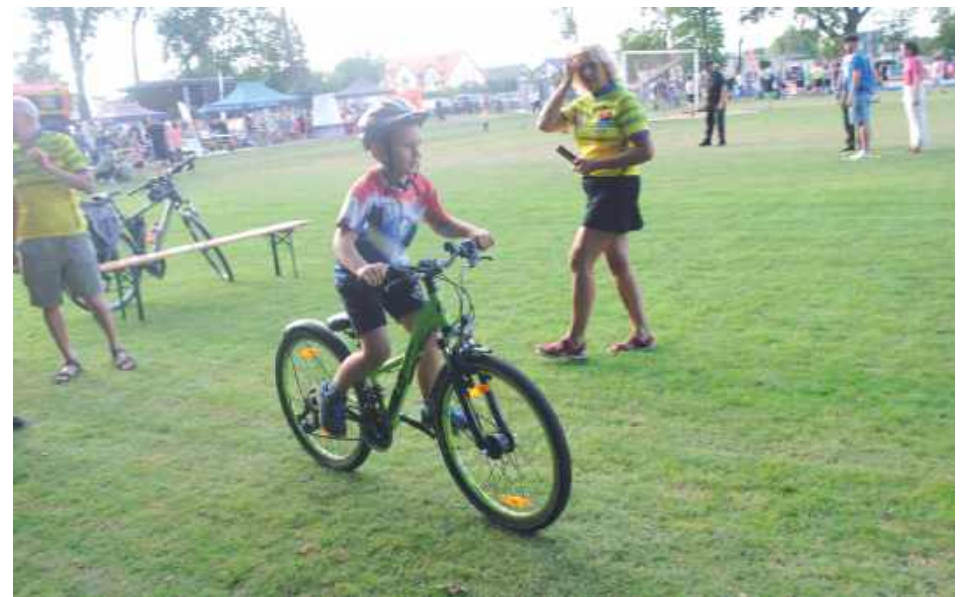
MKTR Relaks zorganizował tor przeszkód