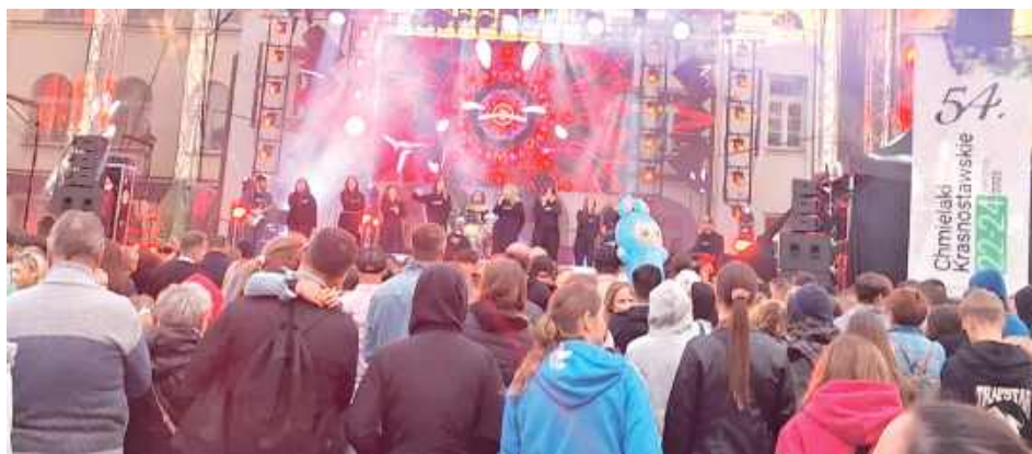
Koncerty przyciągnęły miłośników gatunków od folkloru po rock