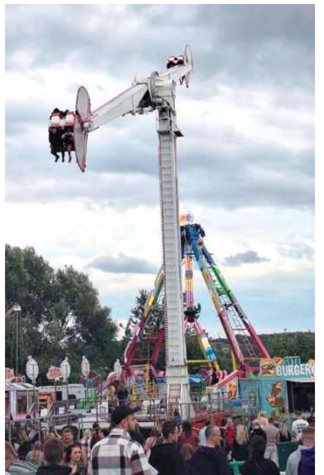
W czasie Chmielaków w mieście można było skorzystać z wielu atrakcji, a także skosztować smakowitych przekąsek