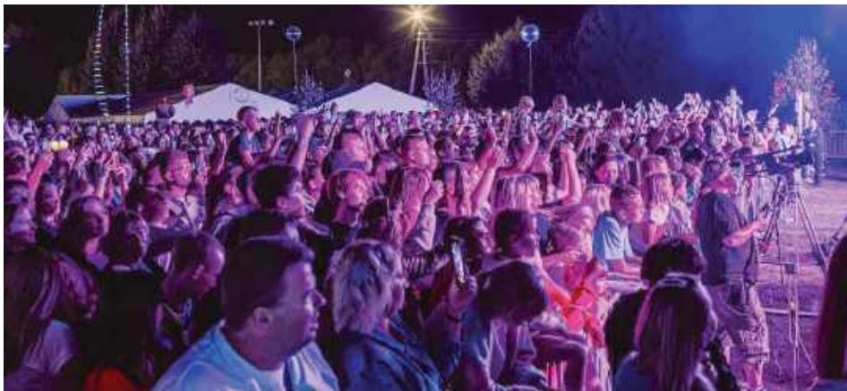
Publicność na koncercie gwiazdy wieczoru