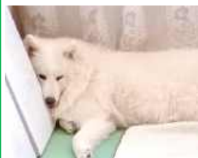
Bella, Cezar Nowicki, Łuków