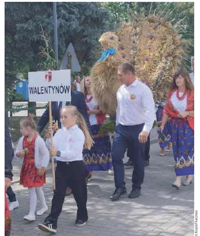
Nie mogło też zabraknąć reprezentantek lokalnych kół gospodyń wiejskich i tradycyjnych wieńców. Najpiękniejszym wybrano ten, który przygotowali mieszkańcy Walentynowa