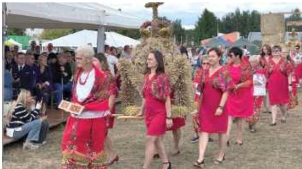
Reprezentacja gospodarzy z KGW Niemce

Jednym z ważniejszych punktów święta plonów był wybór najładniejszego wieńca. Trzeba przyznać, że konkurencja ponownie była