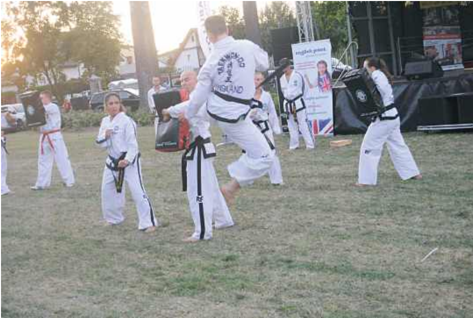
Publiczności podobał się pokaz Taekwon - do