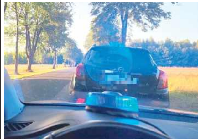
Kobieta kierowała Oplem

Policjanci parczewskiej drogówki zatrzymali 41-latkę, która mając ponad 3 promile alkoholu w organizmie, kierowała Oplem. Jakby tego było mało, wewnątrz pojazdu znajdowała się dwójka jej dzieci w wieku 7 i 8 lat.