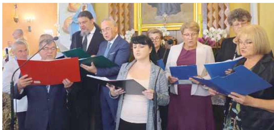
O oprawę muzyczną mszy św. inauguracyjnej dożynki w gminie Jeziorzany zadbał chór ADOREMUS