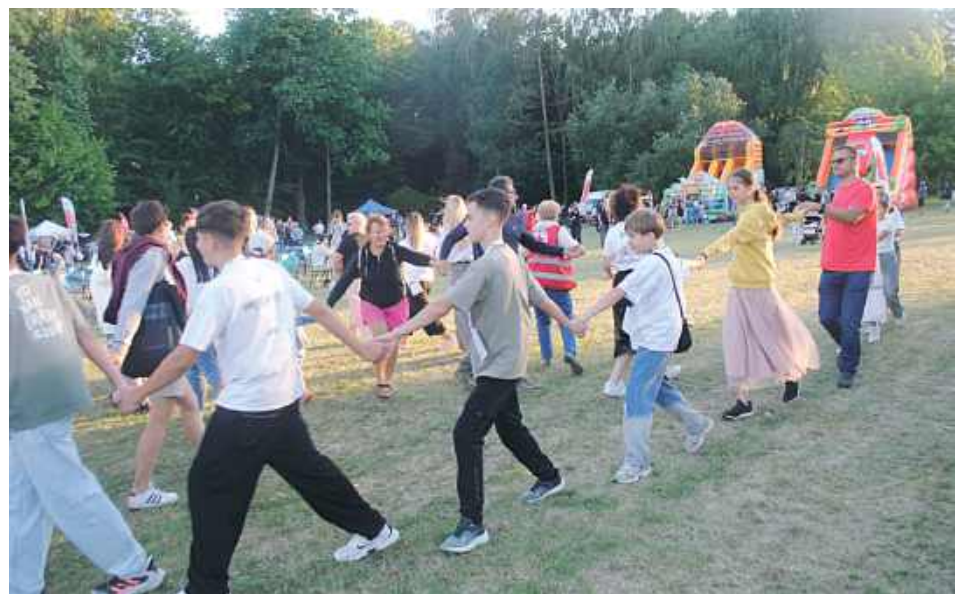
Wspólne tańce młodzieży z Lubartowa i Sławuty