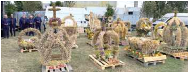
Siedemnaście pięknych wieńców przegotowały sołectwa gminy Niemce