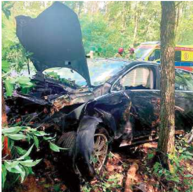
Mężczyzna poruszał się drogą wojewódzką numer 820 z miejscowości Sosnowica w kierunku Starego Orzechowa. Nagle na jezdnię, wprost pod jadący pojazd wybiegła sarna

- Będący na miejscu policjanci zastali już zespół ratownictwa medycznego, który udzielał pomocy poszkodowanemu. Kierującym okazał się 19-letni mieszkaniec gminy Sosnowica. Mężczyzna poruszał się drogą