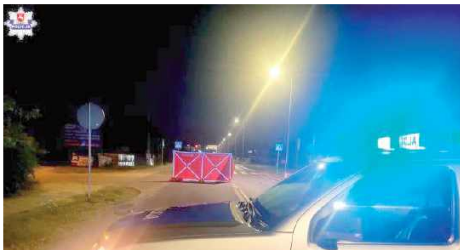
Kierujący samochodem koloru srebrnego, poruszający się od strony Lubartowa, na prostym odcinku drogi w rejonie skrzyżowania z ul. Piwonii wjechał w kobietę prawdopodobnie przechodzącą przez przejście dla pieszych