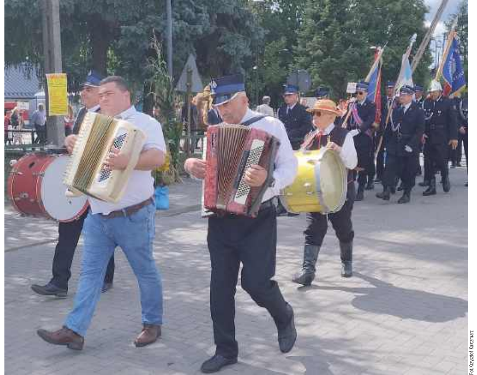
Ulicami centrum Jeziorzan przeszedł tradycyjny korowód. Był orkiestra czy reprezentanci jednostek OSP

Rolnicy i mieszkańcy najmniejszej gminy w powiecie lubartowskim wspólnie podziękowali za tegoroczne plony. Były korowód, tradycyjne wieńce i koncerty.