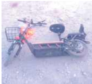
Poszkodowany mieszkaniec powiatu ryckiego z obrażeniami twarzy został przetransportowany do szpitala

Powiat rycki: W Kletni 70-letni mężczyzna stracił kontrolę nad hulajnogą elektryczną i upadł na szutrowej drodze. Z obrażeniami twarzy został przewieziony do szpitala.