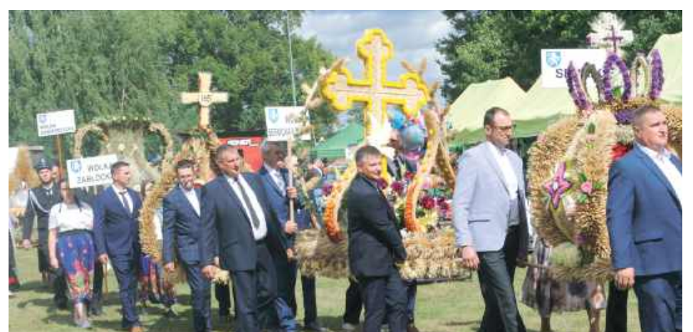
Prezentacja wieńców dożynkowych