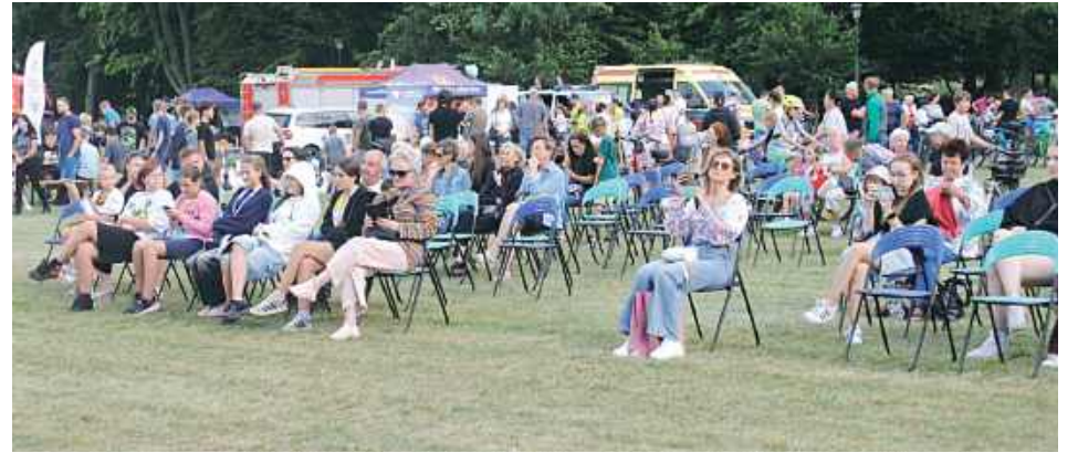
Publiczność oglądała występy na scenie