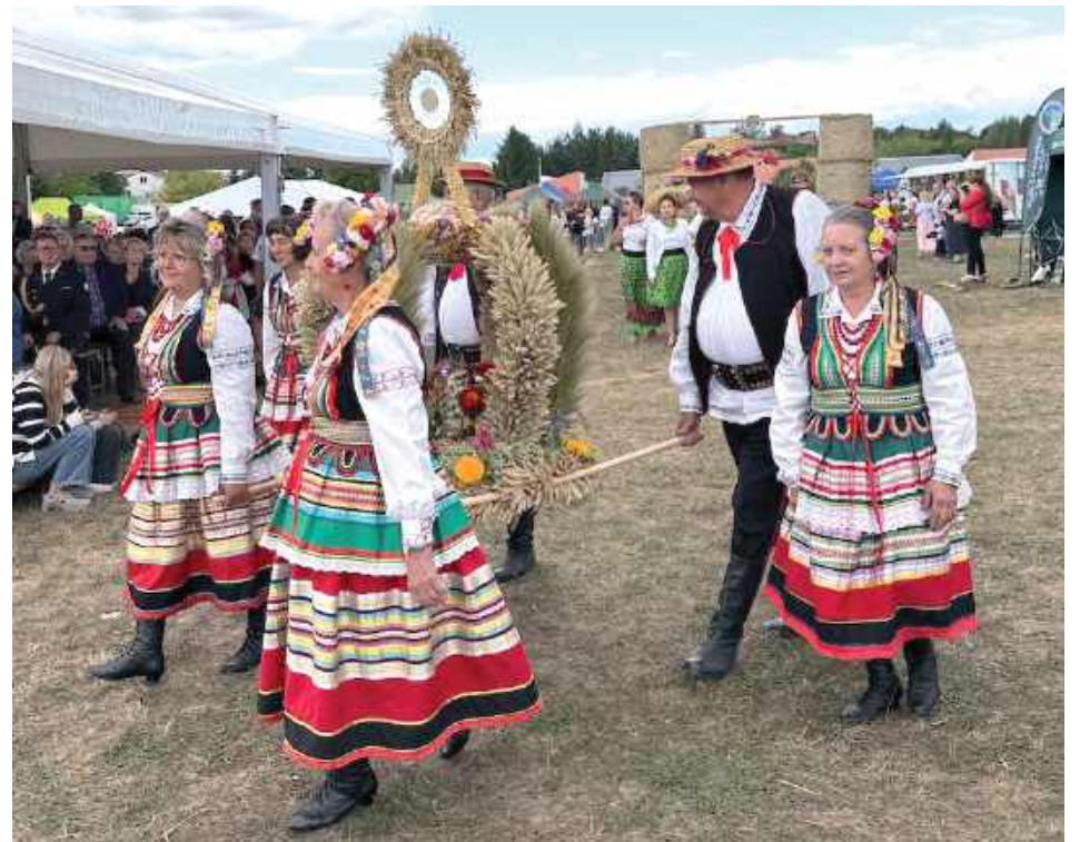
Dysowiaczy ze swoim ślicznym wieńcem wykonanym metodą tradycyjną. Ich praca wygrała w tej kategorii