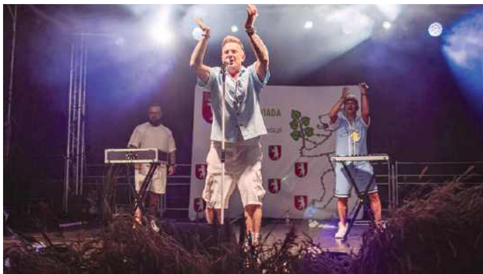
Gwiazda wieczoru - D Bomb