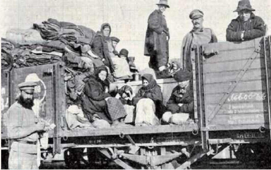
Ludzi upychano w wagony, których ładowność określano na „Wosiem łoszadziei i sorok ludzi” - osiem koni i czterdziestu ludzi

W 1917 roku liczbę mogących wracać szacowano na 2-3 mln - dołączyli do tego zesłańcy powstaniowi, zresztą sama administracja prosiła, żeby się nie wrywać natychmiast z powrotem (!), potem