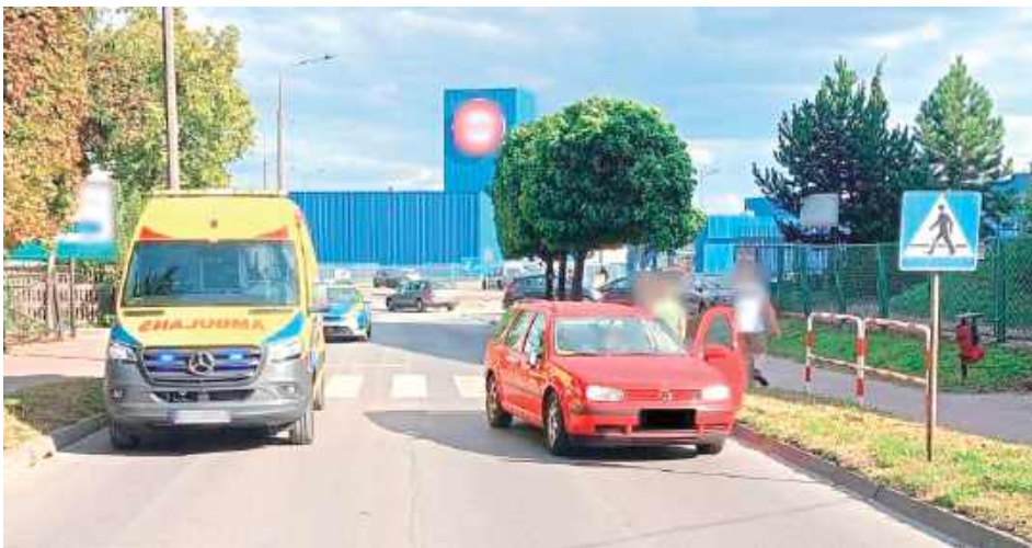
44-letni mieszkaniec powiatu ryckiego kierujący Volkswagenem, jadąc ul. Żytnią, nie ustąpił pierwszeństwa 65-letniemu pieszemu, który znajdował się na przejściu dla pieszych

Ze wstępnych ustaleń funkcjonariuszy wynika, że 44-letni mieszkaniec powiatu ryckiego kierujący Volkswagenem, jadąc ul. Żytnią, nie ustąpił pierwszeństwa 65-letniemu pieszemu, który znajdował się na przejściu dla pieszych. W wyniku potrącenia 65-letni mieszkaniec powia-