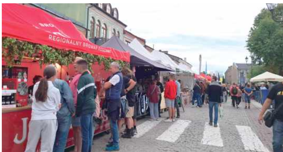
Tradycyjne stoiska przyciągnęły tłumy