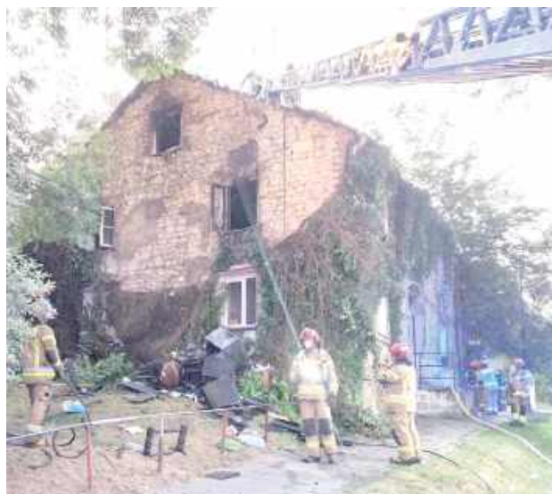
Strażacy równocześnie prowadzili gaszenie pożaru oraz przeszukiwanie pomieszczeń, aby upewnić się, że w zadymionych mieszkaniach nie pozostały inne osoby wymagające pomocy

- Ze zgłoszenia wynikało, iż przy ulicy Słowikowskiego w Lublinie doszło do pożaru kamienicy. Ogień najprawdopodobniej miał pojawić się na poddaszu. Na miejsce od razu skierowano służby ratunkowe. Podczas akcji gaśniczej w mieszkaniu na poddaszu ujawniono ciała dwóch osób. Ciała przekazano na sekcję zwłok. Wstępnie ustalono, że mogą to być 60-let-