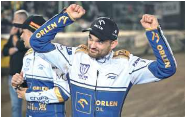
Bartosz Zmarzlik znów pokazał wielką klasę!

Orlen Oil Motor Lublin rozegrał pierwszy półfinał PGE Ekstraligi z Bayersystem GKM-em Grudziądz. Mistrzowie Polski w początkowej fazie zawodów mieli spore problemy i zapowiadało się zaskoczenie. Później koledzy wzięli przykład z Bartosza Zmarzlika.