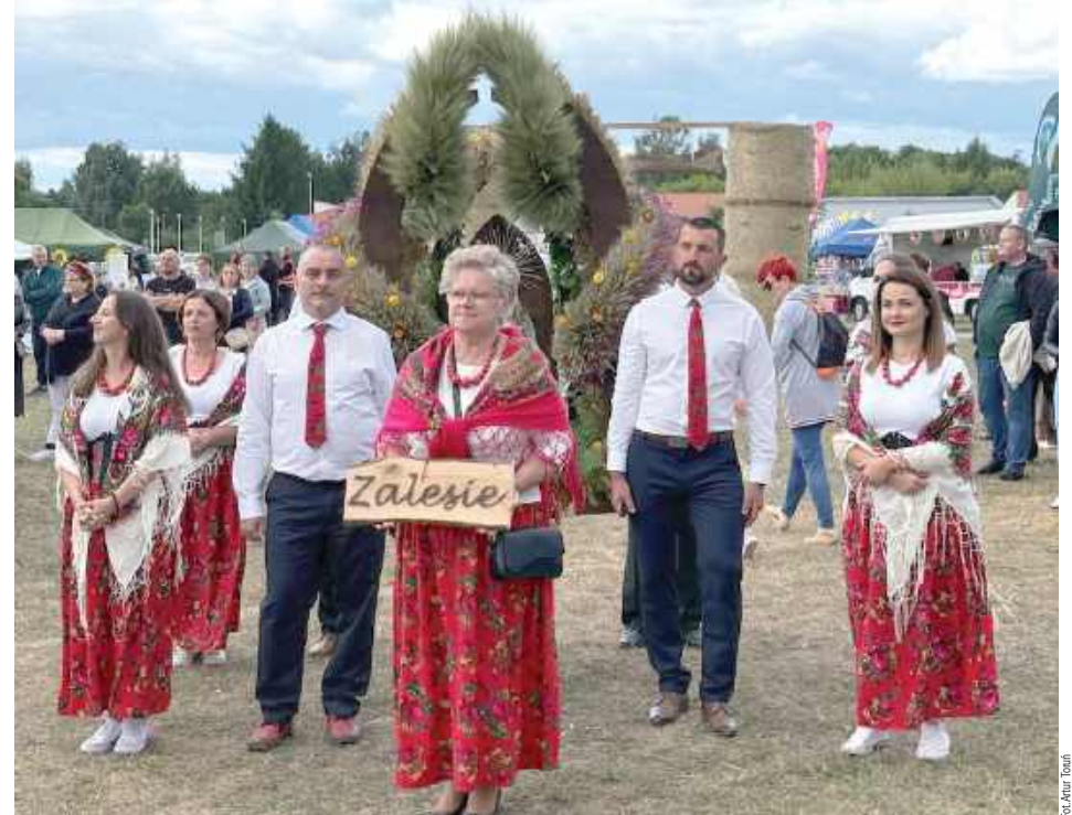
Przedstawiciele Zalesia niosą najładniejszy wieniec w kategorii - wieniec współczesny