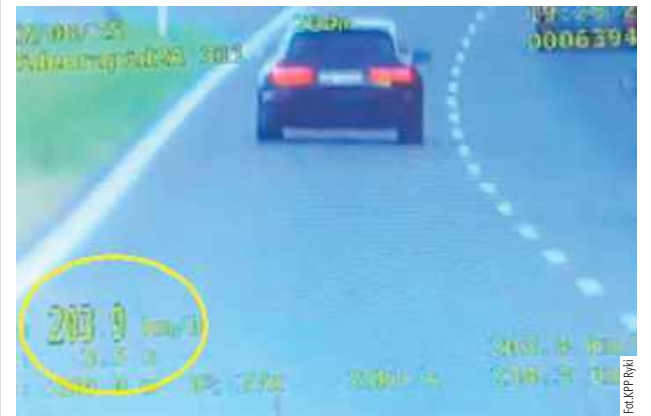
Wykroczenie zostało zarejestrowane policyjnym wideorejestratorem. Mężczyzna został natychmiast zatrzymany do kontroli drogowej

Policjanci z Ryk zatrzymali pirata drogowego. Mężczyzna pędził ponad 200 km/h trasą S17.