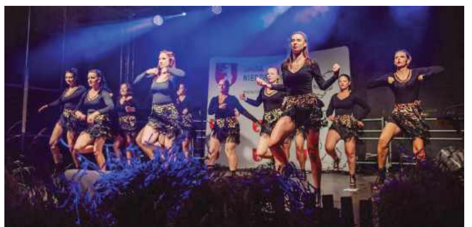
Wystąpiło Studio Tańca Spektrum