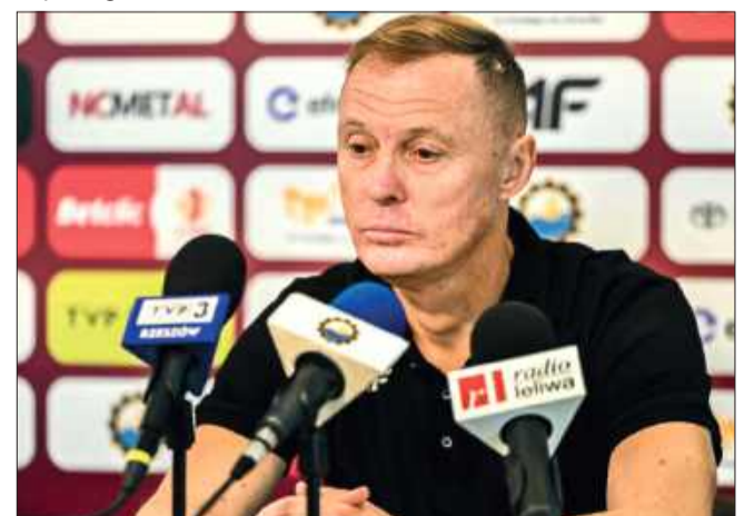
To on ma poprowadzić Stal Mielec do utrzymania