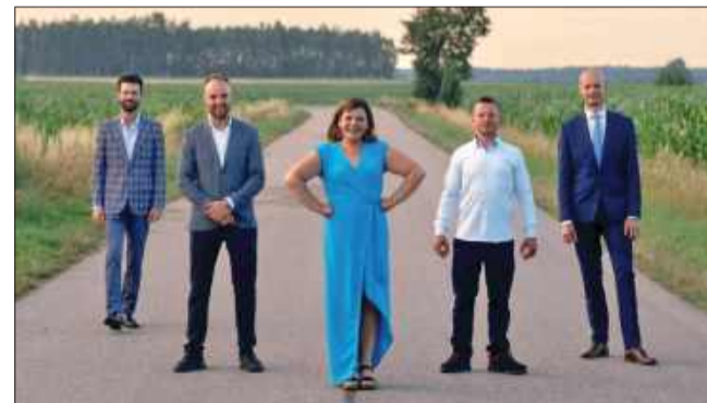
Podkarpacie w „Rolniku”! Kandydatki z naszego regionu szukają miłości.