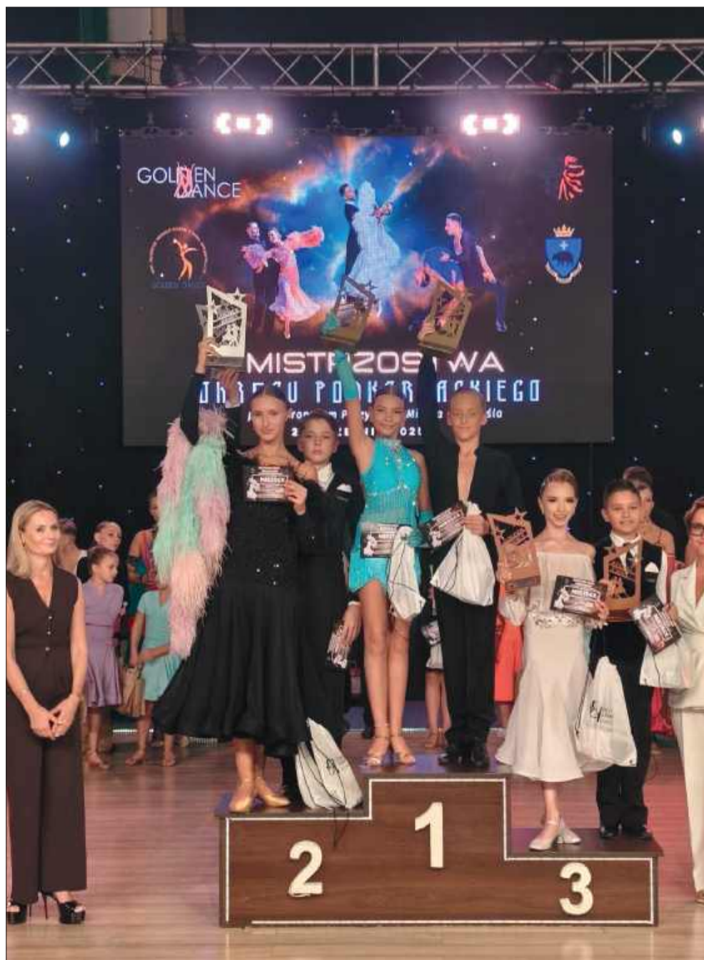
Radość zwycięzców – 21 tytułów mistrzowskich i wicemistrzowskich dla mieleckiej „Gali”.