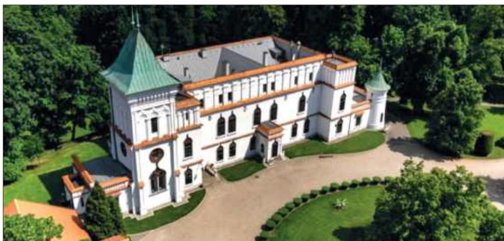
Nowa, bajkowa sceneria ślubów w Przeclawiu.