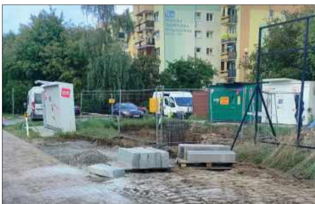
Na Smoczce trwają prace.