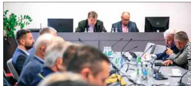
Posiedzenie Komisji Bezpieczeństwa i Porządku

30 września 2025 r. w Starostwie Powiatowym w Mielcu odbyło się posiedzenie Komisji Bezpieczeństwa i Porządku. Spotkanie poświęcone było dwóm kluczowym tematom dla mieszkańców powiatu mieleckiego: bezpieczeństwu hydrologicznemu oraz podsumowaniu tegorocznej akcji „Bezpieczne Lato”.