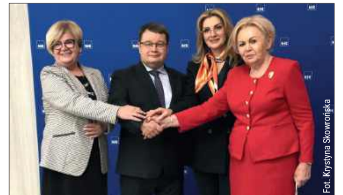
Mieszkańcy regionu zyskają nowoczesną infrastrukturę.

Łącznie do oceny formalno-merytorycznej zgłoszono 57