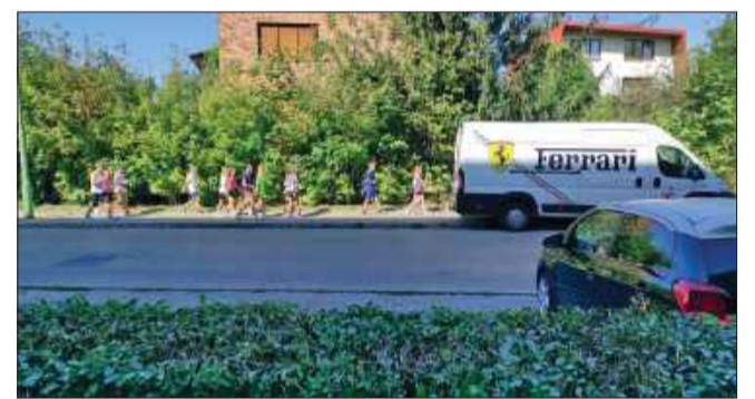
Pieszym trudno przejść chodnikiem.

Na ul. Warszawskiej w Mielcu mieszkańcy od dłuższego czasu zwracają uwagę na narastający problem z parkowaniem samochodów. Kierowcy pozostawiają auta na chodniku, co utrudnia swobodne poruszanie się pieszym. Sytuacja jest szczególnie uciążliwa, ponieważ to odcinek, którym codziennie przechodzi wielu uczniów oraz mieszkańców.