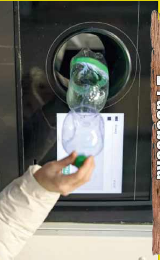
Ruszył system kaucyjny. Na razie trudno o butelki z kaucją na półkach.