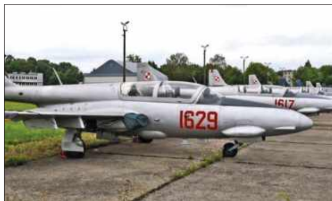
Samolot „Iskra” został okradziony w Muzeum Sił Powietrznych.

Skradzione elementy mają dużą wartość kolekcjonerską. Choć sama „Iskra” została przekazana miastu z wyceną na 20 tys. zł, części osprzętu kokpitu są unikatowe i cenione przez pasjonatów lotnictwa na całym świecie.