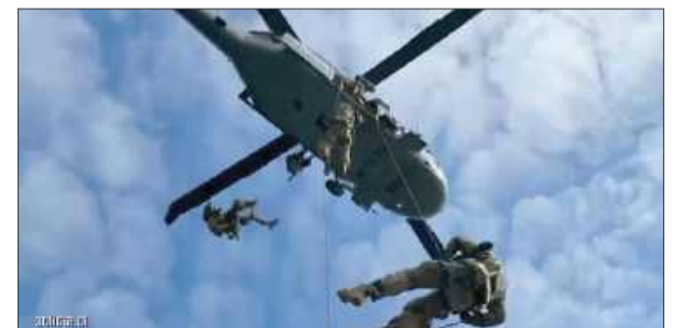
Spektakularne ćwiczenia Policji. Black Hawk w akcji nad Świnoujściem.

Wykorzystano nowoczesne środki techniczne — psy bojowe, systemy obserwacji z powietrza i sprzęt łączności satelitarnej — co pozwoliło wiernie odtworzyć