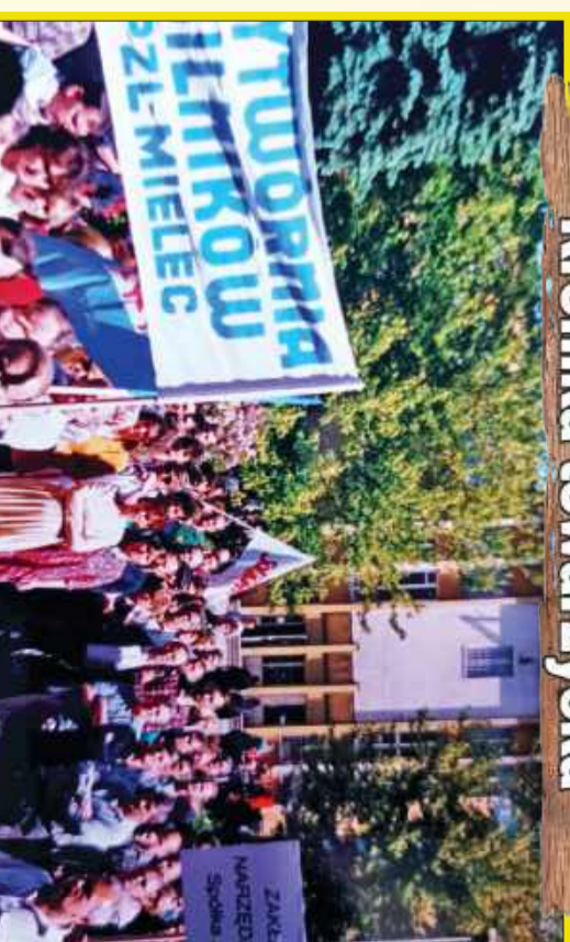
Milec w latach 90-tych. Archiwalne zdjęcia przywołują tamte zmiany i przełomu.