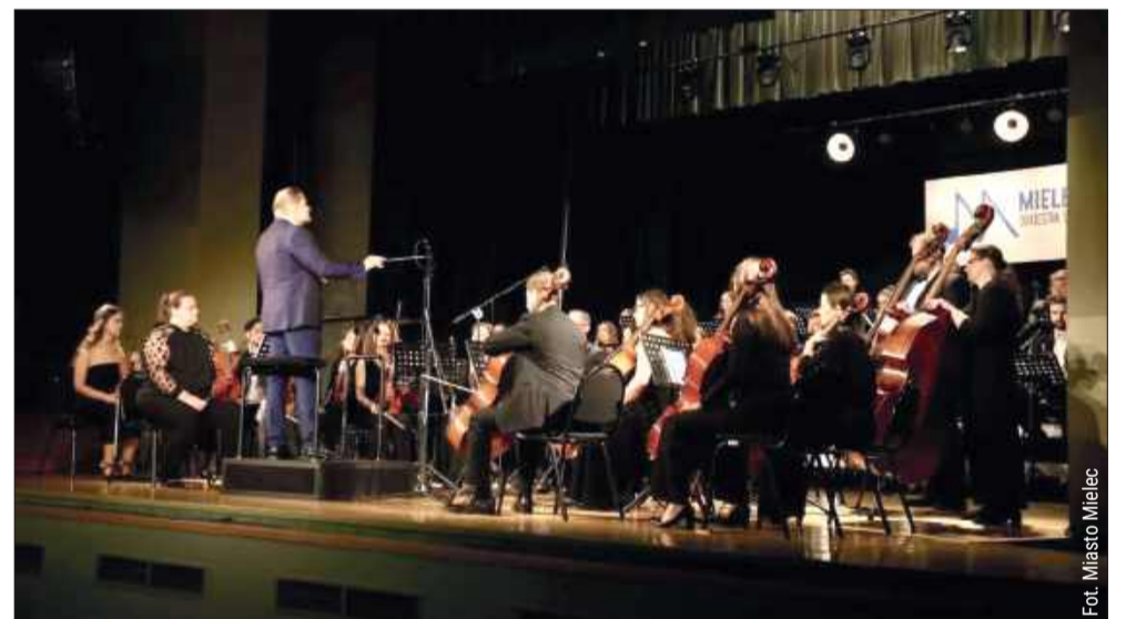
Mielecka Orkiestra Symfoniczna