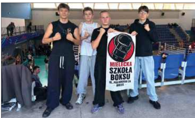
Kolejny udany turniej reprezentantów MSB