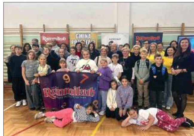
Uczestnicy I Mistrzostw Gminy Przecław w Rummikub podczas rozgrywek w Szkole Podstawowej w Łączkach Brzeskich.