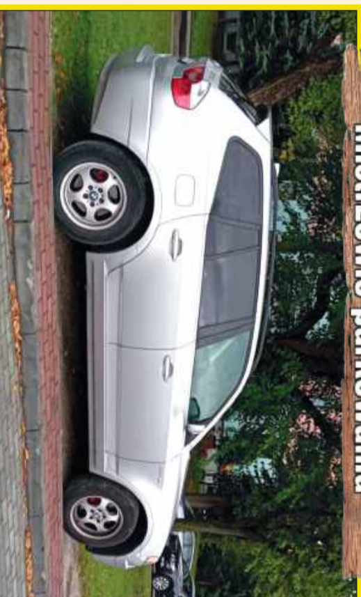
Parkowanie równoległe... na trawniku.