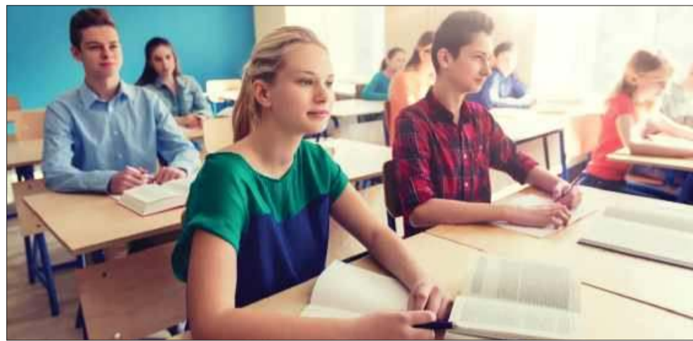
Edukacja zdrowotna nie przyciąga wielu uczniów.

Najwyższą frekwencję odnotowano w Powiatowym Zespole Placówek Szkolno-Wychowawczych – 11,21% (24 uczniów