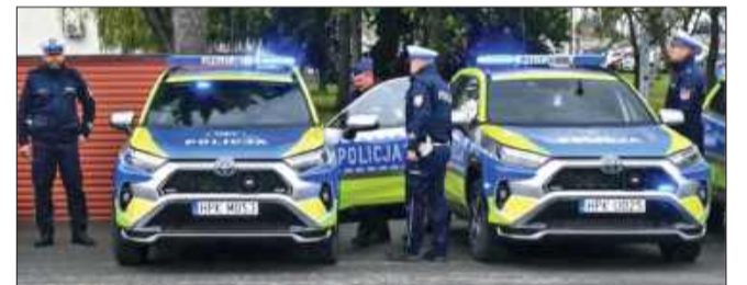
Nowoczesna Toyota RAV4 zasilila flotę mieleckiej policji.

Do Komendy Powiatowej Policji w Mielcu trafił nowy radiowóz – Toyota RAV4 w policyjnej wersji z hybrydowym napędem i nowym, neonowym oznakowaniem. To jeden z 16 nowoczesnych pojazdów, które otrzymali funkcjonariusze garnizonu podkarpackiego.