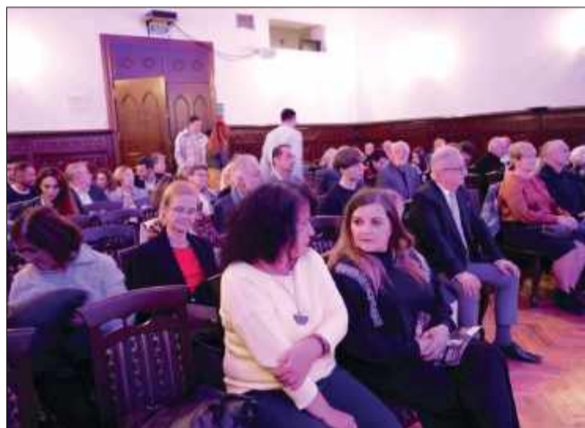
Publiczność nagrodziła młodego pianistę długimi oklaskami.