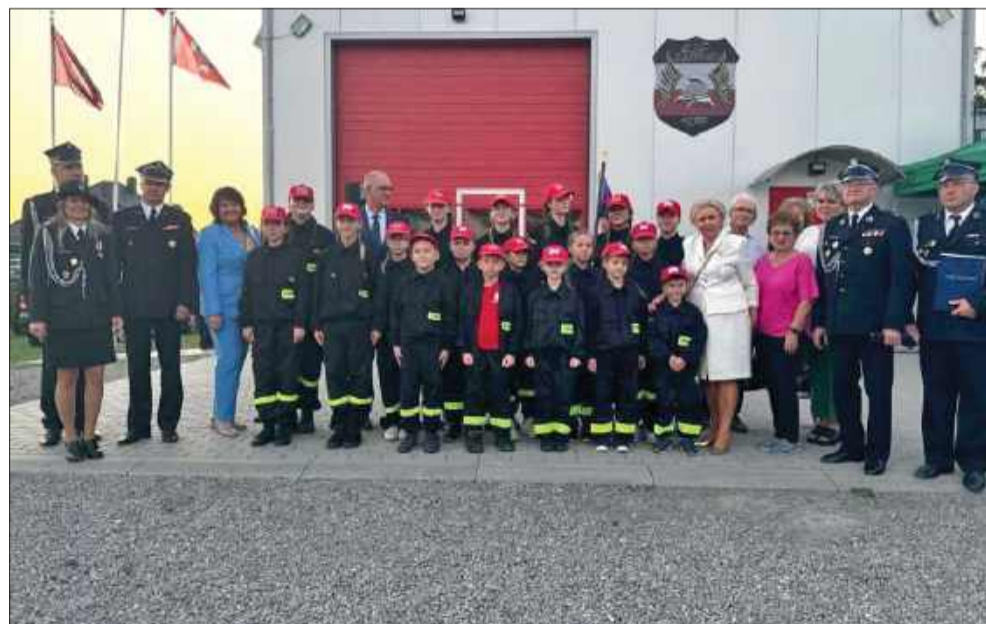
Wspólne zdjęcie uczestników uroczystości na placu OSP w Złotnikach.