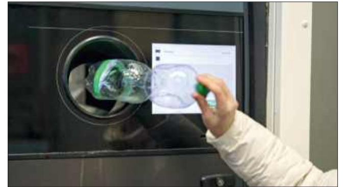
Potrzeba czasu, by system kaucyjny działał sprawnie.