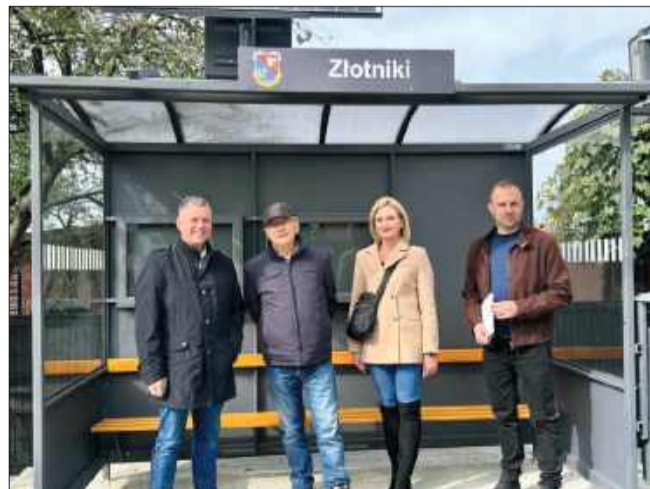
Na takim przystanku miło będzie czekać na autobus.

Wartość inwestycji wyniosła 497 259,82 zł brutto. Marta Warias