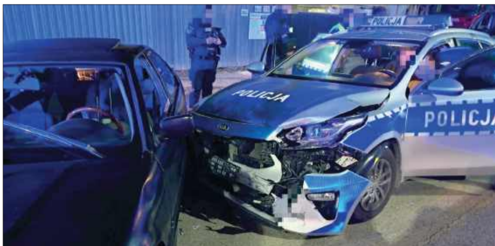
Uciekał przed policją ulicami Mielca. 20-latek z Borowej zatrzymany po pościgu

Mężczyzna odpowie za swoje czyny przed Sądem Rejonowym w Mielcu. Marta Warias