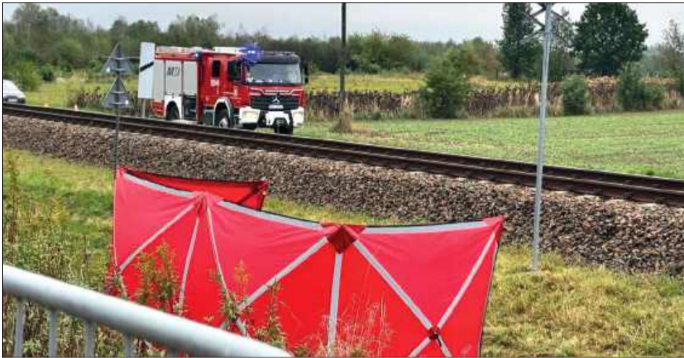
Tragiczny wypadek zabrał życie dwóch osób.