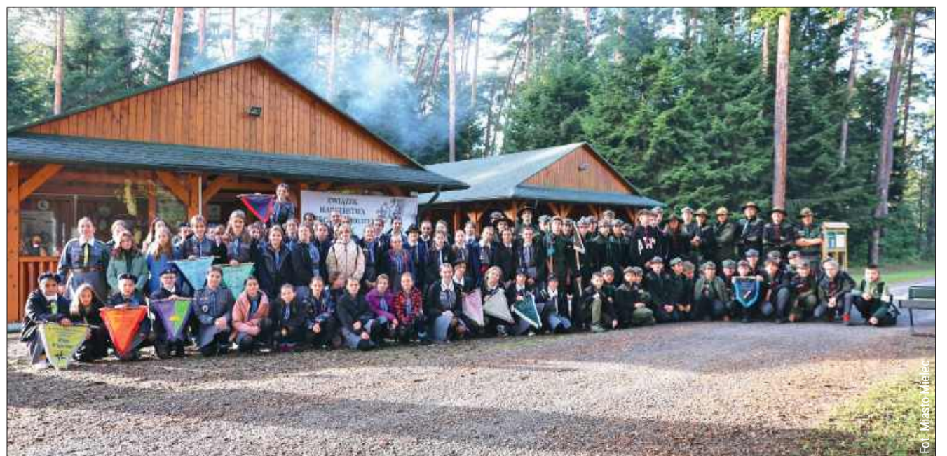
Grupa ZHP Mielec