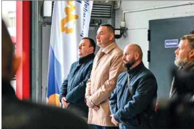
Wiceprezydenci również byli obecni na konferencji.

Aby jednak faktycznie skorzystać z tego uprawnienia, nie wystarczy samo zameldowanie w Mielcu. Niezbędna będzie imienna Mielecka Karta Miejska (MKS, MKR3+ lub aplikacja mobilna), na której zostanie zapisany bezpłatny bilet.