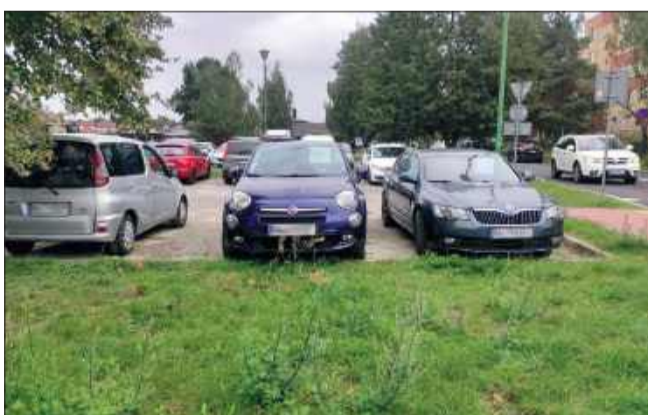
Wiele samochodów ma kartkę z napisem „Na sprzedaż”.

Mieszkańcy osiedla Szafera alarmują, że ich parkingi coraz częściej zmieniają się w nielegalną giełdę samochodową. Tuż przy rondzie, na miejscach postojowych przeznaczonych dla lokatorów, od dłuższego czasu można zobaczyć kilkanaście aut z kartkami „kupię”, „sprzedam” za szybą.