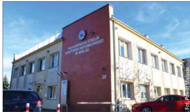
Stacja Pogotowia Ratunkowego w Mielcu