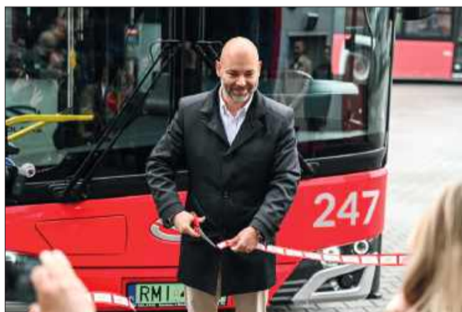
Przecięcie wstęgi stworzonej z dawnych biletów