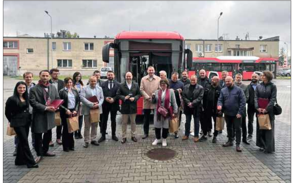
Pamiątkowe zdjęcie przed mieleckim MKS-em.

Darmowa komunikacja obejmuje strefę miejską „0”, czyli wszystkie przystanki znajdujące się w granicach administracyjnych Mielca. Podróżując dalej do gminy Mielec (strefa „1”) lub poza nią (strefa „2”) pasa-