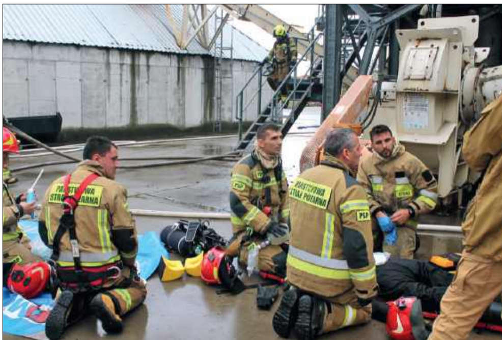
Wspólne działania umożliwiły praktyczne sprawdzenie procedur.

W dniach 29 września - 1 października 2025 roku na terenie zakładu Kronospan Polska w Mielcu odbyły się szeroko zakrojone ćwiczenia ratowniczo-gaśnicze zorganizowane przez Komendę Powiatową Państwowej Straży Pożarnej w Mielcu. W manewrach udział wzięli strażacy PSP, jednostki OSP z powiatu mieleckiego, Zakładowy Zespół Ratowniczy oraz służby współdziałające.