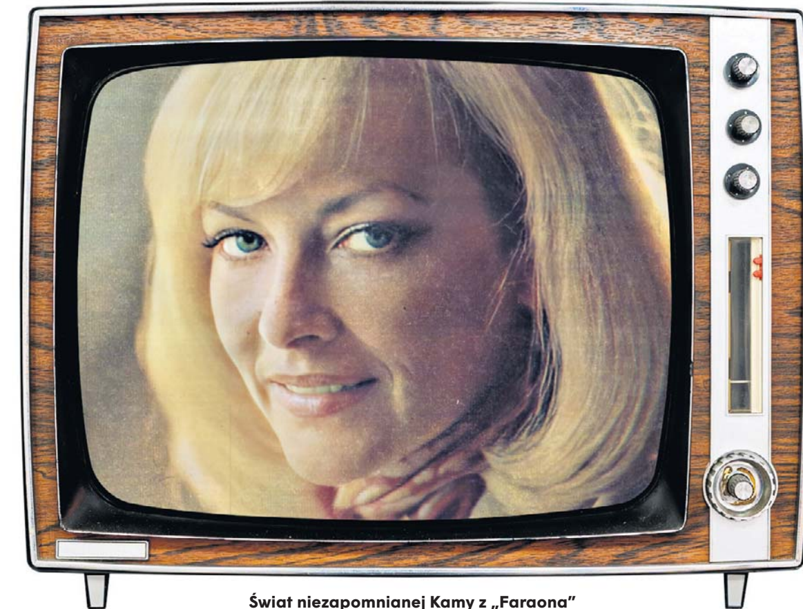
Świat niezapomnianej Kamy z „Faraona” i Krzysi z „Pana Wołodyjowskiego” zawalił się w 1993 roku. Aktorka przeżyła osobistą tragedię. Po śmierci córki wycofała się z życia publicznego