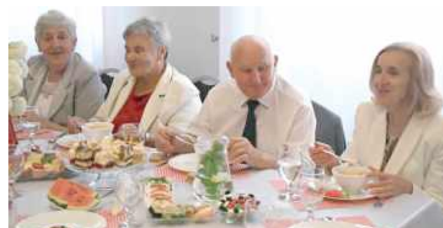
Humory dopisywały seniorom, którzy mieli okazję spotkać się w większym gronie