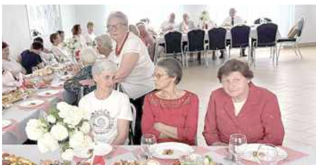
Wspólny obiad i serdeczna atmosfera były okazją do integracji mieszkańców oraz rozmów przy jednym stole