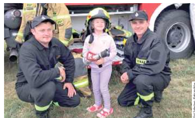
Uczestnicy mogli z bliska obejrzeć wyposażenie wozów strażackich i poznać specyfikę ich pracy