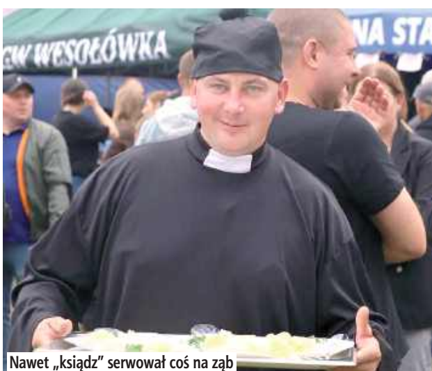
Nawet „ksiądz” serwował coś na ząb