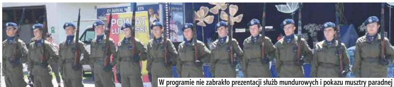
W programie nie zabrakło prezentacji służb mundurowych i pokazu musztry parady

spotkania i wspólnego spędzenia czasu. W programie znalazły się występy artystyczne, prezentacje służb mundurowych oraz pokaz