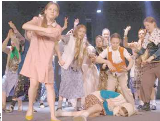
To było święto dziecięcej wyobraźni, kreatywności i scenicznej odwagi