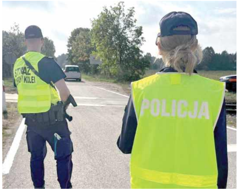
Na szlaku kolejowym Dziewule - Łuków w rejonie przejazdu kolejowo-drogowego funkcjonariusze z Posterunku Straży Ochrony Kolei w Łukowie i Komendy Powiatowej Policji w Łukowie zauważyli mężczyznę, który jechał hulajnogą z napędem elektrycznym po drodze publicznej

49-letni łukowianin, zamiast odbywać zasłużoną karę więzienia, hulał w okolicy Łukowa na hulajnodze i został zatrzymany podczas rutynowej kontroli w rejonie przejazdu kolejowego. Jak podaje Straż Ochrony Kolei, podczas legitymowania okazało się, że mężczyzna jest poszukiwany do odbycia kary 6 miesięcy pozbawienia wolności.