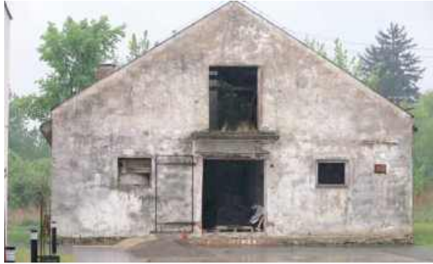
Całkowita wartość przedsięwzięcia wynosi 2 420 807,28 zł, z czego 1 810 800 zł stanowi dofinansowanie pozyskane w ramach programu OLiOC

Przedsięwzięcie będzie polegało na adaptacji istniejącego budynku należącego do powiatu.