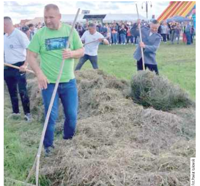
W czasie festynu zorganizowano różne konkurencje, nawet wójt sięgnął po grabie