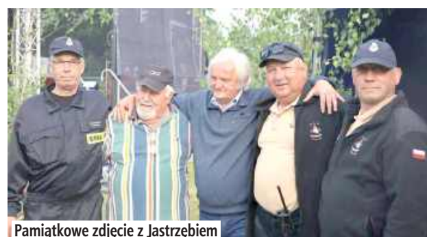
Pamiątkowe zdjęcie z Jastrzębiem