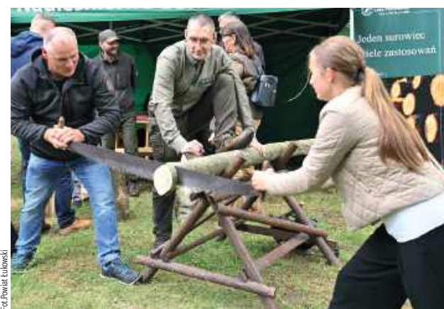
Konkurencje stolarskie przyciągnęły zarówno dzieci, jak i dorosłych