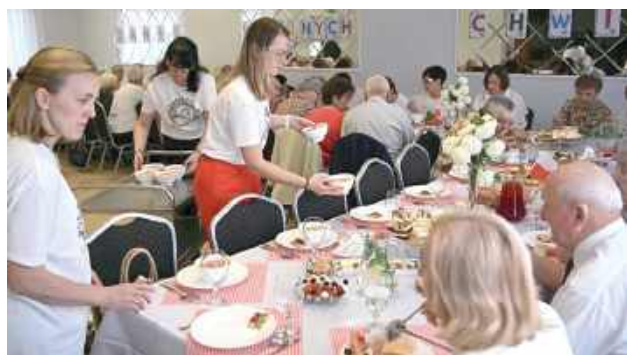
Pyszny posiłek przygotowały panie z KGW Gołaszynianki