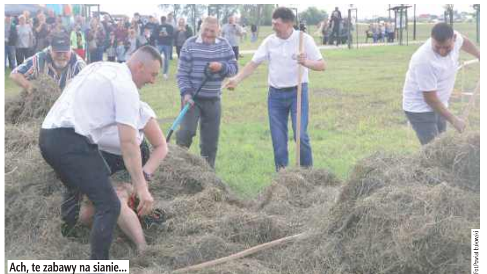
Ach, te zabawy na sianie...