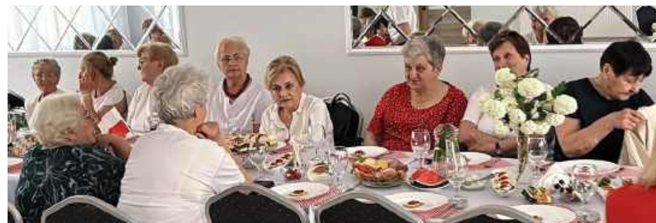
Wspólny obiad, rozmowy i dobra atmosfera towarzyszyły uczestnikom spotkania w świetlicy wiejskiej w Gołaszynie

GMINA ŁUKÓW: W świetlicy wiejskiej w Gołaszynie odbyło się drugie spotkanie seniorów w ramach programu „Danie Wspólnych Chwil” Fundacji Biedronki zorganizowane przez Koło Gospodyń Wiejskich Gołaszynianki. Nie zabrakło wspólnego posiłku i praktycznych wskazówek dotyczących zdrowia.