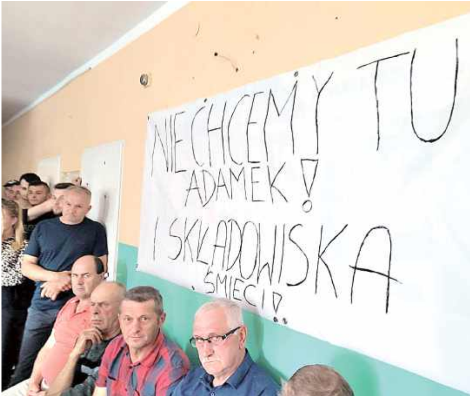
„Nie chcemy tu Adamek i składowiska śmieci” - taki transparent przynieśli mieszkańcy Zakępia i okolic