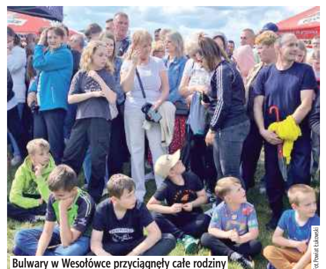
Bulwary w Wesołówce przyciągnęły całe rodziny