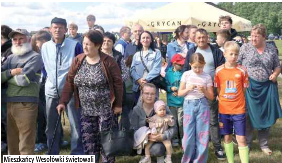
Mieszkańcy Wesołówki świętowali