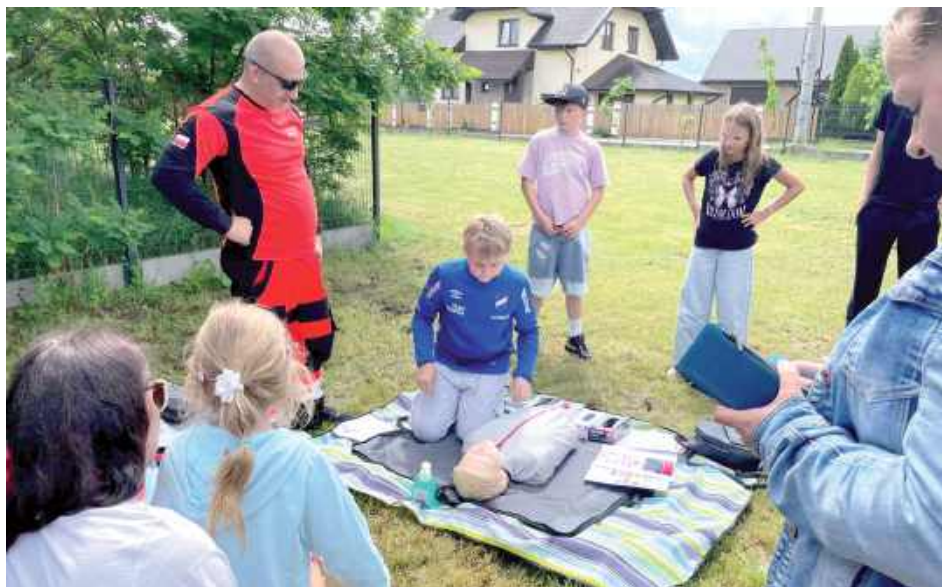
Podczas festynu nie zabrakło zajęć z pierwszej pomocy, które wzbudziły zainteresowanie najmłodszych

Tego dnia w Aleksandrowie zrobiło się tłoczno i gwarno! Festyn rodzinny przyciągnął bardzo dużo osób, a dzieci korzystały ze wszystkich atrakcji do ostatniej chwili. Dla najmłodszych były dmuchańce i zabawy. Piękne kolorowe tatuaże, pokazy straży pożarnej, policji i pokazy pierwszej pomocy. Dodatkowo był też pyszny poczęstunek w postaci kiełbaski