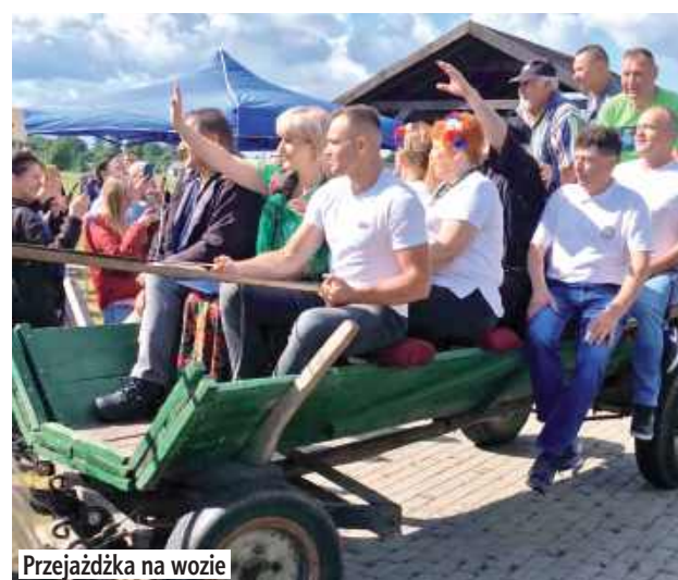
Przejażdżka na wozie