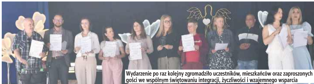
Wydarzenie po raz kolejny zgromadziło uczestników, mieszkańców oraz zaproszonych gości we wspólnym świętowaniu integracji, życzliwości i wzajemnego wsparcia

Występy artystyczne, pokazy służb mundurowych, liczne atrakcje i wspólna zabawa przy muzyce – tak przebiegał XIII Piknik Integracyjny „Razem Raźniej”, który 17 czerwca zgromadził na terenie Środowiskowego Domu Samopomocy w Anielinie uczestników placówki, mieszkańców oraz zaproszonych gości.