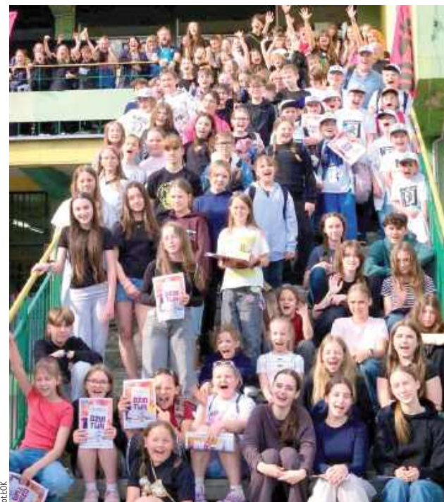
Wydarzenie, które jest najstarszym festiwalem teatrów dziecięcych w Polsce odbyło się w dniach 20-22 maja w Miejskiej Strefie Kultury – Centrum Edukacji Kulturowej „Na Żubardzkiej” w Łodzi