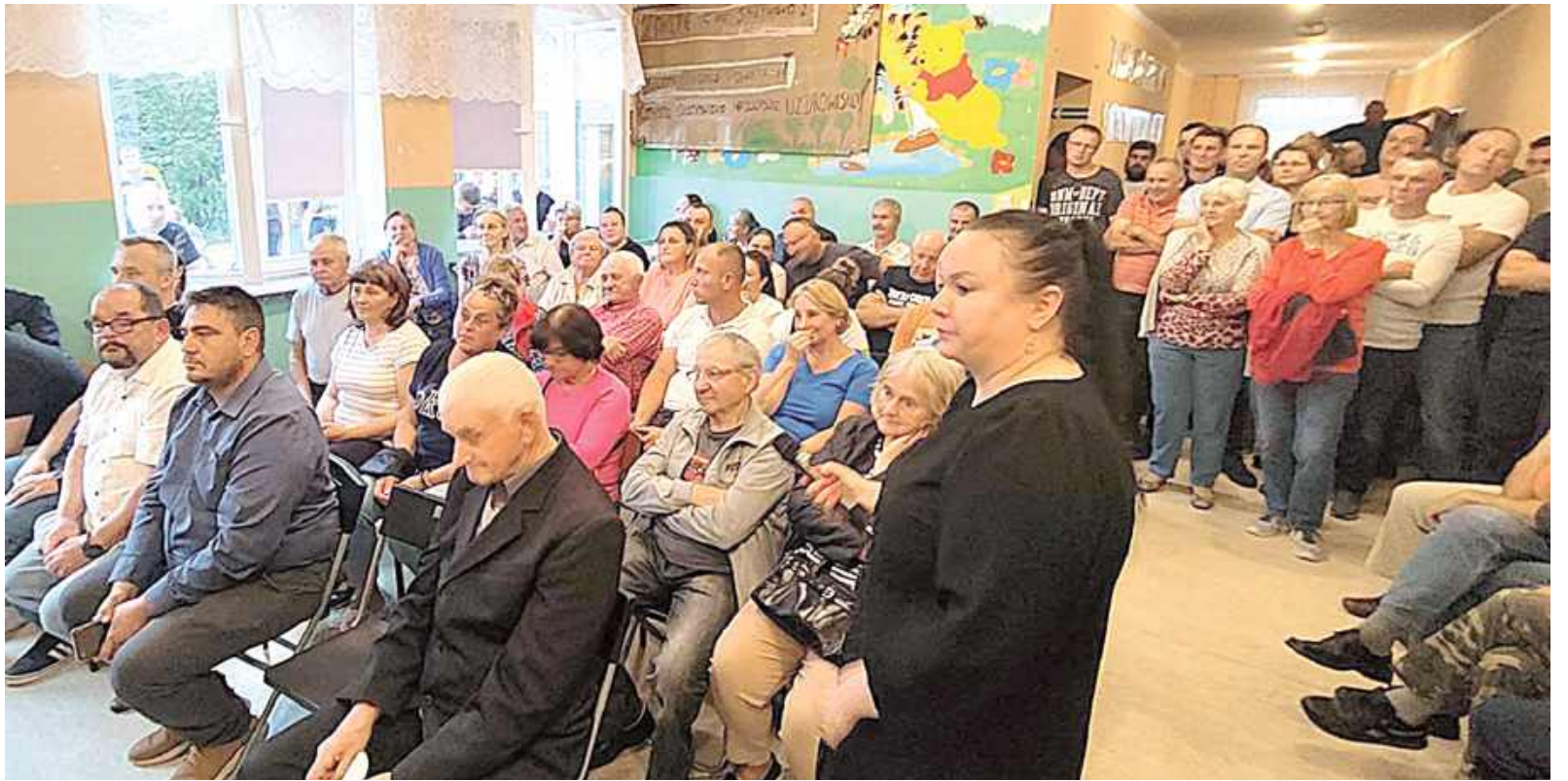
18 czerwca w świetlicy w Zakepiu odbyło się spotkanie mieszkańców. Przyszło około 150 osób. Ludzie nie mieścili się w środku. Wiele osób stało na dworze i przy otwartych oknach

Nie chcą do tego wracać. Uważają, że powstanie nowego składowiska spowoduje ogromny smród rozkładających się odpadów i drastyczny wzrost natężenia ruchu samochodów ciężarowych. To zagrazi bezpieczeństwu na drogach. Wielkie ilości śmieci przyciągną plagę ptactwa, gryzoni i insektów. Może dojść do skażenia rzeki Motwicy i wód podziemnych, a działki i domy w okolicy wysypiska bardzo stracą na wartości.