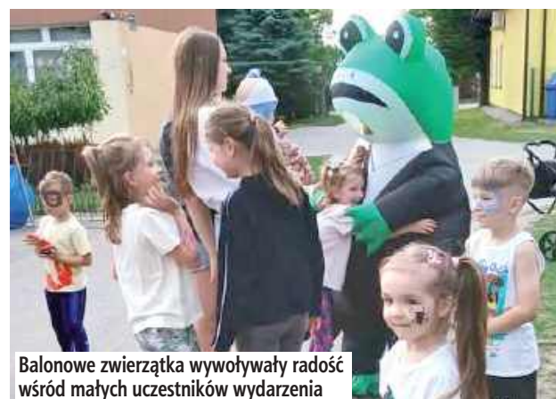
Balonowe zwierzątka wywoływały radość wśród małych uczestników wydarzenia