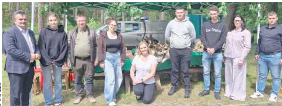
Festyn „Drzewa Naszych Lasów – Dąb” zgromadził mieszkańców powiatu łukowskiego w Centrum Promocji Drewna w Zdżarach

Tłumy mieszkańców powiatu łukowskiego oraz gości odwiedziły Festyn Rodzinny „Drzewa Naszych Lasów – Dąb”, który odbył się na terenie Centrum Promocji Drewna w Zdżarach.