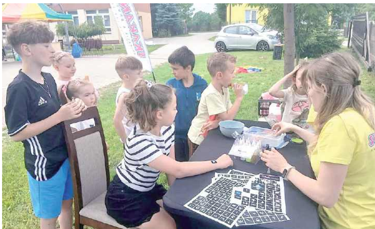
Na najmłodszych czekało mnóstwo atrakcji – m.in. zmywalne tatuaże

GMINA ŁUKÓW: W Gołąbkach odbył się pełen radości Piknik Rodzinny. Na najmłodszych czekało mnóstwo atrakcji – wspólne zabawy z animatorami, kolorowa chusta animacyjna, balonowe zwierzątka, konkursy i gry ruchowe.