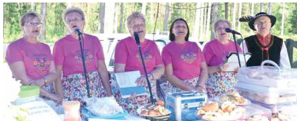
Wystawcy przygotowali liczne stoiska dla odwiedzających