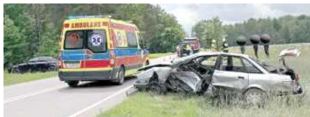
W wyniku zderzenia oba samochody zostały poważnie uszkodzone. Dwie osoby zostały przewiezione do szpitala na dalszą diagnostykę i leczenie

Do akcji zostali zadysponowani strażacy z OSP KSRG Krzywda, OSP Drożdżak oraz strażacy z Jednostki Ratow-