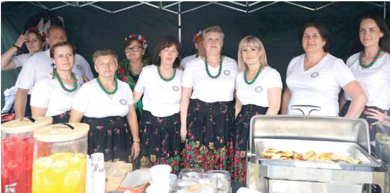
Stoiska KGW kusyły smakołykami