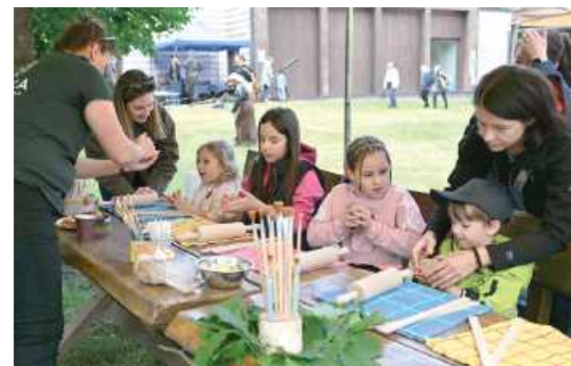
Dzieci chętnie korzystały z przygotowanych atrakcji