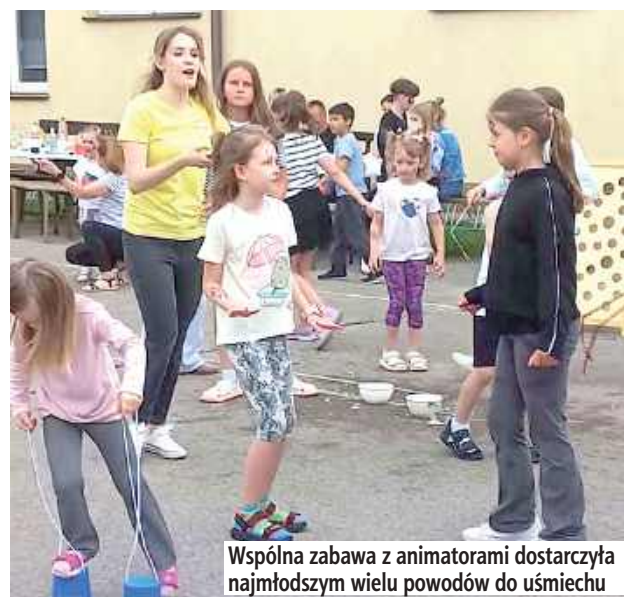
Wspólna zabawa z animatorami dostarczyła najmłodszym wielu powodów do uśmiechu

mosferze. Uczestnicy dziękują wszystkim, którzy się wspólnie bawili, organizatorom, animatorom oraz osobom zaangażowanym w przygotowanie tego pięknego wydarzenia.