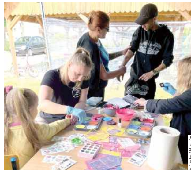
Biblioteka Publiczna w Aleksandrowie przygotowała kącik artystyczny oraz kreatywne zabawy dla dzieci

- Mamy nadzieję, że impreza mimo wątpliwej pogody podobała się wszystkim uczestnikom i wierzymy, że za rok również będziemy mogli ugościć wszystkich ponownie – dodają.