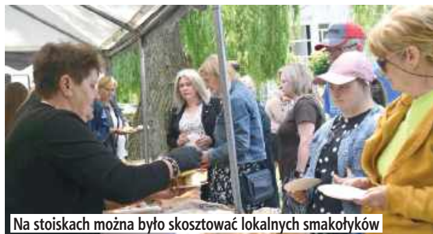
Na stoiskach można było skosztować lokalnych smakołyków