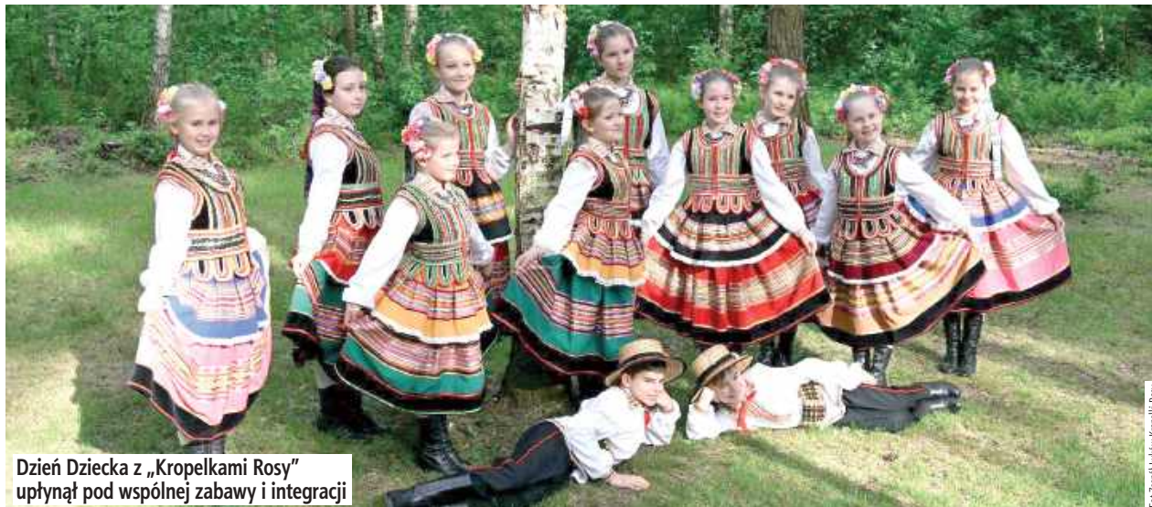
Dzień Dziecka z „Kropelkami Rosy” upłynął pod wspólnej zabawy i integracji