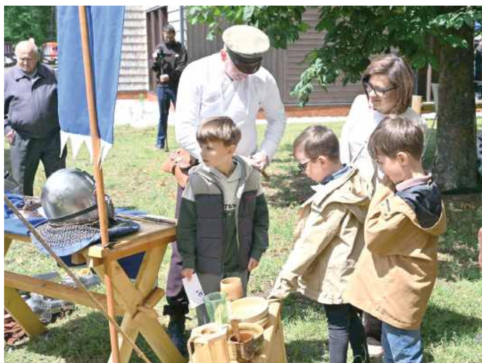
Atrakcje czekały na małych i dużych