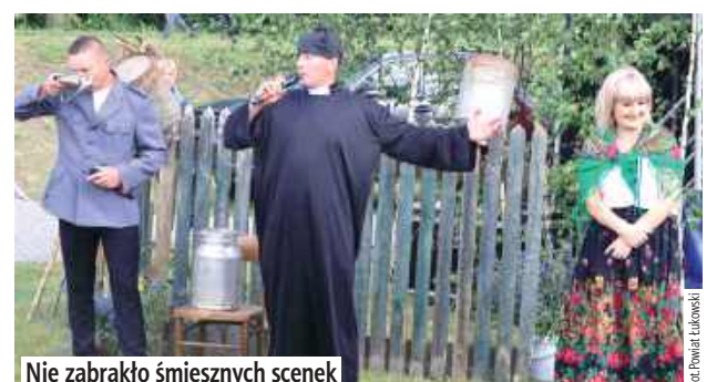
Nie zabrakło śmiesznych scenek