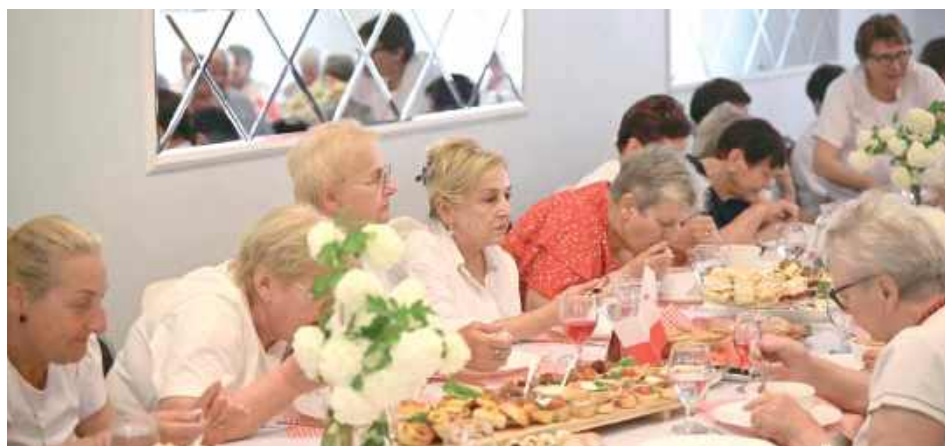
Program „Danie Wspólnych Chwil” po raz kolejny połączył mieszkańców Gołaszyna przy wspólnym stole