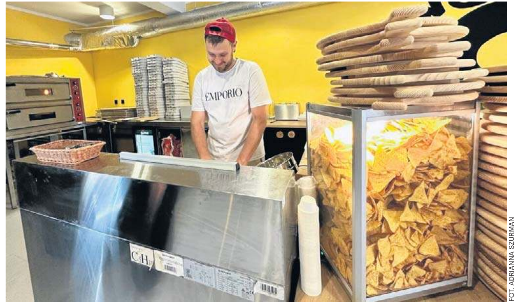
Bike Pizza w Szczawno-Zdroju już czynna. Nowa restauracja kusi włoskimi smakami.

Jest także sześć rodzajów win z nalewaka, świetnie wyglądają beczki na ścianach. Do wyboru trzy czerwone i trzy białe. Znajdzie się także aperol i piwo.