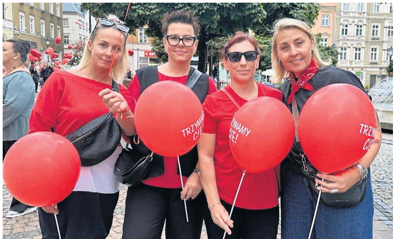
Marsz wyruszył spod wałbrzyskiego „Energetyka”. Młodzież i dorośli przeszli ulicą Słowackiego aż do Rynku.