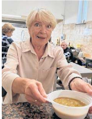
Jednym z festynowych przysmaków była grochówka.

Na wysokości zadania stanęła wówczas forma Sirbud Minari, której prezesem był śp.