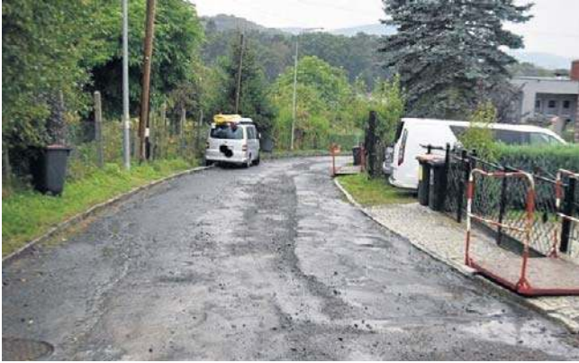
Ulicę Radomską trudno dziś nazwać reprezentacyjną arterią Wałbrzyska. Jeszcze w tym roku to się jednak zmieni.