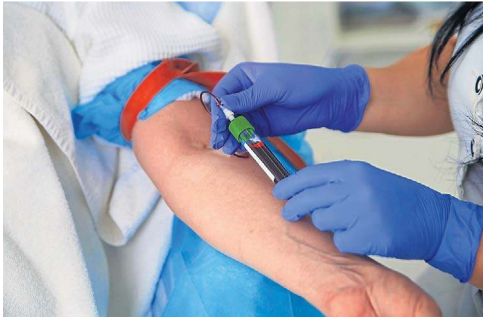
Choroba z początku nie daje objawów. Badania pomogą ją wykryć na wczesnym etapie.