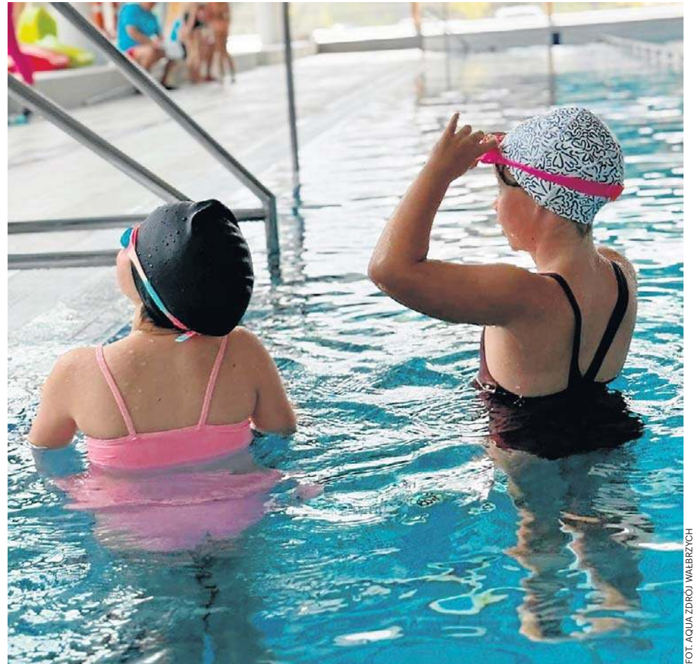
W Wałbrzychu od 14 lat jest prowadzony bezpłatny, Miejski Program Nauki Pływania.

Ponad 200 osób wzięło udział w zorganizowanym 13 września w Sokołowsku XIV Festiwalu Nordic Walking Ziemi Wałbrzyskiej. Uczestnicy tej imprezy z kilkunastoletnią już tradycją nie przestraszyli się zapowiedzi trochę gorszej pogody. Wędrówka z kijkami po pięknej, maleńkiej miejscowości w gminie Miroszów i jej okolicach była więc bardzo przyjemna i dała uczestnikom wiele satysfakcji. Zarówno tym, którzy wybrali dystans 5 km, jak i maszerującym przez 10 km. PG