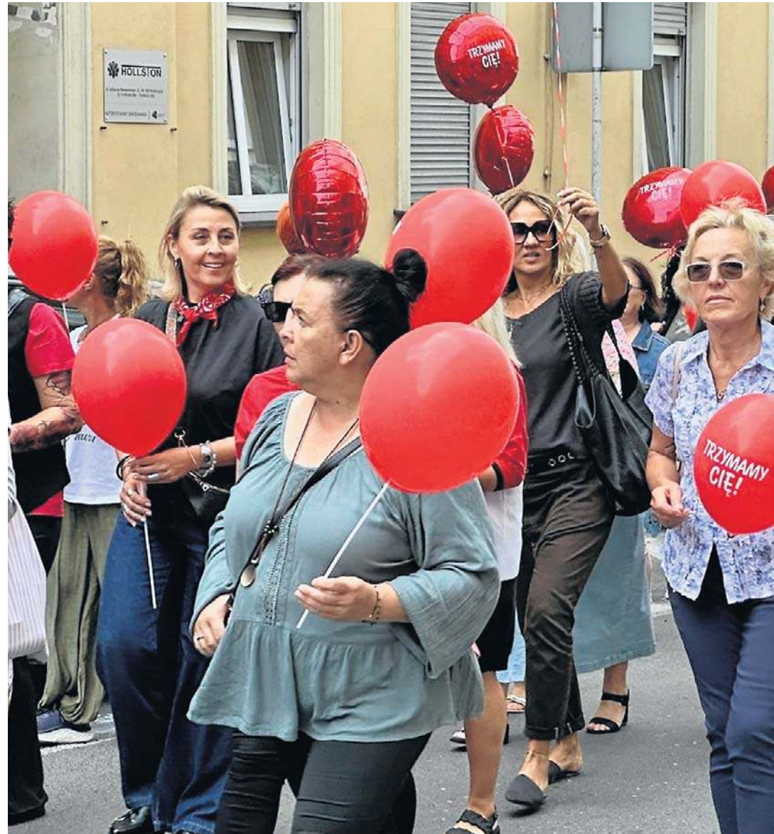
Ulicami Wałbrzyska przeszły 10 września setki uczniów szkół, nauczycieli i przedstawicieli inst