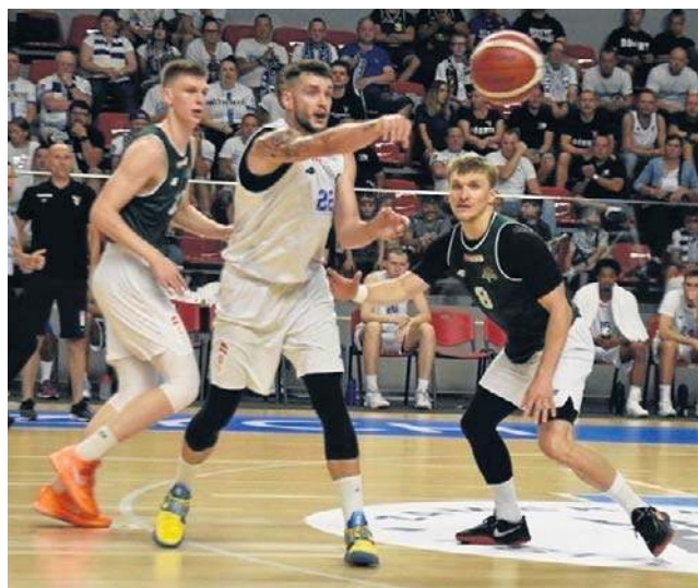
27 i 28 września Górnik zagra w Warszawie o Superpuchar Polski. W półfinale zmierzy się ze Startem Lublin.