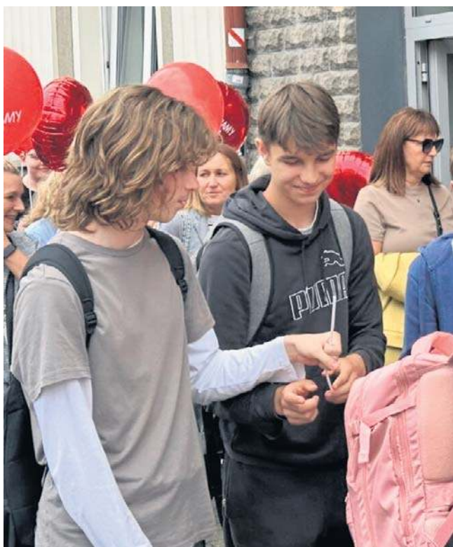
Uczestnicy marszu nieśli 127 czerwonych balonów. Tyle było w ostatnim czasie samobójczych śmierci uczniów...