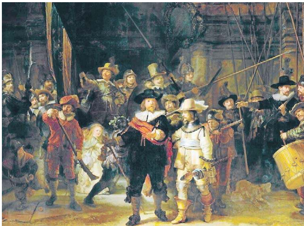
„Kompania Fransa Banninga Cocq i Willema van Ruytenburgha” lub „Straż nocna” albo „Wymarsz strzelców” znajduje się w zbiorach Rijksmuseum w Amsterdamie.

Nie był to pierwszy akt wandalizmu wobec tego obrazu, ani ostatni. Historycy sztuki od dawna zastanawiają się więc nad jego fenomenem, choć może o zdanie trzeba by spytać także psychologów albo chemików?