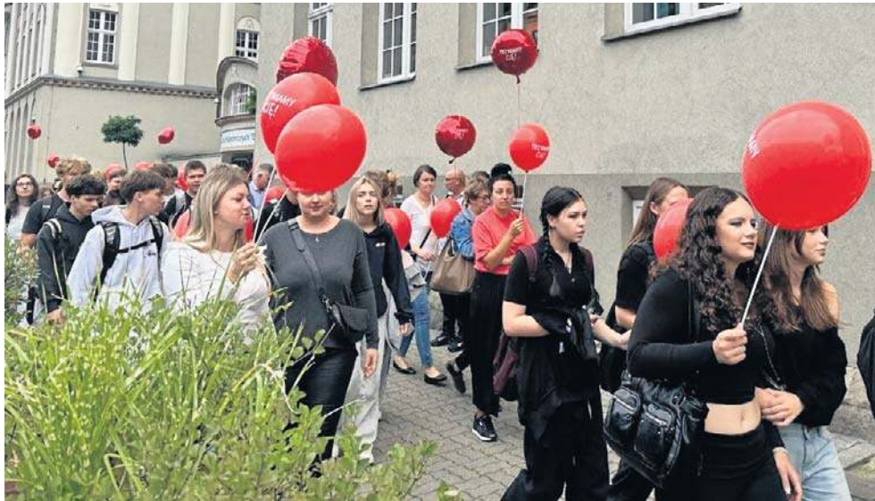
Marsz zorganizowano w ramach Światowego Dnia Zapobiegania Samobójstwom.