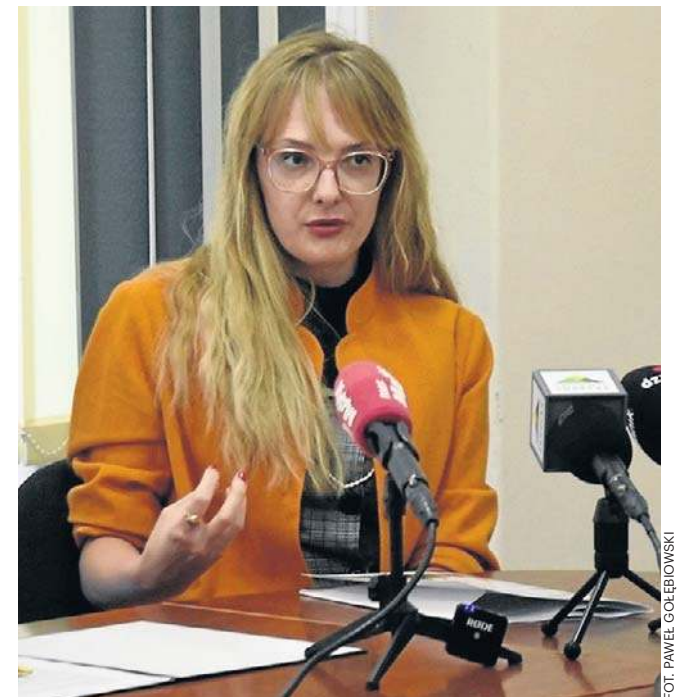
Organizatorzy projektu „Równi, choć różni” przekonują, iż będzie on skutecznie zapobiegał dyskryminacji seniorów.

- Polityka senioralna do 2023 roku była realizowana wyłącznie przez samorządy gminne. Od tego momentu jest zadaniem jednostek powiatu. Doświadczenia z panem starostą do wniosku, że należy to traktować jako uzupełnienie obszernej już realizowanych działań