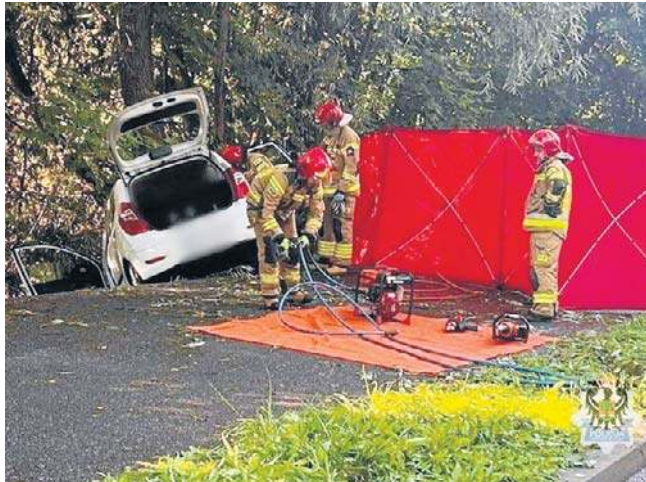
Policja wyjaśnia okoliczności wypadku na ul. Świdnickiej. Jedna osoba nie żyje, jedna jest ciężko ranna.