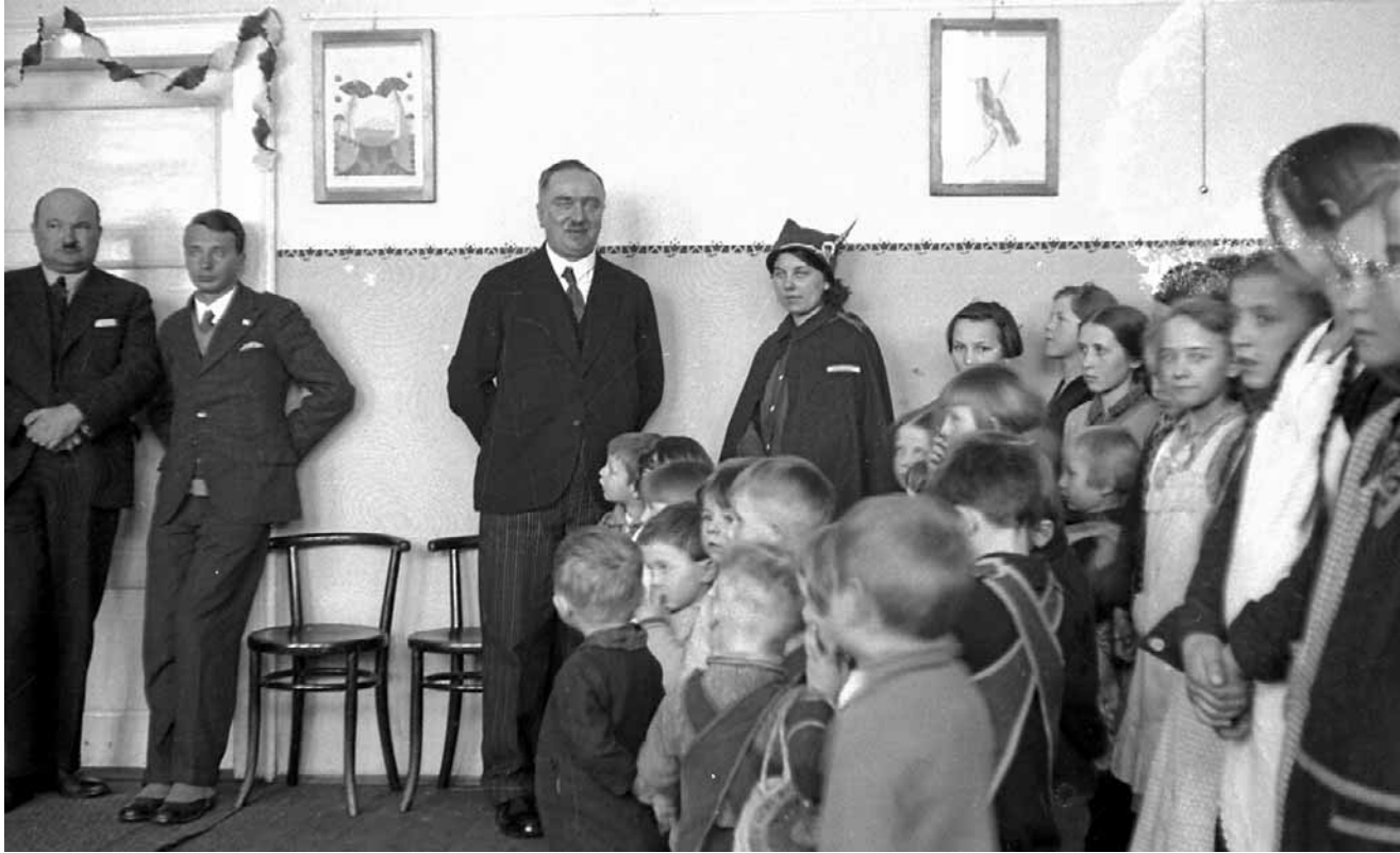
W okresie międzywojennym na Śląsku obowiązywało prawo, zabraniające pracy w szkołach nauczycielkom mężatkom. Kobiety przy tablicy były niemiłe widziane. Wyjątkiem były nauczycielki panny.

Wśród nauczycieli, którzy trafili na Śląsk sporo było kobiet. Chciały nie tylko nieść kaganek oświaty, ale także zarabiać i układać sobie życie prywatne. Trafiły jednak do środowisk żyjących własnym stylem, z odmiennym etosem pracy i systemem wartości. Zderzyły się z konserwatywną śląskością, która miała zupełnie inne spojrzenie na miejsce i rolę kobiety w codziennym życiu. Istotną barierą okazał się także język. Powszechna na Śląsku godka nie ułatwiała wzajemnych rela-