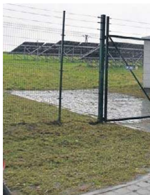
Nowa farma fotowoltaiczna da ogromne oszczędności.

Prezydent Nogajczyk zdradza, że instalacji fotowoltaicznych powstanie w mieście więcej. M.in. farmy przy ul. Internatowej będą zapewniały dostawę energii dla I i II liceum ogólnokształcącego. ©