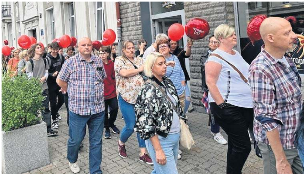
Akcja jest symbolem wsparcia wobec osób, przeżywających kryzys psychiczny.