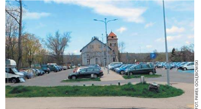
Miejscy urzędnicy uważają, iż dzięki opłatom zwiększy się dostępność miejsc dla najbardziej potrzebujących.

Teraz, zgodnie z zarządzeniem prezydenta miasta i uchwałą rady miejskiej, stał się płatnym placem parkingowym. Obowiązują na nim na-