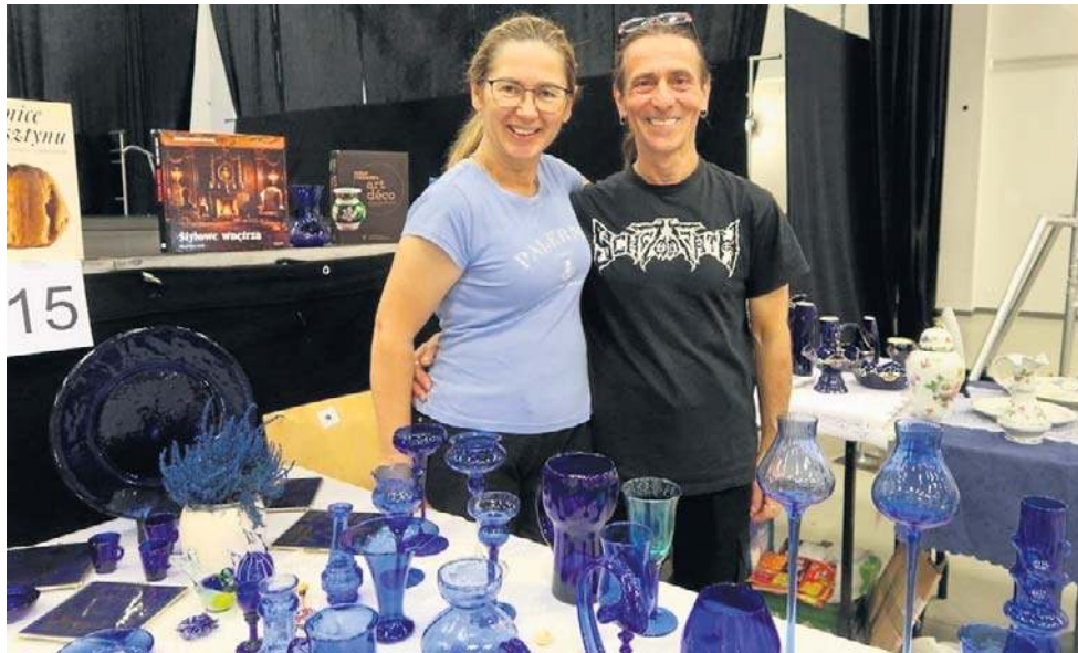
Uczestnicy giędy doskonale się znają. Niektórzy przyjeżdżają do Wałbrzyska co roku.

To było wyjątkowe wydarzenie dla pasjonatów kolekcjonerstwa i miłośników przedmiotów z historią. W Starej Kopalni, w Sali Łańcuszkowej, odbyła się już 4. edycja Wałbrzyskiej Giędy Ceramiki i Porcelany. Trwała w obydwa dni całe popołudnia, do godz. 17. Swoje bogate, delikatne kolekcje zaprezentowało 24 wystawców - zarówno z Dolnego Śląska, jak też spoza regionu. To nieznacznie mniej niż w ubiegłym roku. Za to odwiedzający tegoroczną giędę dopisali wyjątkowo.