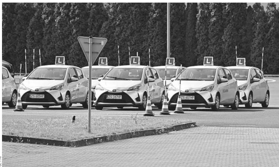
Nie wszystkim podoba się pomysł, by 17-latkowie mogli jeździć samochodami osobowymi

Już dziś w wielu krajach 17-latkowie mogą prowadzić auta. Tak jest obecnie m.in. w Austrii, Estonii, Francji, Danii, Luksemburgu, Holandii oraz w Niemczech, z tym że młodych kierowców obowiązują tam spore