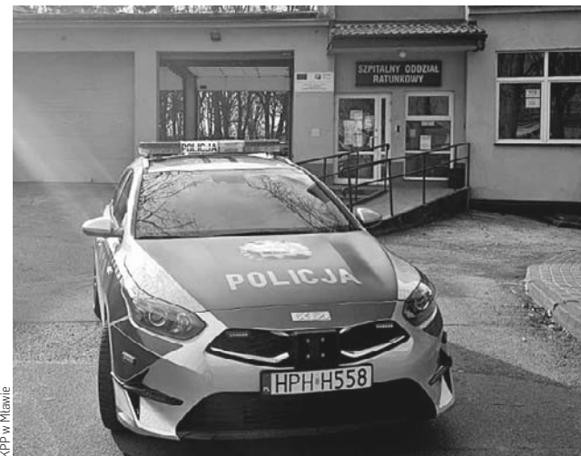
KPP w Mławie