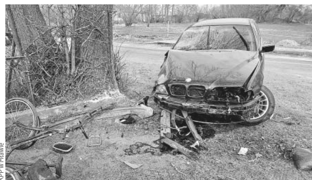
KPP w Mławie

Trwają czynności mławskiej policji i prokuratury w sprawie wypadku drogowego, w którym ranne zostały dwie osoby, w tym nietrzeźwy sprawca zdarzenia. Do wypadku doszło w sobotę rano (15.02), w Czarnocinku (gm. Strzegowo). Kierowca BMW, na łuku drogi stracił panowanie nad pojazdem, zjechał na przeciwny pas jezdni i uderzył w ogrodzenie posesji, a następnie w pieszego, wykonującego prace porządkowe na poboczu. W chwili zatrzymania, kierowca BMW miał ponad 2,6 promila alkoholu. Jak wynika