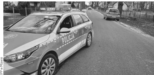
KPP w Mławie

Patrol ruchu drogowego, prowadzący pomiar prędkości na odcinku wskazanym przez użytkowników Krajowej Mapy Zagrożeń Bezpieczeństwa, zatrzymał kierującego toyotą, który w terenie zabudowanym jechał z prędkością 74 km/h. Podczas prowadzonej kontroli, policjanci sprawdzili stan trzeźwości kierującego.