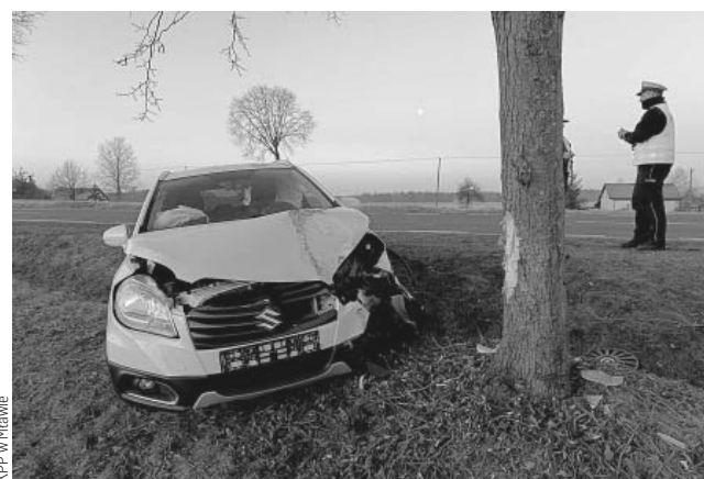
KPP w Mławie

Policja apeluje o dostosowanie prędkości do warunków ruchu i zachowanie szczególnej ostrożności na drodze. W poniedziałek rano (17.02), na odcinku drogi wojewódzkiej 615 w rejonie Trzcianki Kolonii, doszło do niebezpiecznego zdarzenia drogowego. Kierujący suzuki stracił panowanie nad pojazdem, zjechał do rowu i uderzył w drzewo. Kierowca suzuki, 40-letni mławianin oraz jadąca z nim pasażerka, zostali przewiezieni do szpitali w Mławie i Ciechanowie. Kierowca był trzeźwy. Jak oświadczył w rozmowie z policjantami, pracującymi na miejscu zdarzenia, zauważył psa na jezdni i wykonał gwałtowny manewr,