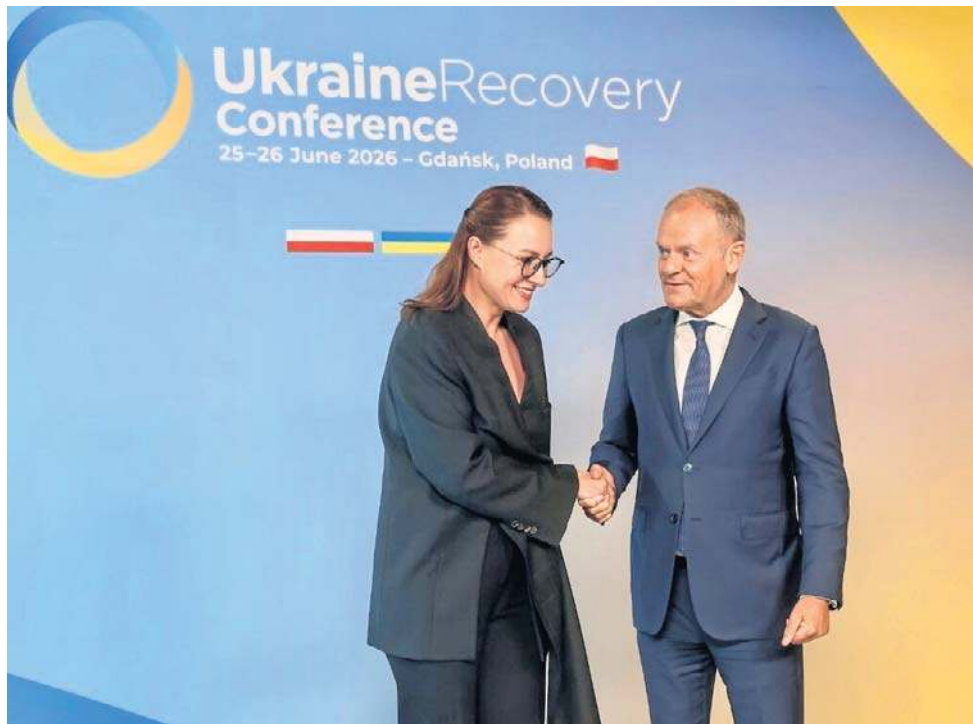
Gospodarzami były - przygotowujące wspólnie URC - Polska i Ukraina, które reprezentowali premierzy: Donald Tusk i Julia Swyrydenko

Zaznaczmy: łączna wartość zawartych umów to 10 mld zł.