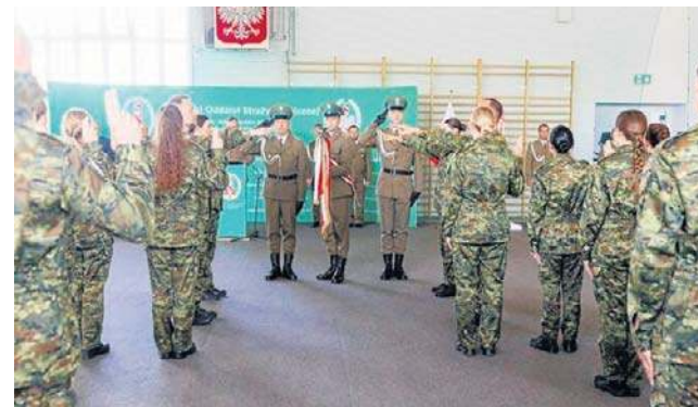
51 nowych funkcjonariuszy wstąpiło w piątek oficjalnie w szeregi Podlaskiego Oddziału Straży Granicznej

Jak podkreślał, Straż Graniczna odgrywa dziś szczególną rolę w systemie bezpieczeństwa państwa. - To właśnie nasi funkcjonariusze każdego dnia stoją na pierwszej linii ochrony granicy Rzeczypospolitej Pol-