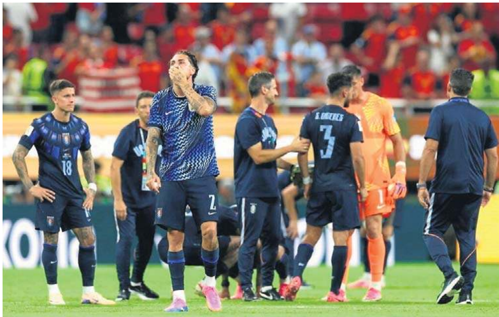
Piłkarze Urugwaju zawiedli, musieli wracać do ojczyzny na własną rękę...

Czołowa ekipa z Ameryki Południowej turniej rozpoczęła fatalnie, od remisu 1:1 z Arabią Saudyjską, a na dobrą sprawę mogła to spotkanie nawet przegrać. Mimo fatalnego wyniku szanse na awans były wciąż spore, bo następnym ry-