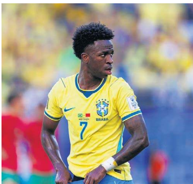
Vinicius Junior przyjechał w bardzo dobrej formie - również strzeleckiej - na północnoamerykański mundial

Oczywiście, liczba uczestników, a co za tym idzie - rozegranych spotkań - ma wpływ na grad bramek. W północnoamerykańskim turnieju mamy czterdzieści meczów więcej niż w poprzednim w Katarze, więc to naturalne, że w protokołach meczowych zapisało się więcej strzelców.