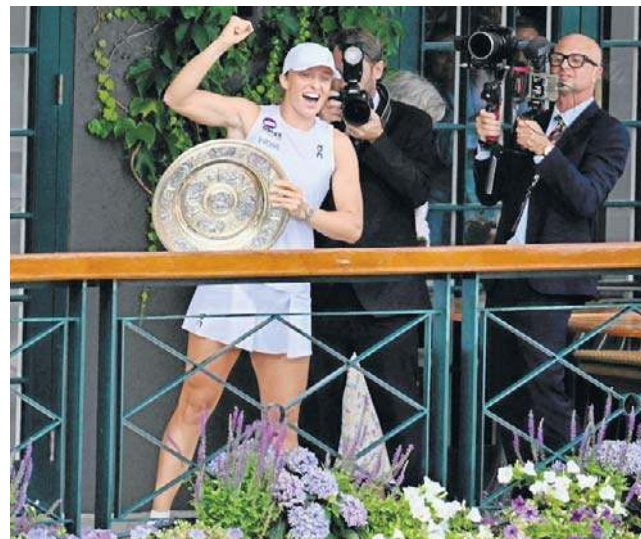
Tak Iga Świątek w zeszłym roku prezentowała się na balkonie kortu centralnego z trofeum Venus Rosewater Dish

- Oczywiście, mój sezon na trawie w 2025 roku był fantastyczny. Ale to nie jest tak, że zawsze czułam się na niej komfortowo. Tym razem nie nabrałam takiego rozpędu w Bad Homburg, jaki miałam w zeszłym roku. Czuję, że tę imprezę zacznę z zupełnie innej pozycji i dbam o to, żeby moje ambicje były skromne - powiedziała Świątek, zajmująca trze-