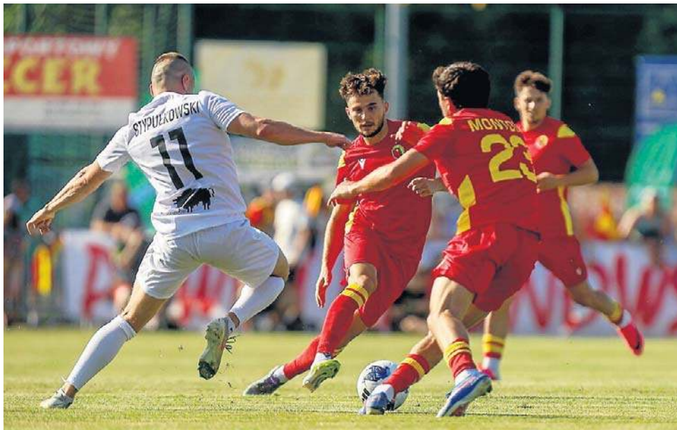
Jagiellonia (na czerwono) nie dała szans Reprezentacji Województwa Podlaskiego