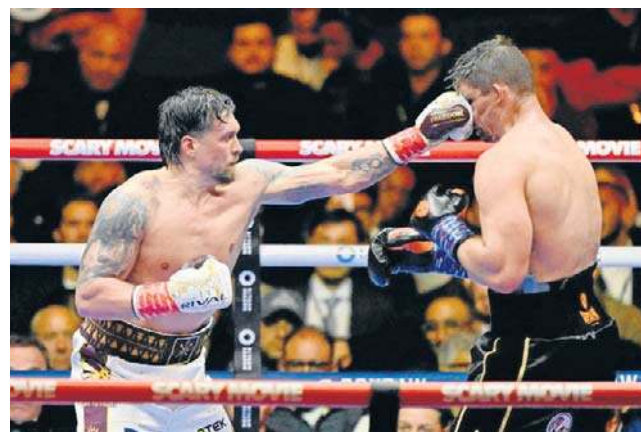
Oleksandr Usyk w ostatniej walce bokserkiej z kickbokserem Rico Verhoevenem był bliski porażki

„Dzisiaj jest dobry dzień, żeby powiedzieć, że chcę zrzec się wszystkich pasów, które obecnie posiadam. Oddajcie je, żeby ci, którzy stoją za nimi w kolejce, mogli się o nie boksować. Przyjaciele, rzekam się pasów, ale nie zrywam ze sportem. Został mi jeszcze jeden ostatni taniec. Chcę podziękować