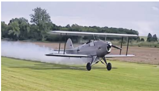
Podczas pobytu w gminie Przeworno piloci zaprezentowali swoje umiejętności