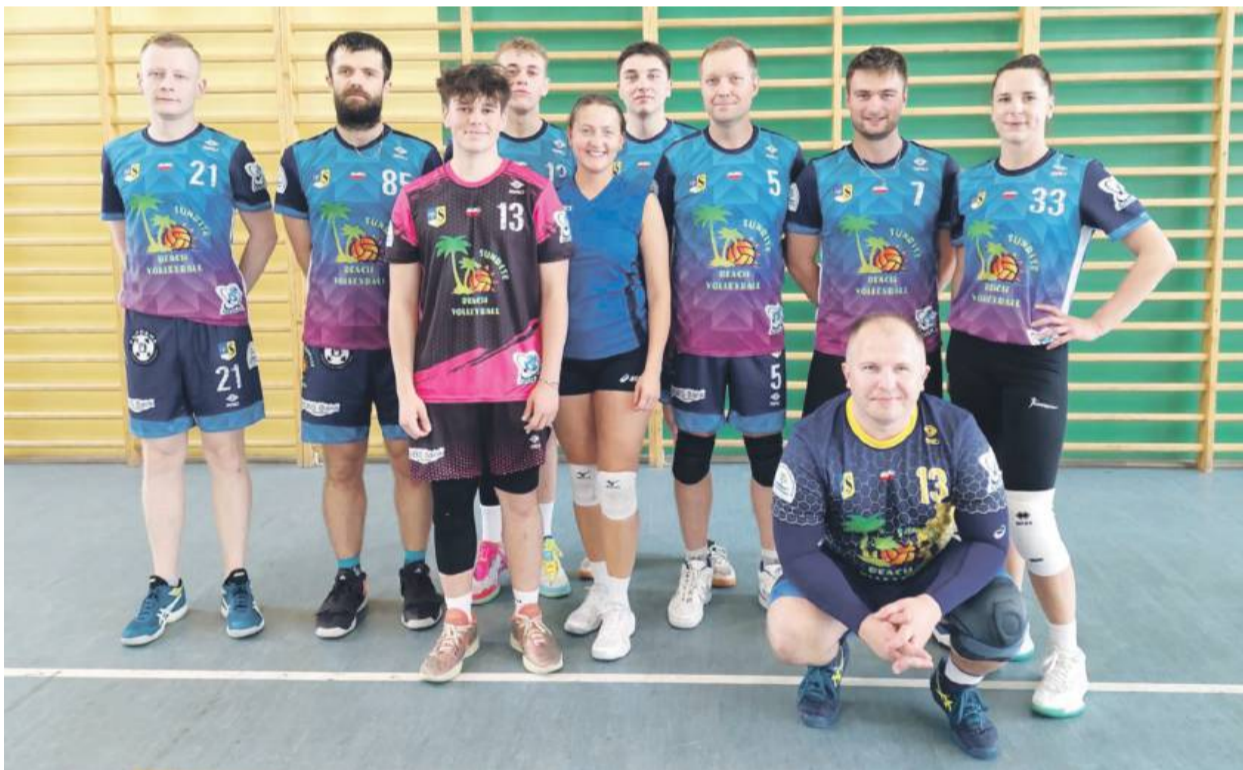
Ekipa Sunrise dotarła do finału