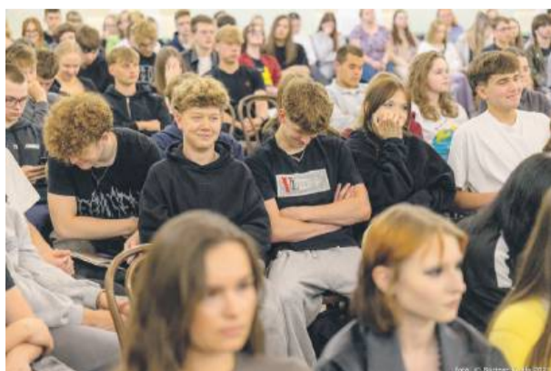
Debate w strzelińskim ogólniaku cieszyła się dużym zainteresowaniem, a aula szkolna wypełniła się uczniami z różnych klas.