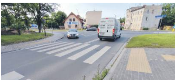
W godzinach zwiększonego ruchu wjazd na to skrzyżowanie z dróg podporządkowanych jest trudny i niebezpieczny