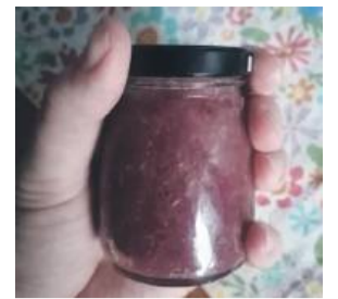
Czasem w słoiczkach zamknięte są nasze wspomnienia

2 godziny, aż puszczą sok. Róża i cukier powinny być zawsze w równych proporcjach. Przekładamy całość do makutry (jeśli ktoś nie ma – może użyć moździerza) i ucieramy na gładką masę. Pod koniec dodajemy sok z cytryny. Przekładamy do malutkich, dobrze wyparzonych, suchych słoiczków i zakręcamy.