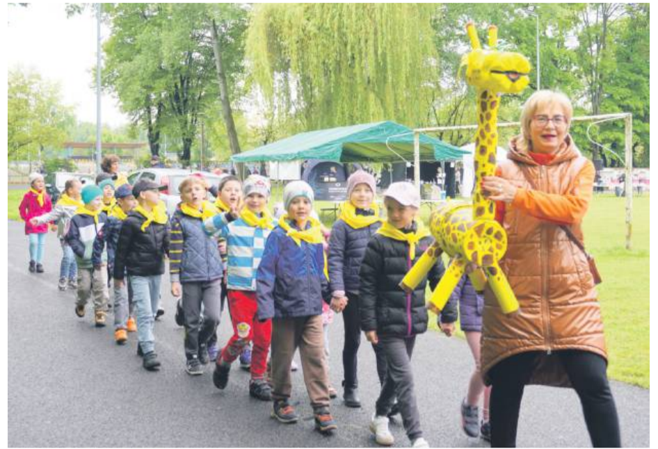
Festiwal rozpoczął się od parady eko-stworów