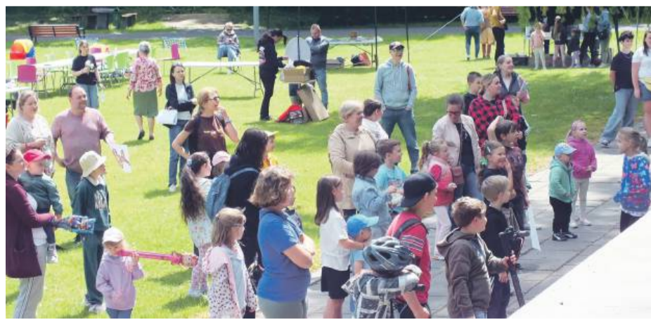
W wydarzeniu udział wzięły całe rodziny