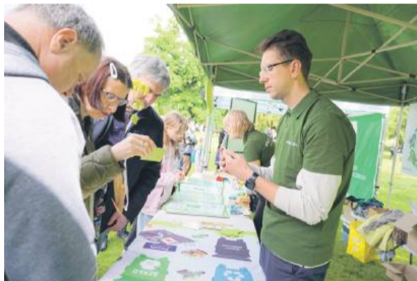
Uczestnicy mogli wziąć udział w różnych aktywnościach ekologicznych