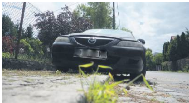
Mazda blokowała ruch pieszych przez kilka lat. Po naszej interwencji samochód zniknął z chodnika

Co należy robić z pojazdami, które blokują miejsca parkingowe, tarasują chod-