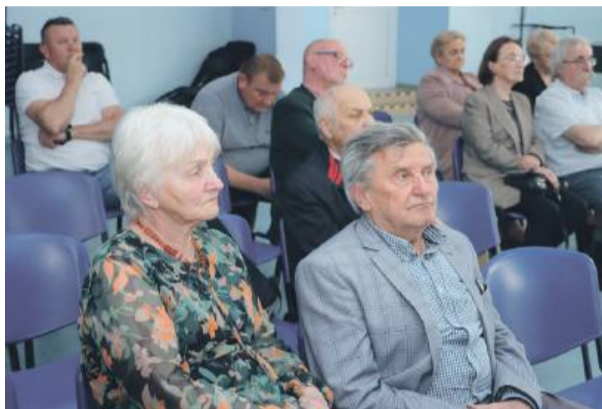
Na spotkania Klubu Piastowskiego „Myśląc Polska” przyjeżdżają również mieszkańcy spoza gminy Przeworno