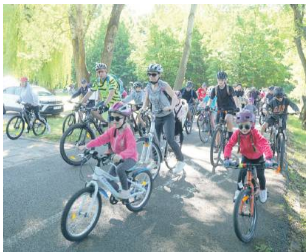
Wystartowało ponad 300 osób