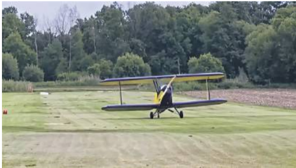
Nagranie wideo z niecodziennego wydarzenia jest dostępne na naszym profilu na Facebooku