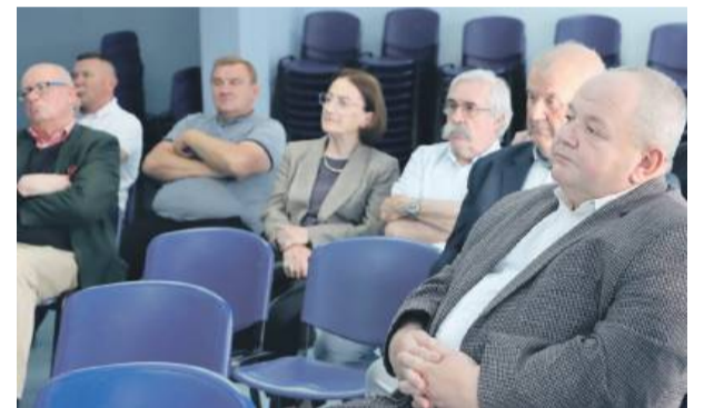
Obecni na sali z zainteresowaniem słuchali wykładu