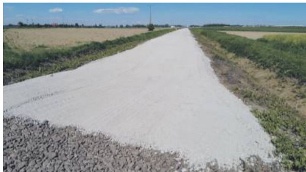
Już w wakacje zakończą się prace na trasie rowerowej Strzelin – Krzepice.

Prace budowlane dobiegają powoli końca i już w wakacje będzie możliwe korzystanie z nowej trasy, która sprzyjać będzie spacerom, jeździe na rowerze, a także na rolnkach. Z informacji uzyskanych od burmistrz