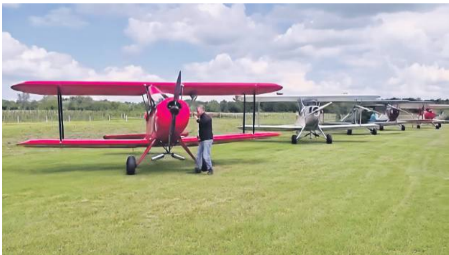
Osiem zabytkowych dwupłatowców i jedna awionetka z Niemiec niespodziewanie wylądowały na lokalnym pasie trawiastym w gminie Przeworno

Pięć najczęstszych błędów w odchudzaniu u kobiet po 30. roku życia