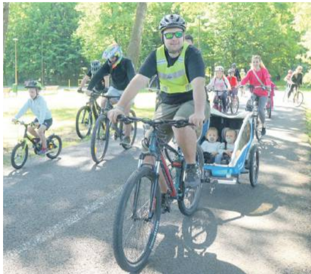
Najmłodszy pokonali trasę w specjalnych wózkach

W niedzielę, 25 maja, o godz. 10 z parku miejskiego w Strzelinie wystartował III Eko Rajd Rowerowy „Strzelin dla środowiska”.