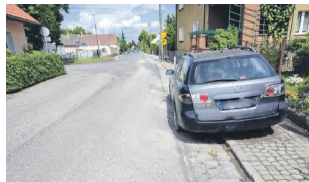
Stojący w tym miejscu samochód nie miał w kołach powietrza. Jego położenie sprawiało, że utrudniał mijanie się samochodów jadących widocznym fragmentem ul. Sosnowej

– Do usunięcia pojazdu uprawnionym jest również zarządca terenu. W przypadku gdy porzucenie samochodu ma miejsce w lesie, na parkingach czy na drogach wewnętrznych, które nie podlegają przepisom prawa o ruchu drogowym. W przypadku porzuconego samochodu na terenie prywatnym, np. parkingu pod sklepem, który nie wpisuje się do strefy ruchu, uprawnionym do usunięcia również pozostaje