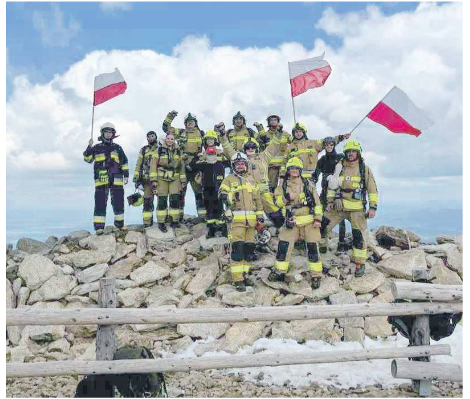
Na szczycie strażacy zrobili wspólne zdjęcie