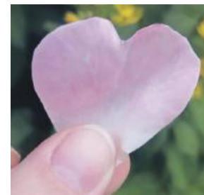
Warto stare przepisy podawać dalej, bo razem z nimi w świat idzie cała miłość, którą przekazywali nam nasi bliscy

Sposób przygotowania: Oczyszczone i osuszone płatki róży zasypujemy cukrem i odstawiamy na ok.