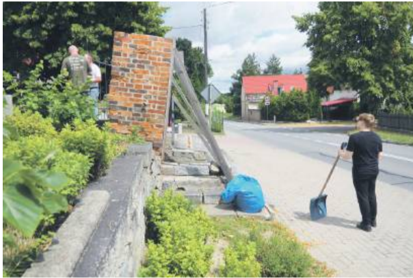
Od lat na remont czekają pochylone słupy bramy wejściowej

Co interesującego wydarzyło się w Starym Wiązowie? W ostatnim dziesięcioleciu nie doszło tu do żadnych dramatycznych zdarzeń. Ciekawostką są z pewnością kapliczki na posesjach i krzyże na polach. Nie wszyscy też wiedzą, że w okolicy wsi znajduje się średniowieczny cmentarz ofiar epidemii tyfusu. Niestety, źródła historyczne niewiele mówią na ten temat. Przez wieś przebiega droga krajowa nr 39.