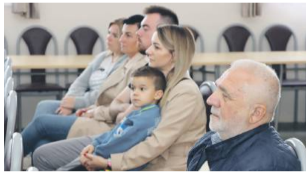
Podczas spotkania proponowano, żeby do strategii wpisać m.in. rewitalizację wieży widokowej na Gromniku i budowę ścieżek rowerowych na nieczynnych trasach kolejowych ze Strzelina do Przeworna

niewykorzystany potencjał turystyczny. Wskazywano m.in. na potrzebę zagospodarowania zbiornika zalewowego w Przewornie oraz terenu wokół Gromnika. Proponowano rewitalizację wieży widokowej i budowę ścieżek rowerowych na nieczynnych