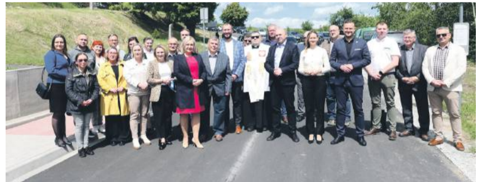
Ul. Kaczerki w Kuropatniku została oficjalnie otwarta w ubiegłym tygodniu