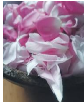
Zbierając róże na konfiturę, trzeba pamiętać, że znacznie zmniejszają swoją objętość

Jest ciepłe lato. Biegamy po babcinym podwórku w krótkich portkach, razem z nami kury. Czasem idziemy do sadu albo pogłaskać krowę. Do domu wpadamy tylko po to, żeby się napić i zjeść. W drodze do kuchni na szafce w korytarzu stoi duża metalowa miska z płatkami róży posypanymi cukrem. Je też zawsze wyjadamy. Babcia z tych płatków, które ocalały, robi potem konfiturę do pączków i ciasteczek. Kiedy przychodzi czas, w którym pachną róże, to wspomnienie do mnie wraca. Dwa lata temu postanowiłam sama zrobić taką konfiturę i czułam jakby babcia była tuż obok. Dziś podzielę się również z Wami tym babcinym przepisem.