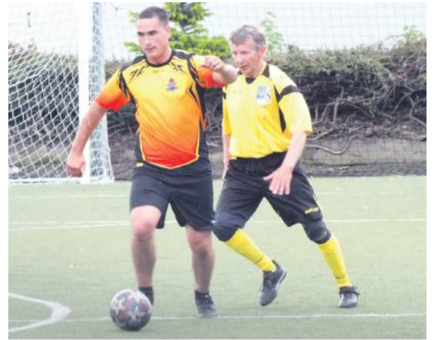
Na murawie rywalizowali m.in. strzeleńscy strażacy oraz gracze Strzelca