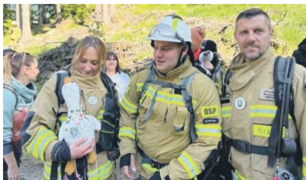
W wydarzeniu uczestniczyli strażacy z całej Polski, mieszkańcy regionu oraz sympatycy służb ratowniczych

Warunkiem uczestnictwa w akcji była wpłata dowolnej kwoty, tzw. wpisowego, które zostało przekazane na zbiórkę prowadzoną na portalu siepomaga.pl. – To była taka