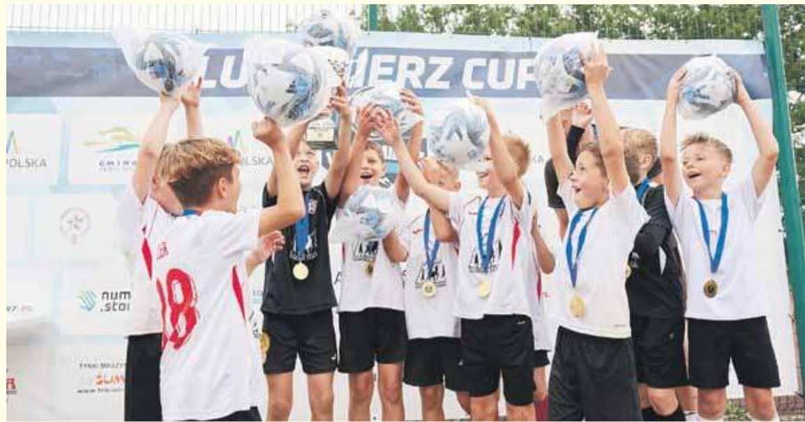
W sportowych zmaganiach wzięło udział ponad 240 młodych zawodników.