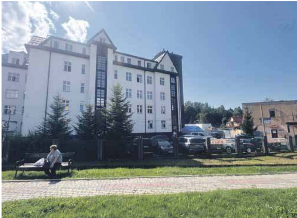
Odbudowany gmach Szpitala Miejskiego w Rabce.