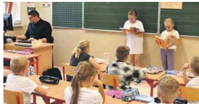
Trwa dodatkowa katecheza w Szkole Podstawowej nr. 1 im. Bohaterów Westerplatte w Cichem.