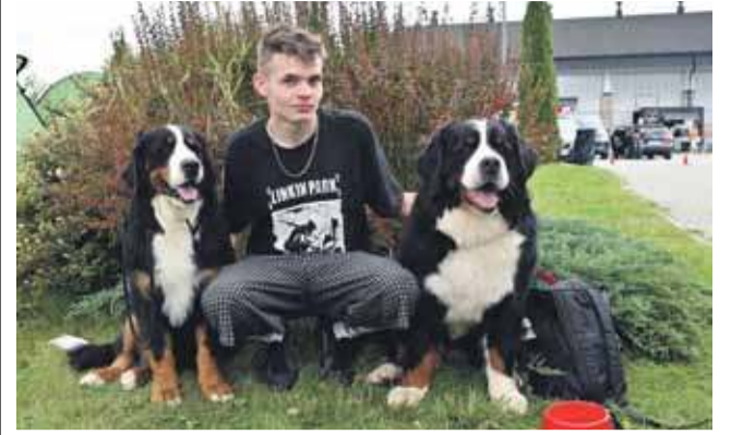
Sympatyczne psy przyjechały do Czarnego Dunajca z Makowa Podhalańskiego.