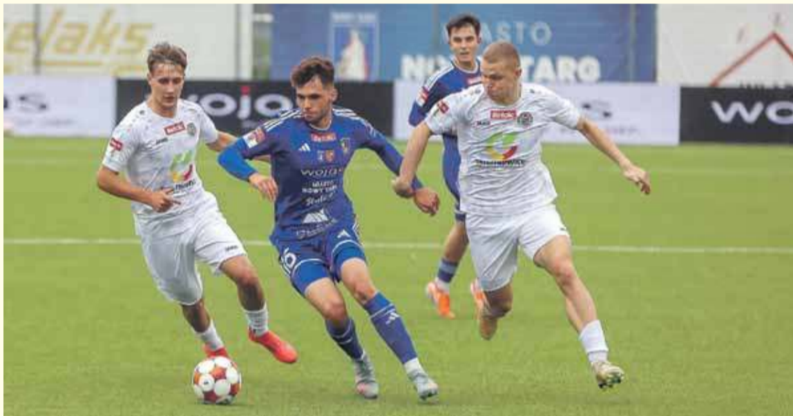
Podhale lepsze w starciu beniaminków.