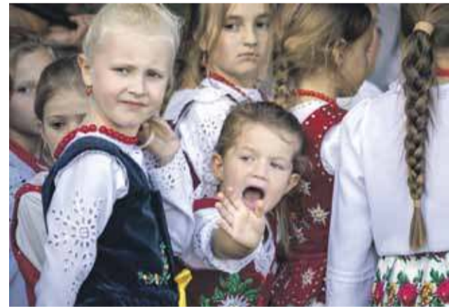
rza, Krauszowa, Długopola, Staroego Bystrego.

Na zakończenie odbyła się zabawa taneczna z zespołem „Zgrani” z Bukowiny Tatrzańskiej, która porwała do tańca uczestników imprezy. Obok sceny można było podziwiać wieńce dożynkowe, przygotowane przez mieszkańców okolicznych miejscowości, m.in. z Ludźmie-