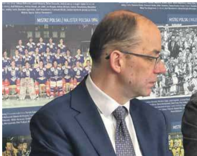
Grzegorz Watycha, burmistrz Nowego Targu.