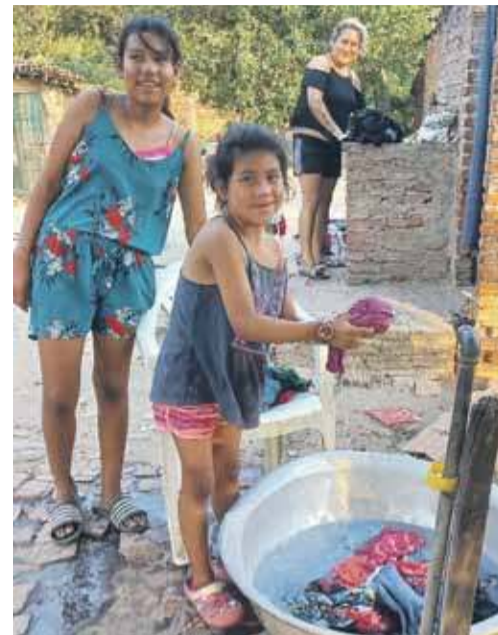
Podopieczni polskiej misjonarki

W jej sercu skrytych jest wiele wzruszających historii. Do jednej wraca szczególnie, bo jest związana z jej pierwszymi Świętami Bożego Narodzenia w dalekiej Boliwii. - Po Pastercie podeszła do mnie kilkuletnia dziewczynka. Była zmartwiona i pokazywała mi rozbity figurkę Dzieciątka Jezus. Staralam się ją pocieszyć. Zobaczy-