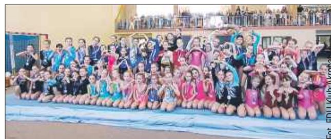
Turniej w Tryńczy.