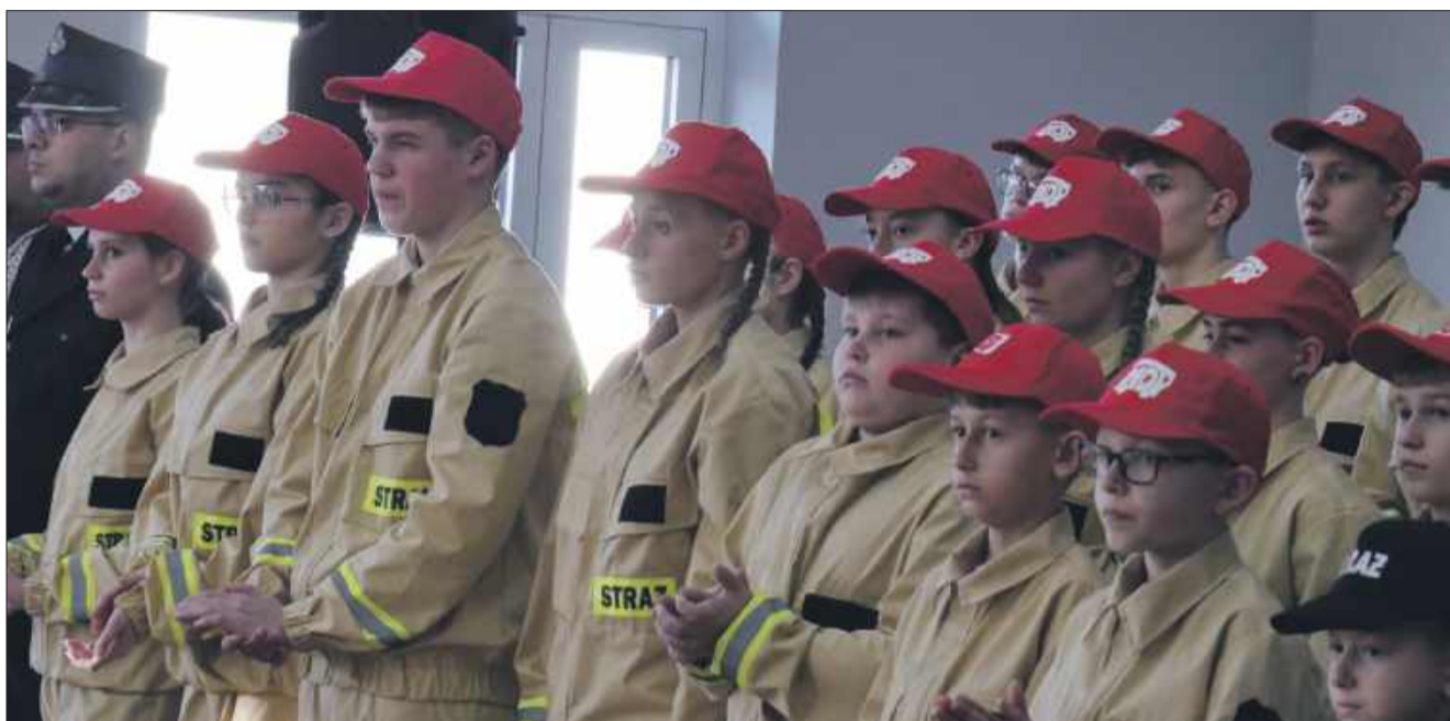
Młodzi, odważni i gotowi na służbę.