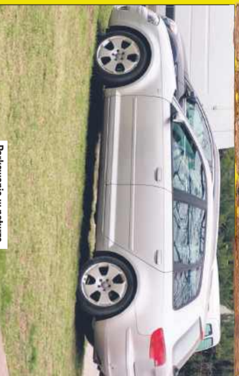
Parkowanie w naturze.