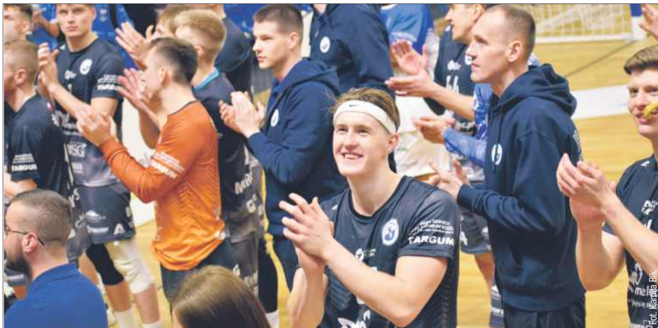
Kolejny mecz już w piątek w hali MOSIR Mielec.

Handball Stal Mielec zrobiła kolejny krok w kierunku awansu do Superligi, pokonując na wyjeździe SMS Kielce 35:32. Choć młodzi zawodnicy z Kielce walczyli ambitnie, to faworyt nie zawiódł i wraca do Mielca z kompletem punktów.