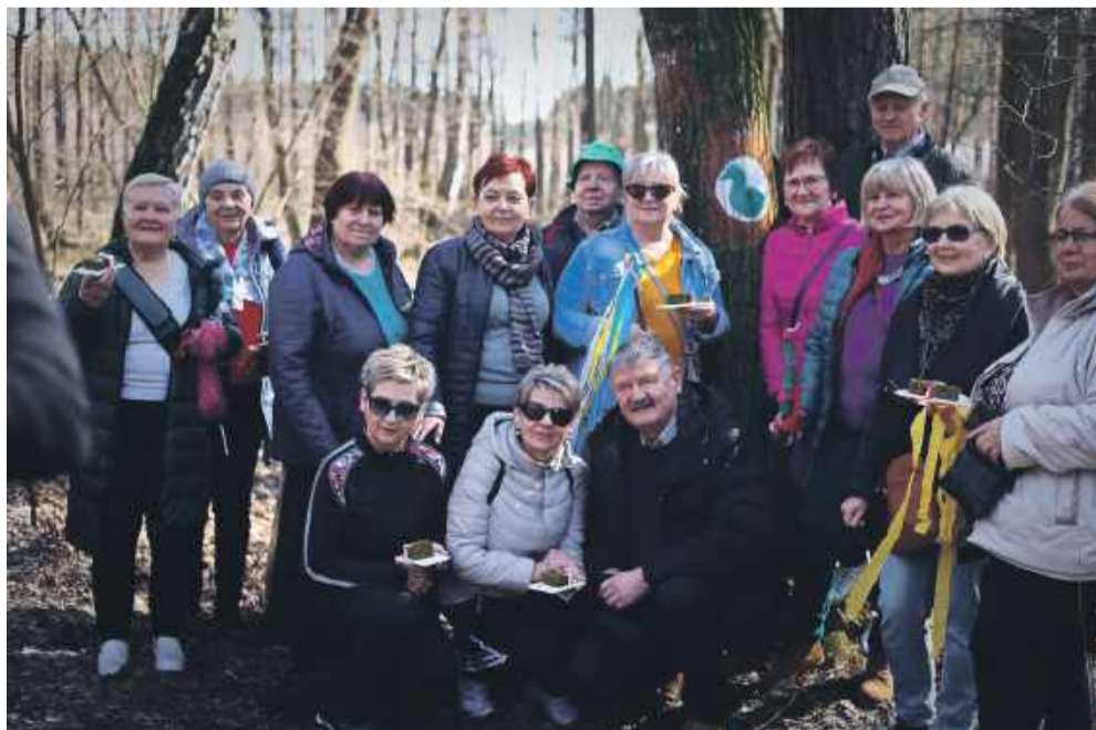
Trasa ma długość 5,2 km. Idealnie na przechadzkę w miłym gronie.

Uczestnicy mogli także skorzystać z urządzeń do ćwiczeń ruchowych, takich jak równoważnie, które pozwoliły na rozwój zdolności motorycznych i utrzymywanie balansu.