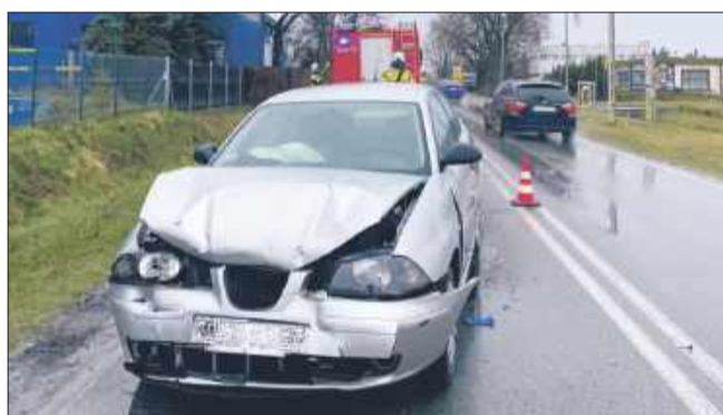
Sprawcą zdarzenia był 21-letni mieszkaniec powiatu dębickiego.

Na miejsce wezwano służby, które potwierdziły, że wszyscy uczestnicy zdarzenia byli trzeźwi i nie odnieśli obrażeń. Ostatecznie sytuacja została zakwalifikowana jako kolizja drogowa,