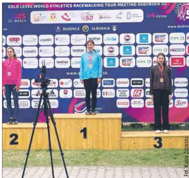
Siostry Zdziebło w świetnej formie!

Dudince od lat są miejscem zmagania najlepszych chodźców z całego świata, a polscy zawodnicy regularnie rywalizują tam