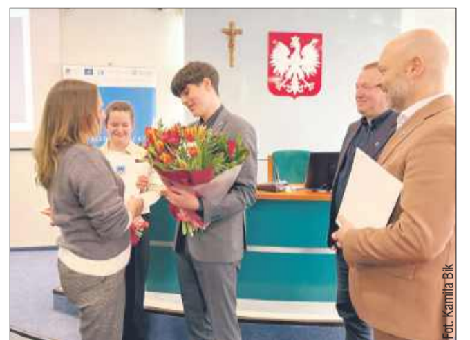
Sesja rozpoczęła się od oficjalnych podziękowań dla pracowników Biura Rady Miejskiej, którzy dotychczas sprawowali administracyjną opiekę nad Młodzieżową Radą Miejską.

W trakcie obrad poruszono również inne kwestie, m.in. zwią-