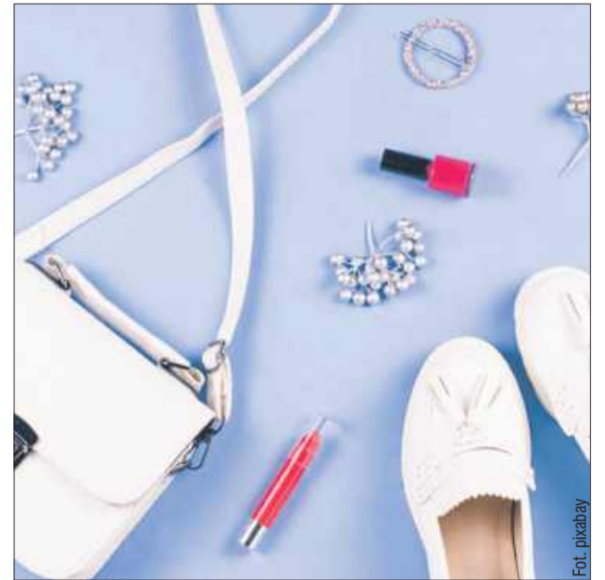
Mokasyny modne wiosną 2025.

Nie ma wygodniejszych butów na wiosnę dla pań 50+ niż skórzane