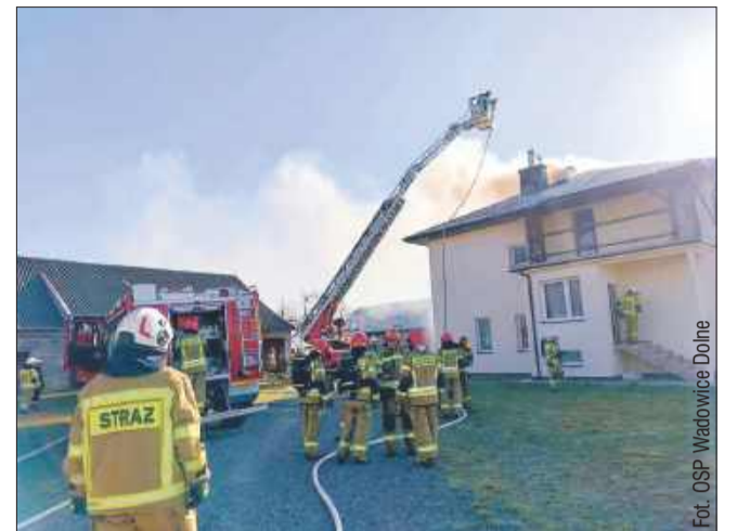
Pożar wybuchł w murowanym domu mieszkalnym.

Na szczęście w wyniku zdarzenia nikt nie odniósł obrażeń. Strażacy szybko przystąpili do gaszenia płomieni, zapobiegając dalszemu rozprzestrzenianiu się ognia.