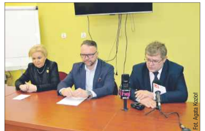
Briefing prasowy w mieleckim szpitalu.

Podczas konferencji w mieleckim szpitalu padły pytania m.in. o Centrum Zdrowia Psychicznego. Czy istnieje szansa na utworzenie takiego centrum?