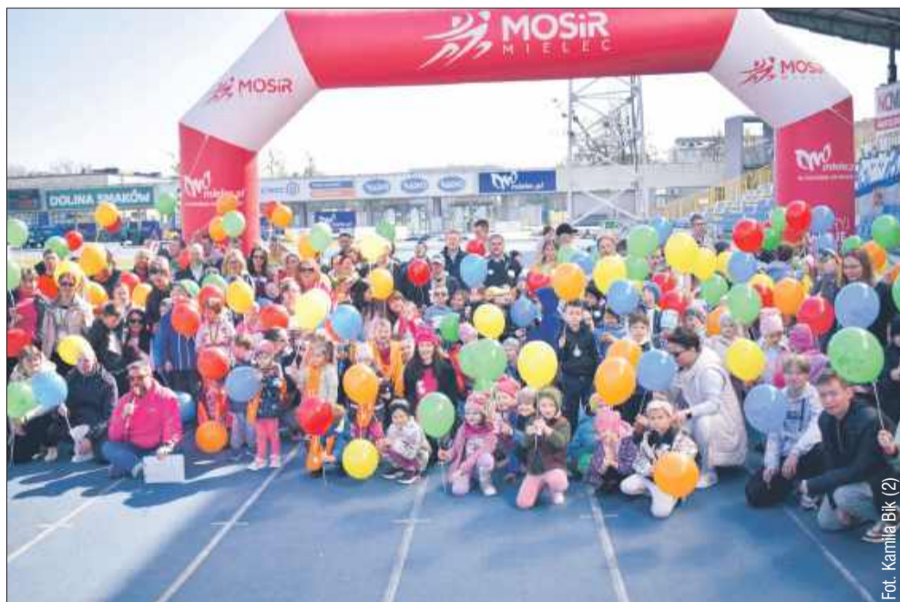
Było kolorowo i na sportowo!