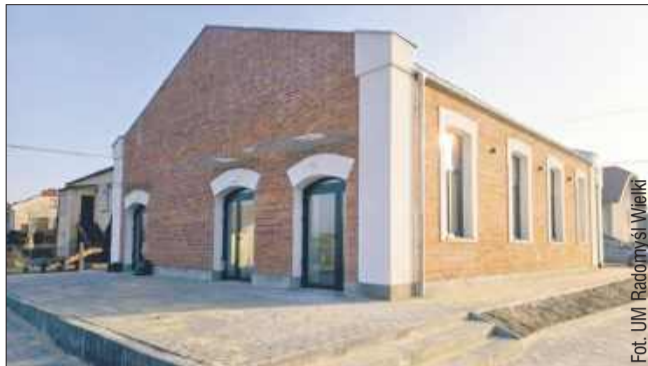
Budynek został przekształcony w Izbę Pamięci i Tradycji.

Zakres prac obejmował m.in. remont i przebudowę istniejącej struktury, odtworzenie pierwotnej geometrii okien oraz