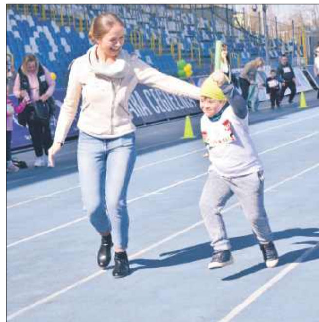
Sport łączy wszystkich!