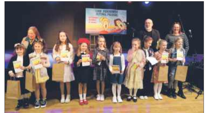
Wszyscy młodzi artyści zaprezentowali wysoki poziom.

18 marca w Domu Kultury SCK odbyły się eliminacje powiatowe XXXIV Podkarpackiego Konkursu „Śpiewaj razem z nami”. Do rywalizacji stanęło aż 80 młodych wokalistów i zespołów, którzy walczyli o awans do kolejnego etapu. Jury wyłoniło 15 solistów oraz 2 zespoły, które zaprezentują się w finale wojewódzkim.