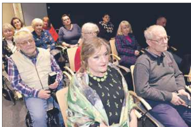
Niedziela z poezją w MBP.

Po raz pierwszy na spotkaniu w Mielcu obecni byli członkowie Klubu Lokalnych Poetów „Strumień” z Ropczyc, również oni mieli okazję przedstawić swoje utwory.