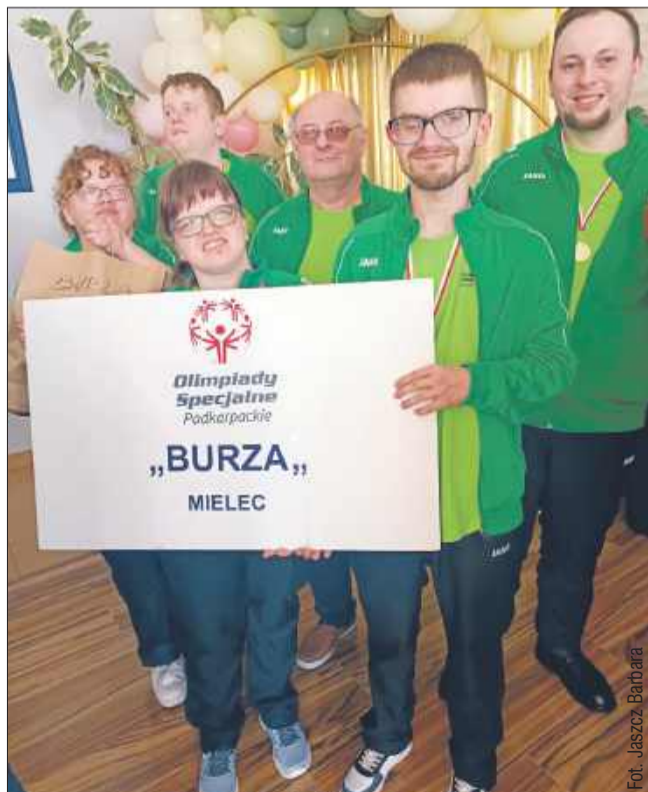
Reprezentanci Mielca na Turnieju Bowlingowym w Ropczycach.

Na kręgli Laguna w Ropczycach odbył się XII Podkarpacki Turniej Bowlingowy Olimpiad Specjalnych Polska.