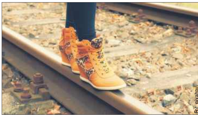
Moda wiosenna wiązania.

Choć mało praktyczne, to mało które modele otrzymały od projektantów tyle uwagi co buty ze sznurowaniami. Nie tylko dekorowały one najróżniejsze fasony - od botków przez szpilki aż po