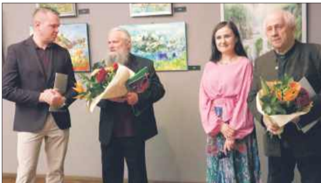
W plenerach w Łańcucie, Niedzicy-Frydmanie i Kolbuszowej wzięło udział kilkudziesięciu artystów z całej Europy.