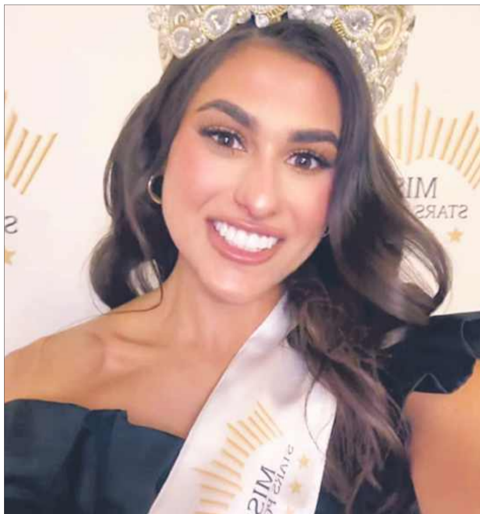
Miss Stars Poland