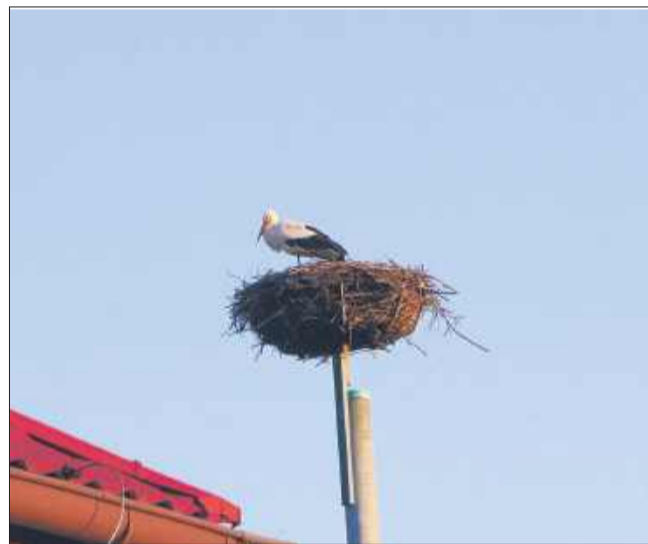
Bocian przy remizie w Wadowicach Górnych.

Wiosna już tu jest! I to nie tylko dlatego, że za oknem robi się ciepło, a promienie słońca zaczynają wreszcie wyganiać zimowy chłód. Przyleciały bociany!