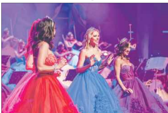
Koncert Wiedeński Orkiestry Księżniczek to wspaniała uczta dla zmysłów.

Doskonała zabawa dla widzów w każdym wieku, znakomity kontakt z publicznością, różnorodny repertuar i mnóstwo humoru... Koncert Wiedeński 3 (część 3.) Orkiestry Księżniczek to także wspaniała uczta