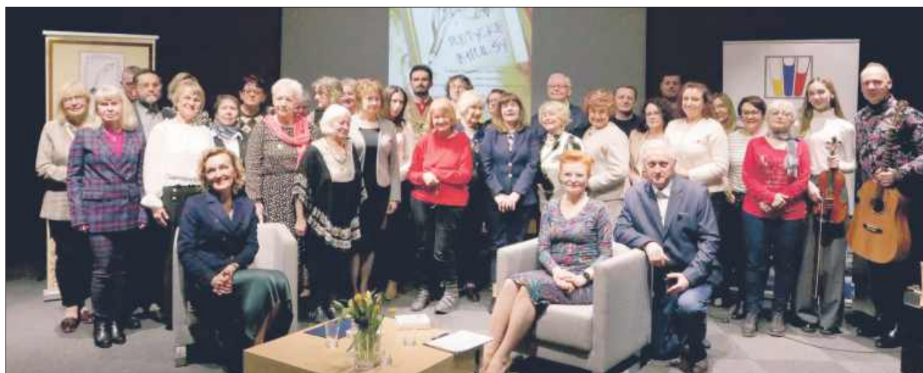
Ilu twórców, tyle sposobów na dobry wiersz.