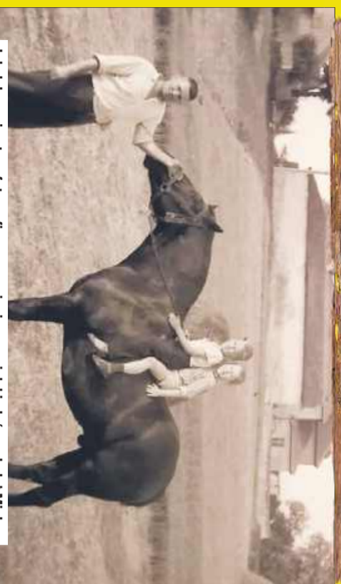
Jak dobrze, że stare fotografie przypominają nam, jak kiedyś wyglądał Mielec.