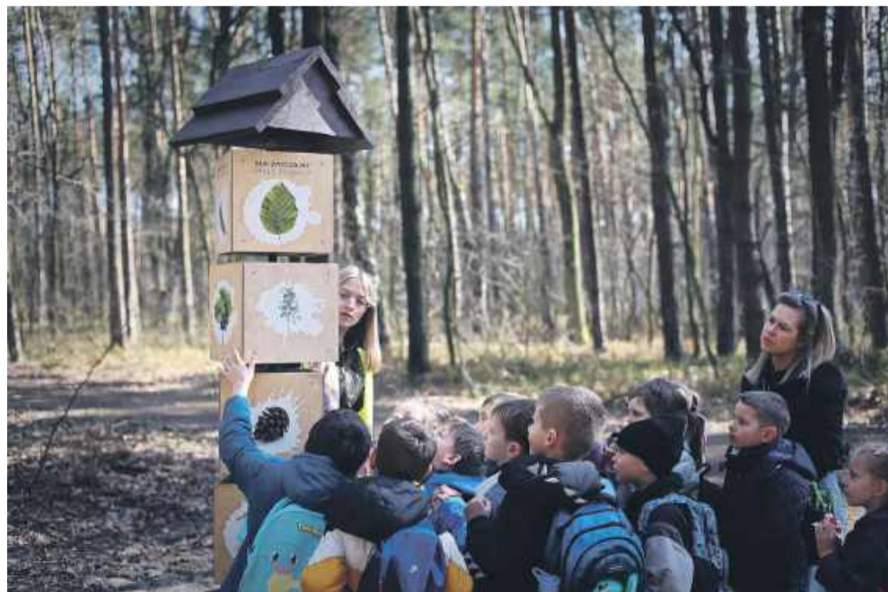
Dzieci były zachwycone nową ścieżką.