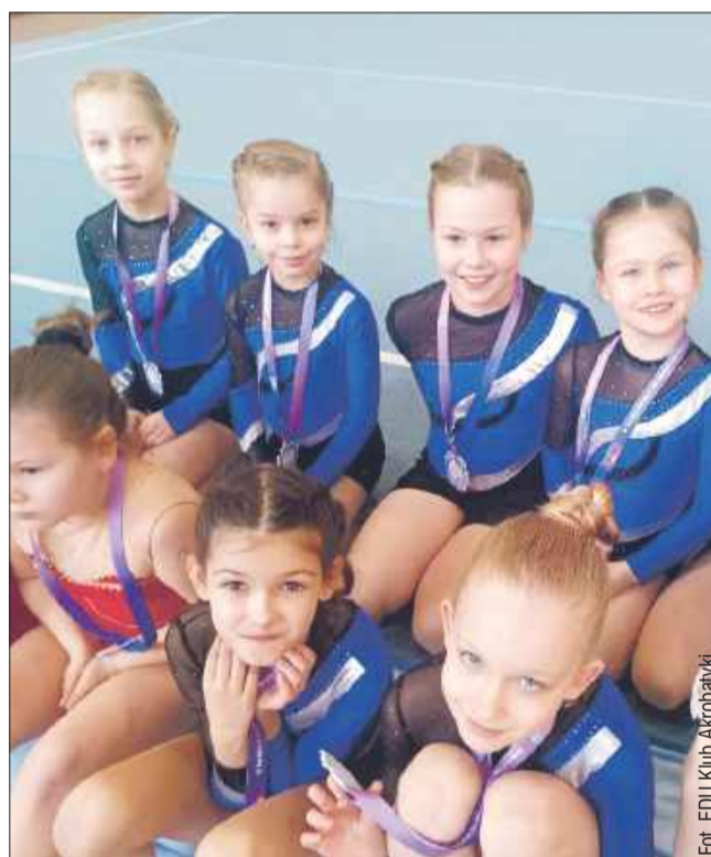
Mieleckie akrobatki z medalami.