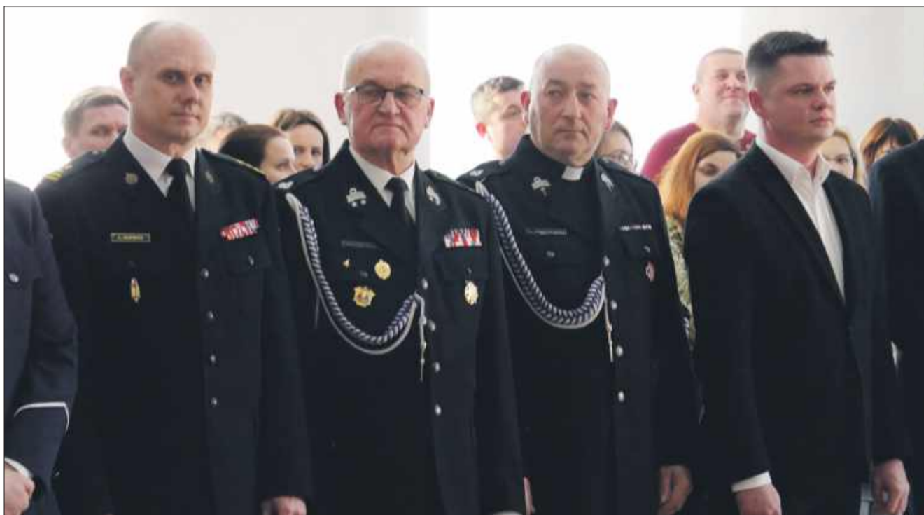
Starsi stażem z dumą patrzyli na nowe pokolenie strażaków.