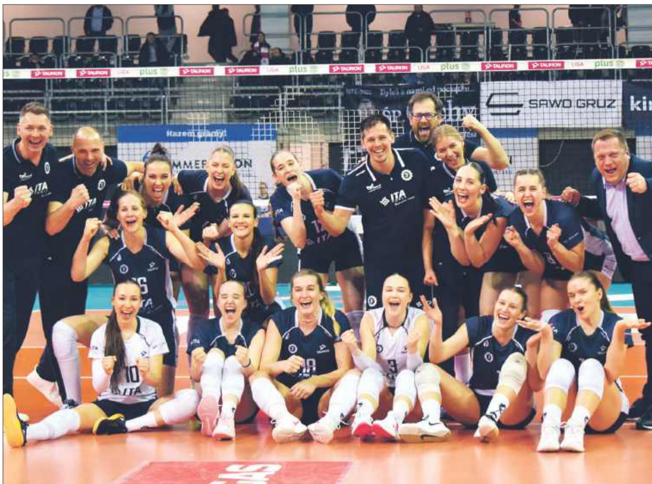
W czwartek ITA TOOLS Stal Mielec powalczy o awans do najlepszej czwórki! Zwycięstwo da im europejskie puchary!

- Do odważnych świat należy. Po to się gra w siatkówkę, żeby spełniać swoje marzenia. Ale na razie mamy do wykonania jeszcze jedno zadanie. Gramy krok po kroku.