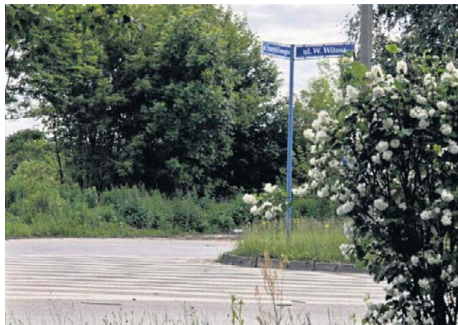
Miliony złotych na nową drogę w Chrzanowie to szansa na rozwój osiedla Młodości

Nie jest to jedyne zadanie drogowe zaplanowane na ten rok. Remont ulicy Długiej w Balinie ma zostać przeprowadzony i zakończony jeszcze w tym roku. ©©