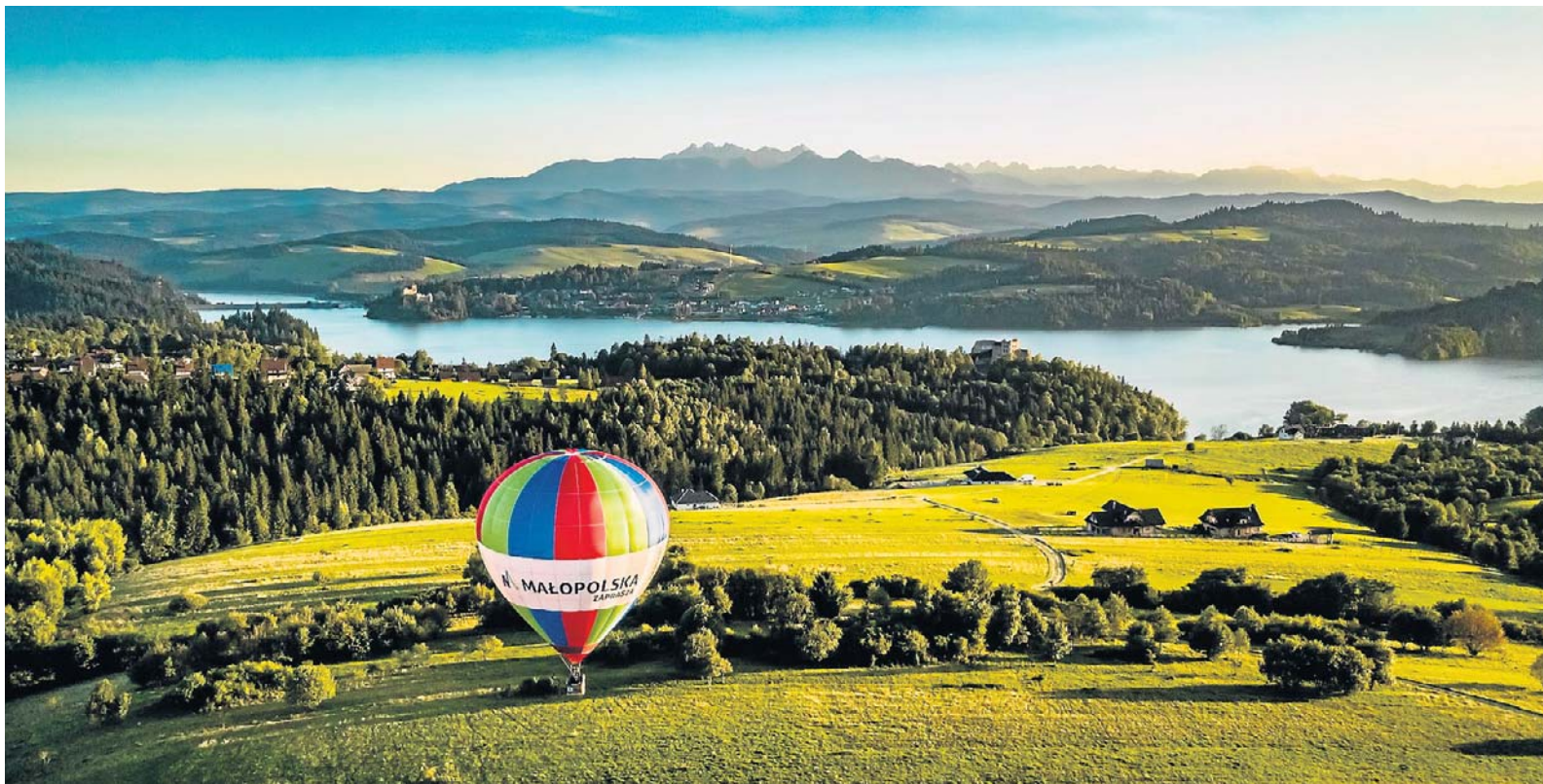
Tak było na Podhalu, tak też będzie na Sądeckczyźnie

Za „lisem”, czyli balonem wytyczającym kierunek lotu, wyruszą więc te załogi, które myślą o zwycięstwie. Która z nich okaże się najlepsza? Ta, która dobrze odczyta kierunek wiatru i jego moc, popisze się precyzyjną nawigacją oraz perfekcyjnym rzutem specjalnego znacznika. Im bliżej wyłożonego na ziemi „krzyża” się znajdzie, tym lepiej.