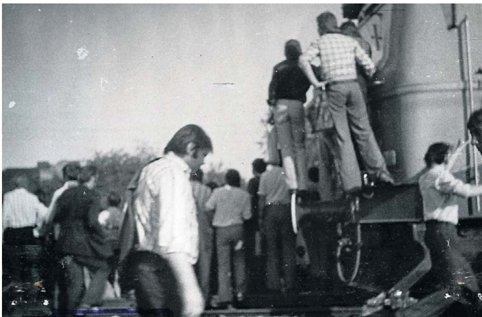
Robotnicy Zakładów Mechanicznych „Ursus” blokujący w proteście przeciwko podwyżkom cen tory kolejowe na trasie Warszawa - Skierniewice

wszyscy zgromadzeni pod komitetem, by Warszawa dowiedziała się o wielotysięcznej pokojowej manifestacji, żeby towarzysze puknęli się w głowę”. Nadzieje te okazały się jednak płonne. Gdy przedstawiciele władz nie podjęli rozmów z demonstrantami, napięcie zaczęło narastać. Doszło do zajęcia budynku Komitetu Wojewódzkiego PZPR, zniszczeń i pożaru. Po południu do miasta wkroczyły oddziały ZOMO, Milicji Obywatelskiej i Służby Bezpieczeństwa. Rozpoczęła się brutalna pacyfikacja.