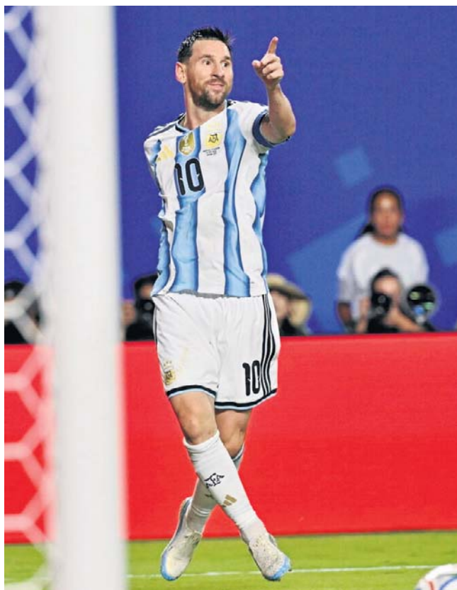
Argentyna rozbiła Algierię 3:0. Wszystkie gole dla Albicelestes strzelił niezawodny Lionel Messi

Z hukiem na mundialu zadebiutował Erling Haaland. Snajper Manchesteru City już w swoim pierwszym meczu na wielkim turnieju strzelił