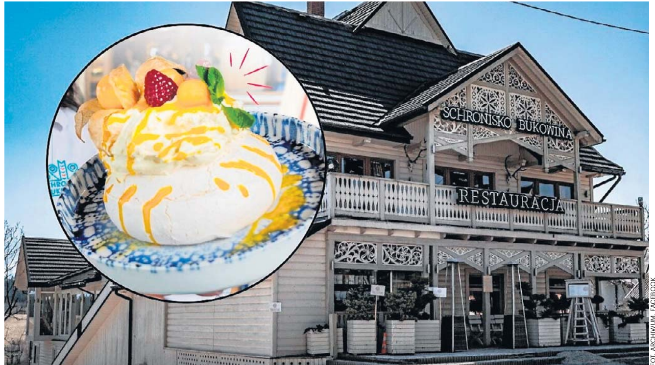
Restauracja Schronisko Bukowina zaprosiła dzieci ze świadectwami z czerwonym paskiem na darmową bezę

Łukasz Bobek lukasz.bobek@polskapress.pl