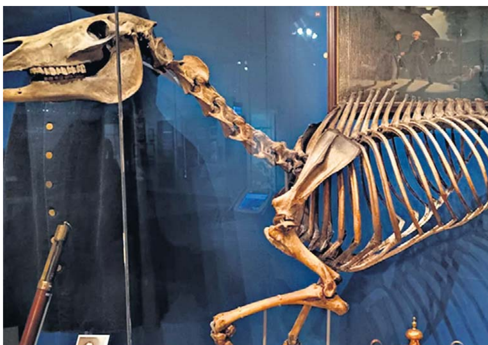
Gdy cesarz został zesłany na Świętą Helenę, jego wierzchowiec Marengo, siwy ogier arabski, trafił do Anglii jako budzące uciechę trofeum wojenne. Tam też zdechł w 1831 r.

Doczesne szczątki ukochanego konia Napoleona to jeden z cenniejszych eksponatów w National Army Museum w Londynie. Anglicy pałają dziwną fascynacją do resztek wierzchowca, który towarzyszył Cesarzowi podczas wielu bitew - to właśnie na nim Napoleon przekracza Alpy w scenie znanej z obrazu Davida. Marengo skończył swój wojenny żywot pod Waterloo, a potem dożywał w Anglii. Co ciekawe, dziś roszczą sobie doń pretensje także radni z irlandzkiej miejscowości Cork.