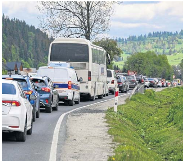
Korek na zakopiance między Zakopanem a Białym Dunajcem

Największe kontrowersje wzbudza plan montażu aż pięciu nowych sygnalizacji świetlnych na skrzyżowaniach, które do tej pory funkcjonowały w oparciu o klasyczne pierwszeństwo przejazdu. Światła mają pojawić się w następujących lokalizacjach: ● na wjeździe do Białego Dunajca (skrzyżowanie z drogą do Bańskiej Wyżnej), ● przy kościele w Białym Dunaju, ● tuż za nowym mostem im. gen. Mieczysława Boruty-Spiechowicza, ● na skrzyżowaniach w Poroninie (ulice Za Torem i Jana Kaspro-