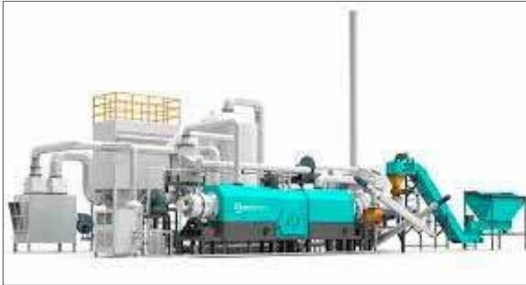
Przykład maszyny służącej w procesie karbonizacji i przetwarzania biomasy

Przypomnijmy, że pierwsze informacje ws. inwestycji podaliśmy w DN na początku stycznia br. Całość obejmuje nie tylko instalację produkującą zieloną energię, wodór, fosfor i CO 2 z odpadów, ale też budowę drogi dojazdowej na wydzielonych działkach w Dąbrowie Nowogardzkiej i Miętnie.