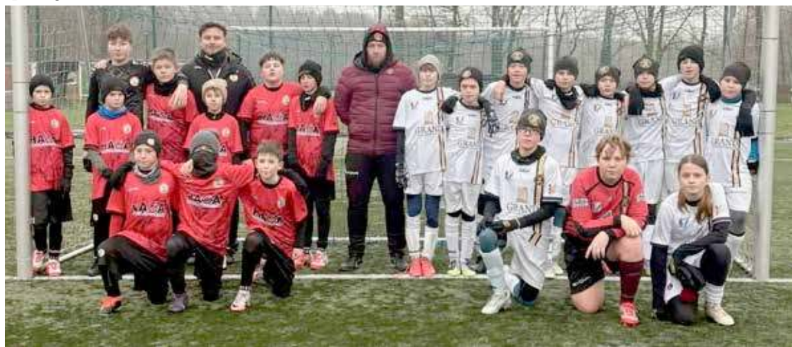
Wspólne zdjęcie obu drużyn