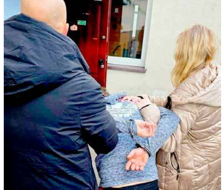
Rodzice trójki dzieci, którzy spędzili noc w lesie, zostali zatrzymani

Dodajmy, że policjanci z Nowogardu, jak i Goleniowa zorganizowali zbiórkę najpotrzebniejszych rzeczy z myślą o dzieciach w ich trudnym położeniu. Akcja wymagała zaangażowania wiele osób. Zgromadzono m.in. pampersy, ubrania, obuwie, ręczniki, koce, zabawki, żywność oraz artykuły chemiczne i kosmetyczne.