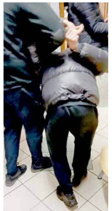
Za 21-latkim wystawiony został list gończy