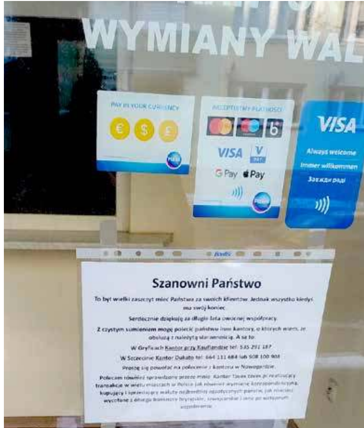
Informacja została umieszczona na szybie dawnego punktu wymiany walut

- To był wielki zaszczyt mieć swój koniec. Serdecznie dziękuję Państwu za swoich klientów. Kupuję za długie lata owocnej współpracy - czytamy m.in. w