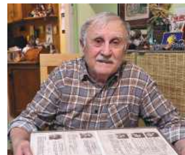
Opis zdjęcia z uroczystości odsłonięcia i poświęcenia symbolicznej mogiły 4 Żołnierzy AK