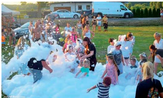
Wśród atrakcji była też piana party