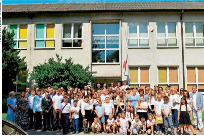
Ostatnie wspólne zdjęcie

roku szkolnym uczyło się w niej zaledwie 50 dzieci, łącznie z oddziałem przedszkolnym. W niektórych rocznikach nie udało się już utworzyć klas. To obraz zmian demograficznych, z którymi mierzy się dziś wiele samorządów w całej Polsce.