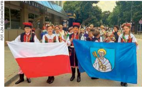
Barwny korowód przeszedł ulicami Silistry

Podczas koncertu galowego LZA Ciechanów zaprezentował przygotowany program składający się z tańca narodowego krakowiaka i suity tańców śląskich oraz regionalnych przyspiewek.