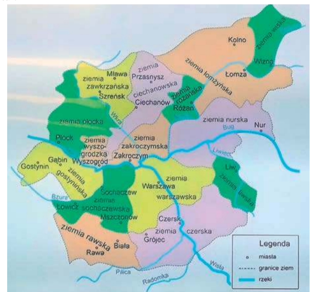
Podział Mazowsza przed inkorporacją

Charakterystyczna dla Mazowsza jest natomiast czarna legenda zbudowana wokół tutejszej szlachty. Uchodziła ona przez lata za czarną owcę wśród szlachty polskiej (a wśród szlachty mazowieckiej za taką uchodziła szlachta z Zawkrza). Do dziś zresztą na Podlasiu mówi się