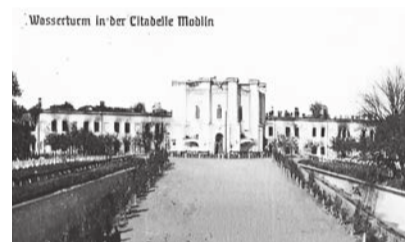
Wieża ciśnieniowa w cytadeli Modlin (zdjęcie z I wojny światowej)

Inną, dość dobrze zachowaną, tego rodzaju budowlą jest wieża ciśnieniowa w Płocku. Został wybudowany w 1894 r. na końcu ulicy Warszawskiej według projektu Seleroka Chesona, moskiewskiego architekta. Był to wówczas najwyższy budynek w Płocku, pięciokondygnacyjny, wybudowany na planie ośmioboku z czerwonej cegły. Pojemność zbiornika na wodę wynosiła „siedem tysięcy wiader”. Budynek bombardowany w czasie I i II wojny światowej, mocno zniszczony, ocalał, bo na solidnych fundamentach był wzniesiony. Już w okresie międzywojennym został przekształcony na budynek mieszkalny, a po ostatniej