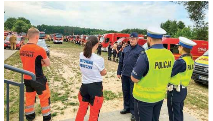
Scenariusz wtorkowych ćwiczeń zakładał pożar lasu

Miasto oraz Leśnictwa Kuchary w gminie Sochocin. Działania były prowadzone m.in. na terenie miejscowości Idzikowice.