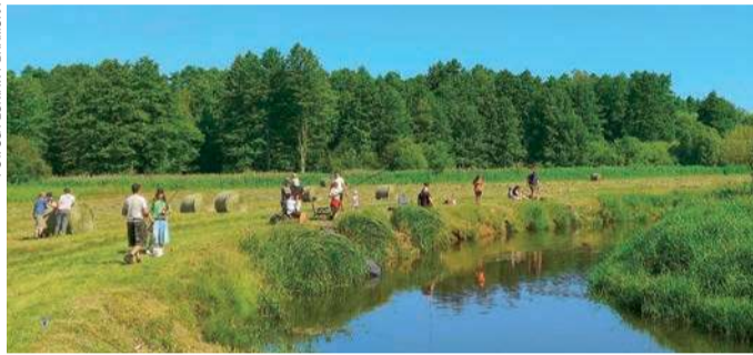
W zawodach udział wzięło 22 uczestników

zajęć stacjonarnych, jak i w przypadku nauki zdalnej. Ułatwi także nauczycielom prowadzenie zajęć z wykorzystaniem technologii informacyjno-komunikacyjnych. Dzięki otrzymanemu nieodpłatnie sprzętowi uczniowie zyskają możliwość rozwijania kompetencji cyfrowych, korzystania z zasobów edukacyjnych online oraz pracy z aplikacjami wspierającymi naukę – informuje gmina. RK