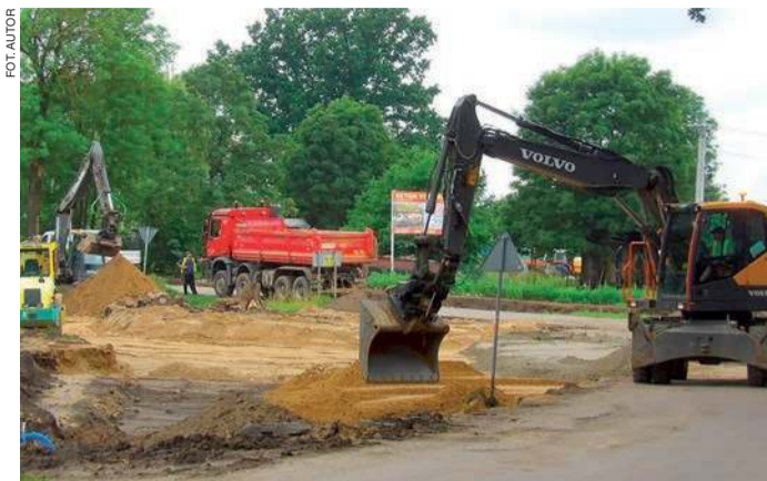
Prace nad rozbudową drogi idą pełną parą. Na zdjęciu: roboty w miejscu przyszłego ronda w Liberadzu

o niewielkim natężeniu ruchu. Na te korupcyjne roboty jest przeznaczony 14 milionów złotych publicznych pieniędzy z budżetu państwa polskiego”. Słowem, pada oskarżenie władz powiatowych o korupcję i niegospodarność.