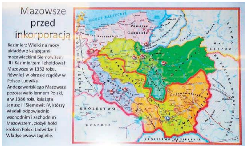
Mazowsze przed inkorporacją

- Współczesną kulturę polską ukształtował romantyzm. Mamy pięciu wielkich romantyków. Mickiewicz pochodził z Kresów i do tych Kresów nawiązuje. Słowacki z Kresów, tylko z południa, i do tych Kresów nawiązuje. A trzech pozostałych kultur.