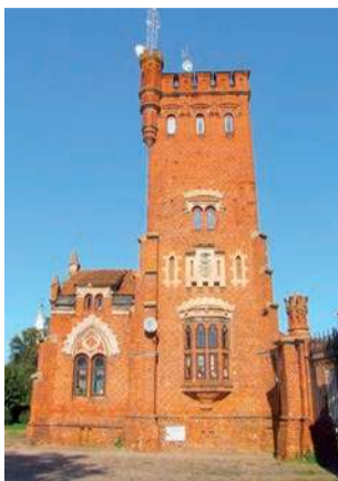
Wieża ciśnieniowa w Krasnem, ...