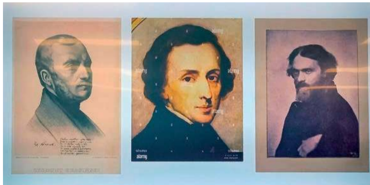
Wielcy romantycy z Mazowsza: Zygmunt Krasiński, Fryderyk Chopin, Cyprian Kamil Norwid

Mazowsza, z uwagi na jego rozległość, wyraźną granicę pomiędzy północą a południem, czy zmieniający się na przestrzeni wieków podział administracyjny.