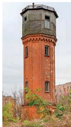
... Pułtusk ...