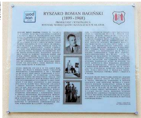
Tablica pamiątkowa na budynku spółki „WOD-KAN”

W 1926 r. podjął pracę w Dyrekcji Robót Publicznych Województwa Warszawskiego. W latach 30.