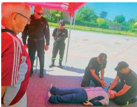
Treningi miały praktyczny charakter

Na terenie powiatu treningi miały miejsce w następujących lokalizacjach: strażnica OSP Czerwonka, strażnica OSP Dąbrówka, remiza OSP Dążeń, parking przy Urzędzie Miejskim w Makowie Maz., świetlica wiejska w Ogonach, strażnica OSP Płoniawy-Bramura, Urząd Gminy w Różaniu, strażnica OSP w Rzewniu, Gminny Ośrodek Kultury w Sypniewie, Dom