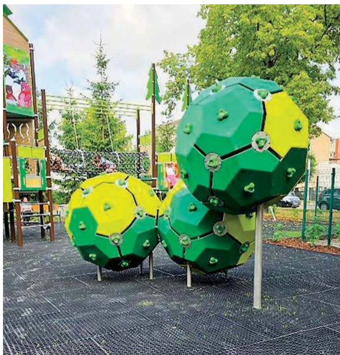
Nowe elementy wzbudzają ciekawość nie tylko dzieci

Strefa młodszego dziecka obejmuje wielofunkcyjny zestaw zabawowy wspierający rozwój ruchowy i poznawczy najmłodszych. Znajdują się tu również ławki, kosze na śmieci oraz bezpieczna nawierzchnia pia-