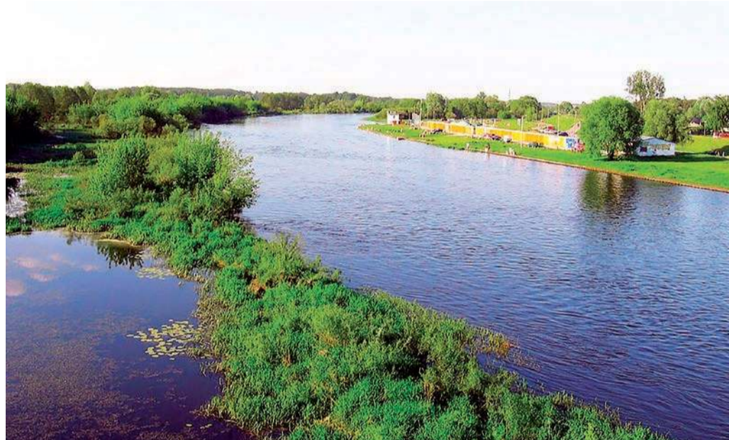
Narew koło Ostrołki

W dziewiętnastowiecznym Słowniku Geograficznym tak opisywano