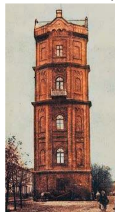
... i w Płocku

jednym z elementów układu naczyń połączonych, odpowiedzialnych za miejscową sieć wodociagową. Budynek został tak zaprojektowany, aby pełnił rolę pawilonu z tarasem widokowym na okolicę. Z czasem został przekształcony na budynek mieszkalny dla służby folwarcznej, ale to już zupełnie inna sprawa.