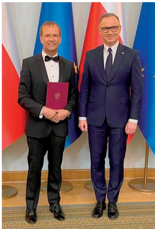
Pałac Prezydencki. Prezydent RP Andrzej Duda w dniu 20 maja 2025 r wręcza nominację profesorską Robertowi Gajdzie podpisaną w dniu 5 marca 2025 r. w dyscyplinie: nauki o zdrowiu