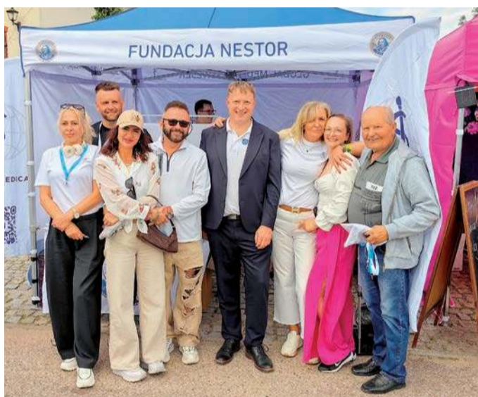
Stoisko Fundacji Nestor

mi, Parkinsonem, Alzheimerem czy różnymi postaciami demencji.