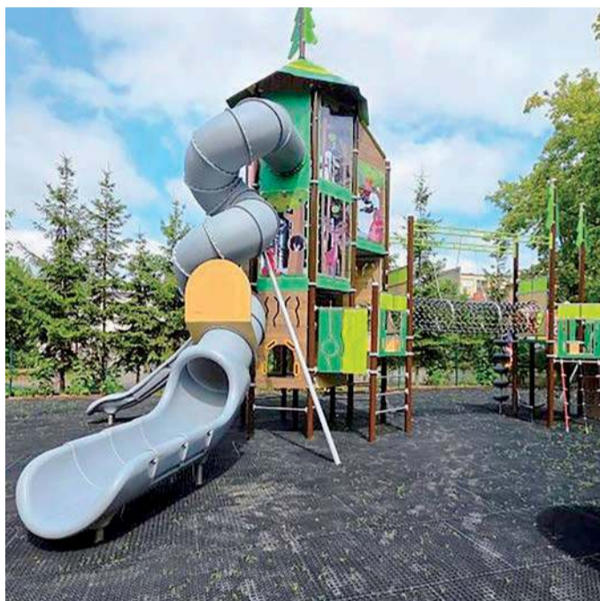
Po przebudowie pojawiło się sporo nowych atrakcji dla dzieci i młodzieży

Strefa starszego dziecka została wyposażona w duży zestaw wielofunkcyjny z wysoką zjeżdżalnią tubową i ślizgiem odkrytym, kule wspinaczkowe przypominające drzewa, huśtawkę typu „bocianie gniazdo”, karuzelę integracyjną, ławki oraz kosze na śmieci. Zastosowano bezpieczną nawierzchnię z mat przerosowych, a całość otacza żywopłot z hortensji.