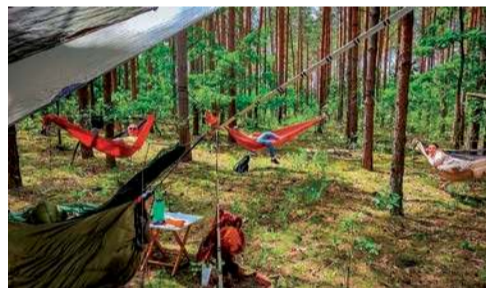
Chwila relaksu na hamaku

Udział we wszystkich wydarzeniach jest bezpłatny, jednak obowiązują wcześniejsze zapisy prowadzone za pośrednictwem strony internetowej Nadleśnictwa Ciechanów. erem