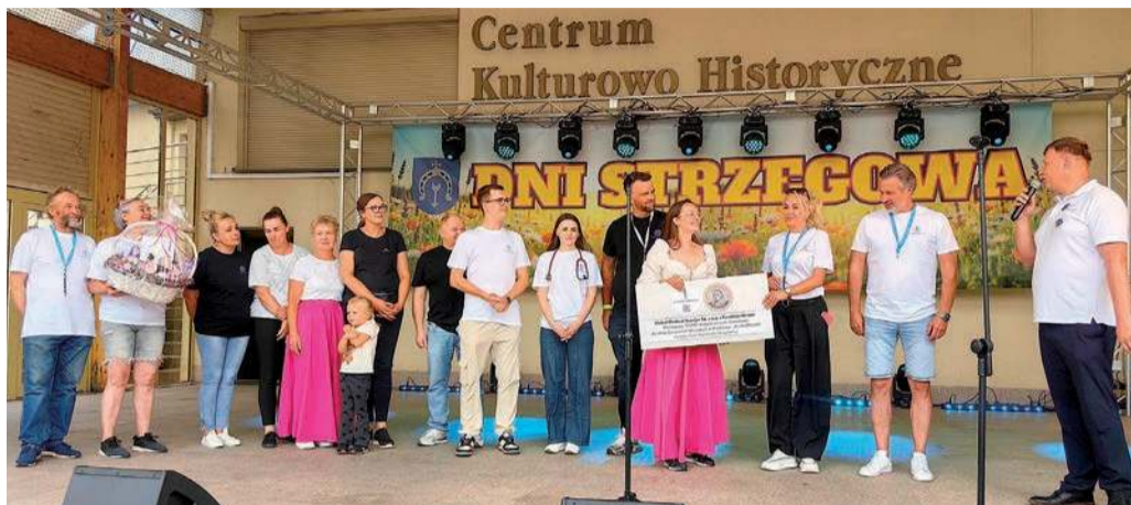
Przekazanie czeku podczas imprezy z okazji Dni Strzegowa

Integralną częścią działalności jest również Dom Opieki Nestor oraz centrum rehabilitacji. Trafiają tam osoby po ciężkich urazach, zabiegach operacyjnych, udarach, a także pacjenci z chorobami neurologicznymi,