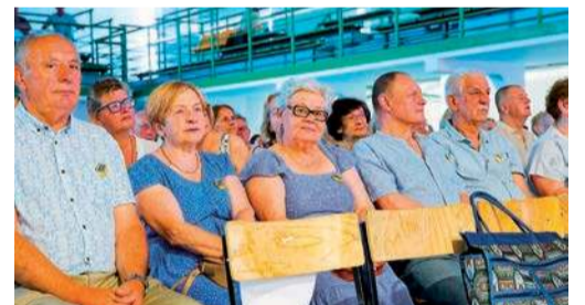
Seniorzy kończą kolejny rok akademicki