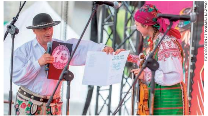
Wręczenie nagród. III miejsce Kapela z Kurpi Białych

- To były dla nas cztery dni przygody, muzyki, integracji i inspiracji. Wystąpiliśmy tam w roli reprezentantów białokurpiowskiej kultury muzycznej pierwszy raz, ale całą