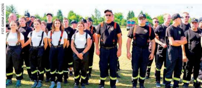
Ochotniczki i ochotnicy z gminy Ojrzeń

Zlekceważył dożywotni zakaz i jechał na „podwójnym gazie”