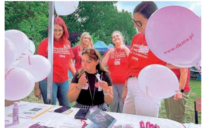
... I wpis do bazy danych DKMS

Swoje stoiska przygotowały także służby mundurowe. Dzieci mogły z bliska obejrzeć wóz strażacki oraz radiowóz policyjny, porozmawiać