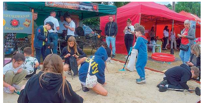
Tradycyjnie, dużą atrakcją, było stoisko Sąchockiego Towarzystwa Poszukiwaczy Historii

„Nie umiera ten, kto trwa w pamięci żywych” - ks. Jan Twardowski