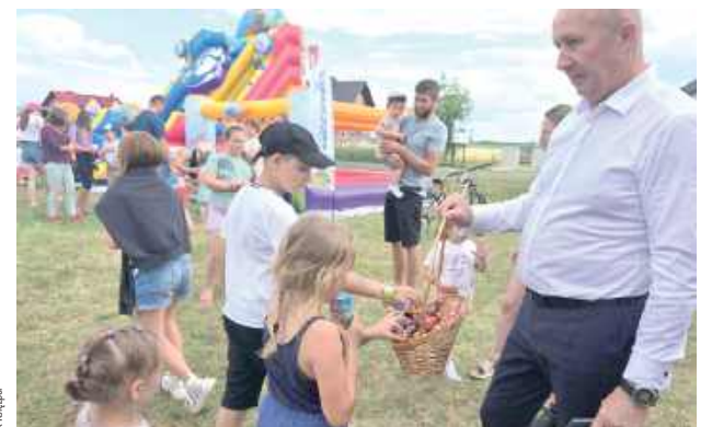
Wójt pojawił się na imprezie z cukierkami