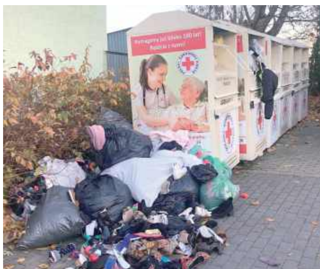
Jesienią ubiegłego roku tak wyglądały kontenery PCK na parking przy SP nr 1 (od strony ulicy Zamojskiej). Wiosną tego roku kontenery zniknęły całkowicie

Jeszcze do niedawna w Biłgoraju ustawione były 104 kontenery na używaną odzież, których właścicielem był Polski Czerwony Krzyż. Lubelski oddział PCK organizował akcję zbiórki odzieży. Za opróżnianie pojemników odpowiadała podwykonawca, czyli zewnętrzna firma, która wywoziła ich zawartość do sortowni. Ale od pewnego czasu kontenery zniknęły, a zdziwieni mieszkańcy co jakiś czas pytają dlaczego.