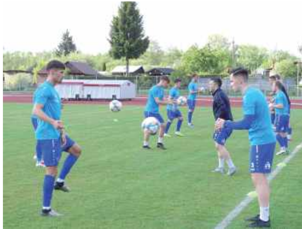
Piłkarze Łady na pierwszym treningu po przerwie spotykają się 10 lipca (czwartek)

Sezon 25/26 na boiskach IV ligi piłkarskiej rozpocznie się w weekend 9-10 sierpnia.