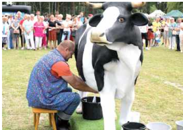
Bicie piany, dojenie sztucznej krowy i śmiech do łez - konkurencje na weselo podbiły serca publiczności