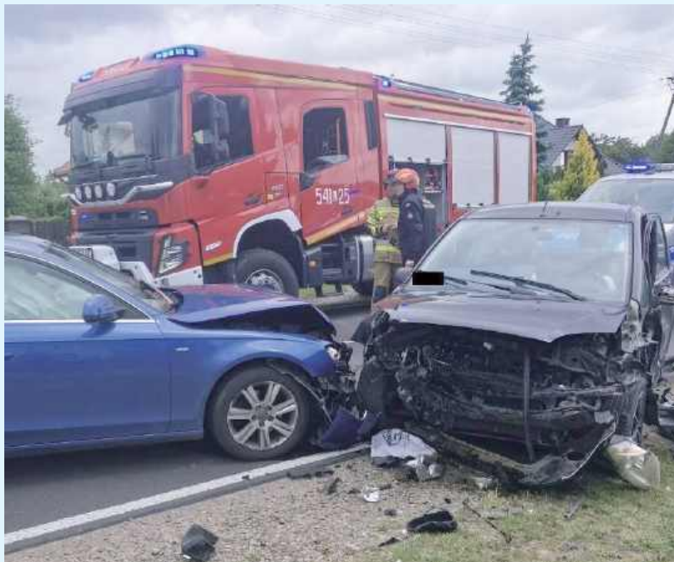
Kierujący Iveco wykonał nieprawidłowy manewr omijania i opryskiwaczem, który znajdował się na lawecie zaczepił o zaparkowany na poboczu pojazd marki Renault Kangoo