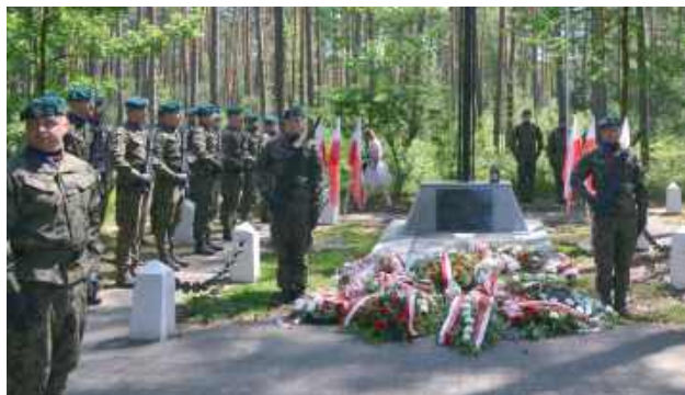
4 lipca 1944 r. to jedna z największych tragedii w historii Biłgoraja i okolic