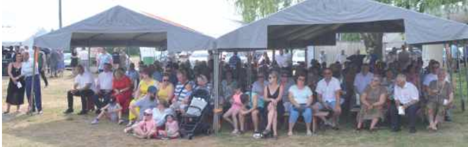
Bukowskie Jagodzianki to jedna z najważniejszych imprez w regionie

Bukowskie Jagodzianki to doskonała okazja do spróbowania lokalnej kuchni, poznania folkloru i tradycji regionu, a także do wspólnej zabawy z rodziną i przyjaciółmi.