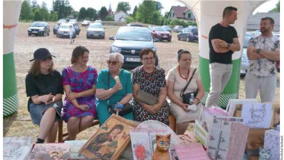
Stoisko z rękodziełami ludowymi