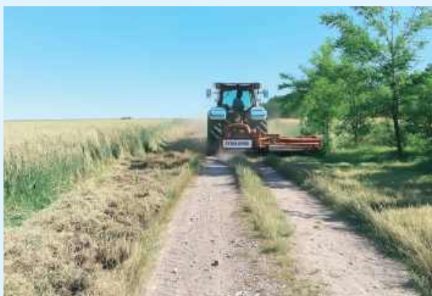
Mieszkaniec Wielączy nie mógł się doczekać interwencji urzędników ze Szczepieszyna. Sam postanowił wykosić teren przy drodze

Droga ta była koszona co roku - to była stała praktyka. W tym roku jednak prezes