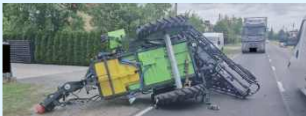
Z lawety spadł opryskiwacz wprost na jadący od strony Tomaszowa samochód osobowy marki Ford Focus

W piątek (27 czerwca) na ul. Józefowskiej w Rogóźnie doszło do zdarzenia drogowego z udziałem czterech pojazdów.