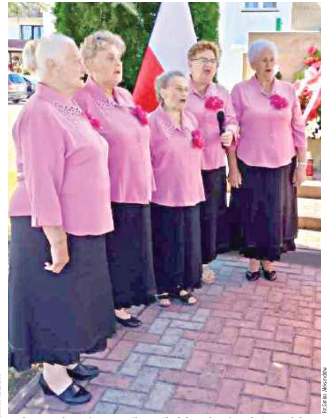
Podczas wydarzenia wystąpił zespół Aleksandrowiaczy, który nadał mu podniosły charakter