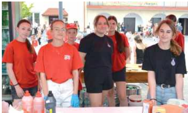
Z imprezy nikt nie wyszedł głodny

W minioną niedzielę Tarnogród po raz kolejny stał się muzycznym sercem regionu. Wszystko za sprawą IV Kresowego Festiwalu Orkiestr Dętych, który przyciągnął miłośników orkiestralnych brzmień z całego Roztocza.