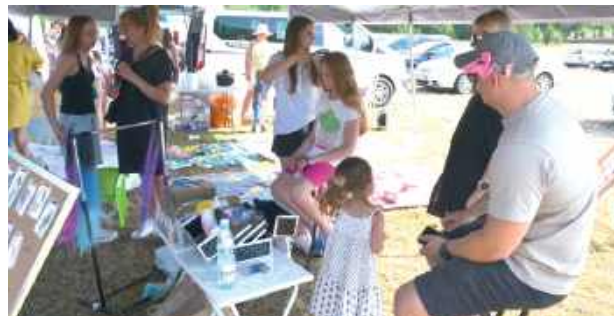
Najmłodsi nie nudzili się mimo upalnej pogody