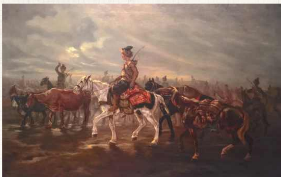
Tatarzy słynęli z szczególnych okrucieństw i niszczenia mienia. W XVI i XVII w. budziły wśród Polaków strach i lęk

Zachowały się spisy z XVII wieku i opisy z raportu Mikołaja Stworzyńskiego z 1834 roku. W 1624 roku Tatarzy najechali na Zaborszczyznę,