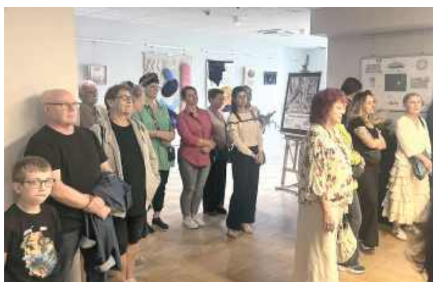
Wernisaż wystawy cieszył się sporym zainteresowaniem