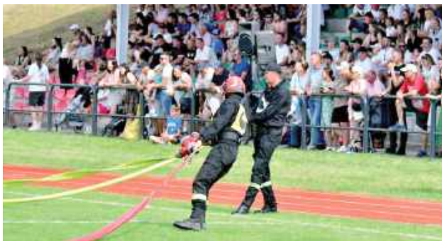
Pomimo upału frekwencja dopisała

Organizatorami wydarzenia byli: samorząd Tarnogrodu, Starostwo Powiatowe w Biłgoraju, Komenda Powiatowa Państwowej Straży Pożarnej w Biłgoraju oraz Zarząd Powiatowy OSP RP. Najlepsze drużyny zostały uhonorowane nagrodami finansowymi oraz pamiątkowymi dyplomami. — To była doskonała okazja,