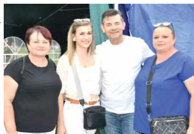
I jeszcze jedna pamiątkowa foto z królem disco polo