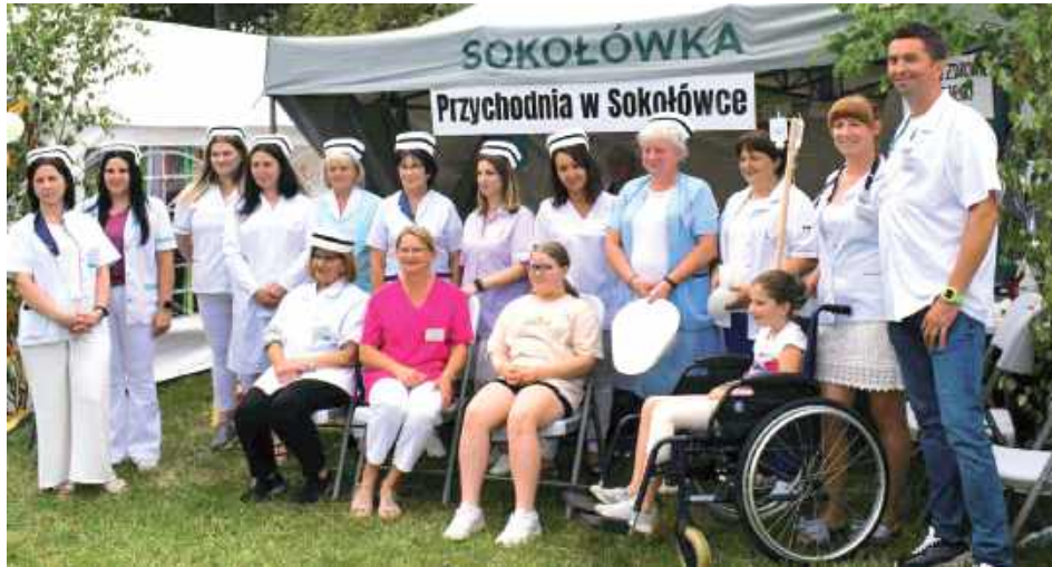
Pielęgniarki i przychodnia pod chmurką - zdrowy żart w najlepszym możliwym stylu