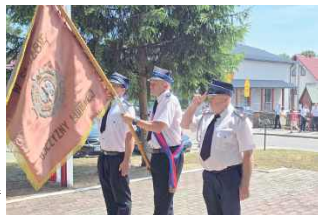
Nie zabrakło pocztów sztandarowych z terenu gminy Księżpol

Następnie uczestnicy uroczystości przemaszerowali pod pomnik ofiar pacyfikacji,