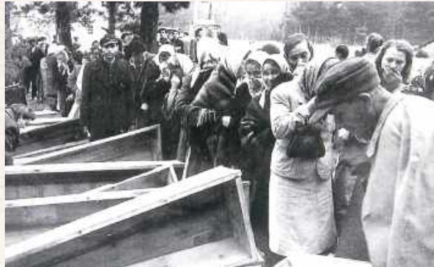
Mieszkańcy Ziemi Biłgorajskiej podczas identyfikacji zwłok

Zaznaczyć należy jednak, że w pobliżu opisanej mogiły znajdowało się jeszcze drugie, zamaskowane miejsce, w którym Niemcy