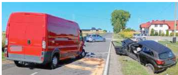
Kierowca i pasażer Citroena byli zakleszczeni w pojeździe. Mężczyźni z pojazdu zostali uwolnieni przez strażaków. Zostali przetransportowani do szpitali

Zgłoszenie o zderzeniu czołowym dwóch pojazdów w miejscowości Bukowina (gm. Biszczka) dyżurny biłgorajskiej komendy otrzymał w środę, 2 lipca około