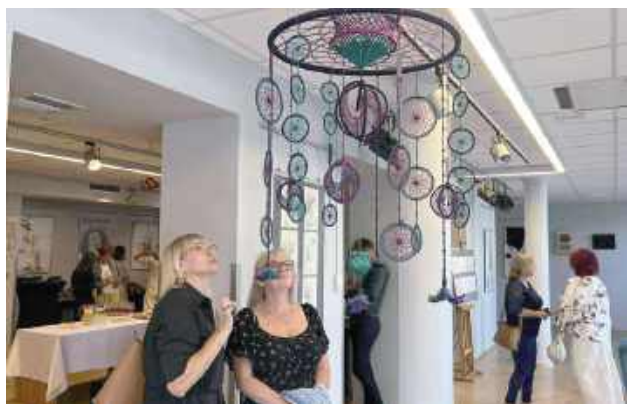
Goście z zachwytem podziwiali rękodzieło

BIŁGORAJ: W Galerii BCK odbył się wernisaż wystawy „Co nam w duszy gra...”. Prace przyciągały wzrok, sala wypełniona ludźmi, a rozmów o sztuce nie było końca.