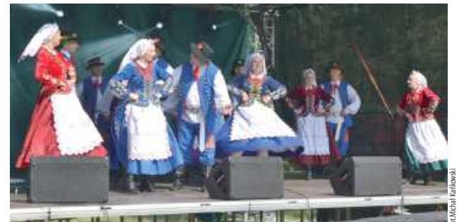
Występy artystyczne zespołów ludowych