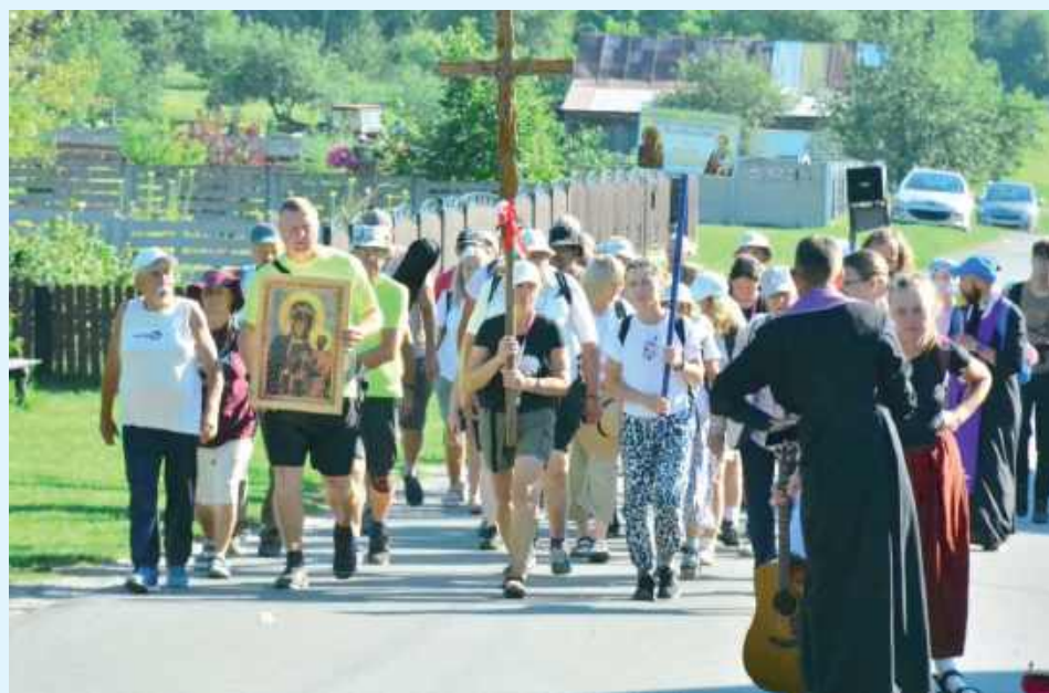
2 sierpnia z Zamościa wyruszy 43. Piesza Pielgrzymka Diecezji Zamojsko-Lubaczowskiej na Jasną Górę

- Już 2 sierpnia rozpocznie się nasza wspólna pielgrzymka do Matki Bożej na Jasnej Górze. Wyruszymy z grupą hru-