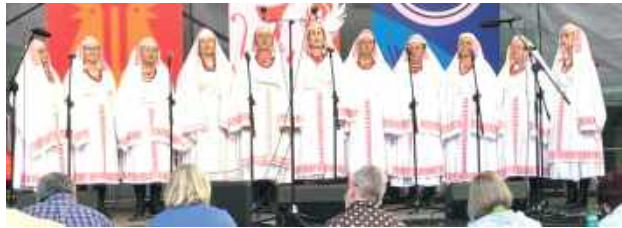
„Dorbozianki” z Dorboz (gmina Obsza) wyśpiewały basztę w kategorii zespoły śpiewacze

- W ostatnich latach nasze zespoły często stawały na podium w Kazimierzu Dolnym, ale dopiero drugi raz zdobyliśmy „Basztę”. Pierwszą taką nagrodę wyśpiewały w 2003 r. „Zamszanki”