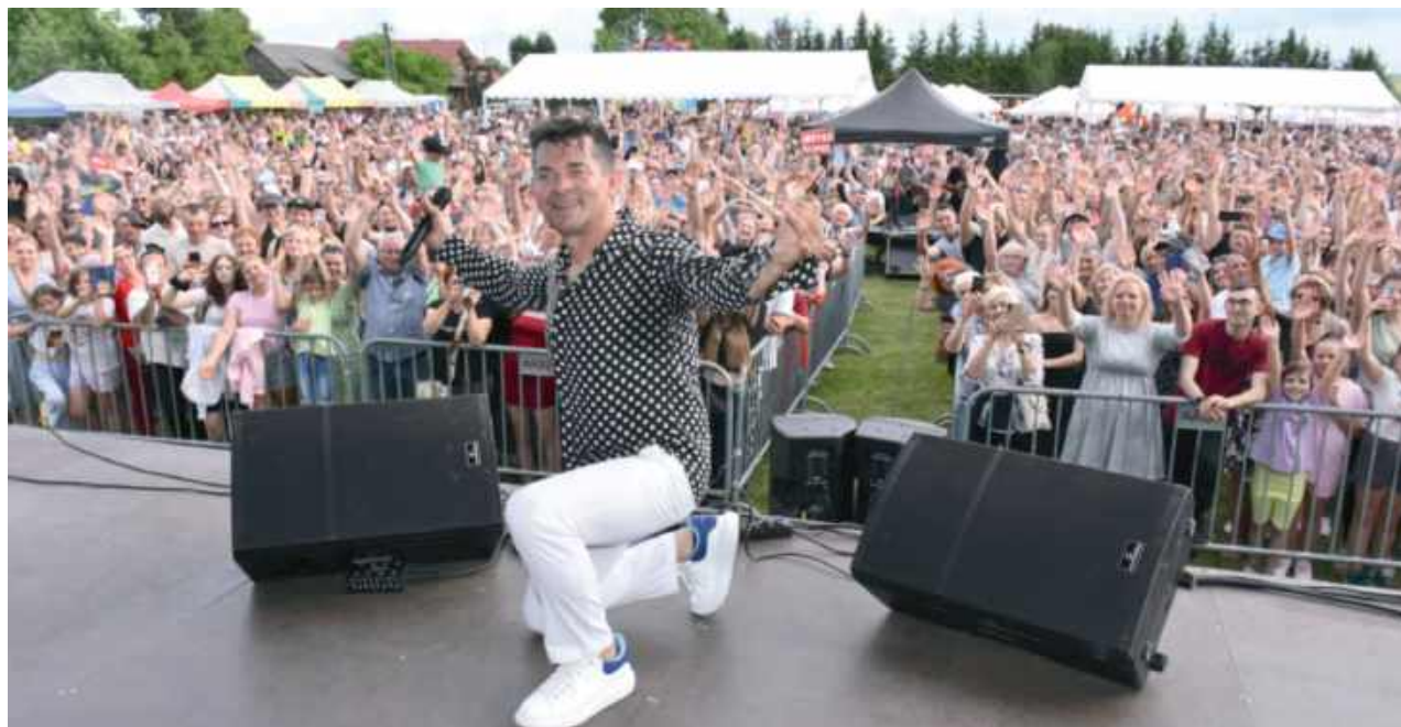
Koncert Zenka Martyniuka przyciągnął tłumy

W niedzielę, 29 czerwca Turobin stał się muzycznym sercem regionu! Na Stadionie Sportowym odbyła się V Turobińska Gala Folkloru i Disco Polo. Gwiazdą imprezy był Zenek Martyniuk. Zobaczcie, co tam się działo!