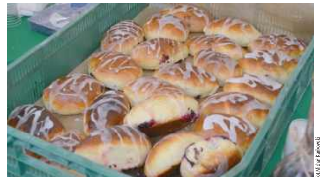
Najlepsze były jagodzianki!