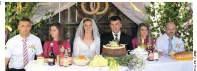
Wesele w plenerze? Czemu by nie