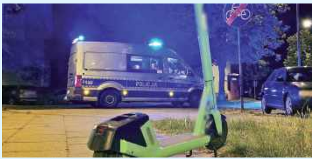
Maksymalna prędkość hulajnowy elektrycznej na drodze wynosi 20 km/h. Przepisy precyzują także zasady parkowania hulajnowy

- Apelujemy o trzeźwość, rozważ i stosowanie się do przepisów obowiązujących na drodze. Przypominamy, że za jazdę hulajnogą elektryczną po użyciu alkoholu (od 0,2 do 0,5 promila) grozi grzywna w wysokości 1000 złotych, natomiast za jazdę hulajnogą w stanie nietrzeźwości (powyżej 0,5 promi-