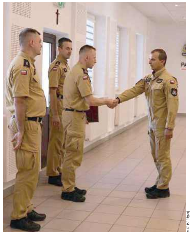
Komendant wręczył akty mianowania