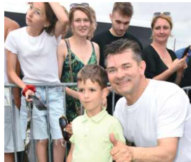
Pamiątkowe zdjęcie z Zenkiem Martyniukiem