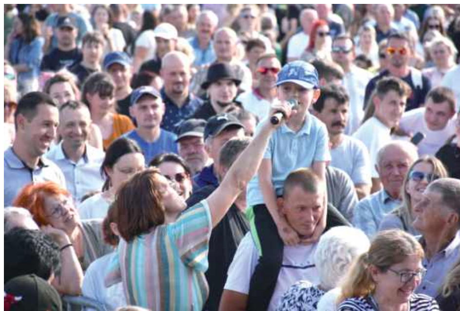
Mieszkańcy chętnie skorzystali z zaproszenia na imprezę