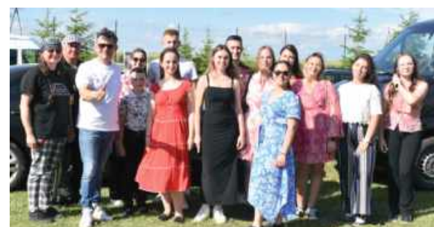
Wspólnym zdjęciem z gwiazdą imprezy nie było końca