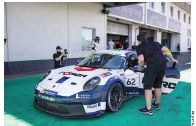
W tym roku Karola czekają jeszcze cztery starty w serii Porsche Sports Cup Deutschland 2025. Najbliższy już w nadchodzący weekend w Austrii