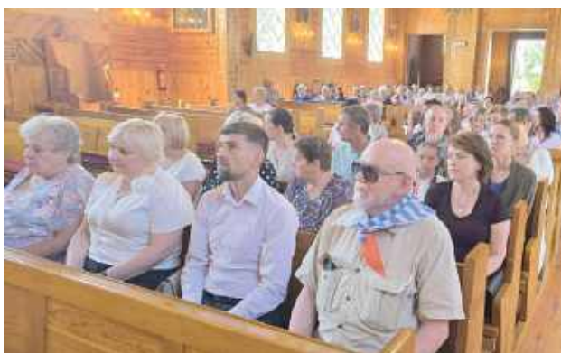
Obchody rozpoczęły się mszą świętą w intencji pomordowanych, odprawioną w kościele pw. Świętych Apostołów Piotra i Pawła w Majdanie Starym

W sobotę, 6 lipca mieszkańcy gminy Księżpol oraz goście z okolicznych miejscowości zgromadzili się w Majdanie Starym, aby uczcić 82. rocznicę tragicznej pacyfikacji Majdanu Nowego i Majdanu Starego przez okupanta niemieckiego w czasie II woj-