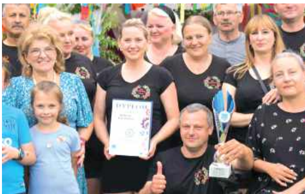
I miejsce zajęła drużyna z Frampola