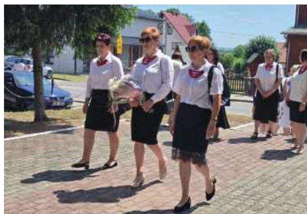
Uczestnicy uroczystości przemaszerowali pod pomnik ofiar pacyfikacji, gdzie odbyła się ceremonia złożenia wieńców i zapalenia zniczy

Obchody rozpoczęły się mszą świętą w intencji pomordowanych, odprawioną w ko-