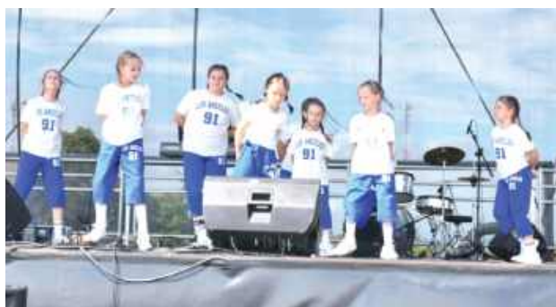
Na scenie pojawili się również lokalni artyści