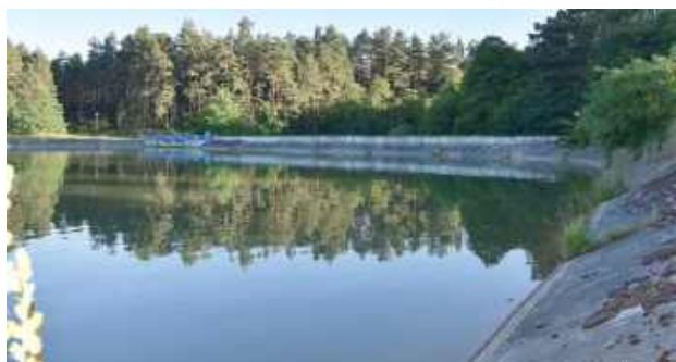
Jak wstępnie ustalono, kobieta w dniu zdarzenia spożywała alkohol

W środę (2 lipca) dyżurny tomaszowskiej policji otrzymał zgłoszenie, że przy zaporze zalewu na rzece „Sopot” w Majdanie Sopockim z wody została