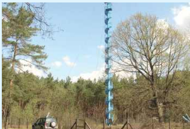
Specjalny maszt przeciwpożarowy pojawi się jeszcze w tym roku w Nadleśnictwie Zwierzyniec

Statystyki są niestety alarmujące. Od stycznia do końca maja br. w Polsce zanotowano 2 491 pożarów lasów, co oznacza wyraźny wzrost w porównaniu do analogicznego okresu w 2024