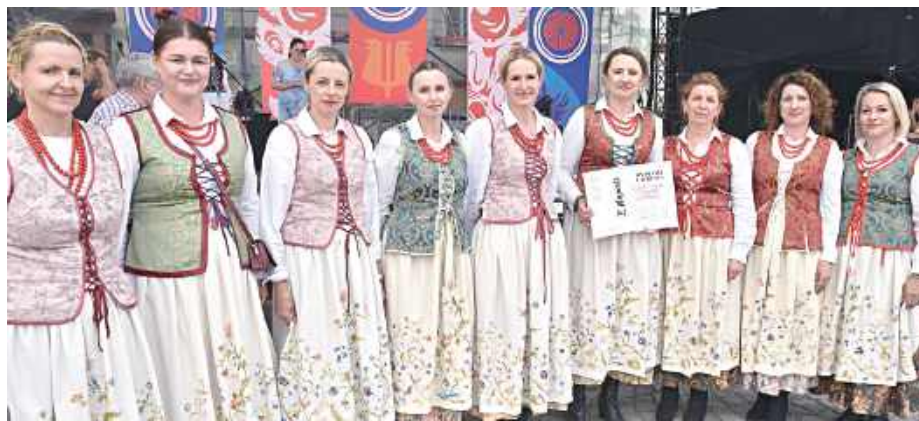
„Jarzębina” zajęła w Kazimierzu zaszczytne II miejsce!

W dniach 27-29 czerwca malowniczy Kazimierz Dolny ponownie stał się stolicą polskiego folkloru. Odbył się tu 59. Ogólnopolski Festiwal Kapel i Śpiewaków Ludowych – jedno z najważniejszych wydarzeń w kalendarzu kulturalnym dla miłośników tradycyjnej muzyki, śpiewu i obrzędów ludowych. W tym roku wydarzenie przyciągnęło, jak co roku, wielu uczestników oraz licznych gości z całego kraju.