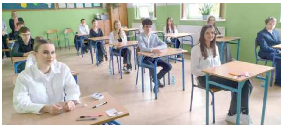
Egzamin Ósmoklasisty w Szkole Podstawowej nr 1 w Biłgoraju. W tej szkole uczniowie osiągnęli najlepsze wyniki w mieście z języka polskiego i matematyki

Najwięcej uczniów, bo łącznie 287, pisało egzamin w mieście Biłgoraju, gdzie znajduje się pięć szkół podstawowych. Najlepiej wypadła Szkoła Podstawowa nr 1