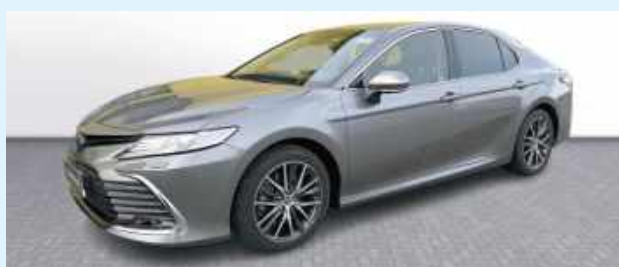
Szara hybrydowa Toyota Camry za blisko 180 tysięcy złotych. To będzie, służbowy samochód prezydenta Zamościa Rafała Zwolaka

- Za środki uzyskane ze sprzedaży samochodu planujemy zakupić używane samochody typu minibus dla Schroniska dla Bezdomnych