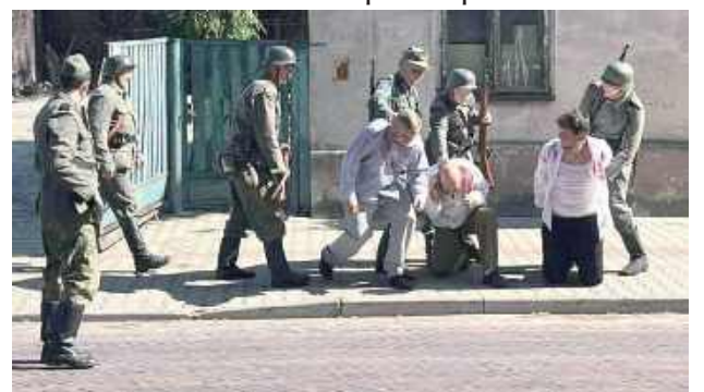
Wydarzenie rozpoczęło się od inscenizacji na ul. Wacek Wasilewskiej