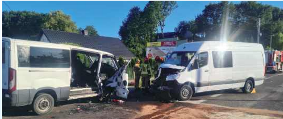
30-letni kierowca busem marki Iveco nagle zjechał na przeciwny pas ruchu, gdzie czołowo zderzył się z busem marki Mercedes

- Ze wstępnych ustaleń policjantów pracujących na miejscu wynika, że 30-letni kierowca Iveco, poruszający się w kierunku Zamościa, nagle zjechał na przeciwny pas ruchu, gdzie zderzył się czołowo z busem marki Mercedes, którym kierował