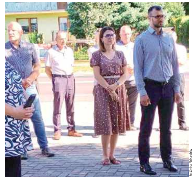
Społeczność Aleksandrowa pokazała, że pamięta i nie zapomni