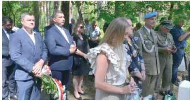
W uroczystościach brały delegacje samorządowe i z środowisk patriotycznych

6 lipca władze samorządowe, organizacje patriotyczne i historyczne wzięły udział w uroczystościach patriotycznych. Wydarzenie rozpoczęło się od inscenizacji na ul. Wacek Wasilewskiej. Następnie została odprawiana msza święta w kościele pw. Trójcy Przenaj-