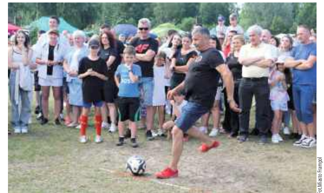
Walka o każdą bramkę, szybkie akcje i gromki doping - na boisku nikt nie odpuszczał