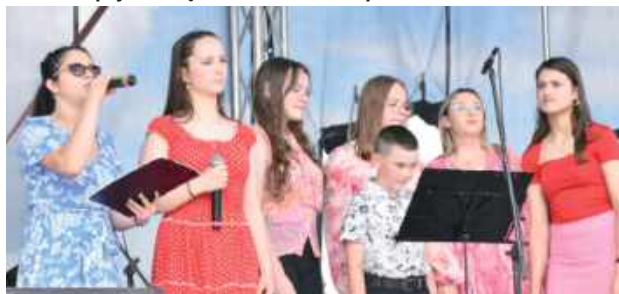
To była już V edycja Turobińskiej Gali Folkloru i Disco Polo