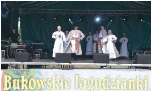
Na scenie zaprezentowały się zespoły ludowe