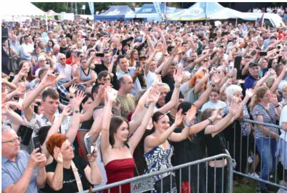
Publiczność świetnie się bawiła