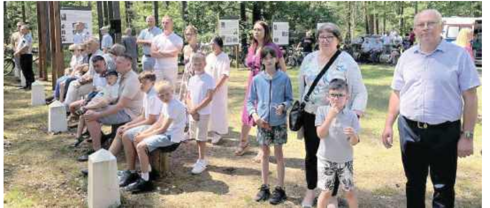
Na uroczystościach na Rapach zjawili się sporo mieszkańców