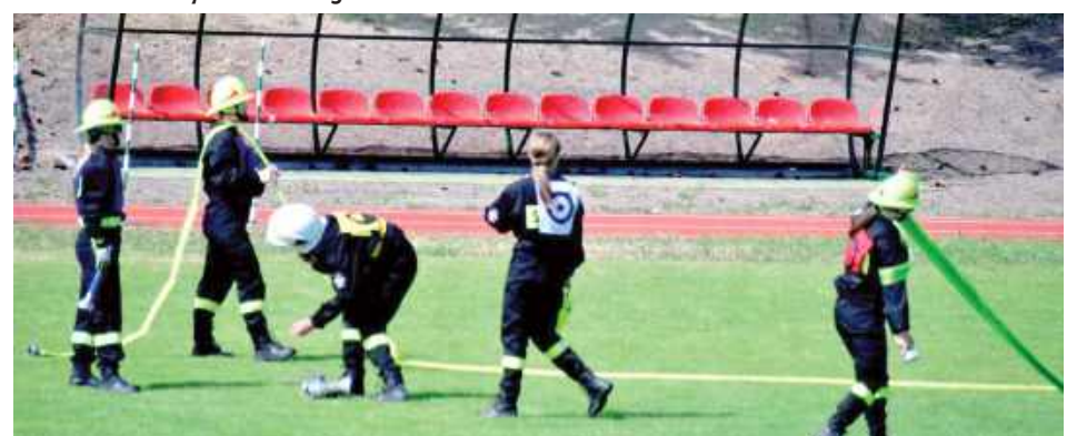
XIV Powiatowe Zawody Sportowo-Pożarnicze Ochotniczych Straży Pożarnych