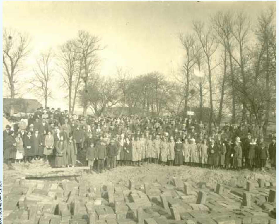
Lata 20. Wmurowanie kamienia węgielnego pod Szkołę Rolniczą w Janowicach