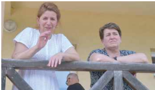
Impreza, pomimo upału, odbyła się w znakomitej atmosferze