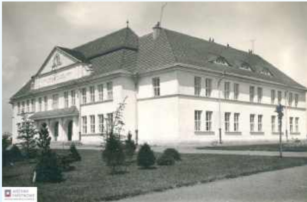
Budynek Ludowej Szkoły Rolniczej Męskiej im. Józefa Piłsudskiego w Janowicach w latach 30.

W wyniku kolejnych zmian szkoła funkcjonowała jako Liceum Mechaniki Rolnej, od 1952 r. Technikum Rolnicze, a od 1954