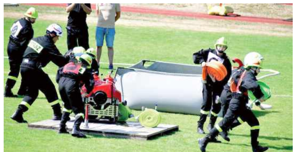
Zawody strażackie cieszyły się ogromnym zainteresowaniem