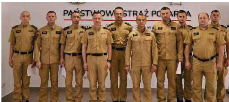
Mundury, skupienie i duma. Tak wyglądał dzień awansów

drowych. Do biłgorajskiej jednostki oficjalnie dołączyli także absolwenci szkół pożarniczych. Nowi strażacy zasilają szeregi Jednostki Ratowniczo-Gaśniczej PSP w Biłgoraju, gotowi do działania od pierwszego dnia służby. - Życzę Wam sukcesów, satysfakcji z realizacji nowych zadań oraz niegasnącego zapału do służby - mówił bryg. Taradyś, zwracając się do wszystkich mianowanych.