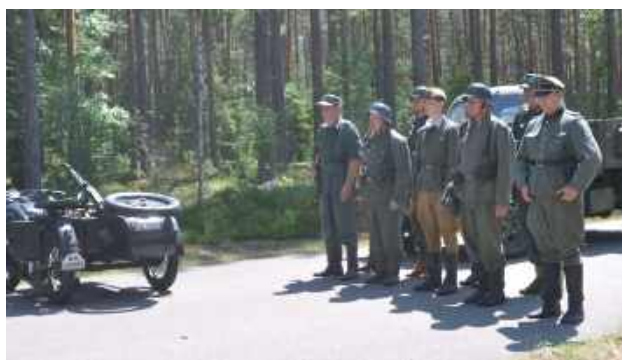
Rekonstrukcja bitwy. Niemcy rozstrzelali ponad 60 partyzantów w lesie Rapy