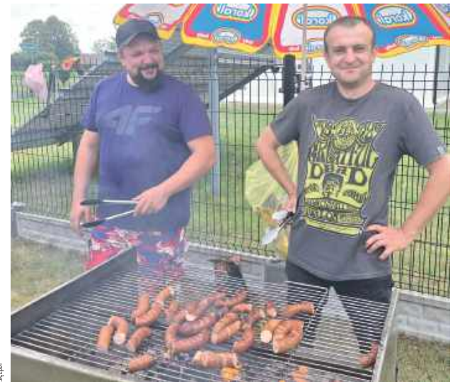
Były i kielbaski z grilla