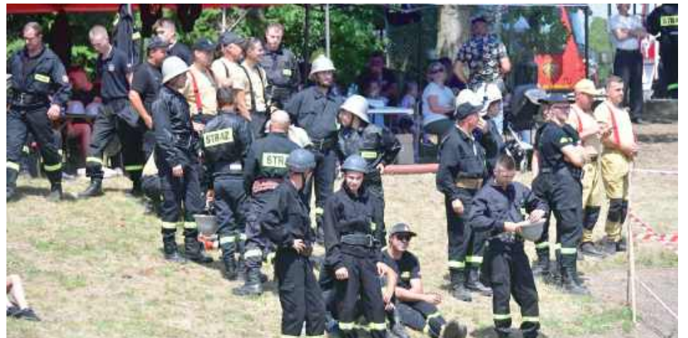
Powiatowe Zawody OSP w Tarnogrodzie