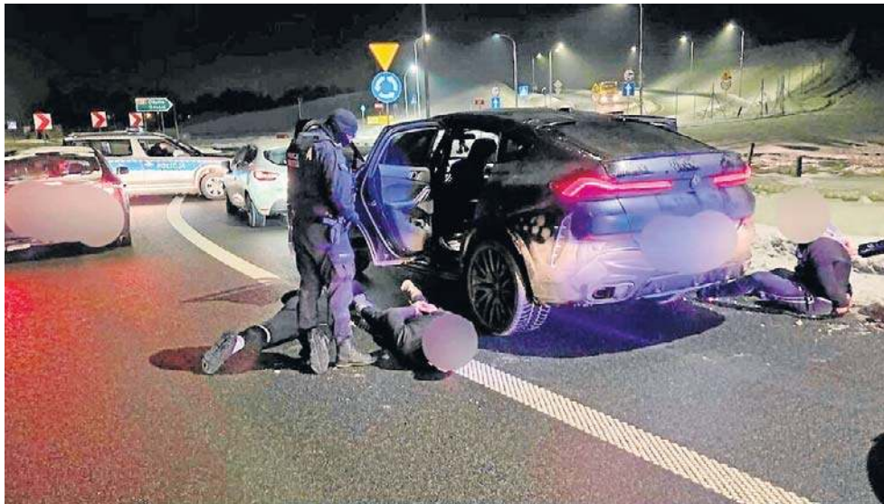
Do zdarzenia doszło w poniedziałek około godziny 19.40. Dyżurny pPolicji w Kościerzynie otrzymał zgłoszenie o wtargnięciu osób do obiektu sportowego.

Zatrzymani mają tłumaczyć, że przyjechali do Kościerzyny turystycznie. Jeden „odwiedzał babcię”, drugi „jadł kebab”.