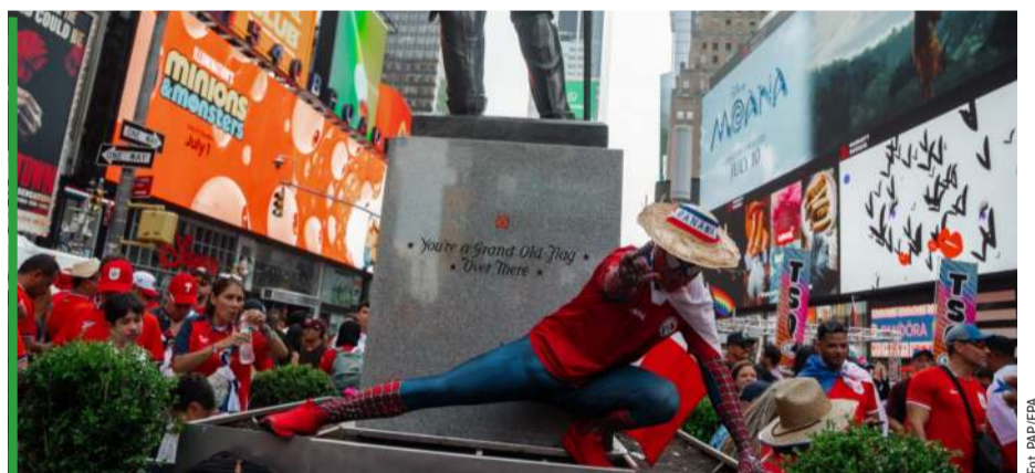
Wśród panamskich fanów był nawet... Spiderman. Ale i on nie pomógł rodakom w zdobyciu choćby jednej bramki na mundialu.