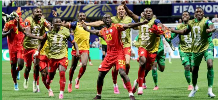
Szalona radość piłkarzy Demokratycznej Republiki Konga.

Faza pucharowa rozpoczęła się wczoraj od meczu Republika Południowej Afryki – Kanada (patrz strona 5). Etap 1/16 finału będzie nam towarzyszył do soboty 4 lipca, gdy na stadionie w Kansas City zagrają Kolumbia i Ghana. W tej fazie rozgrywek mistrzostwa wciąż będą odbywać się w Kanadzie i Meksyku. U północnego sąsiada Stanów Zjednoczonych zawodnicy zagrają 3 lipca. Portugalia i Chorwacja zaprezentują się przed publicznością w Toronto, a Szwajcaria i Algieria w Vancouver. Z kolei Holandia i Maroko zagrają