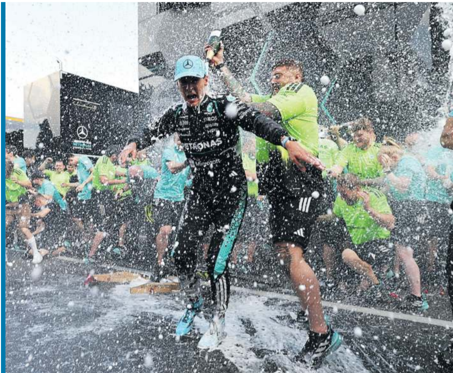
George Russell świętuje zwycięstwo w GP Austrii.

Na 3. miejscu wyścig w Austrii ukończył zespołowy kolega Russella Kimi Antonelli. Włoch, nie pełniąc błą-