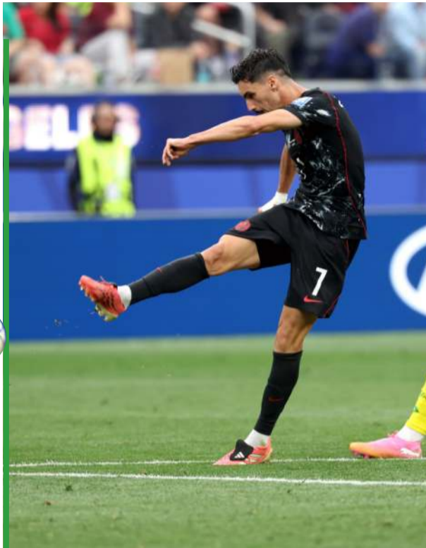
Moment, który dał Kanadzie awans do 1/8 finału MŚ!