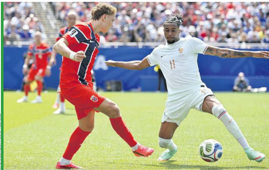
Francuzi wierzą w Michaela Olise (z prawej).

- Było wiele dyskusji na temat tego, jak w pełni wykorzystać siłę ofensywną drużyny, w której jest tylu znakomitych zawodników, a teraz doszedł jeszcze Michael Olise. Zastanawiano się, czy Francja faktycznie wykorzysta potencjał młodej fali utalentowanych graczy, jak wspomniany Olise, ale też Desire Doue. Wiadomo, grali razem na igrzyskach olimpijskich w Paryżu, gdzie sięgnęli po srebrne medale. To kwestia tego, jak wykorzystać tę siłę ognia, najlepszy atak na świecie. A kolejną rzeczą to de-