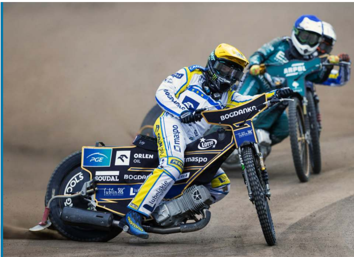
Zielonogórczom z trudem przychodziło gonienie Motoru.