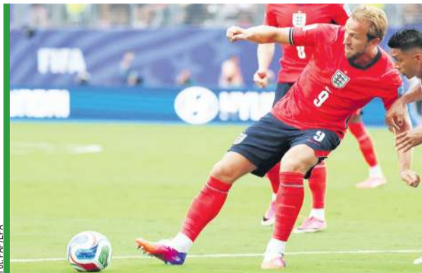
Harry Kane z 12 bramkami został najlepszym strzelcem reprezentacji w Anglii w historii finałów MŚ.

Pierwsza połowa meczu rozgrywanego na MetLife Stadium w Nowym Jorku/New Jersey przypominała mecz Wyspiarzy z Ghaną kilka dni wcześniej w Bostonie. Faworyci nie mogli wówczas przedrzeć się przez szyki dobrze zorganizowanego rywala, który choć już pożegnał się z turniejem, to chciał chociaż zdobyć honorowego gola. Nie udało się. U Anglików, wspieranych przez dziesiątki tysięcy swoich fanów w Stanach (z których trzech przed meczem zostało... zatrzymanych przez policję), starał się na lewym skrzydle aktywny Marcus Rashford, ale bez efektu bramkowego. W ogóle Trzy Lwy Albionu grał ospale, niemrawo. Było tak nawet wtedy, gdy Chorwacja prowadziła z Ghaną, a przy