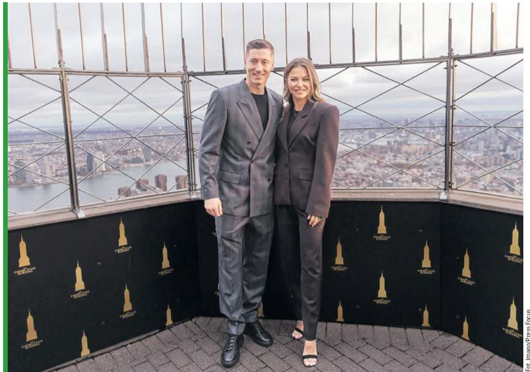
Anna i Robert Lewandowscy na Empire State Building.

Lewandowski 16 maja ogłosił, że po sezonie opuści Barcelonę. W jej barwach występował od 2022 roku. Zdobył trzykrotnie mistrzostwo Hiszpanii