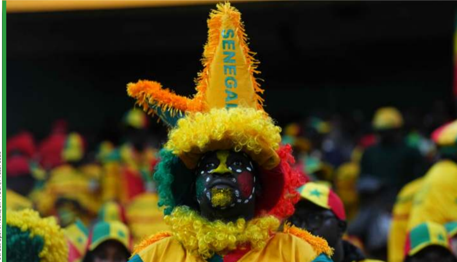
Kibice afrykańscy zawsze barwni, zawsze zaskakujący.

Czwarta drużyna poprzedniego mundialu nie boi się nikogo, Brazylia może mówić o szczęściu, że z Marokańczykami zremisowała. W tym meczu doszło do niezwykłego precedensu, wskazującego na tendencje w światowym futbolu. Przez kwadrans na murawie znajdowali się reprezentanci Maroka, którzy w komplecie urodzili się poza jego granicami. Gwiazdą jest boczny obrońca Achraf Hakimi z PSG, który prezentuje