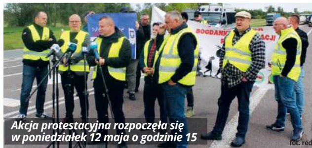
Akcja protestacyjna rozpoczęła się w poniedziałek 12 maja o godzinie 15

Argumentują, że przed wybuchem wojny za obsługę bieżących zleceń odpowiadało ok. 50% kierowców ukraińskich