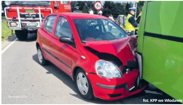
fol. KPP we Włodawie

● GM. WOLA UHRUSKA W czwartek (8 maja) po południu w Uhrusku doszło do poważnego zdarzenia drogowego. Kierujący toyotą yaris 64-latek z niewiadomych przyczyn zjechał nagle na przeciwny pas ruchu i czołowo zderzył się z autobusem. Mężczyzna z obrażeniami ciała trafił do szpitala.