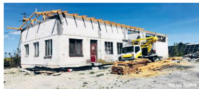
fol. UG Rudnik

Rolniczym w Płonce wygasła już dawno. W ostatnich latach gmina oddała pod dzierżawę budynki oraz grunt najemcy. Ten jednak zmarł i gmina ponownie jest właścicielem tego terenu. Pod koniec 2023 r. uzyskała dofinansowanie ze środków Rządowego Funduszu Polski Łądz, aby wykonać moder-