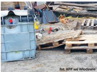
fol. KPP we Włodawie

I apeluje o rozsądek podczas prac polowych oraz obsługi maszyn rolniczych. Nieostrożność może spowodować poważny wypadek, podczas którego narażamy się na utratę zdrowia, a nawet życia. (apm)