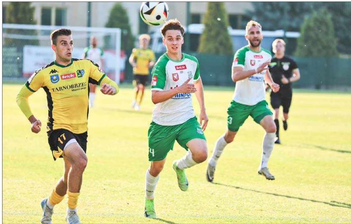
Biało-zieloni nie byli tym razem w stanie urwać punktów Siarce na jej stadionie.

Geniec, Czarny, Panasiuk - Łanucha (64 Kieraś), Żmuda (79 Stróżik), Fedan - Bator (65 Lis), Zawisłak (64. Maik), Kulon (64. Czuchra).