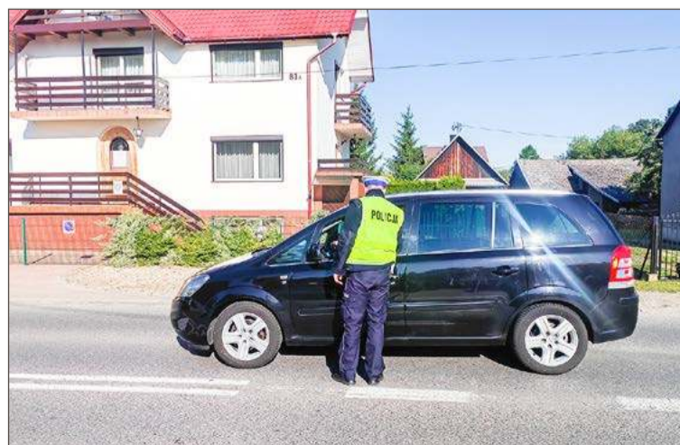
Kontrola trzeźwości prowadzona była także w Straszęcinie.