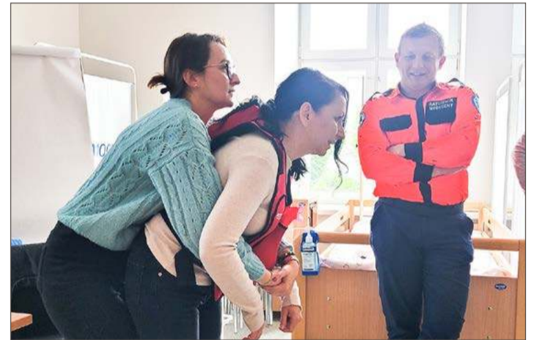
Szkolenie to przede wszystkim zajęcia praktyczne.