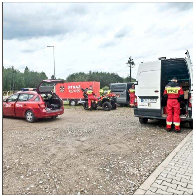
O pomoc poproszeni zostali strażacy z OGPR w Zawadce Brzostockiej.