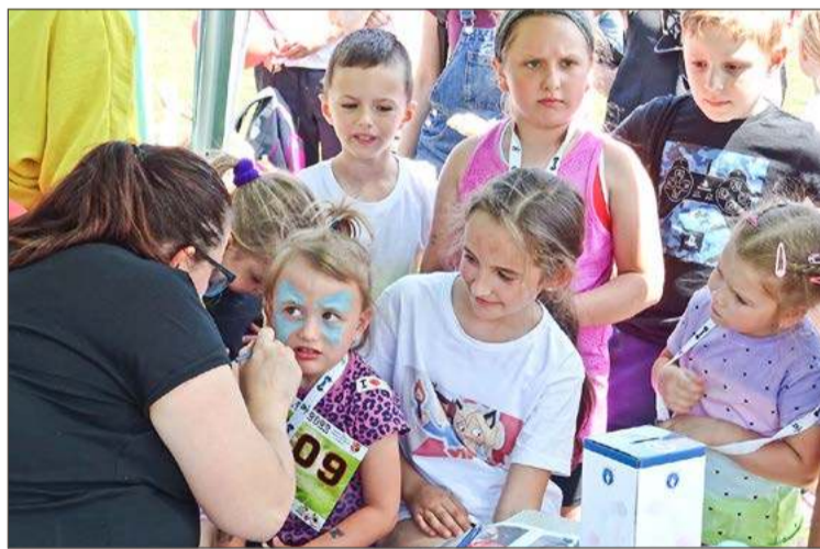
W biegach dla dzieci wystartuje w tym roku 250 dziewczynek i chłopców.

Jedną z atrakcji będzie pokaz karate w wykonaniu Dębickiej Aka-