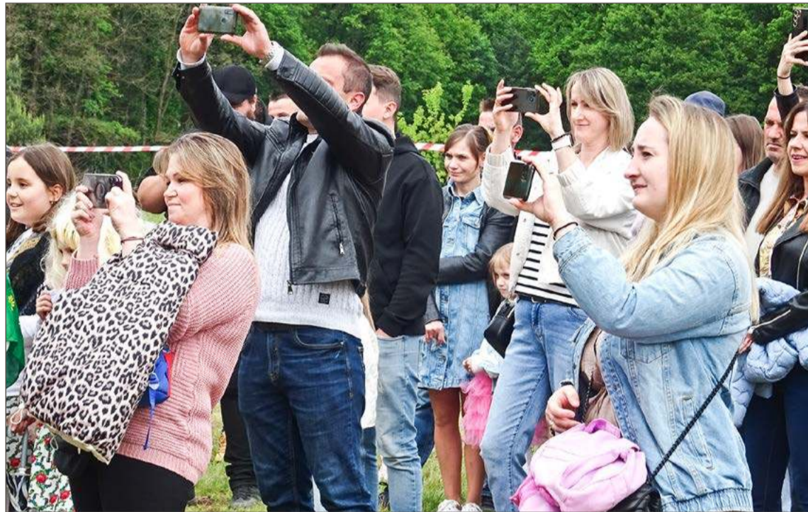
Na scenie w Lipinach występowały dzieci, a rodzice nie mogli nie uwiecznić tego momentu.