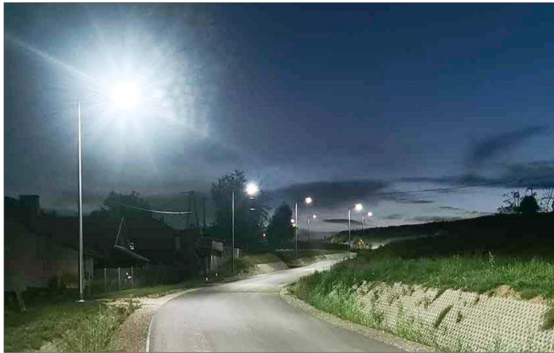
W tej kadencji nowe oświetlenie powstało m.in. w Skurowej.

To jednak nie wszystko, bo dwie kolejne lampy mają stanąć mniej więcej na granicy Przeczycy i Skurowej. Burmistrz nie pamięta, jakie