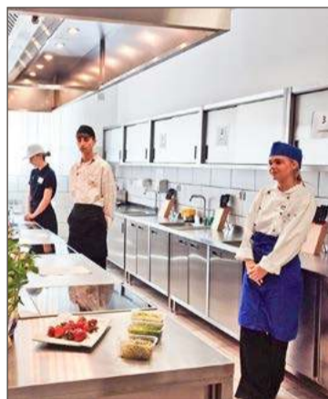
Uczennica z Dębicy walczyła w zawodzie kucharz.

W Gołdapi odbył się finał XX edycji Ogólnopolskiego Konkursu Sprawny w zawodzie.