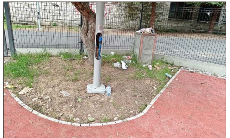
Obecnie sytuacja na placu zabaw wygląda właśnie tak.

O tym, że wcześniej wszystko zostanie tam posprzątane i dopro-