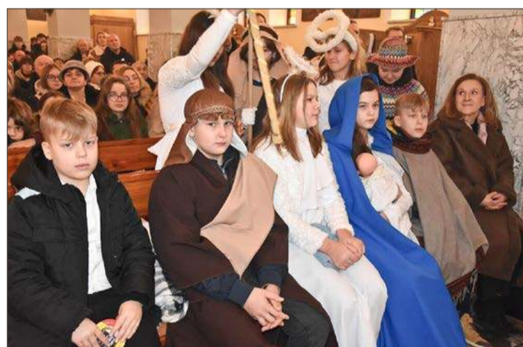
Kolędnicy misyjni z parafii NSPJ w Dębicy-Latoszynie.

Borowa - 4 660 zł; Brzeźnica - 7 500 zł; Czarna - 1 700 zł; Dobrków - 4 700 zł; Góra Motyczna - 1 600 zł; Grudna Górna - 2 800 zł; Gumńska - 3 980 zł; Jodłowa - 8 272 zł; Jodłowa Górna - 3 380 zł; Kamienica Górna - 850 zł; Korzeniów - 1 000 zł;