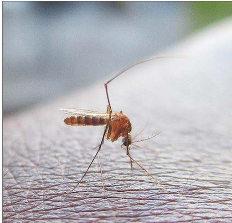
Komary są uciążliwe dla ludzi. Ale ich chemiczne usuwanie budzi od wielu lat liczne kontrowersje.

W poprzednich latach odkomarzanie było przeprowadzane zarówno w Dębicy, jak i w gminie Dębica. Z komunikatów wydawanych przez ten drugi samorząd wy-