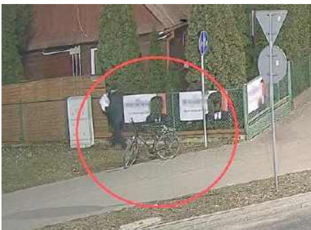
Niszczenie, zrywanie czy zakrywanie ogłoszeń wyborczych jest karalne. Policja szuka sprawców. Nagrał ich miejski monitoring

We wszystkich tych sprawach prowadzone są czynności