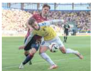
Motor przegrał pierwszy mecz u siebie od 19 października ub.r.

5 października ubiegłego roku doszło do jak dotąd największej niespodzianki w obecnej kampanii z udziałem Motoru. Żółto-biało-niebiescy pokonali wówczas