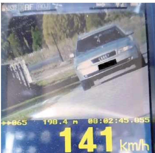
Mężczyzna został ukarany mandatem w wysokości 2,5 tys. zł oraz 15 punktami karnymi

- Urządzenie wykazało, że w terenie zabudowanym jechał 141 km na godzinę. Oznacza to, że przekroczył dopuszczalną w tym miejscu prędkość o 91 km/h - informuje nadkom. Barbara Salczyńska-Pyrchła z KMP w Białej Podlaskiej. - Po zatrzymaniu auta do kontroli okazało się, że za kierownicą osobówki siedzi 20-latek, który spieszył się do pracy.