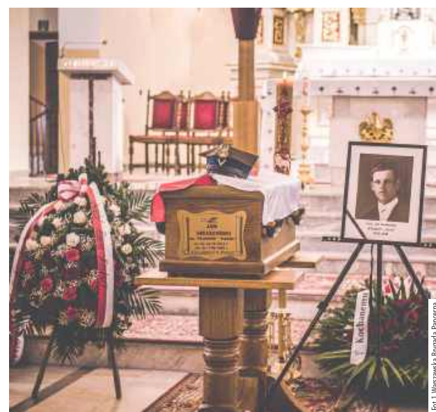
Uroczystości pogrzebowe odbyły się 8 kwietnia w kościele pw. Chrystusa Króla w Międzyrzeczu Podlaskim