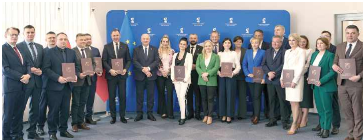
Beneficjentami są Gminy: Krasnobród, Wólka, Biłgoraj, Strzyżewice, Mełgiew, Chodel, Fajstławice, Serniki, Tomaszów Lubelski, Leśniowice, Drelów, Ludwin oraz Zakład Gospodarki Komunalnej w Trzebieszowie Sp. z o.o. i Przedsiębiorstwo Gospodarki Komunalnej i Mieszkaniowej Sp. z o.o. w Terespolu

Gmina Drelów oraz Terespol znalazły się w gronie 14 beneficjentów, którzy otrzymali wsparcie w ramach programu Fundusze Europejskie dla Lubelskiego 2021-2027. W sumie na rozbudowę i modernizację infrastruktury wodno-ściekowej w województwie przeznaczono ponad 77 mln zł, z czego niemal 53 mln zł stanowi unijne dofinansowanie.