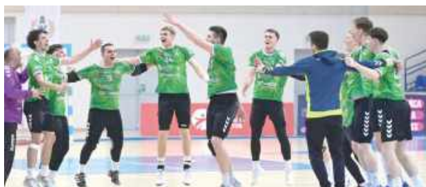
AZS pewnie ograł Olimpię

Zwycięstwo cieszy, ale bialczanie cały czas muszą oglądać się za siebie. Do końca sezonu zostało pięć kolejek. AZS jest w grupie zespołów, które nie mogą być pewne utrzymania w Lidze Centralnej. Na ten moment nasi mają przewagę zaledwie pięciu punktów nad SMS-em ZPRP Kielce. Tak naprawdę o byt na drugim poziomie rozgrywkowym w Polsce musi drzeć również zajmująca ósmą lokatę Anilana Łódź.