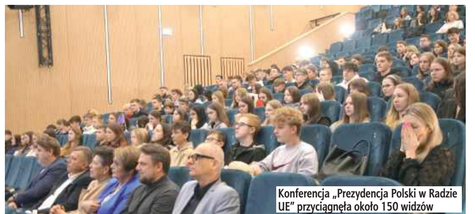
Konferencja „Prezydencja Polski w Radzie UE” przyciągnęła około 150 widzów