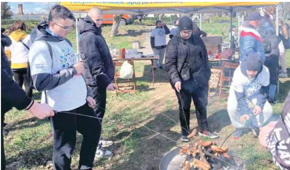
Po akcji odbyło się ognisko