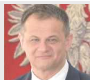
Pi wójt gminy Drelów

Zgodnie z dokumentacją, projekt pod nazwą „Poprawa funkcjonalności komunikacyjnej w Gminie Drelów – etap II” ma na celu poprawę dostępności komunikacyjnej i zwiększenie komfortu życia mieszkańców. Główne zadanie to budowa trasy biegnącej przez Łysą Górę z włączeniem do drogi wojewódzkiej nr 813 na odcinku Miedzyrzec Podlaski – Parczew. Prace na tej trasie już się rozpoczęły – droga, która dotychczas była jedynie lokalnie utwardzona tłuczniem, zo-