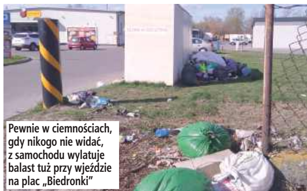
Pewnie w ciemnościach, gdy nikogo nie widać, z samochodu wylatuje balast tuż przy wjeździe na plac „Biedronki”

W bialskich osiedlach ustawione są pojemniki na tekstylia. Białczanie nie muszą jeździć z każdą dziurawą skarpetą do punktu selektywnego zbierania odpadów komunalnych, jak to bywa w niektórych innych miejscowościach.