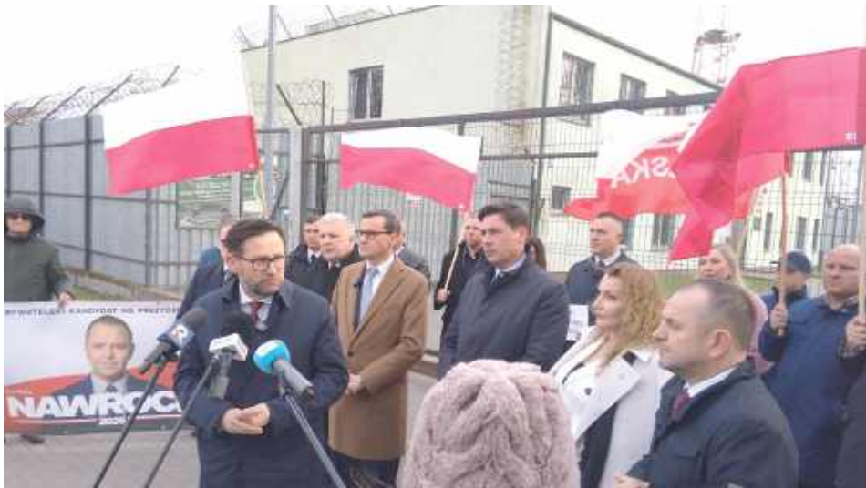
Konferencja prasowa przed ośrodkami strzeżonym i otwartym dla cudzoziemców. - Chcemy powiedzieć głośno: stop nielegalnej imigracji. Mamy do czynienia z trzecią zdradą graniczną Donalda Tuska - grzmieli działacze PiS-u

Na otwarte spotkanie z byłym premierem Mateuszem Morawieckim i byłym szef Orłenu Danielem Obajtkiem przyszło około 300 osób. Był hymn, przemówienia, obrona prawicowych telewizji, ostra krytyka rządu Donalda Tuska i paktu migracyjnego.