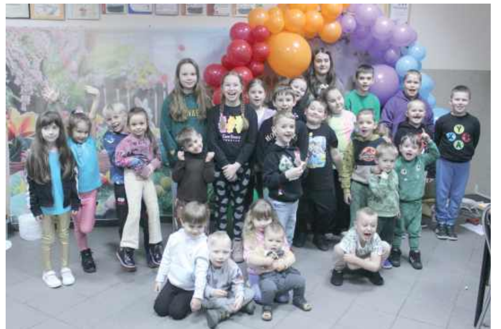
Uczestnicy warsztatów zorganizowanych przez OSP Zawadki

Zabawa i wielkanocne rękodzieło – tak wyglądało piątkowe popołudnie zorganizowane przez druhow z OSP Zawadki w Międzyrzeczu Podlaskim. Wydarzenie przyciągnęło dzieci i ich opiekunów, a lista uczestników zapełniła się kilka godzin po ogłoszeniu warsztatów.