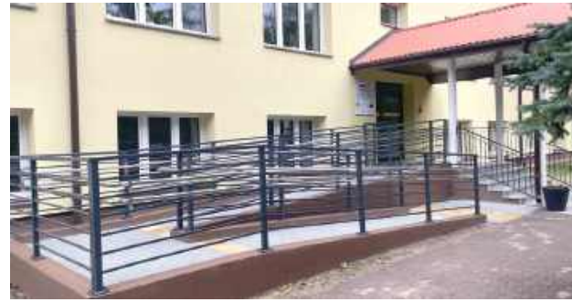
Wiele zmieniło się również w szkole w Rudnikach. Wykonano m.in. podjazd przy wejściu głównym do budynku oraz dostosowano toalety dla dziewcząt i chłopców do potrzeb osób z niepełnosprawnościami

W Rzeczy, w Publicznej Szkole Podstawowej im. Kornela Makuszyńskiego, uczniowie korzystają już z całkowicie odnowionych łazienek. Wymieniono instalacje, zamon-