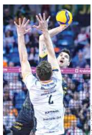
LUK przegrał z JSW trzeci raz w sezonie