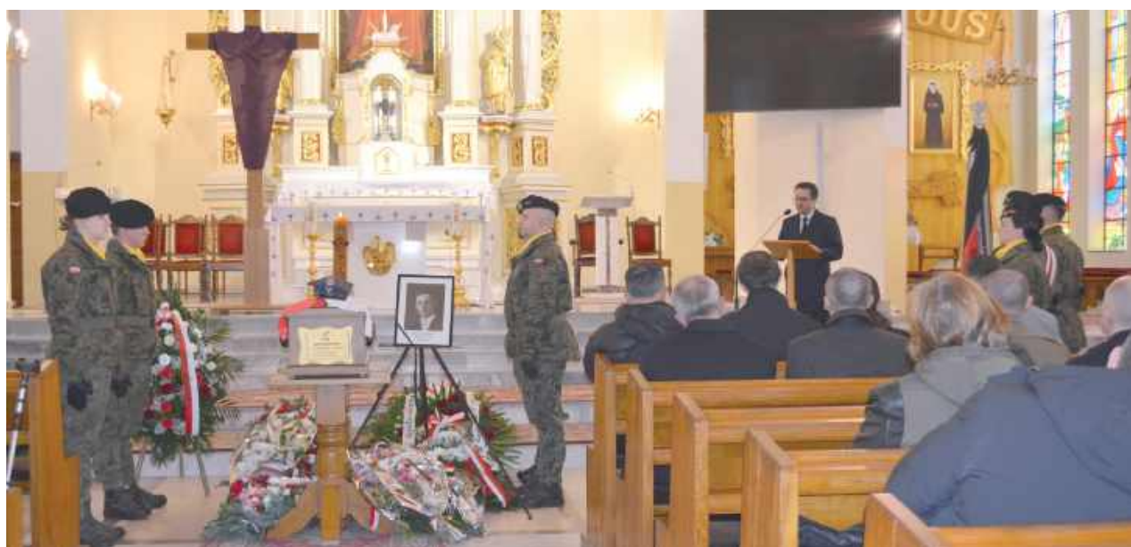
Ceremonia miała charakter państwowy i odbyła się z udziałem asysty wojskowej