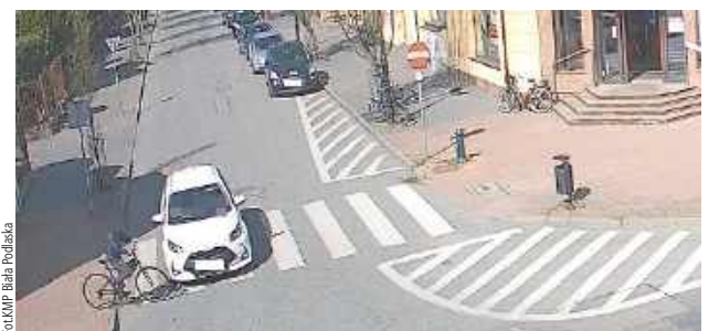
Wszystko widać jak na dłoni na nagraniu z miejskiego monitoringu

Do szpitala trafił rowerzysta, który wjechał na przejście dla pieszych i zderzył się z samochodem osobowym.