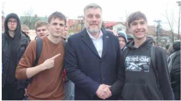
Pierwszy przybył do Białej Podlaskiej w kampanii wyborczej kandydat na Prezydenta RP nieustannie się uśmiechał, witał i dawał autografy

Niezwykle skromne było spotkanie wyborcze w Białej Podlaskiej pośta dr Adriana Zandberga, kandydata partii Razem. W istocie stało się ono konferencją prasową z długim epizodem pozowania do zdjęć z młodzieżą i dawania uczniom autografów.