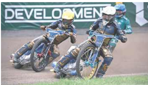
Zawodnicy Orlen Oil Motoru Lublin pewnie rozprawili się z Falubazem Zielona Góra, wygrywając na wyjeździe 31:59

Orlen Oil Motor Lublin przyzwyczaił swoich kibiców do szybkiego i bardzo przekonującego rozprawiania się ze słabszymi rywalami. Mogło się wydawać, że Falubaz Zielona Góra, szczególnie na swoim torze ma wszystko by postawić się mistrzom Polski. Rzeczywiście, pierwszy bieg zakończył się remisem. Na starcie kompletnie przysnął Jack Holder, ale gorszy moment kolegi przykrył fantastyczny od początku tegorocznej jazdy na żuźlu Do-