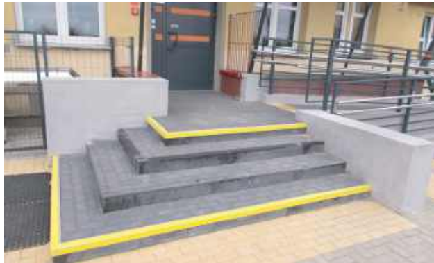
W Rogoźnicy przebudowano m.in. główne wejście do budynku

W Publicznej Szkole Podstawowej im. Karola Krysińskiego w Rudnikach wykonano podjazd przy wejściu głównym do budynku oraz dostosowano