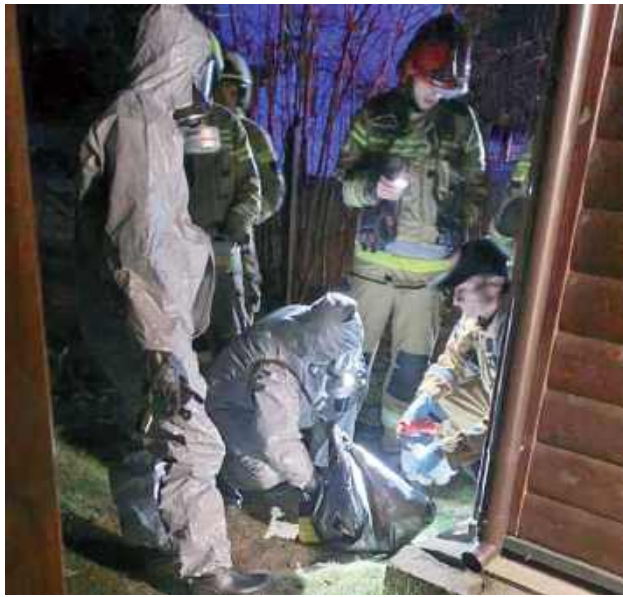
Grupa Chemiczna przeprowadziła pomiary powietrza pod kątem ośmiu różnych związków chemicznych

4 kwietnia o godzinie 20.53 służby ratunkowe zostały zadysponowane do pożaru poddasza w miejscowości Zgórznica, gmina Stoczek Łukowski.