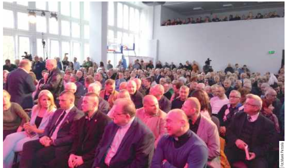
Hala sportowa białskiego Medycznego Studium Zawodowego pękła w szwach, ludzie cisnęli się, stojąc nawet w bocznych przejściach

Wiele uwagi politycy PiS poświęcili sprawom nielegalnej migracji. Ich przyjazd do Białej Podlaskiej łączył promowanie Karola Nawrockiego jako kandydata na prezydenta z protestem przeciwko polityce migracyjnej rządu. O tym mówili na otwartym spotkaniu w hali oraz podczas nieco wcześniej zorganizowanej konferencji prasowej.