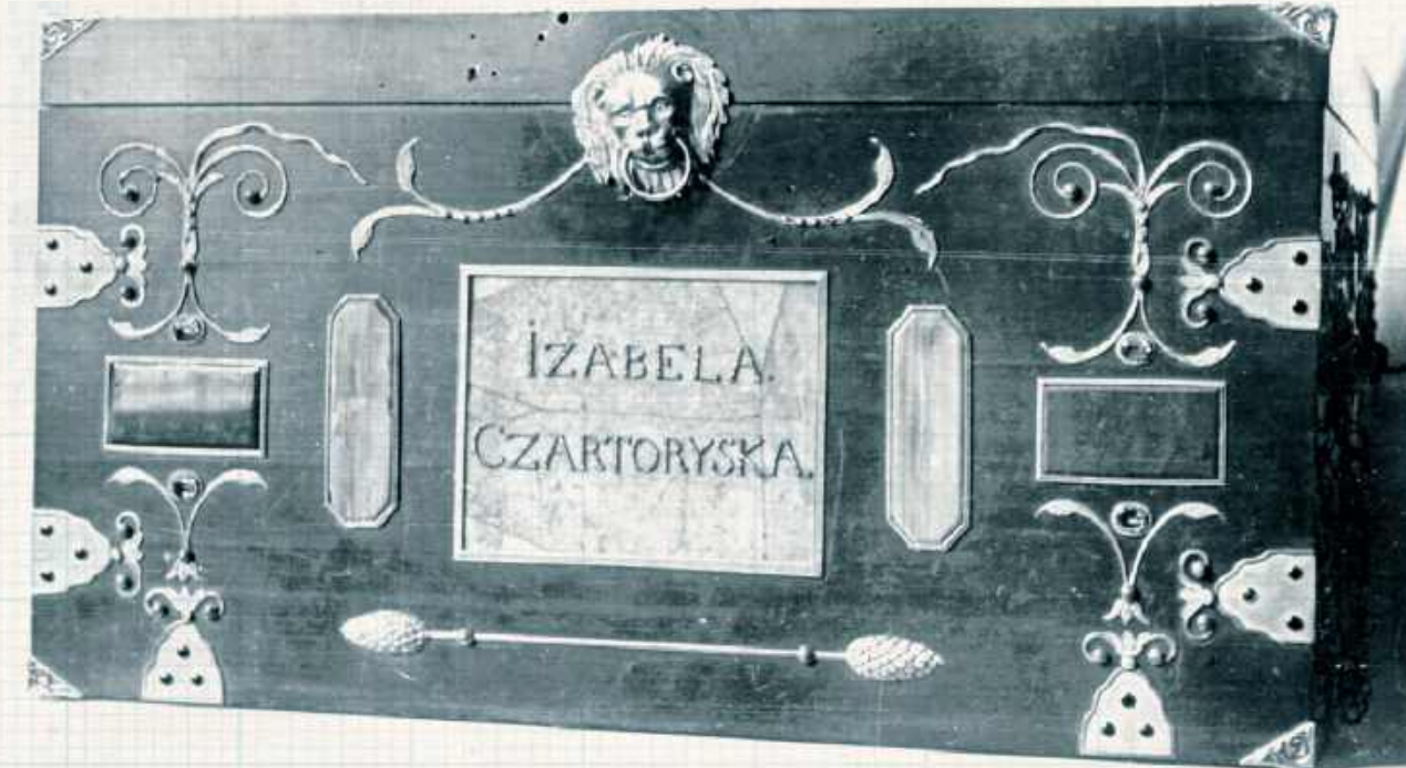
Ostatnie zdjęcie Szkatuły. Dzisiaj w polskich rękach jest tylko siedem z kilkudziesięciu przedmiotów, które się w niej znajdowały

Była więc emaliowana i pozłocana broszka z miniaturą króla Augusta III Sasa. Były dewiszka do zegarka króla Stanisława Augusta Poniatowskiego z jedwabiu i złota z gemmą, dwa złote zapięcia od bransolet, jedno z wizerunkiem królowej Marii