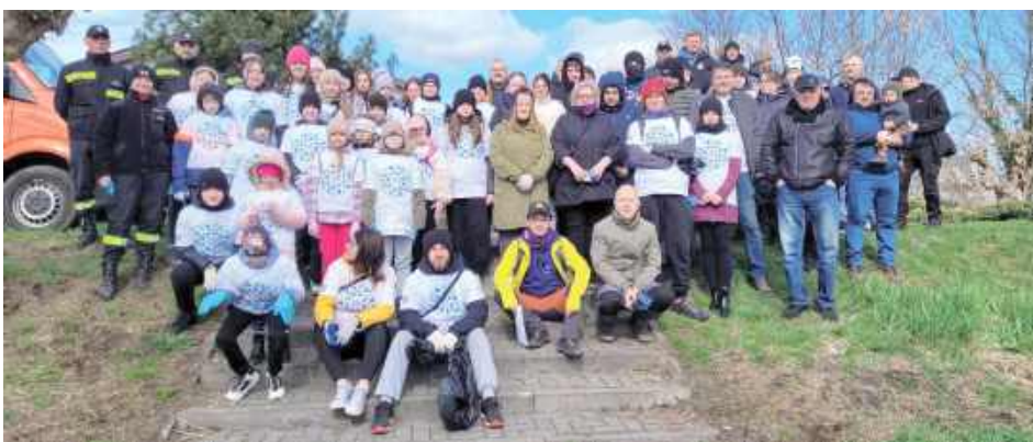
Uczestnicy Operacji Czysta Rzeka

MIĘDZYRZEC PODLASKI: Operacja Czysta Rzeka odbyła się po raz kolejny 5 kwietnia. Ponad sześćdziesięcioro wolontariuszy posprzątało brzegi i koryto Krzny oraz Międzyrzeckie Jezioro.