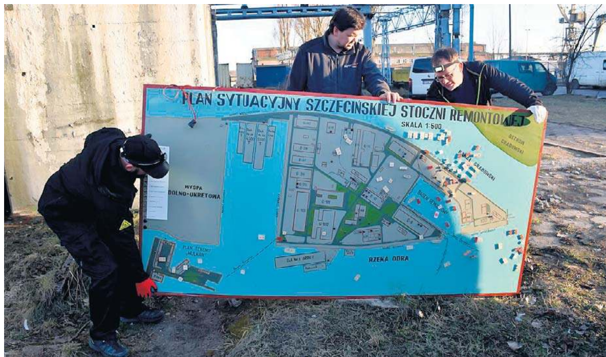
Pasjonaci historii przejęli wyjątkowy plan stoczni „Gryfia” z czasów zimnej wojny

Donald Trump ostro domaga się wsparcia w Cieśninie Ormuz. Sikorski: rozważymy to str. 7