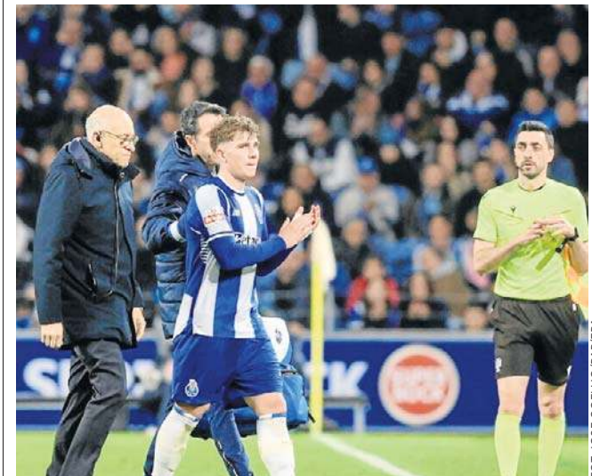
FOT. JOSE COELHO/PAPPEA

Zatem kibice muszą uzbroić się w cierpliwość i poczekać do najbliższego piątku, bo wtedy PZPN ogłosi powołania trenera Urbana na baraże o mundial. © P