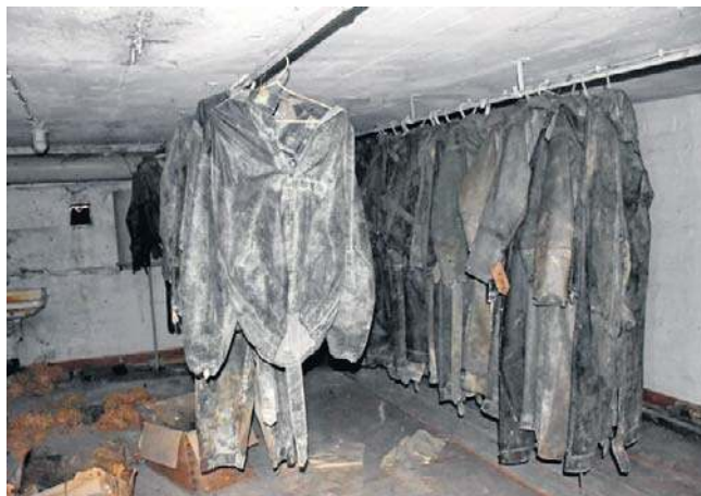
Duża galeria i film ze schronu na naszej stronie www.gs24.pl

- Pomysł na nową salę zrodził się z faktu, że Szczecin to miasto portowe. Te pamiątki są na co dzień niedostępne dla turystów, ponieważ stocznia jest ważnym obiektem strategicznym. Stąd pomysł, a potem przychylność władz stoczni, by