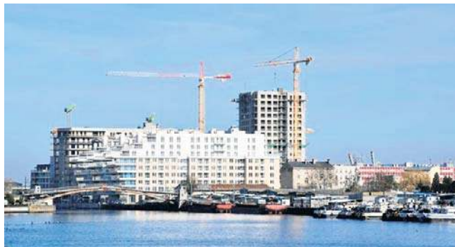
Największe emocje budzi problem - jak wysokie budynki można na obu wyspach budować

Największe emocje budzi jednak wysokość budynków. W analizowanych wariantach pojawiają się obiekty o wysokości 55 metrów, 100 metrów,