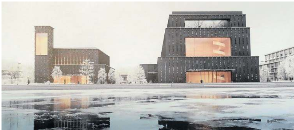
Pracownia SAAW specjalizuje się w projektowaniu budynków wielorodzinnych, usługowych oraz biurowych

Oba tworzące ją budynki będą się od siebie znacząco różnić. Pierwszy (patrząc od strony rzeki) będzie dużo większy. Powstały z trzech poziomów, pudełkowych scen ułożonych jedna na drugiej - z wielkimi