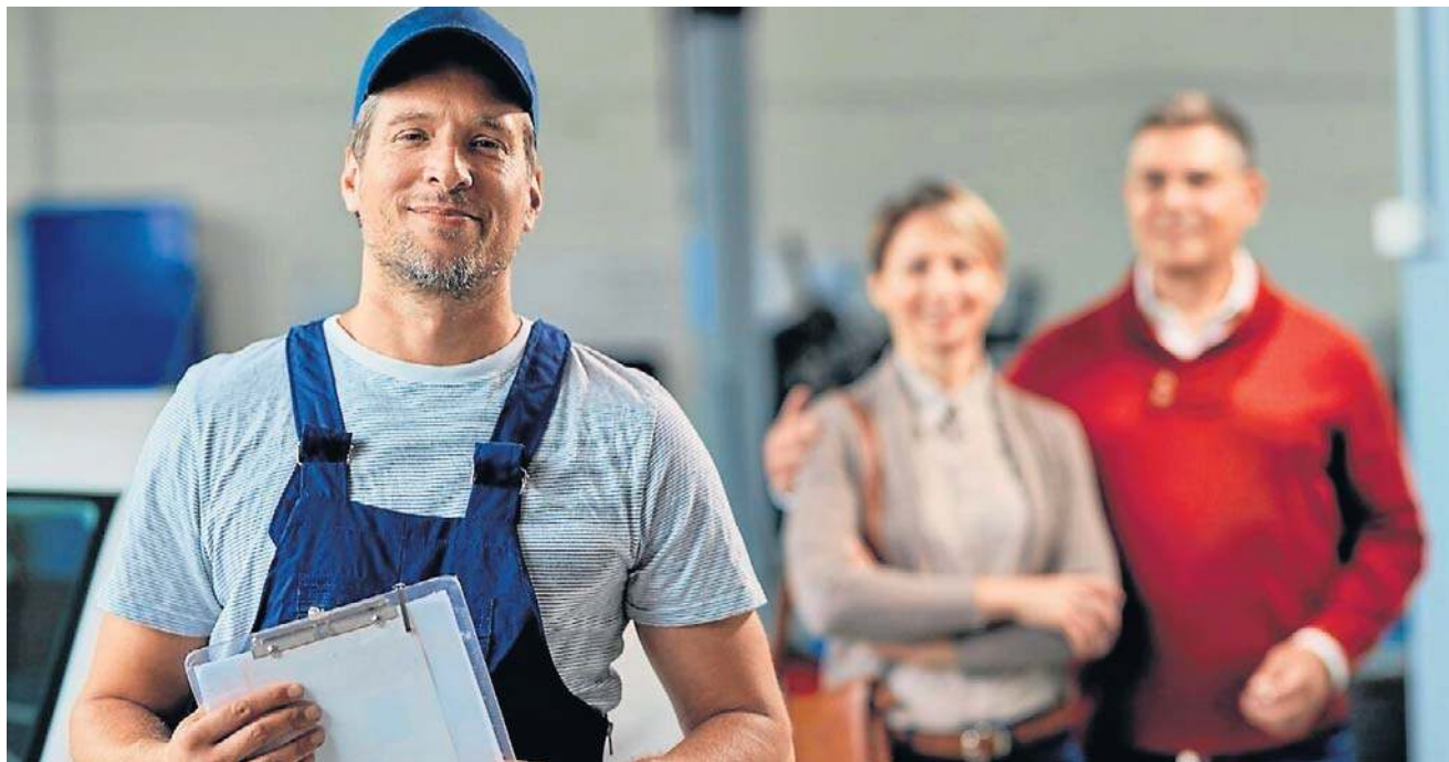
Potwierdzaniem okresów naszej aktywności zawodowej zajmuje się ZUS

okresy podlegania ubezpieczeniom emerytalnemu i rentowym z tytułu: wykonywania umowy zlecenia lub innej umowy o świadczenie usług, do której stosuje się