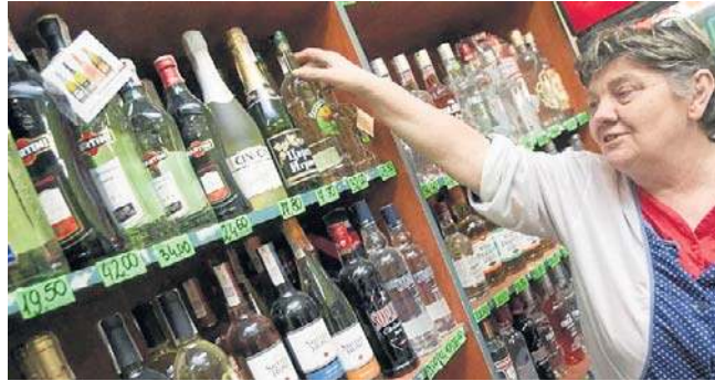
„Schowanie” alkoholu w sklepach może nie wpłynąć na spadek sprzedaży impulsywnej tych produktów

Do kupowania w sposób impulsywny i nieplanowany skłaniają przede wszystkim akcje promocyjne i możliwość nabycia większej liczby produktów za niższą cenę. „Zakupy pod wpływem okazji wielopakowych mają największe znaczenie dla konsumentów w wieku