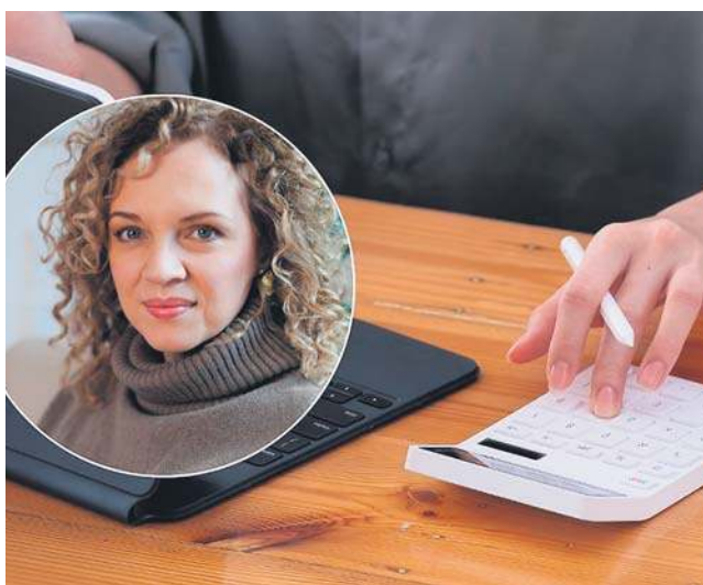
Kobiety w Polsce stanowią zaledwie 8-9 procent aktywnie inwestujących

Uważam, że AI jest świetnym narzędziem w rękach ludzi, którzy wiedzą, co z nim robią. Jeśli tej świadomości nie ma, AI nie zastąpi rzetelnej wiedzy. W finansach powtarzam, że to jest ważne, żeby wiedzieć, do czego używamy narzędzia. Można z wykorzystaniem AI przeanalizować dużą liczbę danych i wyciągnąć wnioski, ale trzeba wiedzieć, co robimy i po co. Zadanie pytania w stylu „Oto moje cele, ułóż mi strategię” to już problem. Nie ma uniwersalnego schematu dla każdego człowieka. Jeśli natomiast mamy już przemyślaną strategię i chcemy coś uprościć, wtedy narzędzie może pomóc. Może zrobić raport, przeszedź