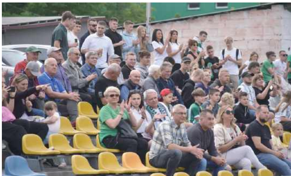
Takich tłumów na stadionie w Rykach nie było dawno. Wszyscy liczą, iż sezon zakończy się pięknie