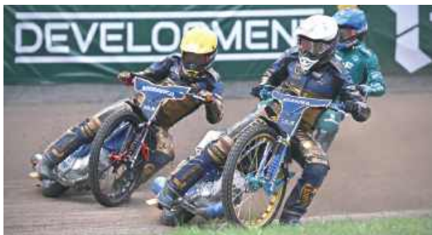
Orlen Oil Motor Lublin nadal wygrał już sześć meczów!