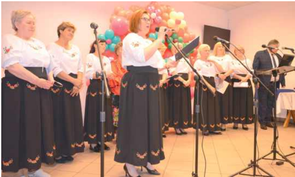
Członkowie KGW „Kalina” zaprezentowały najpiękniejsze piosenki dedykowane Mamom, wprowadzając obecnych w ciepłą i wzruszającą atmosferę