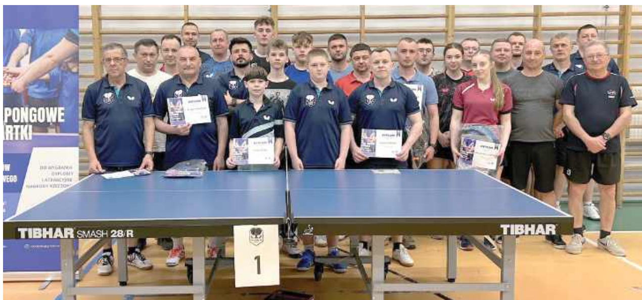
Już w najbliższą sobotę zapowiada się ciekawa rywalizacja. Weźmiesz udział?

Już 7 czerwca odbędzie się Turniej Tenisa Stołowego o puchar burmistrza Dębli. Organizatorzy zapraszają wszystkich fanów piłeczki celuloidowej do walki przy