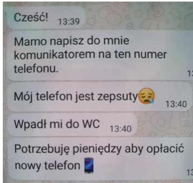
Oszust podający się za córkę poinformował, że potrzebuje opłacić rachunek za nowy telefon i zaznaczył, żeby to był przelew natychmiastowy w kwocie blisko 3000 złotych. Kobieta, chcąc pomóc dziecku, zrobiła przelew natychmiastowy na wskazane konto