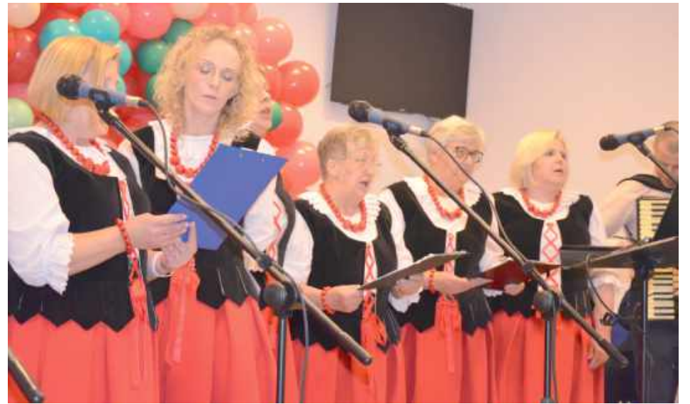
Część artystyczną uświetnił występ KGW z Brzezin

Z okazji Dnia Mamy w remizie Ochotniczej Straży Pożarnej w Pawłowicach odbyło się uroczyste spotkanie, na które przybyły Mamy z okolicznych miejscowości.