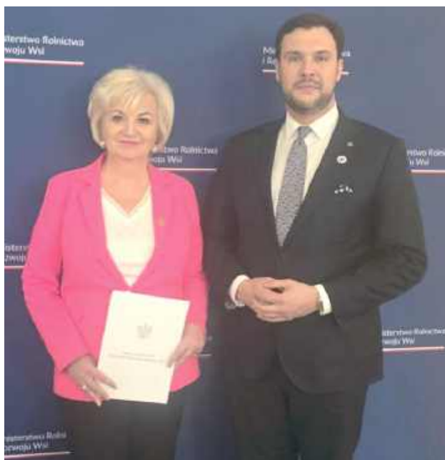
Hanna Czerska na wspólnym zdjęciu z Wiceministrem Rolnictwa i Rozwoju Wsi - Adamem Nowakiem

- Przede wszystkim zamierzam aktywizować Koła Gospodyń Wiejskich. Będę chciała pomagać przy pozyskiwaniu środków na działalność naszych