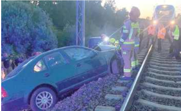
Volkswagenem jechał drogą szutrową i nie dostosował prędkości do warunków ruchu, po czym stracił panowanie nad samochodem