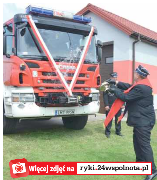
Więcej zdjęć na ryki.24wspolnota.pl