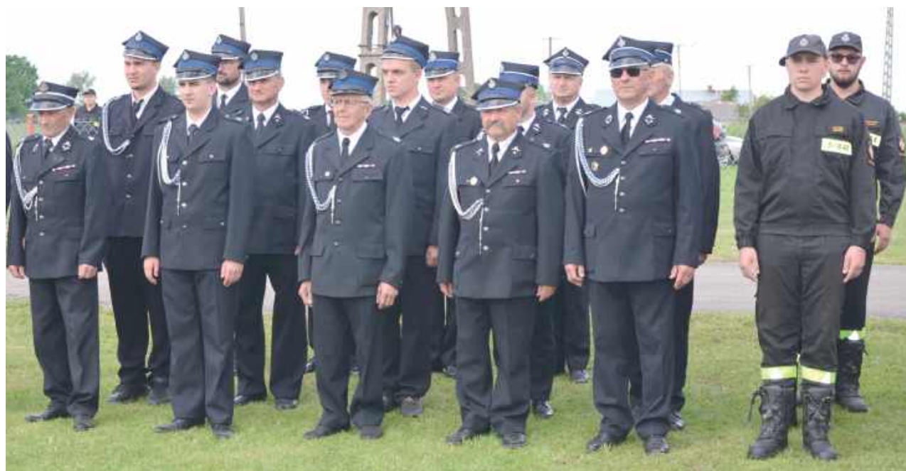
Dla druhów z OSP w Trzciankach było to ważne wydarzenie. Nowy wóz strażacki zwiększy bezpieczeństwo nie tylko w tej jednej miejscowości, ale w całej gminie