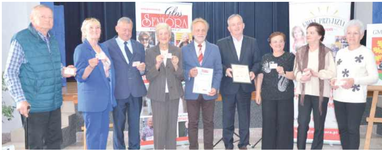
Pierwsi seniorzy odebrali swoje Karty Seniora podczas inauguracji programu Gmina Przyjazna Seniorom w Stężycy. Aby otrzymać kartę należy wypełnić formularz dostępny w GOPS w Stężycy