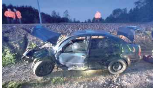
Mieszkaniec powiatu ryckiego został ukarany mandatem karnym w wysokości 5000 zł i 8 punktów karnych za spowodowanie zagrożenia bezpieczeństwa

POWIAT RYCKI: Niebezpieczny widok w Nadwiślanie. 21-latek swoim Volkswagenem wjechał w nasyp kolejowy i zawisł na torach, co mogło doprowadzić do tragedii. Pociągi zostały wstrzymane, a służby działały sprawnie, by usunąć zagrożenie.