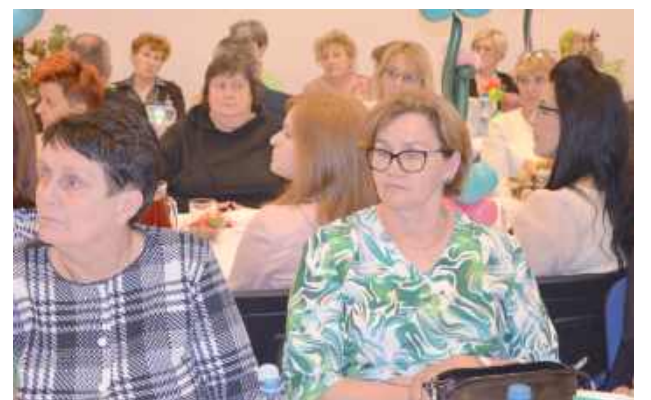
Po części artystycznej przyszedł czas na poczęstunek oraz chwile wspólnych rozmów i integracji