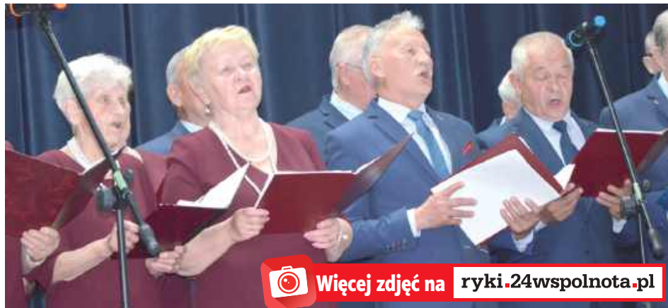
Występ Chóru Seniora „Zorza” uświetnił wydarzenie