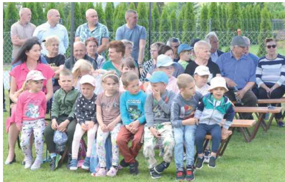
Obejrzeć samochód strażacki przyszło wiele dzieci. Największą radość sprawiło im wejście do środka wozu strażackiego