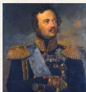
Iwan Paskiewicz z przydomkiem Erywański (1782 - 1856) był jednym z najlepszych rosyjskich dowódców, który wstawił się w wojnie z Turcją (1806-12), w wojnach napoleońskich, na Kaukazie i z Turkami. Dowodził armią rosyjską tłumiając powstanie listopadowe. Wykazał się wtedy także okrucieństwem. Jako namiestnik cesarski z wielką zajadłością tłumiał wszelkie przejawy polskiego życia narodowego, w związku z czym okres jego rządów przeszedł do historii jako „noc paskiewiczowska”

Dobra dęblińska jako część majątku odebranego Czartoryskim podarowane zostały za zasługi m.in. przy tłumieniu powstania listopadowego Iwanowi Paskiewiczowi i jego rodzinie.