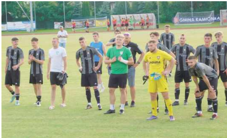
Zespół Ruchu podniósł się po porażce z Turowi Milejów i zgarnął trzy punkty w starciu z LKS-em Kamionka

- Z przebiegu meczu byliśmy zdecydowanie lepsi. Przeciwnik niespecjalnie próbował grać w piłkę. Byliśmy ciągle blisko i wysoko, dlatego Tur ograniczał się praktycznie ciągle do długich piłek. Mielśmy parę sytuacji, może nie stuprocentowych, ale myślę, że można było zdobyć chociaż jedną bramkę. Przeciwnicy nie mieli w sumie okazji do bramki, aż do końcówki pierwszej połowy, gdzie po naszym stałym fragmencie wyprowadzili kontrę. Z bocznego sektora po