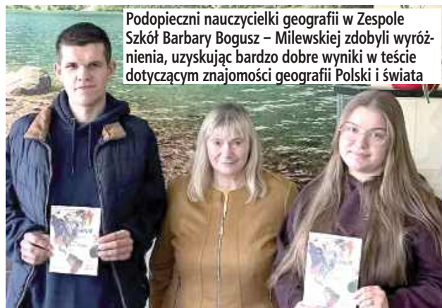
Podopieczni nauczycielki geografii w Zespole Szkół Barbary Bogusz – Milewskiej zdobyli wyróżnienia, uzyskując bardzo dobre wyniki w teście dotyczącym znajomości geografii Polski i świata