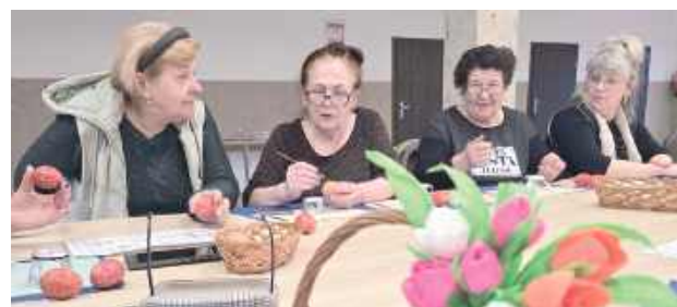
Panie poznały metodę batikową zdobienia pisanek

wosku i barwników tworzyć wzory na jajkach, dzięki czemu powstało wiele kolorowych pisanek.