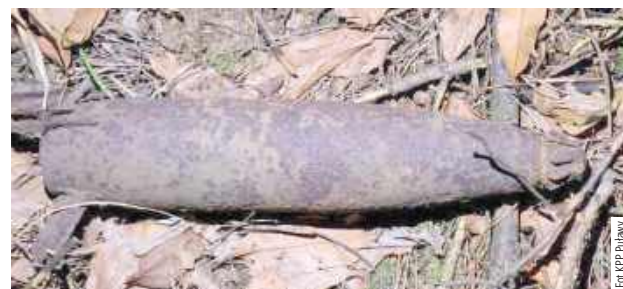
Do czasu przyjazdu patrolu saperowskiego, który w bezpieczny sposób podjął znalezisko, miejsce, w którym znajdował się niewybuch było zabezpieczone przez policjantów z KPP w Puławach

Wezwali policję, która do momentu przybycia saperów zabezpieczała teren. W lesie w Bonowie w gminie Puławy spacerujący turyści natknęli się na bombę lotniczą z czasów II wojny światowej.