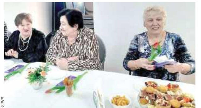
Na stołach królowały przepyszne wypieki

wyjść z domu i spotkać się w sąsiedzkim gronie. Dzięki temu świetlica jest miejscem spotkań lokalnej społeczności i coraz więcej osób dołącza do wspólnej integracji - mówią organizatorzy.