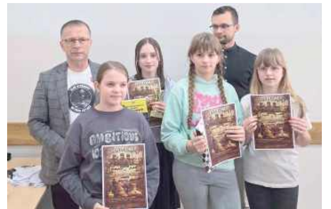
Dziewczyny także świetnie grają w szachy!

Turnieju nie byłoby bez szachistów. Przybyli z takich miejscowości jak: Międzyrzec Pod-