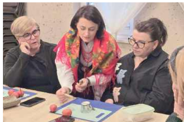
Zajęcia przeprowadzono pod okiem instruktorów z Muzeum Ziemi Łukowskiej im. Longina Kowalczyka

Podczas spotkania uczestnicy poznali tradycyjną metodę wykonywania pisanek techniką batikową. Uczyli się, jak przy pomocy