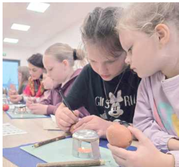
Fot. LGW „Sami Swoi” w Anoninie