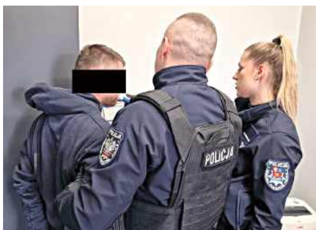
Mundurowi próbowali wyjaśnić zaistniałą sytuację. Mężczyzna oznajmił, że nie zgadza się z zaleceniami lekarza, co dało powód do wzburzenia i agresji

- Jak się okazało, 27-letni mieszkaniec gminy Wisznice wspólnie z ojcem stawiał się na konsultację lekarską. W trakcie rozmowy z lekarzem stał się pobudzony i agresywny oraz zaczął demolować pomieszczenie, w którym przebywał. Jakby tego było mało, mężczyzna wybiegł na plac zewnętrzny i zaczął niszczyć zaparkowane w pobliżu auto, dokonując wgnieceń i uszkodzeń karoserii i elementów pojazdu. Jednak po namowie personelu ponownie powrócił do gabinetu, gdzie był wulgarny i groził osobom przebywającym z nim w pomieszczeniu - informuje młodszy