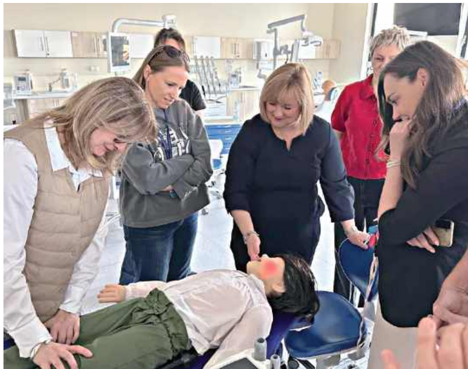
Robot pozwala na trening procedur ratujących życie, takich jak reakcje na podanie znieczulenia, symulacja wstrząsu anafilaktycznego lub przedawkowania środków znieczulających

Robot PediaROID to pierwsze tego typu urządzenie w Europie i trzecie na świecie. Uniwersytet Medyczny w Lublinie przekonuje, że posiadanie tego systemu i innych rozwiązań w symulacji stomatologicznej, stawia kształcenie przedkliniczne na kierunku lekarsko-dentystycznym uczelni w czołówce ośrodków dydaktycznych na świecie.