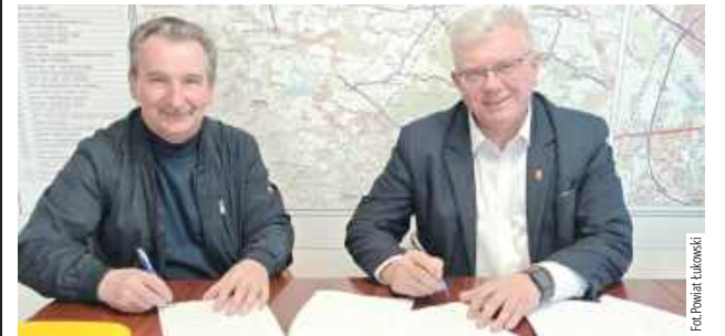
Wykonawca zobowiązał się zrealizować roboty budowlane w terminie 25 czerwca br.

Powiat łukowski podpisał umowę na przebudowę drogi powiatowej na odcinku Lipniak - Zastawie. Inwestycję zrealizuje firma z Biard.