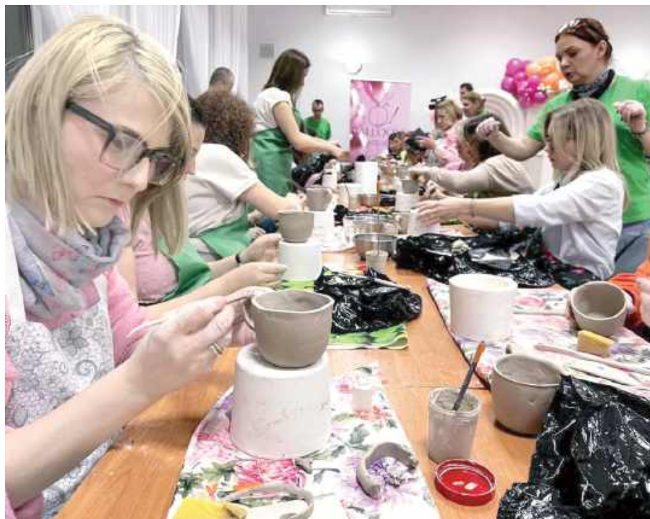
Część artystyczną poprowadziła Fundacja Leny Grochowskiej, zapewniając uczestniczkom najwyższy poziom nauki pracy z gliną

Organizatorki zadbały o to, by każda z uczestniczek poczuła się wyjątkowo - na pożegnanie każda z pań otrzymała piękny, wiosenny kwiatek od lokalnej kwiaciarni Opolsky.