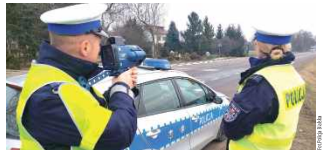
Policja apeluje o rozwagę i przestrzeganie ograniczeń prędkości, przypominając, że nadmierna prędkość nadal należy do głównych przyczyn wypadków drogowych

Od 3 marca obowiązują nowe przepisy, które pozwalają policjantom zatrzymywać prawo jazdy na trzy miesiące za przekroczenie dopuszczalnej prędkości o ponad 50 km/h nie tylko w obszarze zabudowanym, lecz także poza nim, na drogach jednojezdniowych dwukierunkowych. W ciągu ostatnich dwóch tygodni funkcjonariusze białskiej drogowki zatrzymali uprawnienia dziewięciu kierowcom, z czego trzech straciło je już na podstawie nowych regulacji.