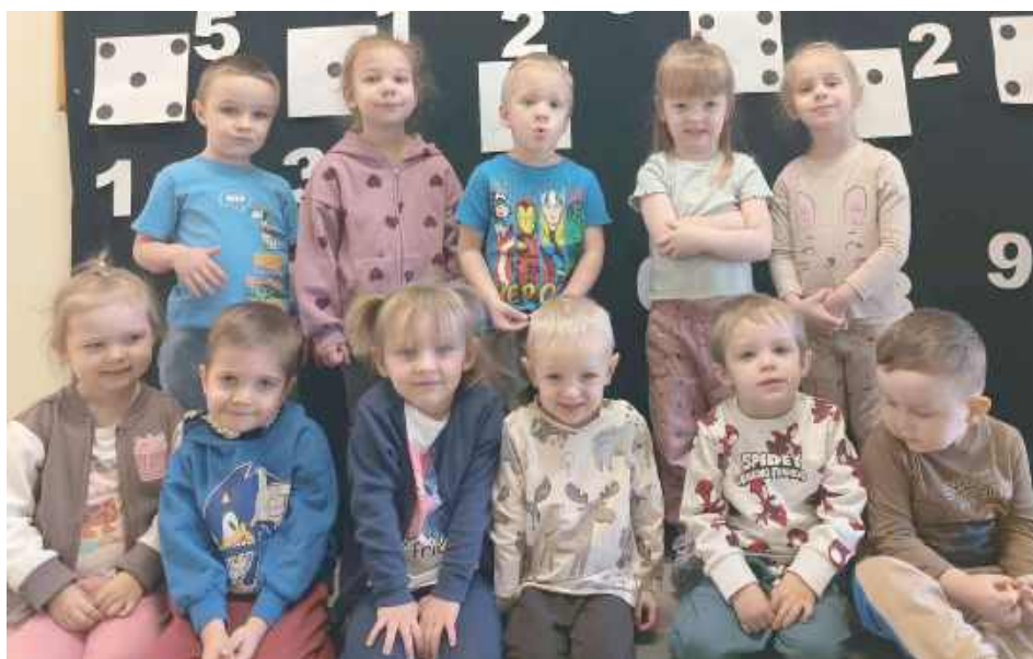
3-latki z przedszkola w Krzówce. W lutym dzieci poznawały „Kształty w naszym świecie”, uczyły się rozpoznawać figury geometryczne w najbliższym otoczeniu

Każdy miesiąc poświęcony jest innej tematyce. W lutym dzieci poznawały „Kształty w naszym świecie”, uczyły się rozpoznawać figury geometryczne w najbliższym otoczeniu. Marcowe zajęcia są pod hasłem