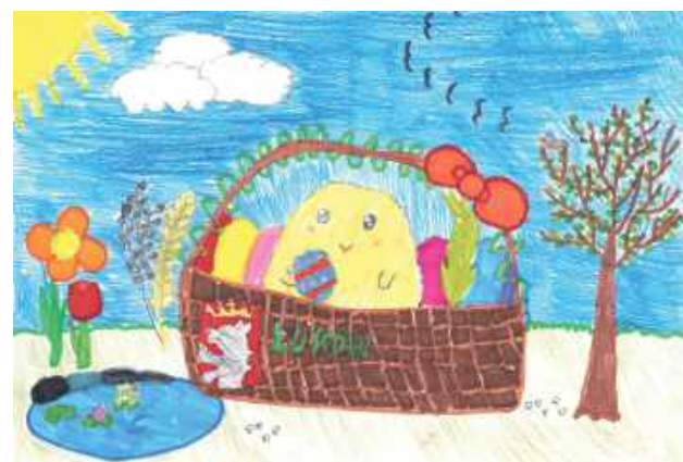
Do konkursu, który był skierowany do uczniów klas I-III łukowskich szkół podstawowych, wpłynęło ponad 80 prac

Prace oceniała komisja złożona z pracowników referatu promocji UM, biorąc pod uwagę zgodność