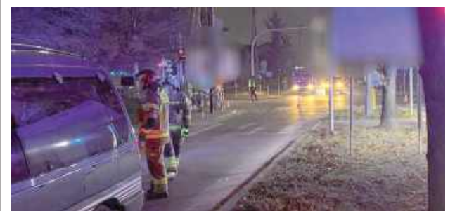
Do tragicznego wypadku doszło 18 grudnia około godz. 15 na skrzyżowaniu Al. Tysiąclecia i ul. Szaniawskiego

Do tragicznego wypadku doszło 18 grudnia około godz. 15 na skrzyżowaniu Al. Tysiąclecia i ul. Szaniawskiego.