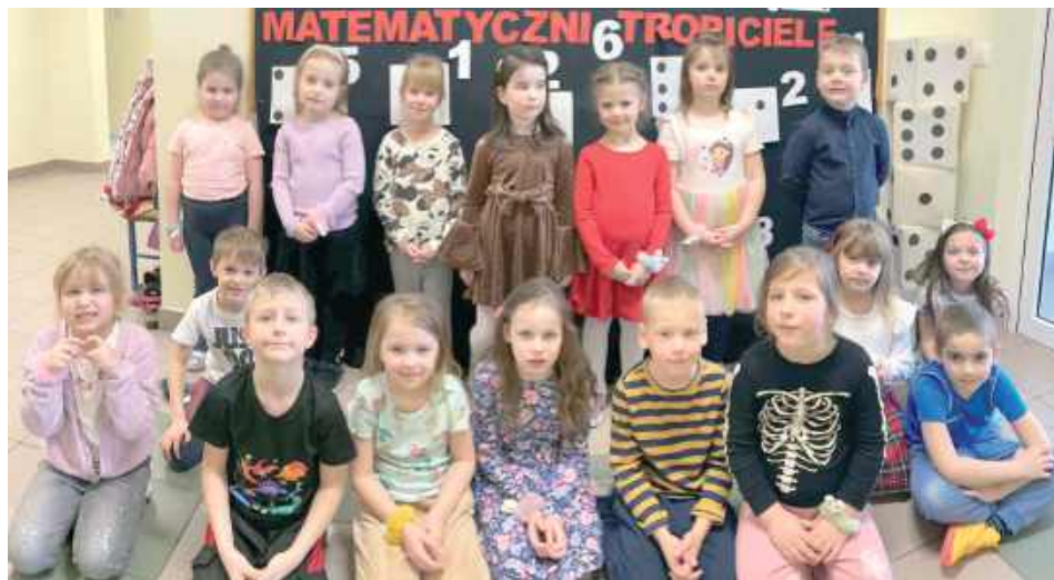
5- i 6-latki z przedszkola w Krzówce. Maj upłynie pod znakiem „Matematycznych podróży – gier planszowych”