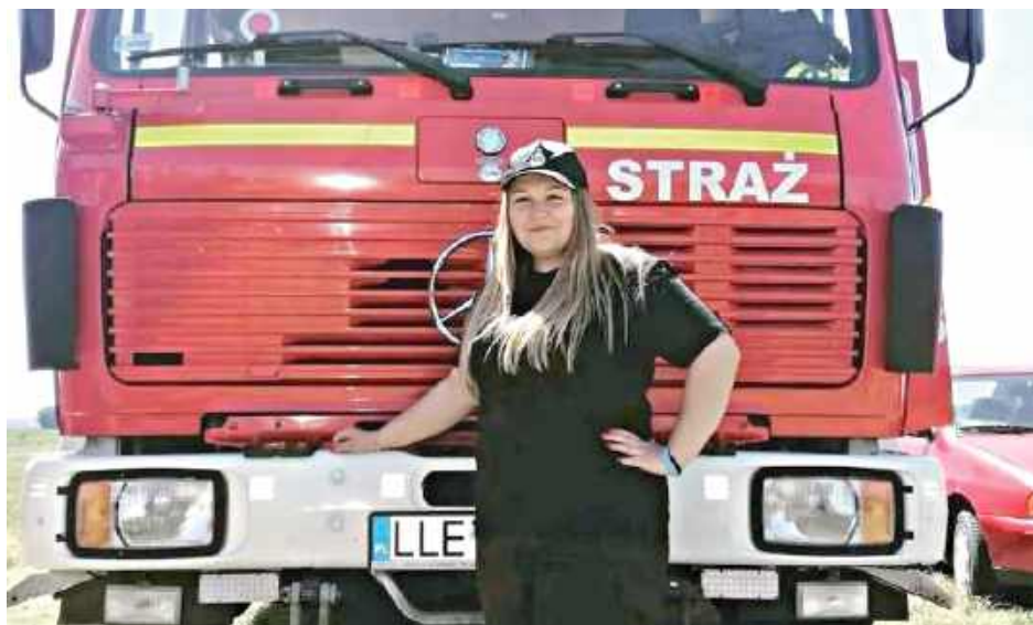
Druhna podkreśliła też znaczenie przygotowania i współpracy strażaków: „Strażakiem się jest, a nie bywa. Szkolimy się, również między jednostkami, i wiemy później, że możemy na siebie liczyć i działać tak naprawdę bez słów

Jedną z pierwszych osób, która zupełnie przypadkowo znalazła się na miejscu była druhna