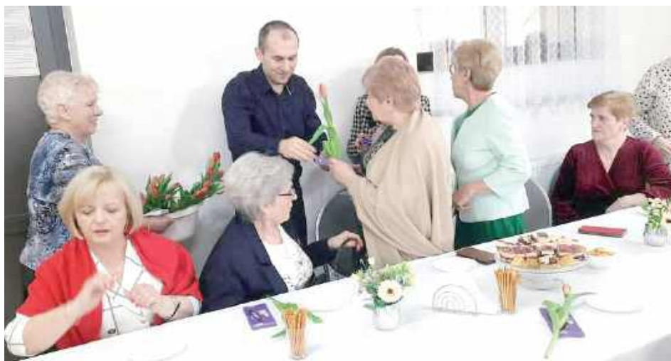
To był wieczór pełen uśmiechów

W trakcie spotkania zorganizowano wspólną zabawę w ka-