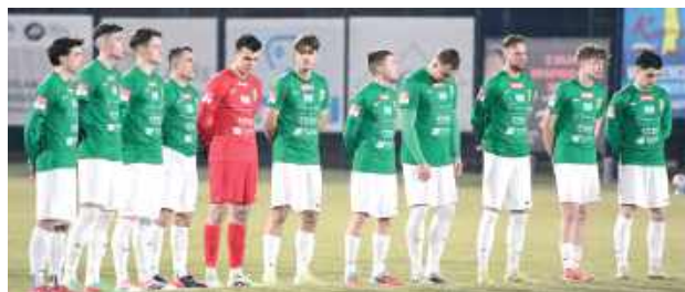
To kolejny mecz, w którym Podlasie wygrywało różnicą dwóch goli i nie potrafiło utrzymać przewagi

Podopieczni Oleksiuka nie zwolnili tempa. Kilka minut później Mróz znów znalazł się w świetnej sytuacji, ale tym razem jego strzał zablokował Michał Smoleń. Gospodarze odpowiedzieli dopiero kilka minut później. Groźna akcja Damiana Bawora i Szymona Szłęka zakończyła się mini-