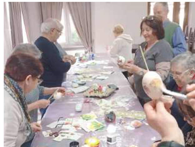
Uczestnicy zajęć poznawali technikę zdobienia decoupage