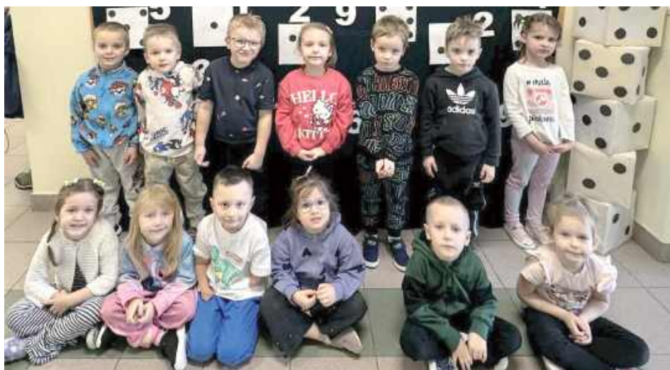
4-latki z przedszkola w Krzówce. Marcowe zajęcia są pod hasłem „Pojęcia matematyczne w życiu codziennym”