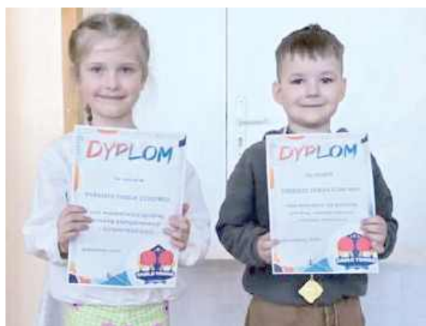
mo Najmłodszy uczestnicy otrzymali pamiątkowe dyplomy