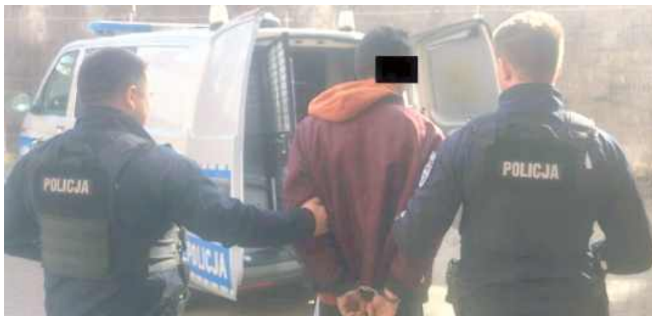
42-latek nie był w stanie wyjaśnić pochodzenia kawy i kapsułek do prania, które miał ze sobą w momencie zatrzymania

Wszystko działo się w ubiegłym tygodniu na terenie Puław. Policjanci z patrolówki zauważyli mężczyznę niosącego kilka paczek kawy i kapsułki do prania, który na ich widok nagle odwrócił wzrok i zaczął iść w przeciwnym kierunku. Funkcjonariusze postanowili go wylegitymować. I mieli przeczucie. Wkrótce okazało się, że zatrzymany przez nich mężczyzna to mieszkaniec gminy Janowiec.