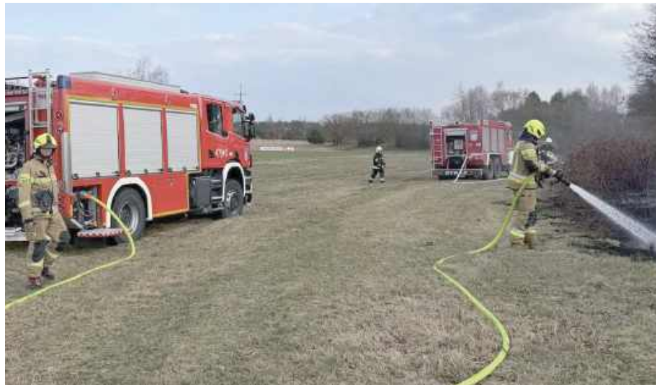
W akcji brały udział: OSP KSRG Krzywda oraz OSP Drożdżak