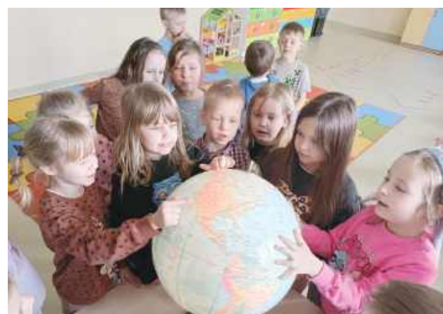
Podczas zajęć grupa 5-6-latków poznawała kierunki świata – dzieci dowiedziały się, że są cztery, a więc i tu kryje się matematyka