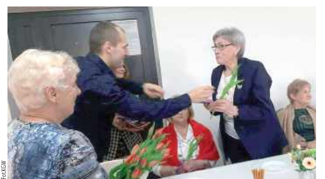
Tego wieczoru nie zabrakło wiosennych tulipanów dla każdej z pań