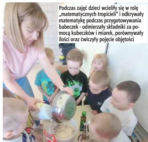
Podczas zajęć dzieci wcieliły się w rolę „matematycznych tropiciele” i odkrywały matematykę podczas przygotowywania babeczek - odmierzali składniki za pomocą kubeczków i miarek, porównywały ilości oraz ćwiczyły pojęcie objętości

Szczególnym zainteresowaniem cieszą się zajęcia kulinarne, podczas których przedszkolaki uczą się przygotowywać proste potrawy. To doskonała okazja do praktycznego poznania pojęć takich jak proporcje, objętość czy waga. Dzieci przekonują się, że matematyka pomaga w codziennych czynnościach – nawet w kuchni.