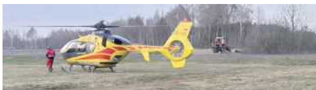
Do zdarzenia doszło na terenie prywatnej działki rolnej. Policjanci ustalili, że 45-latek z gminy Stanin został przygnoił konarem wycinanego przez niego drzewa

- 19 marca po godzinie 16 otrzymaliśmy informację o wypadku podczas wycinki drzewa w Zagoździu. Do zdarzenia doszło na terenie prywatnej działki