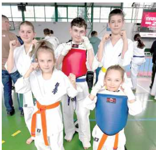
Zawodnicy Łukowskiego Klubu Karate Kyokushin zaprezentowali bardzo wysoką formę, wracając do domu z medalami oraz cennym doświadczeniem