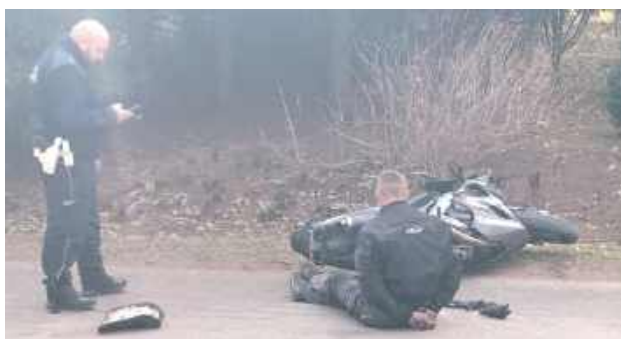
Za niezatrzymanie się do kontroli drogowej grozi kara do 5 lat pozbawienia wolności

Lublin: Kierujący motocyklem został zatrzymany przez policjantów drogówki po pościgu.