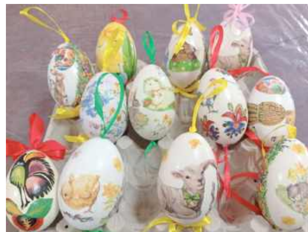
Prace seniorów cieszą oczy pięknym wykonaniem i kolorami