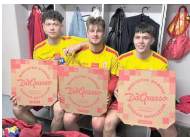
Wielka radość w Łukowie. Pierwsze zwycięstwo Orłąt w tym roku, a piąte w sezonie