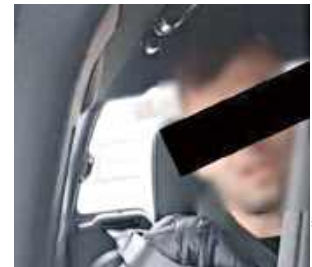
Po zatrzymaniu mężczyzna został przewieziony do zakładu karnego w celu odbycia zasądzonej kary

Poszukiwany był ścigany zarządzeniem sądu za przestępstwo, którego dopuścił się wspólnie z innym sprawcą w czerwcu 2024 roku. Napastnicy, grożąc pozbawieniem życia pokrzyw-