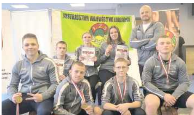
Pamiątkowe zdjęcie ekipy Olimpijczyka Łuków

W Biłgoraju odbyły się Mistrzostwa Województwa Lubelskiego Juniorów i Juniorów w podnoszeniu ciężarów.