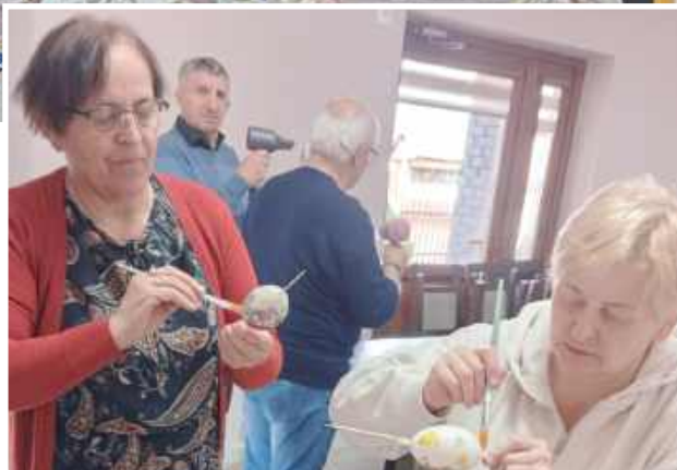
mo Powstały przepiękne barwne pisanki

go spędzenia czasu w miłej, przedświątecznej atmosferze. Efekty pracy uczestników można zobaczyć na pamiątkowych zdjęciach.