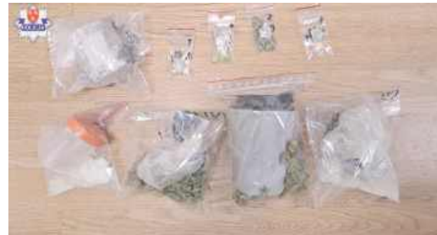
Po przesłuchaniu 34-latek został objęty policyjnym dozorem

Łukowscy kryminalni przechwycili narkotyki należące do 34-latka. Z przejętych substancji można było przygotować kilkaset porcji dilerkich.