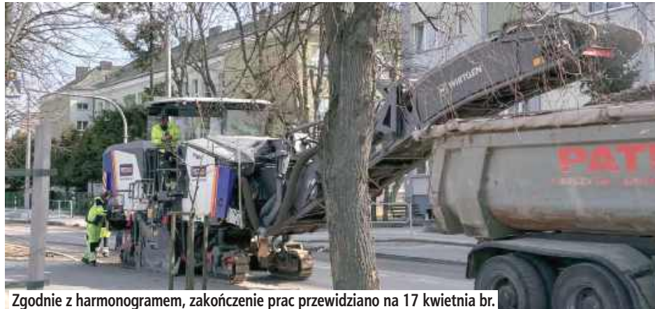
Zgodnie z harmonogramem, zakończenie prac przewidziano na 17 kwietnia br.

Po zimowej przerwie spowodowanej niekorzystnymi warunkami atmosferycznymi, która uniemożliwiła prowadzenie robót w styczniu i lutym, wykonawca przystąpił 2 marca do prac na ul. Partyzantów. Rozpoczęto tam rozbiórkę starych krawężników i montaż nowych elementów ulicznych na odcinku od skrzyżowania z ul. Spokojną w kierunku ul. Ks. Kard. St. Wyszyńskiego. Obecnie realizacja robót osiągnęła około 35 proc.