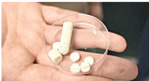
Implant polimerowo-ceramiczny ma być wszczepiany już po złamaniu i wypełniać będzie ubytek w tkance

LUBLIN: Naukowcy z Politechniki Lubelskiej i Uniwersytetu Medycznego w Lublinie stworzyli implant kości, który ma pomagać chorym na osteoporozę. Rozwiązanie powoli uwalnia lek, ale robi to tylko wtedy, gdy jest to niezbędne.