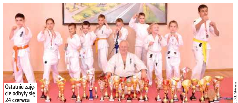
Ostatnie zajęcia odbyły się 24 czerwca