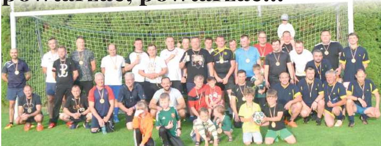
Turnieje dla Taty Cup i dla juniorów 35+ współorganizowały Orleńskie. Dzieci grają, tatusiowie grają, wujkowie grają, pesel to tylko liczby...