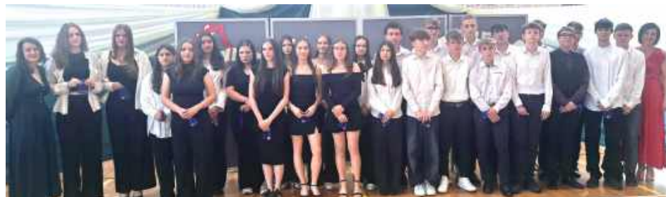
Szkoła Podstawowa nr 1