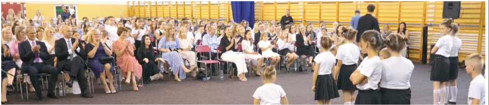
Gałą uświetniły występy artystyczne dzieci, gromko oklaskiwane przez dumnych rodziców i nauczycieli

- Dzisiejsza gala jest wyjątkową okazją, aby wspólnie świętować sukcesy młodych ludzi, którzy dzięki swojej pasji, wytrwałości i ciężkiej pracy osiągnęli znakomite wyniki – w nauce, sporcie i działalności artystycznej. To ogromna radość móc się z Wami spotkać i uhonorować tych, którzy w szczególny sposób zasłużyli na wyróżnienie. Gmina Borki może poszczycić się niezwykle uzdolnioną młodzieżą. Wśród Was są laurea-