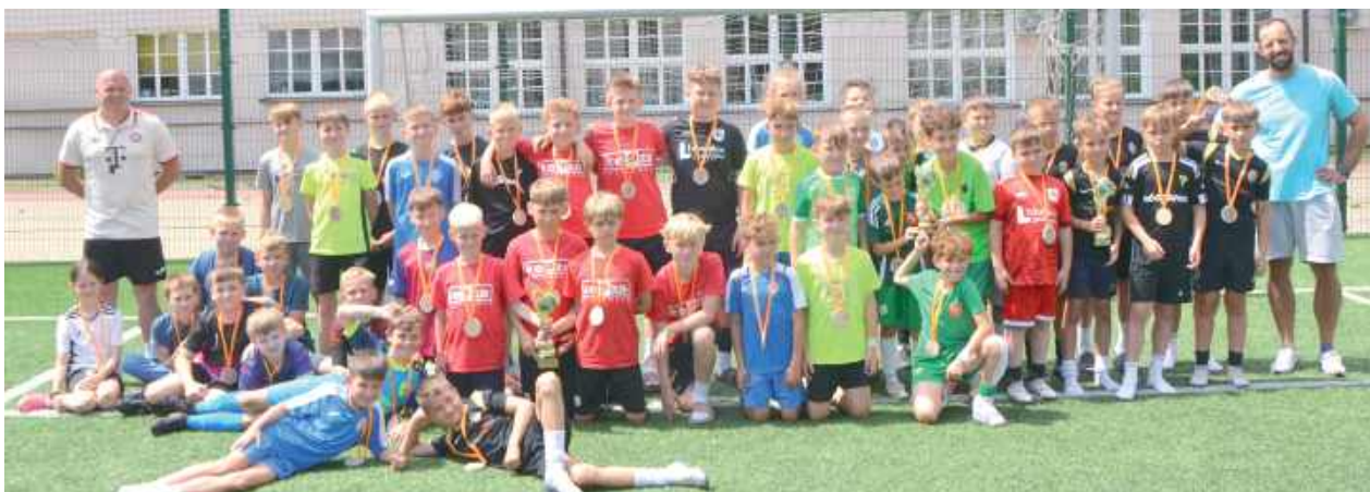
Turniej dzikich drużyn dla dziesięciolatków okazał się być kopalnią talentów dla Młodzieżówki i Orleńskich. W takich imprezach zaczynają się wielkie przygody