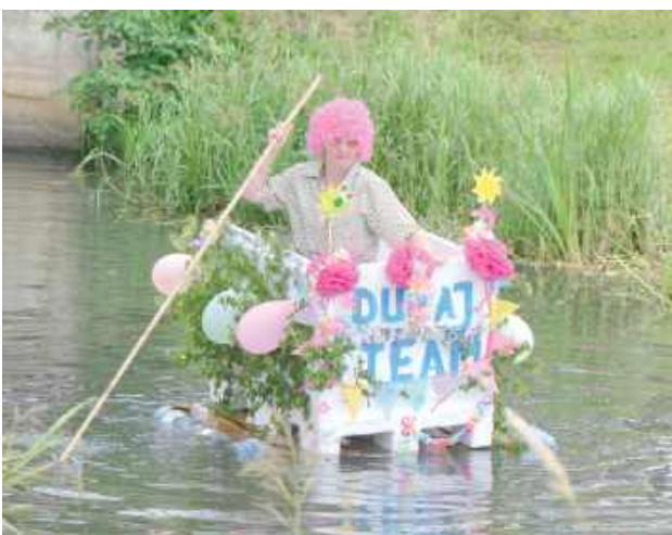
Białkę trzeba było spiętrzyć, żeby zorganizować Sply na Byle Czym. Mimo że ruszyły tylko trzy osady, emocji, fantazji i śmiechu starczyło by dla floty Nelsona