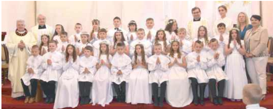
Pierwszą Komunię Świętą w Kąkolewnicy przyjęło 29 dzieci

Uroczystość rozpoczęła się na placu przed kościołem św. Filipa Neri. To właśnie tam rodzice udzielili swoim dzieciom błogo-