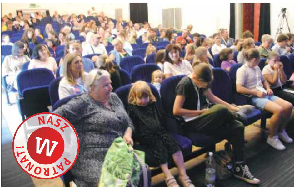
Zainteresowani wypełniali salę Oranżerii

Radzyń Podlaski: Zakończył się trwający przez trzy dni, od 20 do 22 czerwca Festiwal Teatrów Dzieci i Młodzieży Mania.