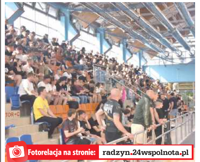
Fotorelacja na stronie: radzyn.24wspolnota.pl