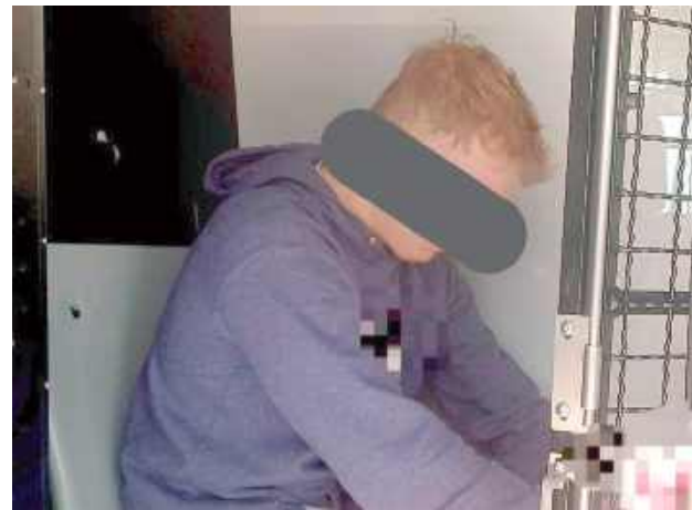
Mężczyzna trafił do więzienia

Parczewscy policjanci pojechali do jednej z miejscowości w gm. Parczew, ponieważ mieli informację, że na terenie jednej z posesji może znajdować się mężczyzna, za którym wydano list gończy. 22-latek poszukiwany był za czynną napaść na