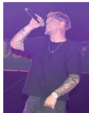
Gwiazdą wieczoru był raper Kubańczyk

W dniach 28-29 czerwca odbywał się Jarmark Wołyński – coroczne wydarzenie z występami gwiazd oraz strefą handlowo-gastronomiczną.