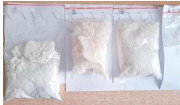
Zgodnie z obowiązującymi przepisami grozi jej kara do 10 lat pozbawienia wolności

Biała Podlaska: Dwa miesiące spędzi w areszcie 20-latka, która wpadła podczas kontroli drogowej. Policjanci znaleźli przy niej środki psychotropowe, które wystarczyłyby do sporządzenia niemal 2400 porcji dealerskich.