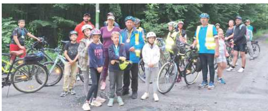
Nic się nie zakreśli bez Radzyńskiej Grupy Rowerowej. W weekend miłośnicy turystyki rowerowej mieli dwa preteksty do wyruszenia na szlak. Siękręci zabrali wszystkich do uroczej Feliksówki, w niedzielę lider wołyńskich Roweraków oprowadzał ciekawskich i ruchliwych po obecnym i dawnym Radzynie

Zaczął się od gali sportów walki, potem były nocna siatkówka, piłka nożna dla dzieciaków i starszawych dzieciaków, wygibasy, rowerowa włóczęga, radosne taplanie się w spiętrzonej specjalnie na tą okazję Białce i kilka innych atrakcji. Radzyń pokazał, że sportem stoi i jeszcze ma ochotę na więcej