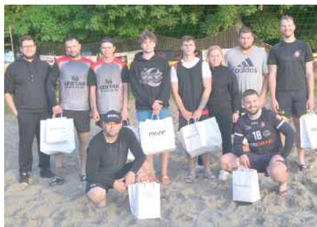
Make Radzyń Plażówka Great Again! - W zorganizowanym przy wsparciu Radzyńskiego Klubu Sportowego turnieju siatkówki wzięło udział 16 drużyn w kategorii open i 12 w mikstach. Grało się do 7 rano, deszcze nie wystraszył. Nagrody w turnieju ufundowało wydawnictwo Wspólnota!

Zaczął się od gali sportów walki, potem były nocna siatkówka, piłka nożna dla dzieciaków i starszawych dzieciaków, wygibasy, rowerowa włóczęga, radosne taplanie się w spiętrzonej specjalnie na tą okazję Białce i kilka innych atrakcji. Radzyń pokazał, że sportem stoi i jeszcze ma ochotę na więcej