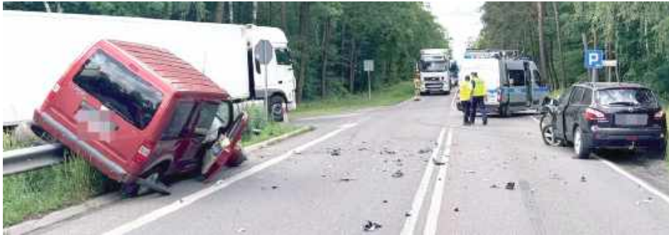
Ten manewr nie był dobrym pomysłem

Do wypadku doszło na drodze krajowej nr 19. Kierujący Nissanem 53-letni mieszkaniec Radzyna, wykonując manewr skrętu w lewo, najprawdopodobniej nieprawidłowo wykonał ten manewr, co doprowadziło do zderzenia z samochodem marki Ford Tourneo, którym kierował