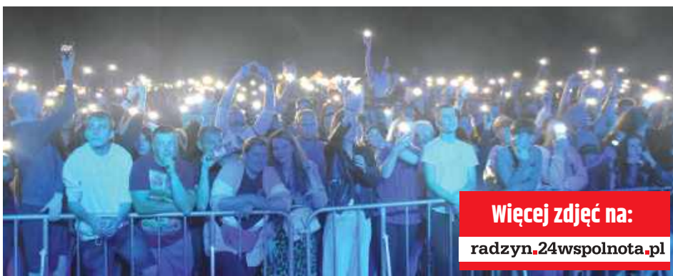
Koncerty przyciągnęły masę publiczności

Największe zainteresowanie przyciągnął ostatni z wykonawców, raper młodego pokolenia, znany także z freestyle'ów (walk