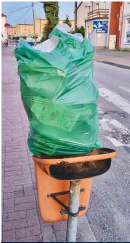
Śmieci podrzucone do publicznego kosza. Przez kogo? Przez kogoś bez wstydu.

Plan na 2025 rok zakłada zbilansowanie kwot gospodarki odpadami na poziomie 5 mln 163 tys zł przy założeniu, że liczba mieszkańców wpisanych do systemu utrzyma się na tym samym poziomie. W tym momencie obejmuje on około 12 tysięcy osób, podczas gdy liczba mieszkańców Radzyna wynosi ponad 14 tysięcy. Oznacza to, że 2 tysiące osób może nie być objętych systemem, a to negatywnie wpływa zarówno na koszty, jak i sprawiedliwość rozliczeń.