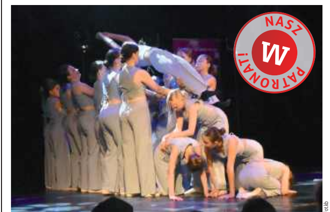
Tancerze reprezentowali wiele grup wiekowych

25 czerwca w sali kinowej odbyła się gala tańca szkoły Dance ma Sens. Zarówno młodsze jak i starsze tancerki (oraz tancerze) pokazali swoje talenty i podsumowali dotychczasowe postępy.