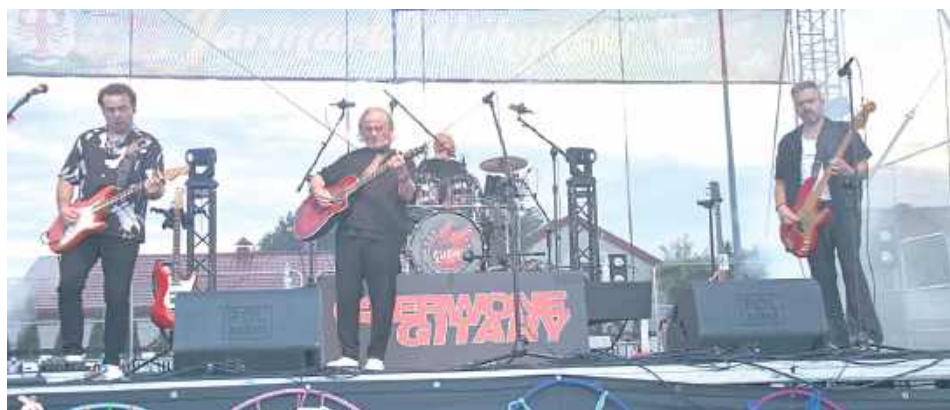
Czerwone Gitary skradły serca publiczności