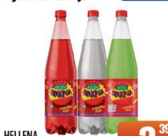
HELLENA ORANŻADA 1,25l wybrane rodzaje