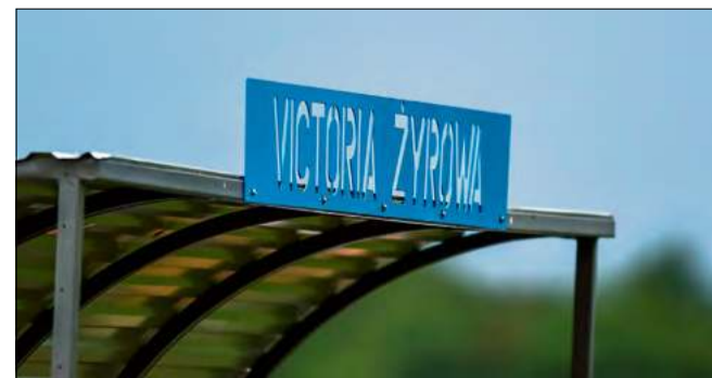
Kibice Victorii Żyrowa liczą na to, że wiosną zobaczą swoich pupili na własnym obiekcie.