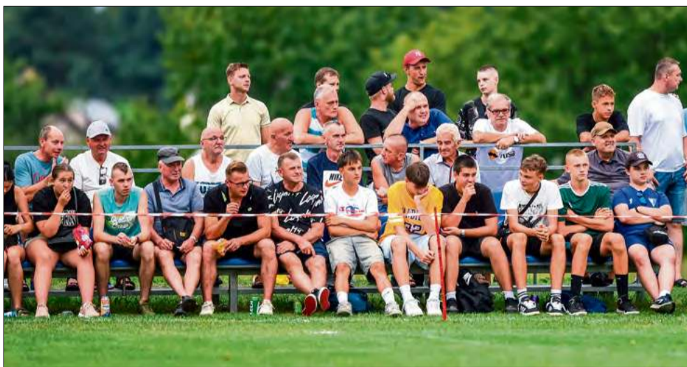
Domowe mecze rundy jesiennej w BS IV lidze beniaminek z Żyrowej będzie rozgrywał na boisku w Zdieszowicach.