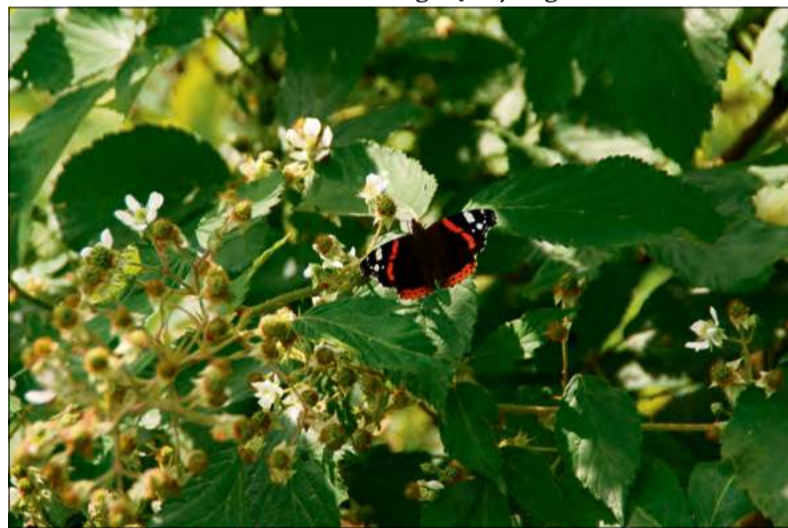
Motyle, podobnie jak pszczoły, potrzebują dostępu do wody i kwitnących roślin.

Choć człowiek od wieków przekształca krajobraz, upraszczając go i dostosowując do własnych potrzeb, nadal pozostaje częścią przyrody. Nawet w najbardziej zurbanizowanych przestrzeniach nie jesteśmy sami. Życie potrafi znaleźć sobie miejsce tam, gdzie pozornie nie ma na nie warunków – między płytami chodnikowymi, przy drogach czy na niewielkich skrawkach zieleni.