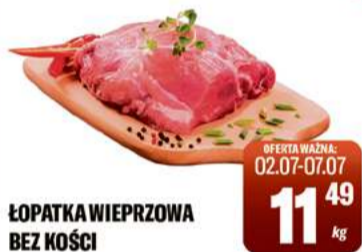
ŁOPATKA WIEPRZOWA BEZ KOŚCI

CENA W OFERCIE OBOWIĄZUJE WE WSZYSTKICH PLACÓWKACH TOMIMARKT