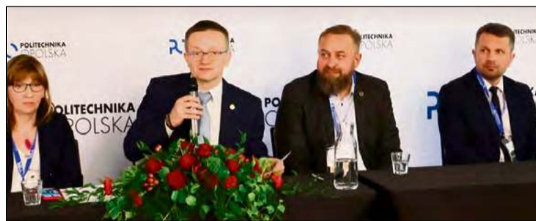
Uczestnicy panelu rozmawiali o perspektywach rozwoju relacji na linii nauka – biznes.

(matt), fot. Heidelberg Materials Polska