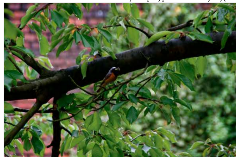
Pleszka zwyczajna to jeden z gatunków ptaków, które można spotkać również w miejskich parkach i ogrodach.

Jednocześnie należy zachować ostrożność w przypadku młodych zwierząt. Samotne młode sarny, ptaki czy zające nie zawsze są porzucone. W wielu przypadkach matka znajduje się w pobliżu i wraca do potomstwa po pewnym czasie. Niepotrzebne zabranie młodego zwierzęcia z naturalnego środowiska może