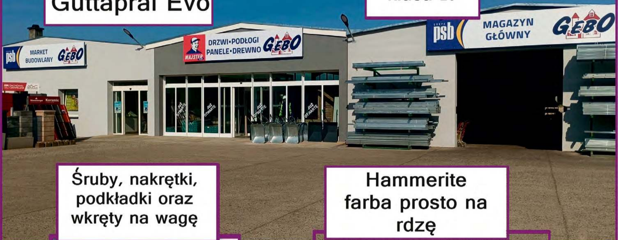
Śruby, nakrętki, podkładki oraz wkręty na wagę