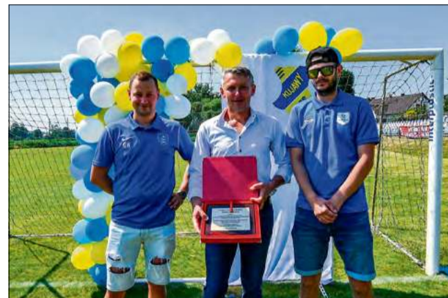
Urodziny klubu „zza miedzy” świętowali też przedstawiciele Kosmosu Dobra.

wsparcie, wręczając na ręce sternika gminy puchar w postaci „złotej piłki”. Burmistrz, gratulując klubowi pięknego jubileuszu oraz sportowych sukcesów osiągniętych przez osiem dekad, przekazał na ręce gospodarzy worek piłek, zapewniając jednocześnie o jeszcze większym zaangażowaniu władz gminy w jak najszybszym zakończeniu