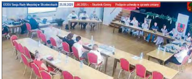
Radni gminy Strzeleccki jednogłośnie przyjęli na sesji uchwałę zmieniającą budżet na bieżący rok, w której zabezpieczono m.in. środki na opracowanie dokumentacji projektowej hali sportowej w Zielinie.

– Chcemy przygotować dobrą, przemyślaną dokumentację, która pozwoli