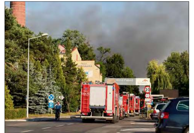
Zadymienie było widoczne z daleka. Na miejsce niezwłocznie przybyły służby ratunkowe.