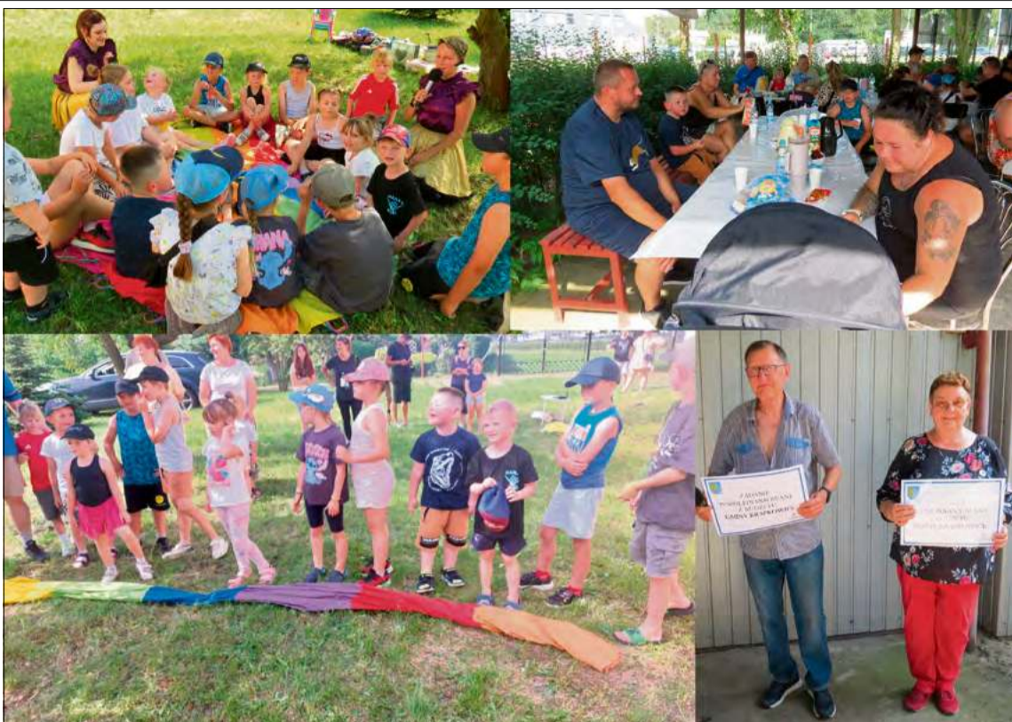
Rodziny dzień pełen zabawy na ROD im. Tadeusza Kościuszki w Krapkowicach przyniósł całym rodzinom wiele frajdy.

Ogromnym zainteresowaniem cieszyły się także bańki mydlane XXL. Dzieci ustawiały się w kolejce po tatusze brokatowe, kolorowe wzory na twarzach i modelowane balony.