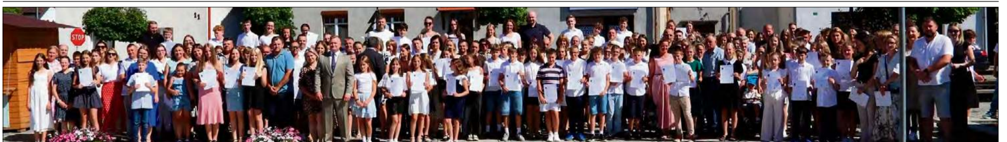
Młodych talentów w gminie Strzeleccki nie brakuje.

W gminie Strzeleccki odbyła się uroczystość, podczas której doceniono młodych mieszkańców za ich wytrwałość, zaangażowanie i imponujące osiągnięcia. To był dzień pełen dumy i uznania dla uczniów, którzy swoją ciężką pracą udowodnili, że warto rozwijać talenty i konsekwentnie dążyć do wyznaczonych celów.