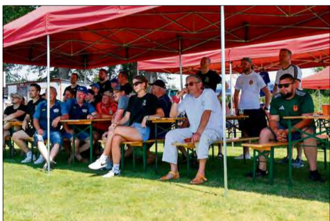
Mimo potwornego upału mieszkańcy Kujaw i goście pojawili się na uroczystym otwarciu obchodów 80-lecia klubu.

sportowy obiekt zamienił się w taneczny parkiet, a muzyczną oprawę, przy znakomitej frekwencji mieszkańców, do białego rana serwował energetyczny RetroBoyz DJs.