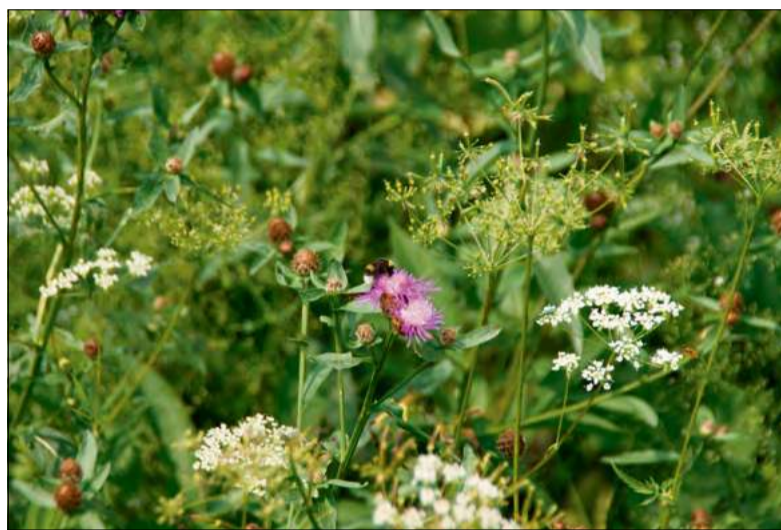
Dzikie zapylacze są szczególnie narażone na skutki suszy i wysokich temperatur.

Skutki przegrzania mogą być bardzo poważne – od osłabienia organizmu i spadku zdolności rozrodczych po niewydolność narządów, a nawet śmierć. Dlatego dostęp do wody, schronienia i zacienionych miejsc ma kluczowe znaczenie dla przetrwania