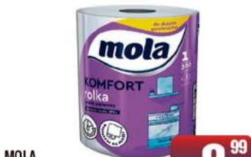
MOLA RĘCZNIK KUCHENNY A'1 komfort