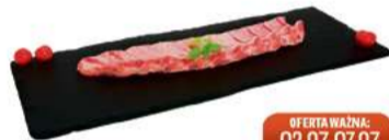
ŻEBERKA WIEPRZOWE PASKI