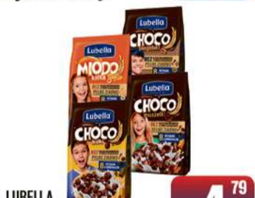
LUBELLA PŁATKI ŚNIADANIOWE 250g wybrane rodzaje