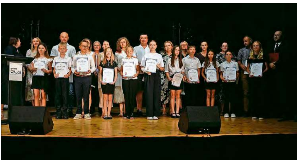
Uroczystość była jednocześnie symbolicznym zakończeniem roku szkolnego oraz okazją do pogratulowania młodym mieszkańcom sukcesów, z których dumna jest cała lokalna społeczność.

To oni są dumą gminy Walce. Najlepsi uczniowie odebrali stypendia wójta za wyniki w nauce i rozwijanie swoich talentów.