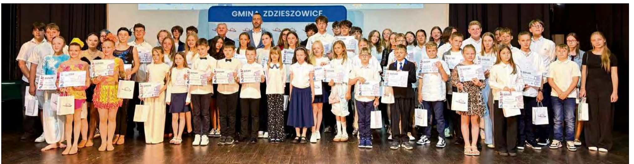
W Zdzieszowicach nagrodzono najlepszych uczniów z gminy Zdzieszowice.

W Zdzieszowicach uhonorowano najlepszych uczniów szkół podstawowych z terenu gminy. Dyplomy i upominki trafiły do wyróżnionych podczas uroczystości. Burmistrz złożył podziękowania rodzicom, wychowawcom, opiekunom i dyrekcji za wkład w edukację młodych mieszkańców.