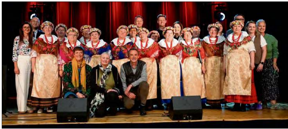
To nie tylko prestiżowe wyróżnienie, ale potwierdzenie, że wspólna praca, zaangażowanie i lokalna tożsamość zostały dostrzeżone i docenione na arenie międzynarodowej.

Szczególne uznanie zdobyły działania prowadzone w Straduni, gdzie mieszkańcy zaangażowali się w ekologiczną rewitalizację terenów