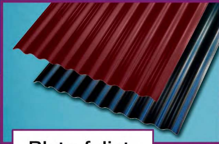
Płyta falista Guttapral Evo