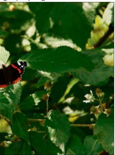
Motyle, podobnie jak pszczoły, potrzebują dostępu do wody i kwitnących roślin.

Wysokie temperatury stanowią dla dzikich zwierząt poważne zagrożenie. Gdy organizm nie jest w stanie skutecznie oddawać nadmiaru ciepła, dochodzi do hipertermii, czyli przegrzania. Zwierzęta próbują się przed nią bronić, między innymi poprzez zwiększony przepływ krwi przez skórę, poszukiwanie cienia oraz ograniczenie aktywności w najgorętszych godzinach dnia.