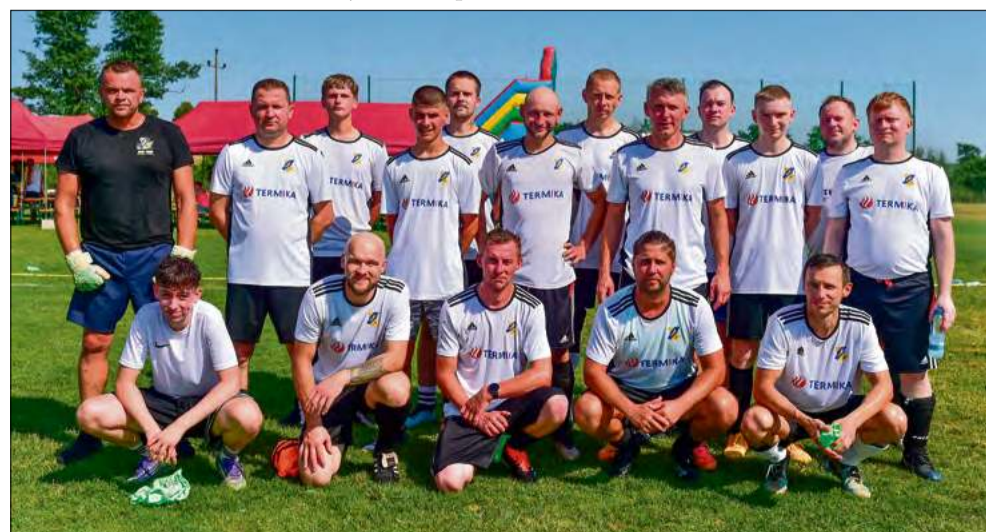
Mecz seniorów był spotkaniem aktualnych i byłych zawodników klubu z Kujaw.