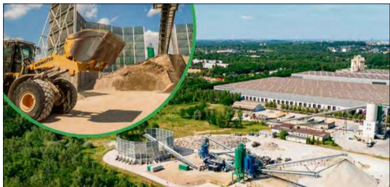
Recycled Cement Paste (RCP), czyli odzyskany zaczyn cementowy, trafia do Cementowni Górażdze.

W zakładzie w Dąbrowie Górniczej Heidelberg Materials Polska przetwarza odpady rozbiórkowe na materiały budowlane. Dzięki technologii ReConcrete z betonowego złomu powstają kruszywa, piasek oraz odzyskany zaczyn cementowy, który trafia do produkcji niskoemisyjnego cementu.