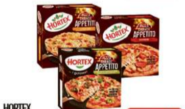
HORTEX PIZZA GRANDE APPETITO 380-425g wybrane rodzaje