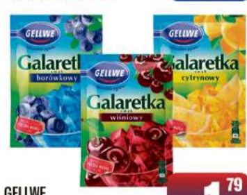
GELLWE GALARETKA 72g wybrane rodzaje