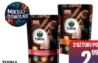
TURNA KARMA DLA KOTA 300g wybrane rodzaje

2 SZTUKI PO 2 99 1 szt 9,97 zł/kg *cena za zestaw: 5,98 zł