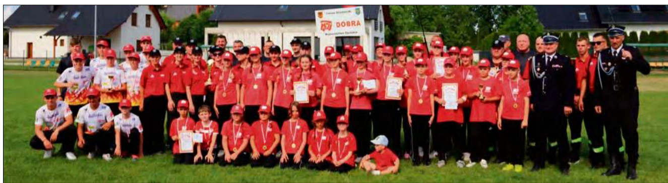
To było wielkie, gminne wydarzenie w Strzelecckach.

W kategorii młodzieżowej chłopców również zwyciężyła OSP Dobra II, wyprzedzając OSP Dobra I. Na najniższym stopniu podium stanęła OSP Zielina. Dalej sklasyfikowano OSP Pisarzowice, OSP Raclawiczki I, OSP Łowkowie,