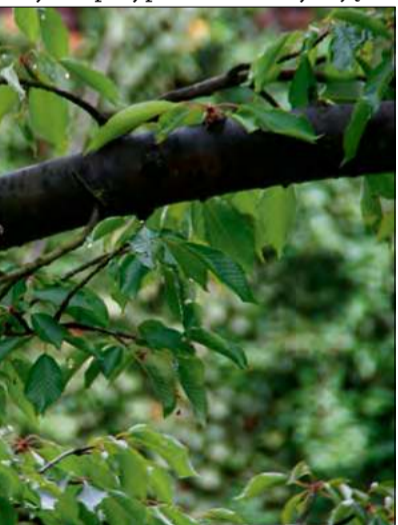
Pleszka zwyczajna to jeden z gatunków ptaków, które można spotkać również w miejskich parkach i ogrodach.

Zmiany klimatyczne wpływają na fizjologię, zachowanie i dobrostan zwierząt, a w skrajnych przypadkach decydują o