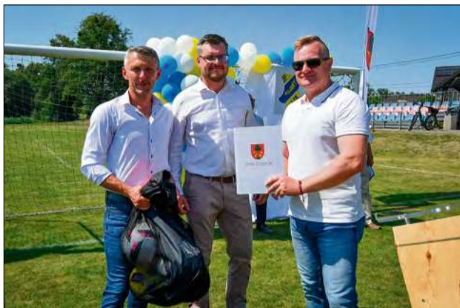
Samorządowcy ze Strzeleczek, oprócz listu gratulacyjnego przekazali „Jubilatowi” worek z piłkami.

tor Opolskiego Związku Piłki Nożnej – przyp. red.) przypomniał najważniejsze karty z historii LZS-u Kujawy. W swojej opowieści wspominał nie tylko początki klubu i jego