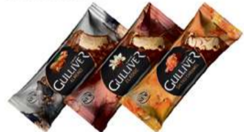
AUGUSTO LODY GULIVERE 120ml almond, classic, salted caramel