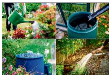
Program „Mikroretencja” został uruchomiony w odpowiedzi na systemowe niedobory wody, które przestały być zjawiskiem sezonowym.

Środki na dotacje pochodzą z programu Fundusze Europejskie na Infrastrukturę, Klimat, Środowisko (FEniKS) na lata 2021–2027. Maksymalna kwota dofinansowania na jedno przedsięwzięcie to 8 tys. zł, przy minimalnym koszcie kwalifikowanym inwestycji wynoszącym 2 tys. zł. Poziom wsparcia sięga 90 procent kosztów kwalifikowa-