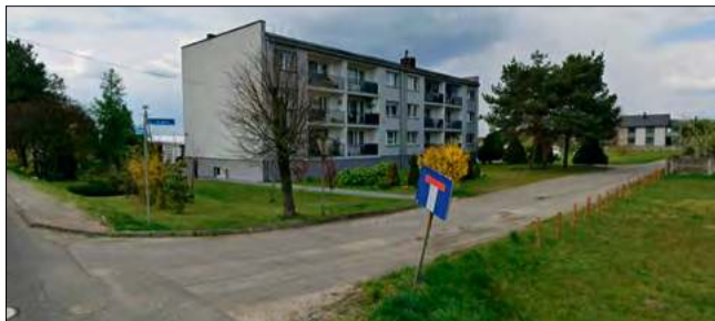
Zdzieszowicki samorząd chce poprawić stan m.in. ulicy Nowej w Krępciej.

Drugie zamówienie dotyczy ul. Ogrodowej w Żyrowej. Tu przebudowany ma zostać odcinek o długości blisko 510 metrów.