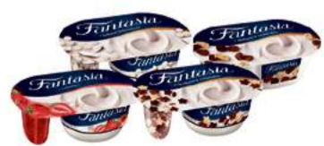
DANONE JOGURT FANTASIA 100-118g wybrane rodzaje