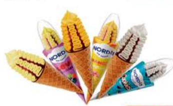
NORDIS LODY ROŻEK 270ml wybrane rodzaje