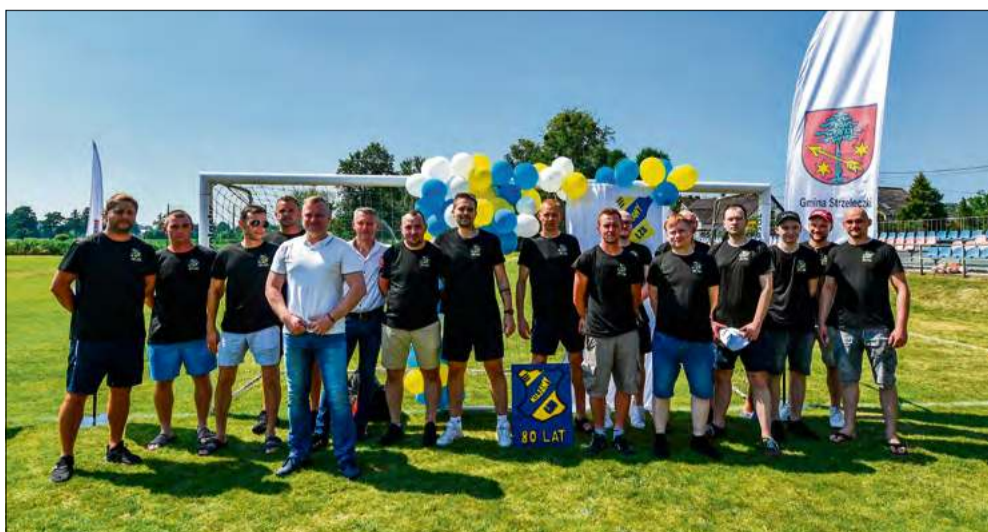
Burmistrz Strzeleczeck nie odmówił sobie wspólnego zdjęcia z piłkarzami z Kujaw.