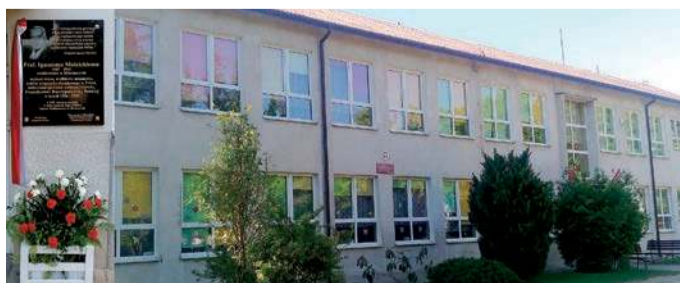
Szkoła w Humięcinie ma wieloletnią tradycję