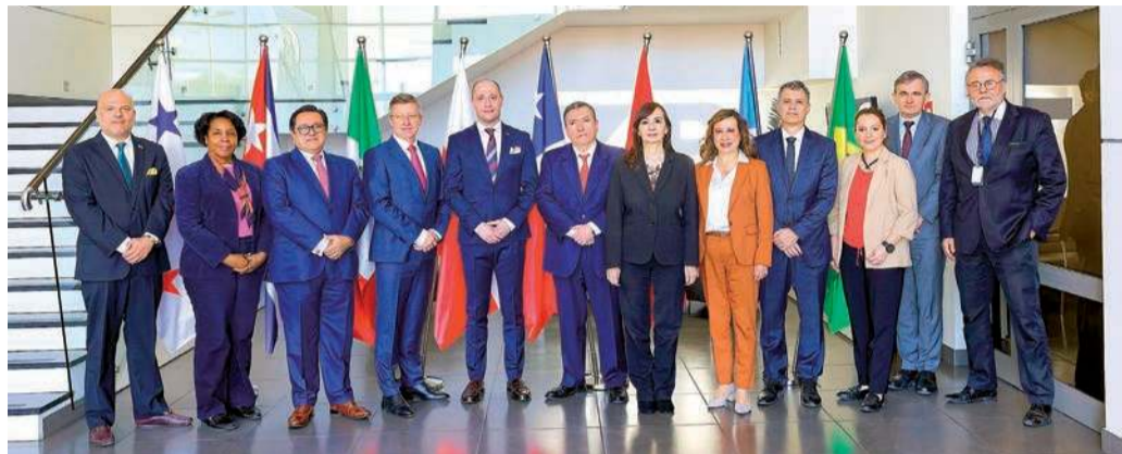
Ambasadorowie krajów Ameryki Łacińskiej, przedstawiciele ministerialni oraz władze T4B podczas konferencji w Ciechanowie

które integrują monitoring, identyfikację osób i pojazdów oraz analizę danych w czasie rzeczywistym.