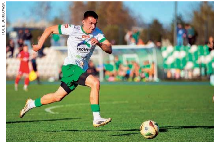
Mławianie odnieśli cenne zwycięstwo w Elblągu