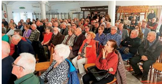
Spotkanie zgromadziło liczną widownię

Wracając do stosunków z prezydentem, wyraził dezaprobatę dla częstego wetowania i procedowania, jak stwierdził „populistycznych, nieprzemysłowych, nastawionych na skłócenie naszego narodu” ustaw. Skrytykował w mocnych słowach m.in. brak podpisu pod ustawą o kryptowalutach.