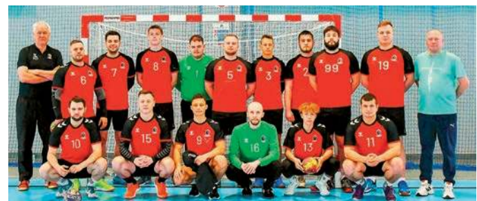
Zespół z Przasnysza może mieć powody do dumy

Wyniki 7. kolejki: AZS Politechniki Świętokrzyskiej Kielce – Agrykola Warszawa 35:43 (16:19), Handball Przasnysz – Piotrkowianin 31:31 (17:13) <4:2>, AZS SGH Piłka Ręczna Warszawa –