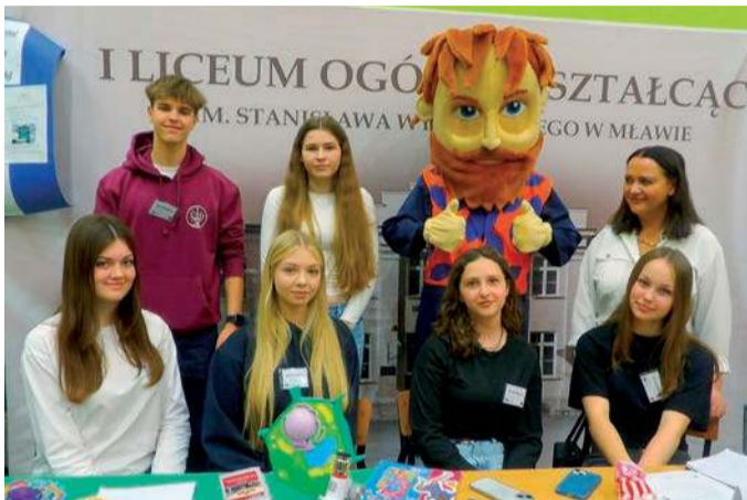
Uczniowie I LO w Mławie z maską patrona – Stanisława Wyspiańskiego

Blisko 80 firm, urzędów i innych instytucji, służb mundurowych, ośrodków szkoleniowych oraz szkół ponadpodstawowych i wyższych uczelni uczestniczyło w Mławskim Targach Pracy, zorganizowanych, jak zwykle, przez Powiatowy Urząd Pracy i Starostwo Powiatowe.