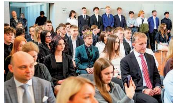
Licealiści i uczniowie technikum ZS nr 1 im. gen. J. Bema