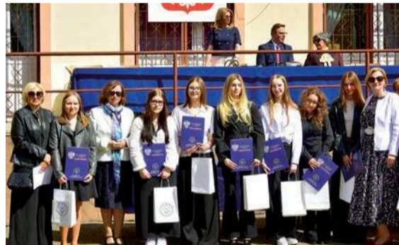
ZS nr 2 im. Adama Mickiewicza w Ciechanowie