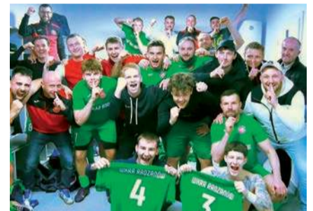
Radość po zwycięstwie w szatni Wkry Radzanów