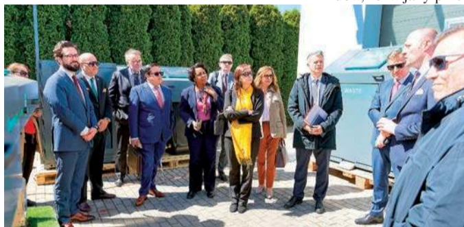
Prezentacja nowoczesnych rozwiązań w dziedzinie gospodarowania odpadami

umożliwiający bieżącą analizę parametrów i szybkie reagowanie na zakłócenia.