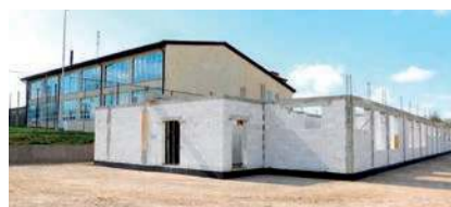
Trwa rozbudowa szkoły w Siedlinie

budynku szkoły podstawowej wraz z modernizacją instalacji (budowlanych, sanitarnych i elektrycznych). Nowa oraz odnowiona część obiektu zostanie w pełni wyposażona – pojawią się m.in. ławki i krzesła do sal