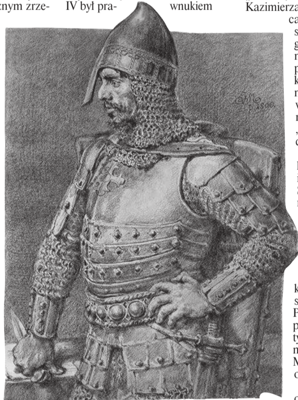
Książę Konrad Mazowiecki (wg. Jana Matejki)

W 1381 r. – po śmierci ojca – książę Janusz objął we władanie ziemie czerską, warszawską, liwską, wyszogrodzką, zakroczymską i ciechanowską. Choć było to księstwo bardziej rozległe niż władztwo jego brata Siemowita, to jednak ziemie te były znacznie słabiej zaludnione i zagospodarowane niż Księstwo Płockie. W tym czasie tylko sześć miejscowości w tej dzielnicy posiadało prawa miejskie (Czersk, Warszawa, Ciechanów, Warka, Ostrołęka i Wizna). W ciągu półwiecza książę lokował ponad 20 nowych miast, w tym Różan, Nasielsk, Wyszogrod, Łomżę, Maków Mazowiecki, Nowe Miasto, Janów, Zakroczym, Przasnysz. Przenosił też wiele wsi na prawo chełmińskie, budował zamki i fortyfikacje, fundował kościoły, wzmacniał północną granicę Mazowsza, przyczynił się do rozwoju stoleczności Warszawy, rewitalizował Ciechanów i inne grody książęce, do których przybywał kilka razy w roku w czasie swoich podróży. Stworzył sprawny zarząd podległymi mu ziemiami, a jego dwór stał się prawdziwym centrum życia kulturalnego i politycznego ówczesnego Mazowsza. Książę Janusz zmarł 8 grudnia 1429 r. na zamku w Czersku i został pochowany w kolegiacie św. Jana Chrzciciela w Warszawie. Był najdłużej żyjącym Piastem mazowieckim.