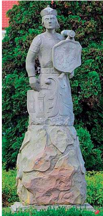
Pomnik Siemowita IV w Gostyninie

Poza Konradem Mazowieckim także kilku jego potomków pretendowało do polskiego tronu. W późnym średniowieczu dwóch z nich miało spore szanse na powodzenie. Pierwszym z nich był książę Siemowit IV, urodzony około 1352 r., syn Siemowita III, ostatniego Piasta, któremu udało się zjednoczyć pod swoją władzą całe Mazowsze. Książę Siemowit IV krótko przed śmiercią ojca otrzymał w spadku ziemie rawską, gostynińską, sochaczewską, płocką,