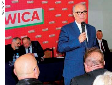
Człowiek ma prawo do tego, żeby być taki, jaki chce – mówił marszałek

- Ja wiem, że w tej chwili są takie nastroje, że ludzie mają w Polsce dosyć Ukrainy i Ukraińców. Ale musimy państwu powiedzieć, że Ukraincy mają jeszcze bardziej tego dosyć (...) Nie ma wolnej Ukrainy bez wolnej Ukrainy – stwierdził, określając sytuację, jako wybór między dobrem a złem.