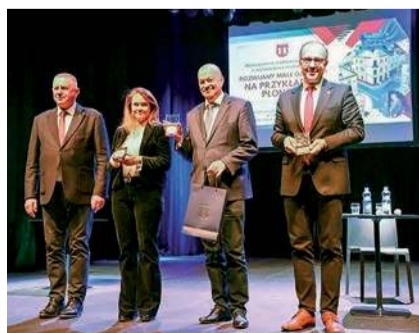
Wykład w Uniwersytecie Trzeciego Wieku