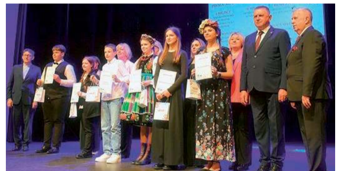
Nagrodzono laureatów w kilku kategoriach