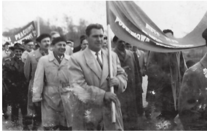
Wspomnienia - pochód 1 majowy

Przed nami weekend majowy, czas wycieczek, wyjazdów, odpoczynku. Warto jednak przypomnieć, jakie dni składają się na długą majówkę.