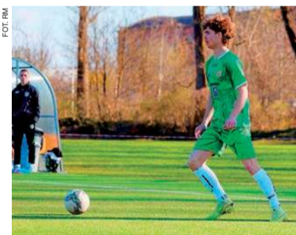
Ciechanowianie nie będą mieli łatwej drogi do utrzymania

W innym spotkaniu ligowym piłkarze z Płońsk (mecz rozgrywany w Słoszewie) po zaciętym meczu dopisali do swojego dorobku kolejne trzy punkty. O losach rywalizacji przesądził jeden gol autorstwa będą-