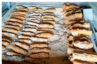
Saperzy zabezpieczyli kilkadziesiąt niewybuchów

Początkowo mowa była o czterech sztukach. Teren został zabezpieczony przez policjantów, a na miejsce wezwano patrol saperów nr 18 z Kazunia Nowego, działający w ramach 2 Mazowieckiego Pułku Saperów. W trakcie czynności wykonywanych przez saperów odkryte zostały kolejne niewybuchy o różnej