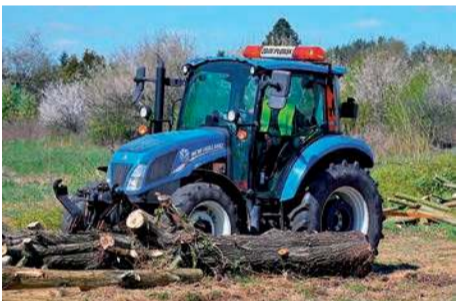
W Płońsku powstanie kolejny obiekt sportowy

- Dzięki budowie stadionu i boiska tereny wokół Miejskiego Centrum Sportu i Rekreacji zapewnią sportowcom warunki, na jakie zasługują. Stadion spełniać będzie wymogi III ligi piłkarskiej, a z obiektem rozgrzewkowym kategorii III A w lekkoatletyce – przekazuje urząd.