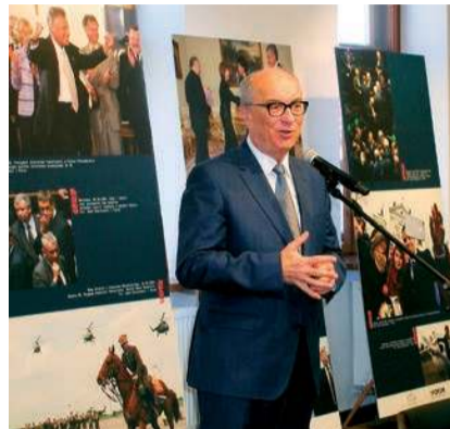
Wystawę otworzył marszałek Sejmiku Włodzimierz Czarzasty

ny był z umiejętności uchwycenia unikalnych momentów, a także z charakterystycznego stylu – nosił kowbojski kapelusz i buty. Zmarł nagle 2 marca 2026 roku w wieku 50 lat. Pośmiertnie odznaczony został przez ministra obrony narodowej srebrnym Medalem za Zasługi dla Obronności Kraju.