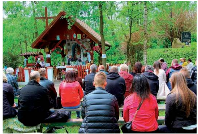
Majowe – Łopacin

1 maja jest ważnym świętem katolickim. Zostało ustanowione w 1955 roku – pod wpływem Święta Pracy – przez papieża Piusa XII dniem św. Józefa Robotnika, patrona ludzi pracy, chociaż wcześniejsi papieże już od XIV wieku ustalali święto Józefa