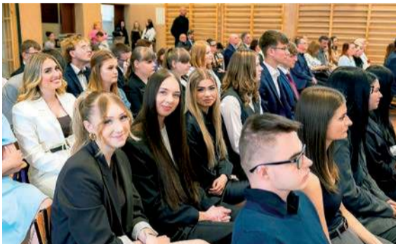
Zespół Szkół Technicznych Centrum Kształcenia Ustawicznego w Ciechanowie