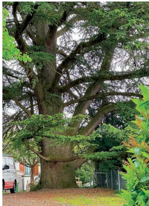
Przyroda ukazuje nam przepiękną starość

i wszystkie podatki, trzydzieści, czterdzieści, pięćdziesiąt lat powinno być go stać na utrzymanie się z własnej emerytury, bez niczyjej łaski. Tymczasem jest z tym różnie. Gdyby stworzono systemowe rozwiązania wykorzystujące potencjał emerytów, podreperowałyby finanse osób starszych, bez oglądania się na czyjaśkolwiek pomoc. Gro osób przechodzących na emeryturę ma ogromną wiedzę i umiejętności, które mogłyby przekazywać młodszym, o ile stworzono by do tego warunki. Na przykład: „doradca młodego pracownika” taka funkcja na część etatu, pomogłaby pracownikom wchodzącym na rynek pracy skorzystać z pomocy starszego kolegi. Młody