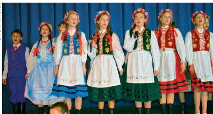
Młodzi artyści z Karniewa

podkreśliła autentyczny, ludowy charakter wydarzenia i sprawiła, że każdy moment był jeszcze bardziej wyjątkowy. To było coś więcej niż koncert – to wspólne przeżywanie kultury, integracja i piękne spotkanie