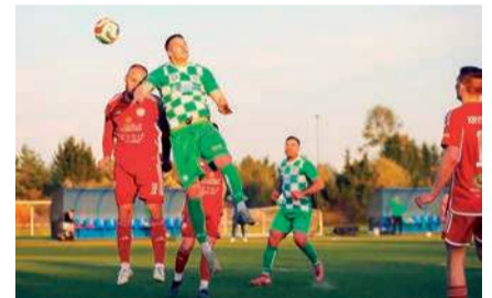
Opia i Kryształ podzielił się punktami

- Narew 3:5, Ostrovia - Gladiator 0:2, Sona - Strzegowo 2:0, Wkra R. - Wkra B. 4:3, Rzekunianka - Kurpik 3:2, Korona - Wkra Ż. 3:1, Kryształ - Opia 1:1.