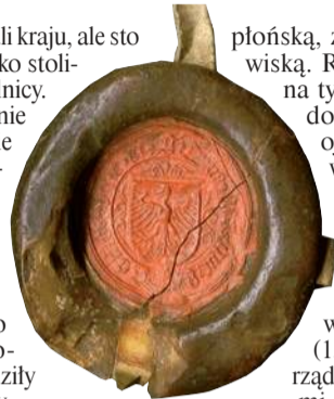
Pieczęć księżnej Anny Radziwiłłówny

płocką, zawkrzeńską oraz wiską. Rzeczywiście rządy na tych terenach objął dopiero po śmierci ojca (1381), ale już wkrótce – w wyniku starań o koronę polską po śmierci Ludwiga Andegaweńskiego i wynikłą z tego wojną domową (1382-1385) – przejął rządy również nad innymi ziemiami, między innymi nad Kujawami brzeskimi, a potem nad