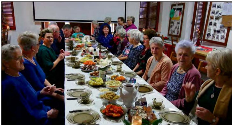
Dzięki wsparciu gminy Prószków nadal swoją działalność będzie kontynuował klub seniora w Żłinicach.

Najwyższa dotacja – 85 tys. zł – trafi do Gminnego Zrzeszenia Orzeł Żłinice. Znaczące wsparcie w wysokości 73 tys. zł, otrzyma również Miejski Klub Sportowy Polonia Prószków-Przysiecz. Wsparcie w wysokości 34 tys. zł przyznano Klubowi Sportowemu „Chrzaszcz” z Chrzaszczyc. Z kolei 18 tys. zł otrzymał PLUKS Pomologia Prószków. Klub organizuje