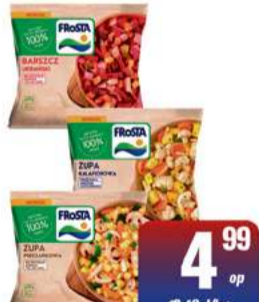
FROSTA ZUPA MIESZANKA WARZYWNA 400g wybrane rodzaje