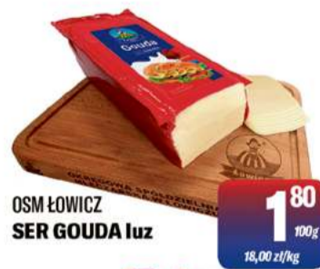
OSM ŁOWICZ SER GOUDA luz