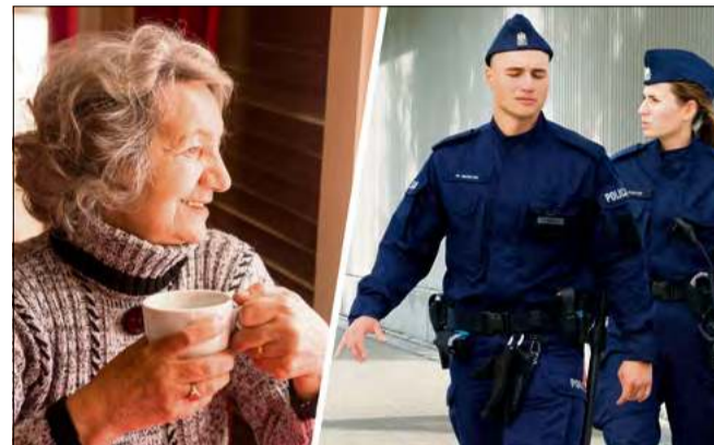
Funkcjonariusze podczas prelekcji omówią zagrożenia, na które narażone są osoby starsze.

Posterunek Policji w Tarnowie Opolskim organizuje spotkanie poświęcone bezpieczeństwu najstarszych mieszkańców gminy. Wydarzenie odbędzie się 13 marca o godzinie 10.00 w Domu Kultury w Tarnowie Opolskim. Organizatorzy zapewniają bezpłatny transport dla osób, które nie mają możliwości samodzielnego dotarcia na miejsce.