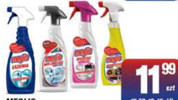
MEGLIO ODKAMINIACZ, ODTŁUSZCZACZ, PŁYN DO ŁAZIENKI 650-750ml wybrane rodzaje