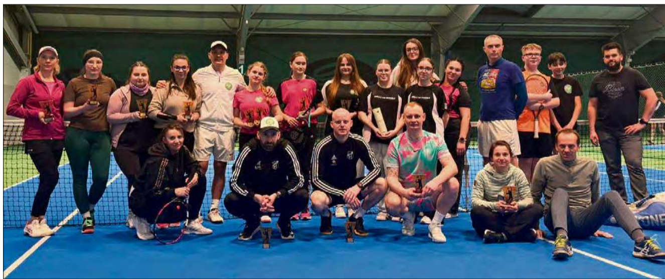
W sportowych zmaganiach mierzyło się 24 uczestników.

Za nami pierwszy halowy turniej deblowy. W zmaganiach wzięły udział 24 osoby, które rywalizowały w trzech kategoriach. Wydarzenie otworzyło sezon tenisowy w gminie.