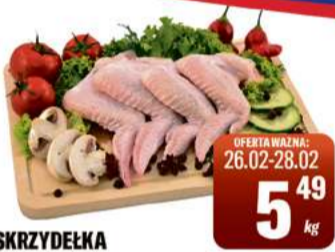
SKRZYDEŁKA Z KURCZAKA

CENA W OFERCIE OBOWIĄZUJE WE WSZYSTKICH PLACÓWKACH TOMIMARKT