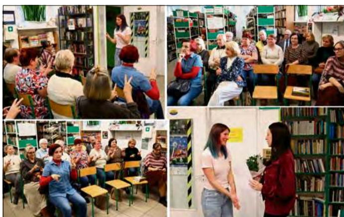
Podczas wydarzenia prelegentka zwróciła uwagę na trzy kluczowe obszary wpływające na jakość życia.

Prowadząca wyjaśniła, jak mechanizm oddychania oddziałuje na cały organizm oraz w jaki sposób ruch przekłada się na zachowanie sprawności