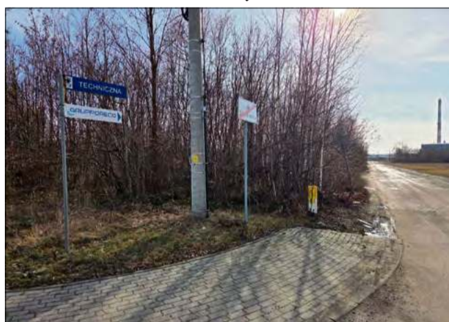
Całkowity koszt przebudowy ul. Technicznej w Schodni to niespełna 1 mln 200 tys. zł.

Przedstawiciele gminy podkreślają, że ul. Techniczna pełni istotną rolę w lokalnym