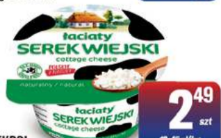
MLEKPOL SEREK WIEJSKI ŁACIATY 200g