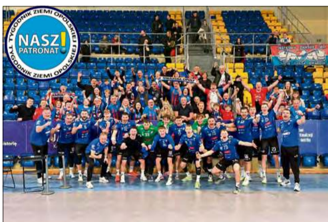
Radość zawodników i kibiców z wygranej była ogromna.

tów przewagi nad strefą spadkową i sześć punktów straty do miejsca w czołowej ósemce.