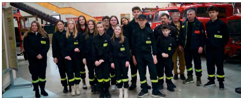
Młodzi druhowie wzięli udział w niezwyklej lekcji historii.