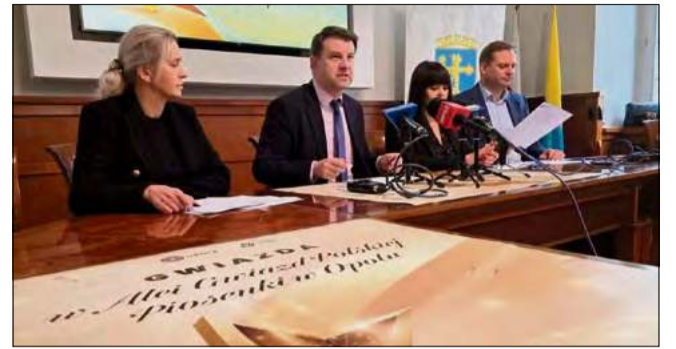
W celu uporządkowania zasad corocznego wyboru artystów i zespołów, które będą odsłaniać w danym roku swoje gwiazdy na opolskim rynku, miasto Opole przygotowało regulamin.

Wyróżnienie imienia Carlosa Marqueza Pratsa to nie jest zwykłe trofeum. W środowisku hodowców uchodzi za dowód nieprzeciętnej klasy i umiejętności utrzymania formy na najwyższym poziomie.