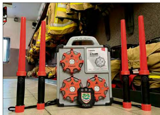
Strażacy otrzymali cztery latarki do kierowania ruchem drogowym oraz zestaw flar ostrzegawczych.

Wyposażenie zostało przekazane dzięki wsparciu