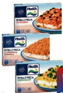
FROSTA RYBA Z PIECA 330-360g wybrane rodzaje