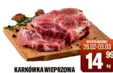
KARKÓWKA WIEPRZOWA BEZ KOŚCI