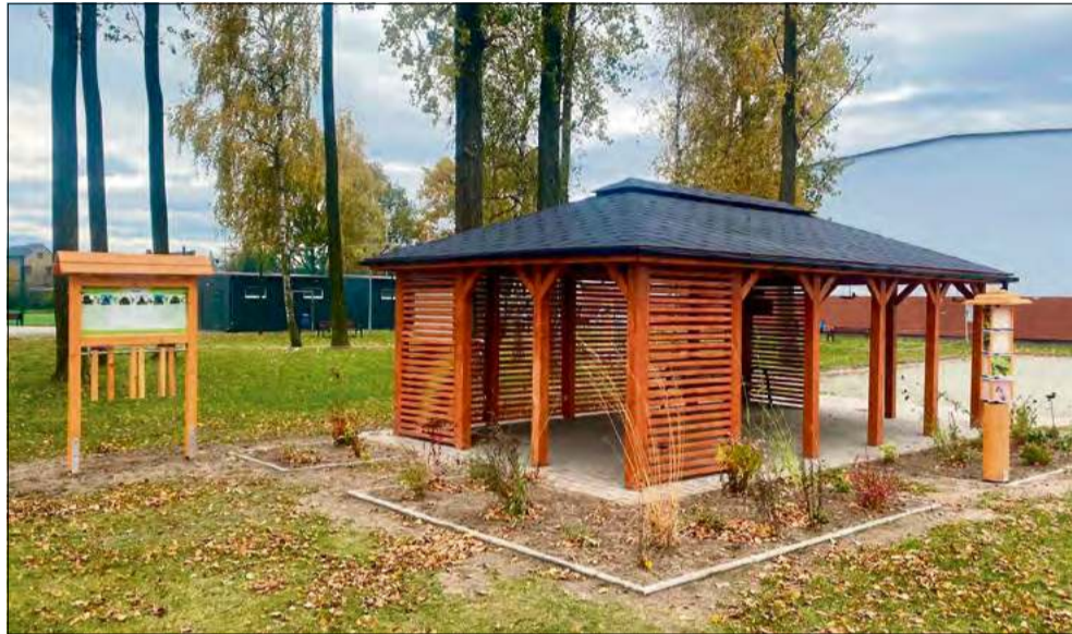
W zielonych klasach będą organizowane plenerowe lekcje, warsztaty, pikniki naukowe i spotkania z lokalną społecznością.

Małgorzata Łyczak, fot. Szkoła Podstawowa w Starych Siolkowicach, szkoła podstawowa w Popielowie, gmina Popielów