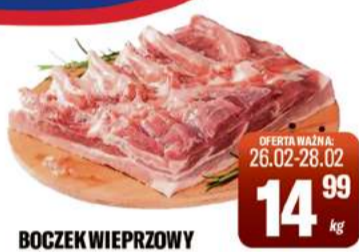
BOCZEK WIEPRZOWY PŁAT