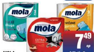
MOLA RĘCZNIK KUCHENNY PAPIEROWY A'2 wybrane rodzaje