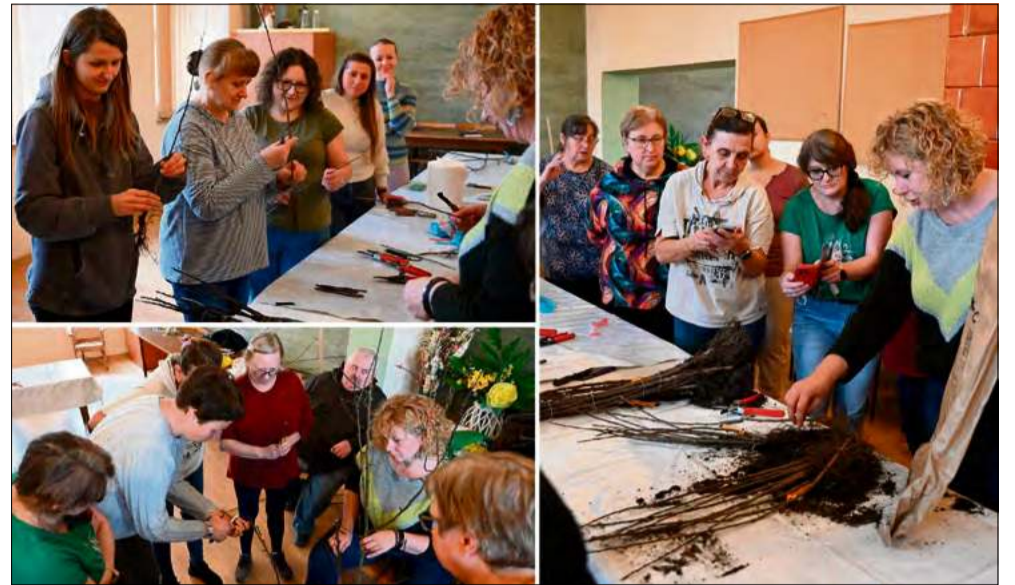
Gmina Murów organizuje praktyczne warsztaty sadownicze i ogrodnicze.

Równoległe gmina przystąpiła do realizacji działań inwestycyjnych. W miejscowości Młodnik powstanie tradycyjny sad, który zostanie ogrodzony i obsadzony starodrzewem. To jeden z elementów szerszego planu ochrony bioróżnorodności, zakładającego również zagospodarowanie siedmiu publicznych przestrzeni w Murowie, Starych Budkowi-