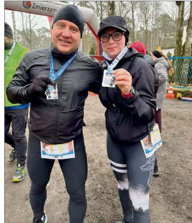
Medale, uśmiechy i satysfakcja - tak kończy się Zmrożona Połówka.

ków biegania, również wśród mieszkańców naszej gminy.