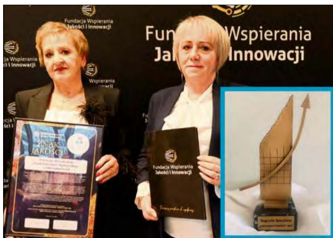
Chrząstowickie przedszkole zostało dostrzeżone poza regionem.

Dla niewielkiej gminy, jaką są Chrząstowice, to sygnał,