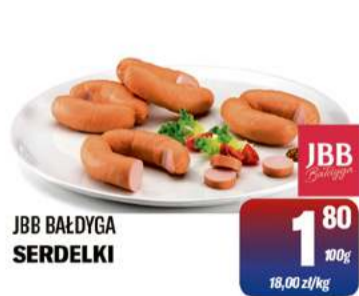
JBB BAŁDYGA SERDELKI