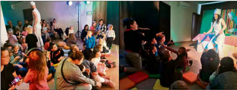
Przedstawienie miało interaktywny charakter.

W miniony weekend Centrum Aktywności Lokalnej w Chróście zaprosiło widzów w niezwykłą podróż do słonecznej Italii. A wszystko za sprawą spektaklu Prościutko w wykonaniu Teatr Gagoki.