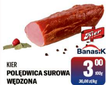
KIER POŁĘDWICA SUROWA WĘDZONA