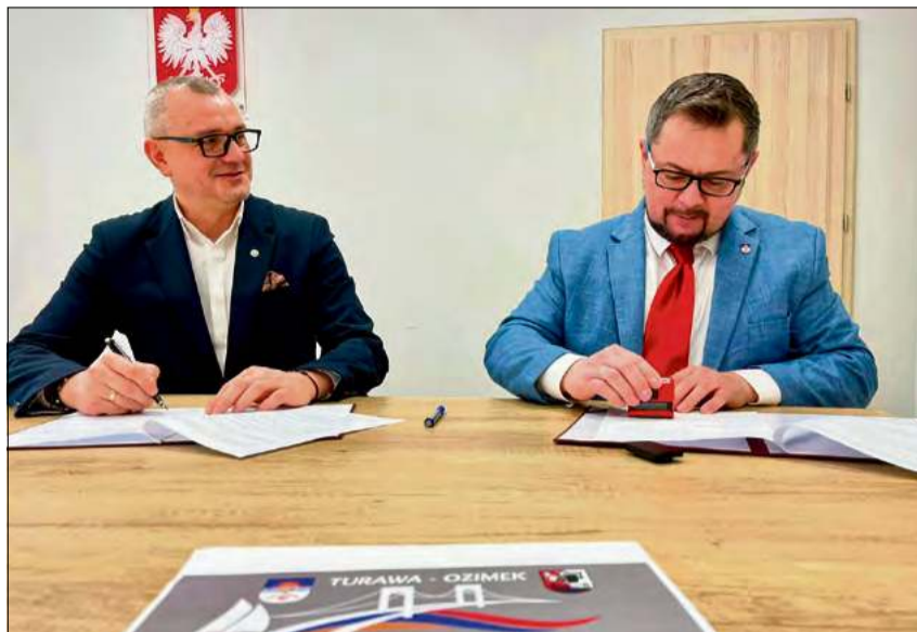
Samorządowcy Turawy i Ozimka wspólnie na rzecz rozwoju komunikacji publicznej.

- Impuls wyszedł wprost od mieszkańców. Podczas zebrań wiejskich już we wrześniu ubiegłego roku bardzo wyraźnie wybrzmiała potrzeba lepszego połączenia z Ozimkiem, zwłaszcza w sołectwach takich