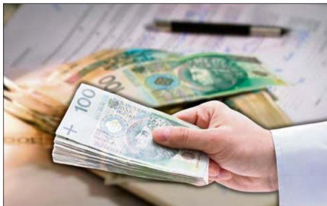
Rusza nowa edycja konkursu na poprawę bezpieczeństwa i higieny pracy dla płatników składek.