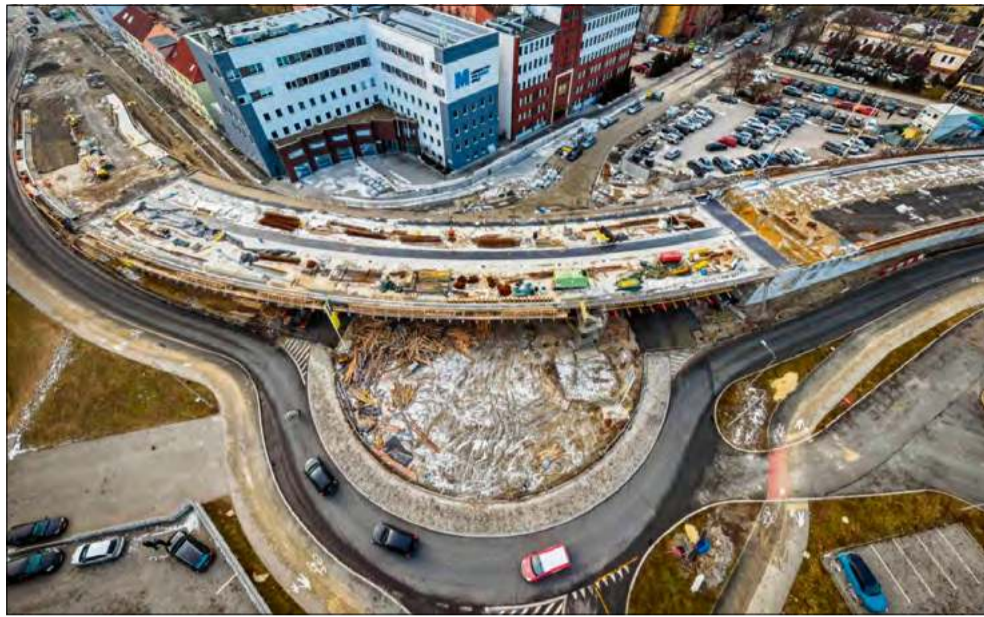
Czerwiec to planowany termin zakończenia robót związanych z wiaduktem przy Centrum Usług Publicznych w Opolu.