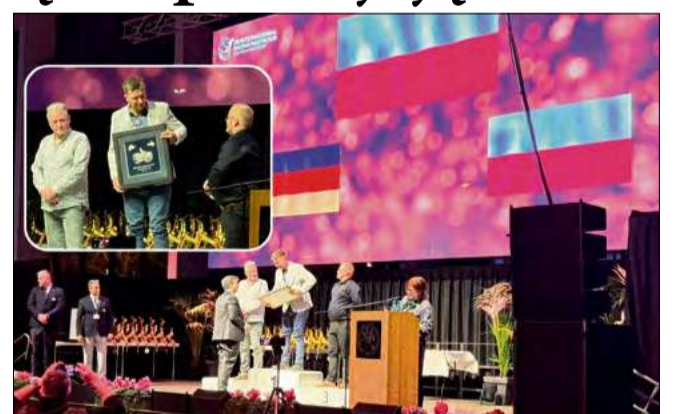
Mieszkańcy gminy Lubniany z wielkim sukcesem na Olimpiadzie Gołębi Pocztowych.

Komisja oceniająca bierze pod uwagę nie tylko pojedyncze zwycięstwa, ale przede wszystkim systematyczność i stabilność wyników w rywalizacji z najlepszymi stadami z całego świata.