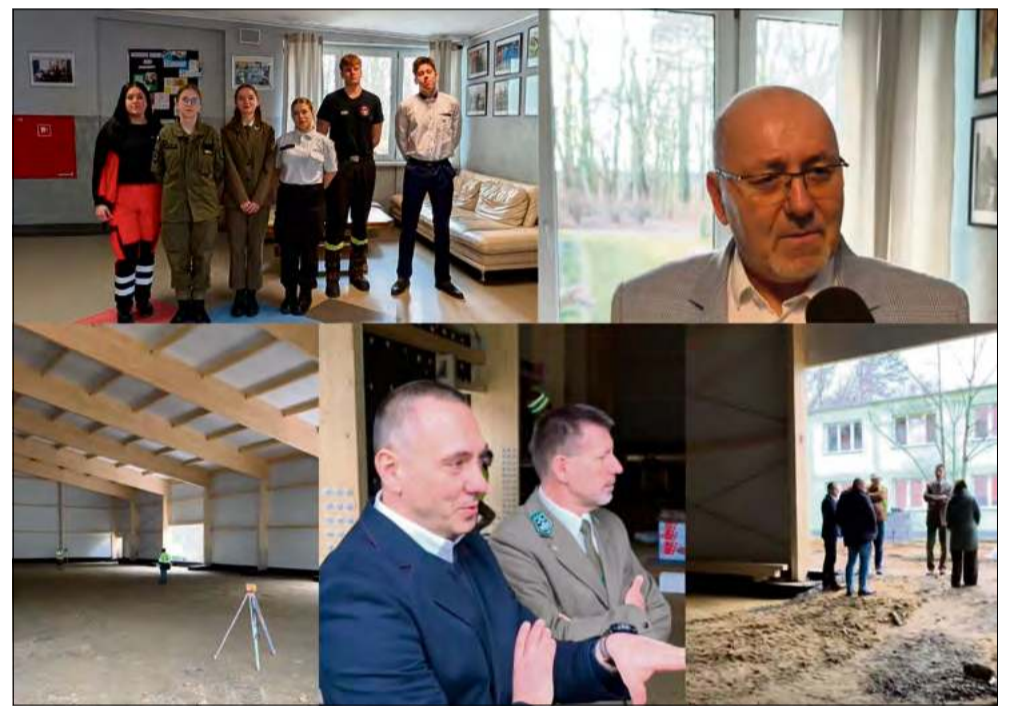
Uczniowie i dyrektorzy szkół powiatu opolskiego podczas wizyty na placu budowy nowej hali sportowej w Prószkowie.

Uczniowie i dyrektorzy szkół z Prószkowa, Niemodlina, Ozimka i Tułowic spotkali się, aby promować edukację i sport w powiecie opolskim. W centrum wydarzeń znalazła się budowa nowoczesnej hali sportowej w Prószkowie z dofinansowaniem 5,6 mln zł z Programu Olimpia, która zapewni młodzieży doskonałe warunki do nauki i rozwijania pasji sportowych.