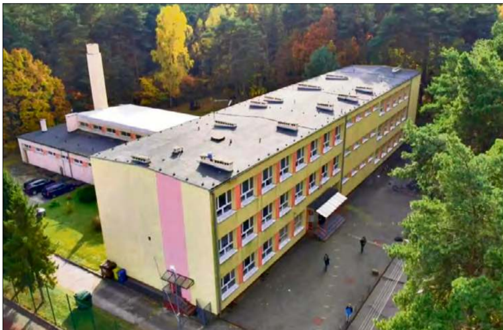
Audyt energetyczny szkoły podstawowej w Szczedrzyku wykazał zbyt duże zużycie energii.

W sali gimnastycznej zaplanowano montaż nagrzewnic wodnych niskotemperaturowych. W budynku zostaną też zdemontowane stare grzejniki żeliwne i zastąpią je nowe kaloryfery. W ramach pla-