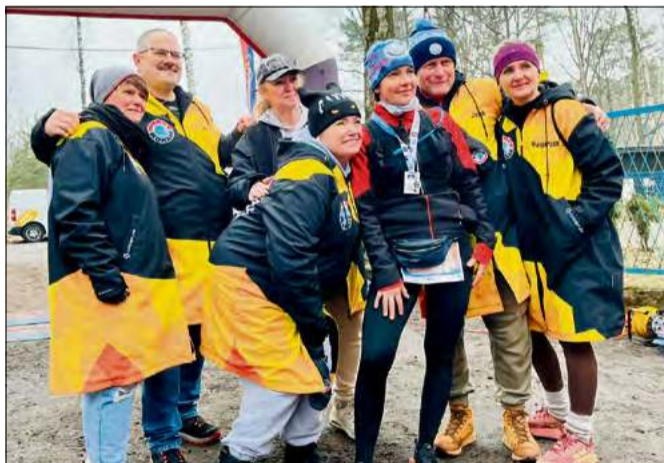
Zmrożona Połówka znów przyciągnęła biegaczy z całego regionu.

P onad 300 zawodników z różnych części regionu, a nawet kraju, stanęło na starcie kolejnej edycji Zmrożonej Połówki nad Jeziorem Turawskim. To wydarzenie, które na stałe wpisało się w kalendarz zimowych imprez biegowych i co roku cieszy się niesłabnącą popularnością.