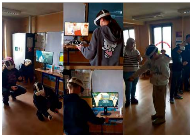
Dla szkół z mniejszych miejscowości to także okazja do kontaktu z technologiami, które na co dzień nie są powszechnie dostępne.

Dzięki technologii wirtualnej rzeczywistości uczniowie mogli zobaczyć, jak wygląda praca między innymi na placu