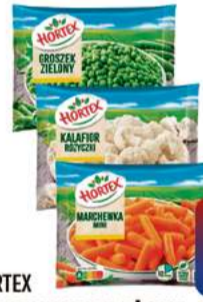
HORTEX WARZYWA MROŻONE 450g groszek zielony, marchewka mini, kalafior różyczki