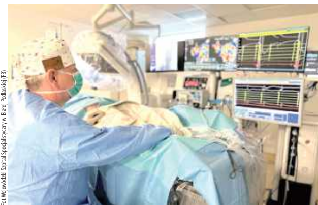
Podczas pierwszych zabiegów ablacji zaburzeń rytmu serca z wykorzystaniem najnowszej technologii cewnika TactiFlex Duo

- Wprowadzenie technologii TactiFlex Duo do naszej pracowni to kolejny ważny krok w rozwoju nowoczesnej elektrofizjologii. System jest całkowicie zintegrowany z trójwymiarowym systemem elektroanatomicznym, co pozwala wykonywać abla-