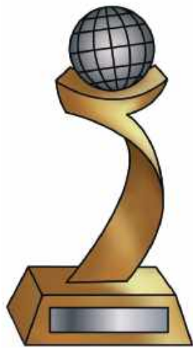
Do tu już XIV edycja Nagrody Biznesowej BPIG

Białkopodlaska Izba Gospodarcza wraz z prezydentem miasta Biała Podlaska i starostą bialskim ogłosiły XIV edycję Nagrody Biznesowej BPIG za rok 2025. Celem konkursu jest identyfikacja i wyróżnienie firm oraz przedsiębiorców działających na obszarze objętym działalnością Izby, którzy spełniają określone kryteria formalne i merytoryczne.