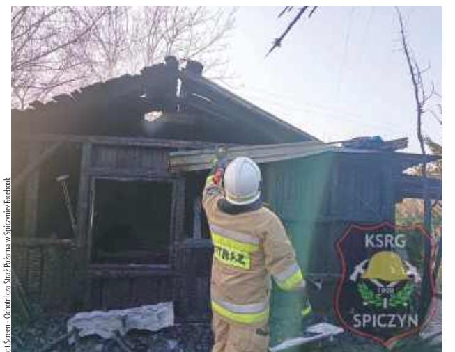
W działaniach wziął też udział zastęp z JRG Komenda Powiatowa Państwowej Straży Pożarnej w Łęcznej oraz zastęp z jednostki OSP Charleż i OSP KSRG Jawidz

Działania straży polegały na podaniu trzech prądów wody. Po ugaszeniu pożaru budynek został przeszukany, aby mieć pewność, że w momencie zdarzenia nikogo nie