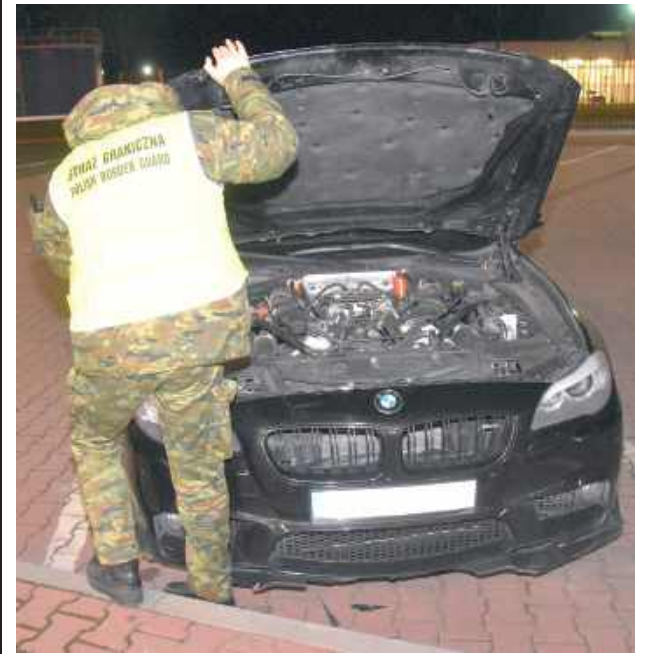
BMW nie wyjechało za Bug

Na terenie drogowego przejścia granicznego w Terespolu Straż Graniczna przerwała podróż Białorusinowi.