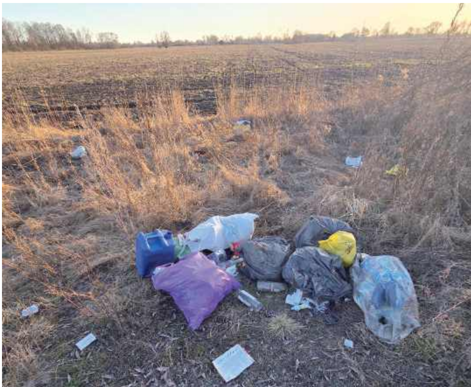
Worki wypełnione śmieciami, plastikowy kanister, walające się wokół papiery. Kto wyrzucił te odpady do przydrożnego rowu?

Przewodniczący terespolskiej Rady Gminy wszczął alarm, gdy zobaczył śmieci wyrzucone wprost do przydrożnego rowu. Dziwił się, że skoro każdy mieszkaniec płaci za odbiór odpadów, to dlaczego ludzie rzucają śmieci na łono natury.