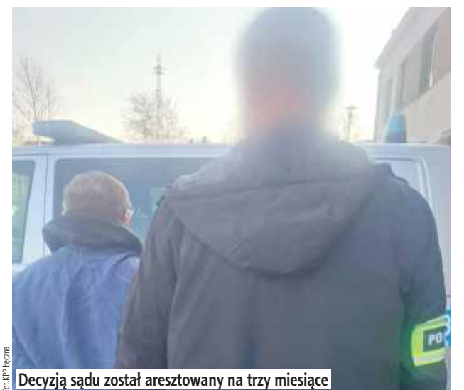
Decyzją sądu został aresztowany na trzy miesiące

- Jak ustalili funkcjonariusze, 64-latek wszczął awanturę, podczas której, trzymając w ręku siekiere, groził pobiciem i pozbawieniem życia swojej 68-letniej