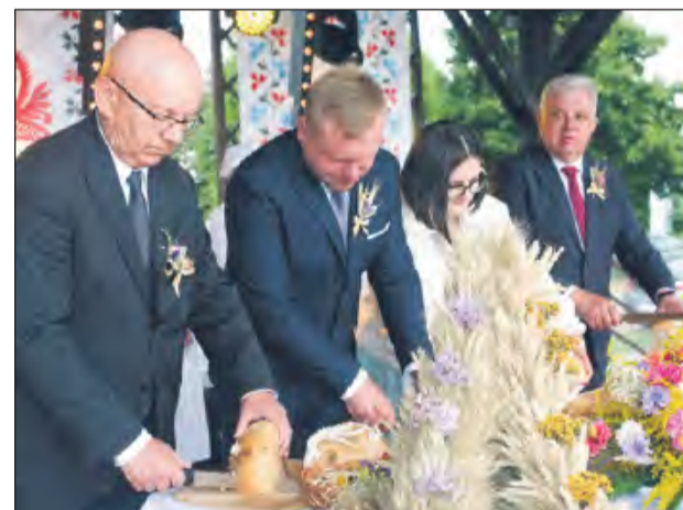
➤ Chleby ze świeżo zebranych ziaren pokroili starostowie dożynek wraz z wójtem i przewodniczącym rady gminy