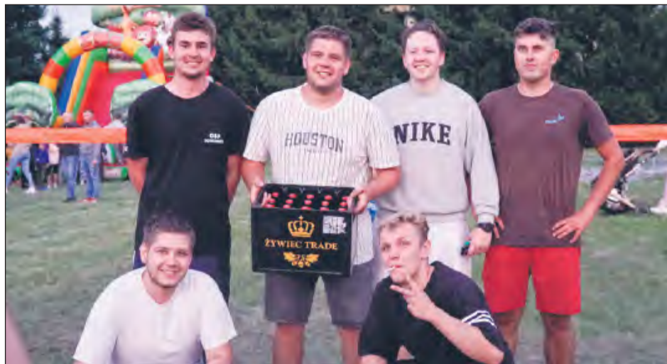
☛ Tego dnia na „Tygrysków” nie było mocnych. Panowie zwyciężyli w turnieju piłki siatkowej. Drugie miejsce zajęły „Orleńca” Nowodwór, a podium zamknęła OSP Nowodwór

Było powitanie to i nie mogło zabraknąć pożegnania. Z takiego założenia wyszli druhowie z OSP w Nowodworze, którzy po udanej czerwcowej integracji, która rozpoczęła tegoroczne lato, postanowili pójść za ciosem i zaprosili mieszkańców na festyn z okazji zakończenia wakacji. Była to okazja, aby wspólnie spędzić wolny czas, w gronie sąsiadów, przyjaciół i całych rodzin, bo jak podkreślali organizatorzy, chcieli, żeby było to popołudnie pełne uśmiechu, rozmów i dobrej zabawy. Atrakcji nie brakowało - najmłodszy mieli do