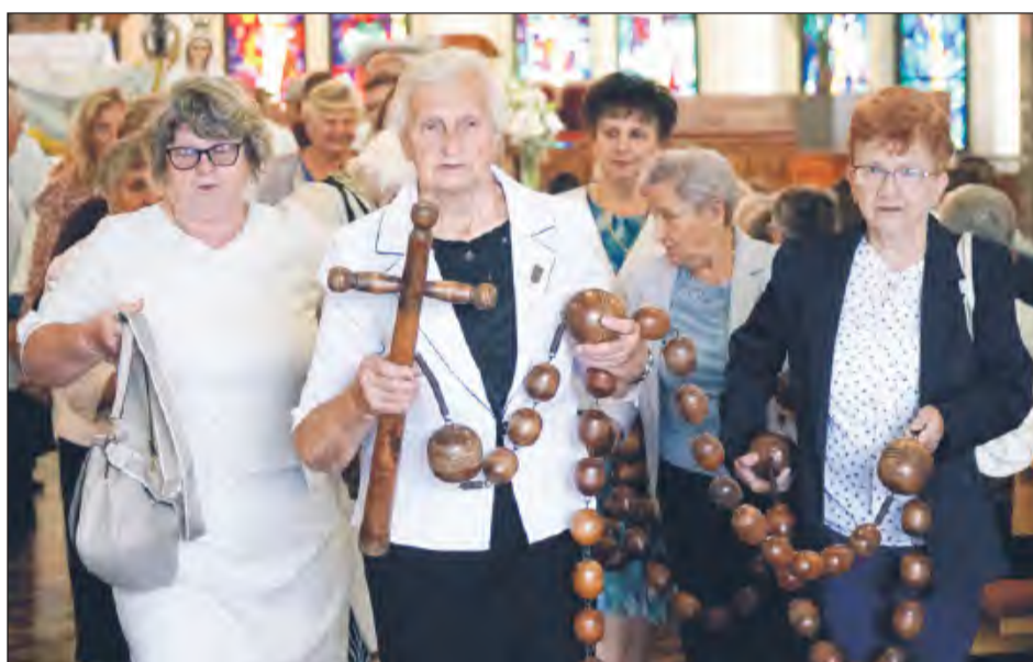
☛ Po Mszy św. sprzed ołtarza wyruszyła procesja eucharystyczna

dzięki staraniom bł. Honorata Koźmińskiego. Po upadku powstania styczniowego pragnął on zjednoczyć Polaków wokół Matki Najświętszej. W 1904 roku, razem z ówczesnym przeorem Jasnej Góry, uzyskał zgodę papieża św. Piusa X na ustanowienie święta. W 1931 roku papież Pius XI rozszerzył je na cały kraj. Sercem tego święta jest oczywiście cudowny wizerunek Matki Bożej, który od