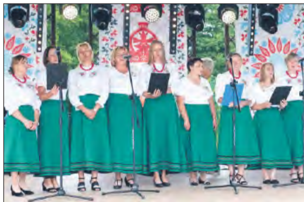
➤ Debiutantami wśród kół gospodyń były panie z Sosnówki. „Sosenki” pierwszy raz uwiity też dożynekowy wieniec

Tegoroczne dożynki były wyjątkowe dla pań z Koła Gospodyń Wiejskich w So-