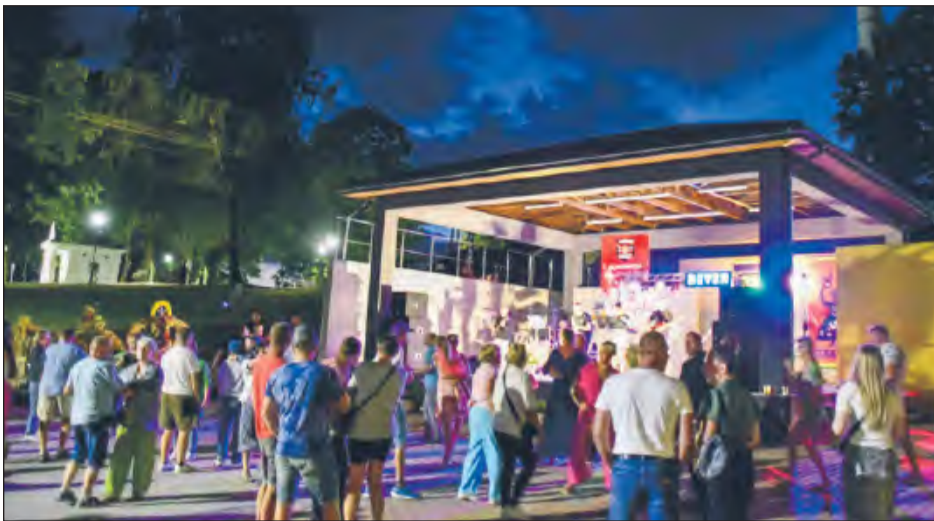
❖ O tym, jak bardzo trafnym pomysłem była budowa nowej sceny koncertowej, można było przekonać się podczas tegorocznych dożynek gminy Uleż

Gminne dożynki były pierwszym wielkim testem dla plenerowej sceny przy ośrodku kultury w Ułężu. Obiekt, który powstał w miejscu starej wiaty, sprawdził się doskonale i już tętni życiem, stając się nową wizytówką gminy