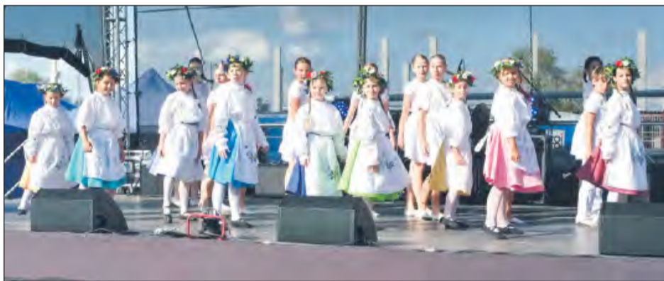
♣ Młodzi tancerze zachwycaли strojem i żywiołowością sceniczną