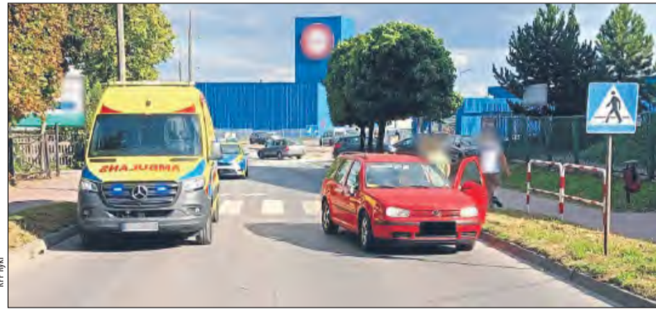
❖ Na oznakowanym przejściu dla pieszych pod koła volkswagena wpadł 65-letni mieszkaniec powiatu ryckiego

Policja po raz kolejny apeluje o zachowanie szczególnej ostrożności na drodze, zwłaszcza w rejonie przejść dla pieszych, przypominając, że przepisy dotyczą wszystkich uczestników ruchu - zarówno kierowców, jak i pieszych.