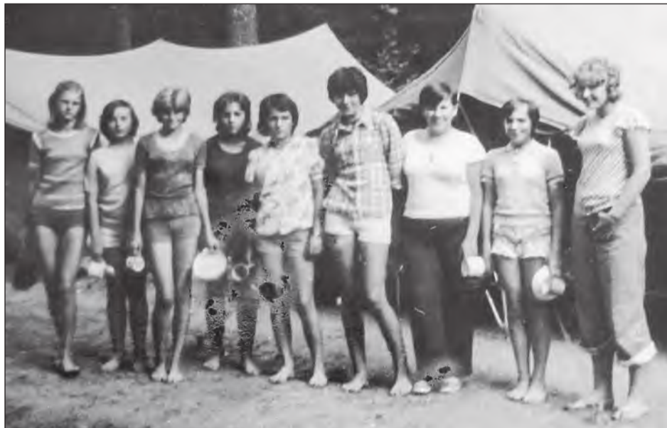
Wymarsz na obiad - zbiórka przed namiotem