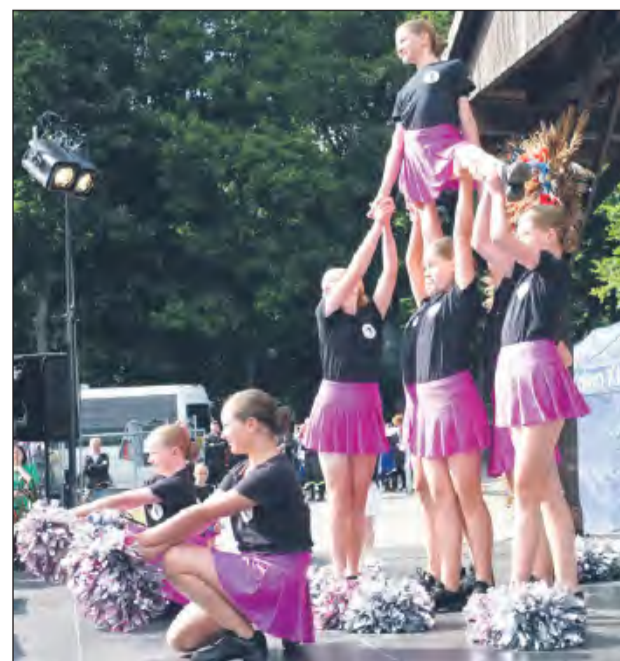
➤ W tym roku na kłoczewskiej scenie po raz pierwszy zaprezentowały się Mażoretki z zaprzyjaźnionej gminy Tarnowo Podgórne