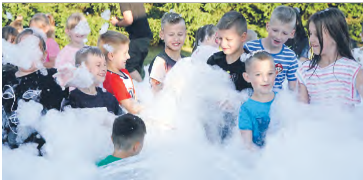
☛ Jedną z głównych atrakcji dla dzieci była „piana party”