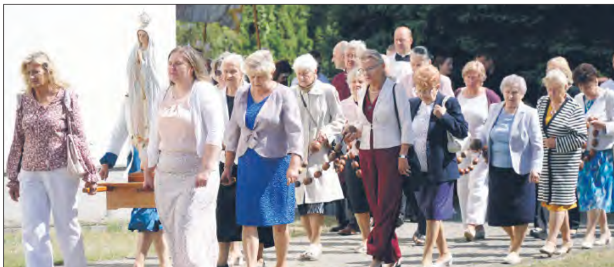
☛ Kulminacyjnym punktem nabożeństwa była procesja wokół świątyni, a po niej wierni odśpiewali hymn „Ciebie Boga wystawiamy”

☛ 1 września, poniedziałek PATRON DŃIA: BŁ. BRONISŁAWA - PAPIEŻ URBAN V WYDAŁ BULLĘ POWOŁUJĄCĄ DO ŻYCIA AKADEMIEJ KRAKOWSKĄ (1364 R.)