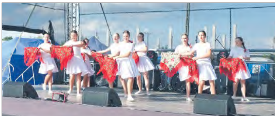
♣ Do nieśmiertelnego przboju zespołu Brathanki „Gdzie ten, który powie mi” zatańczyła Mała Rewia Taneczna