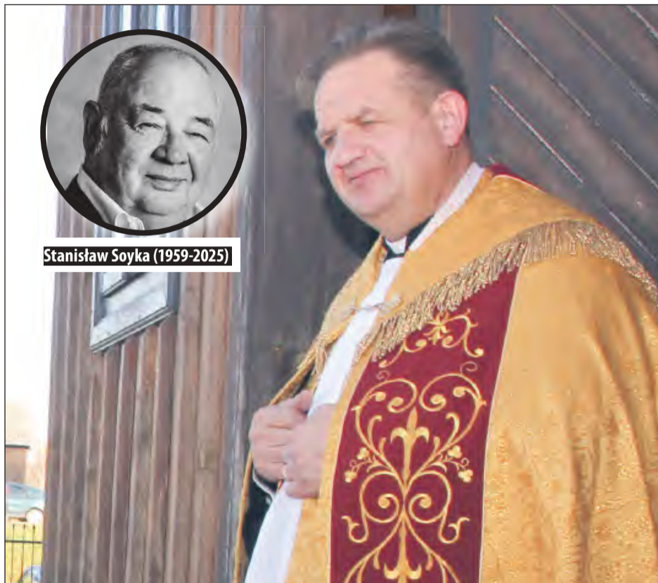
Stanisław Soyka (1959-2025)