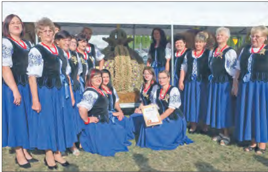
➤ Miano najpiękniejszego uzyskał wieniec uwiity przez panie z koła gospodyń w Nowym Zadybiu

Centralnym punktem dożynek był tradycyjny obrzęd