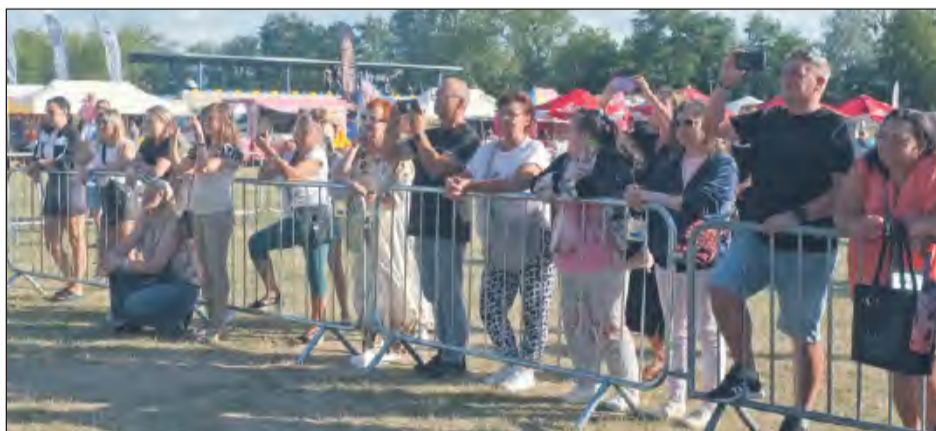
♣ Z każdym występem widzów przed sceną zbierało się coraz więcej

oddawania zwierząt do schroniska. Zwierzęta sterylizujemy i przeznaczamy do adopcji. Jak do tej pory, każdy pies czy kot znalazł swój nowy dom - przekonywała radna Jaroszyk. Tego dnia zbierano również datki do puszek na inny szczytny cel - budowę pomnika upamiętniającego stulecie „Szkoły Orłąt”.