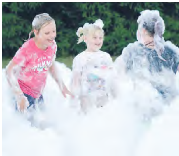
☛ Żeby było jasne. Organizatorzy już przed imprezą przestrzegali, że po szaleństwie w morzu piany będą potrzebne suche ubrania do zmiany