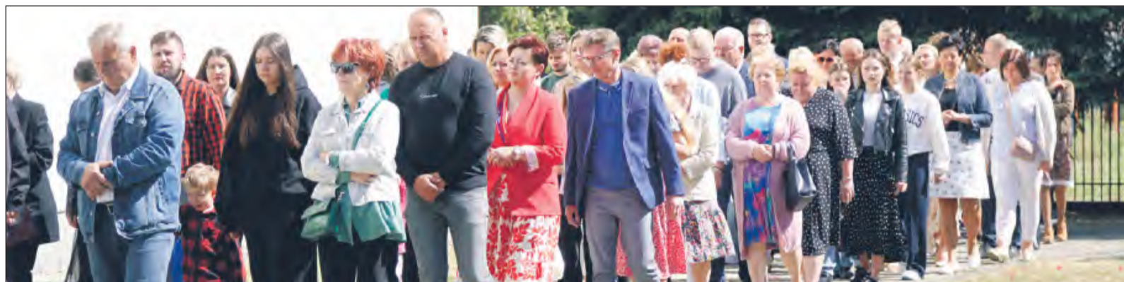
☛ Jak co roku dziesiątki dęblian wzięło udział w sumie odpustowej ku czci Matki Bożej Częstochowskiej

Uroczystości Najświętszej Maryi Panny Częstochowskiej została ustanowiona