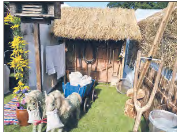
➤ W konkursie na najpiękniejsze stoisko pierwsze miejsce zajęło KGW Stare Zadybie