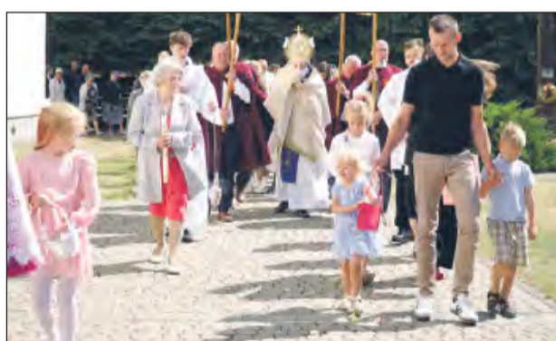
☛ Najmłodsze dziewczynki sypały kwiaty przed Eucharystycznym Jezusem

dzięki staraniom bł. Honorata Koźmińskiego. Po upadku powstania styczniowego pragnął on zjednoczyć Polaków wokół Matki Najświętszej. W 1904 roku, razem z ówczesnym przeorem Jasnej Góry, uzyskał zgodę papieża św. Piusa X na ustanowienie święta. W 1931 roku papież Pius XI rozszerzył je na cały kraj. Sercem tego święta jest oczywiście cudowny wizerunek Matki Bożej, który od