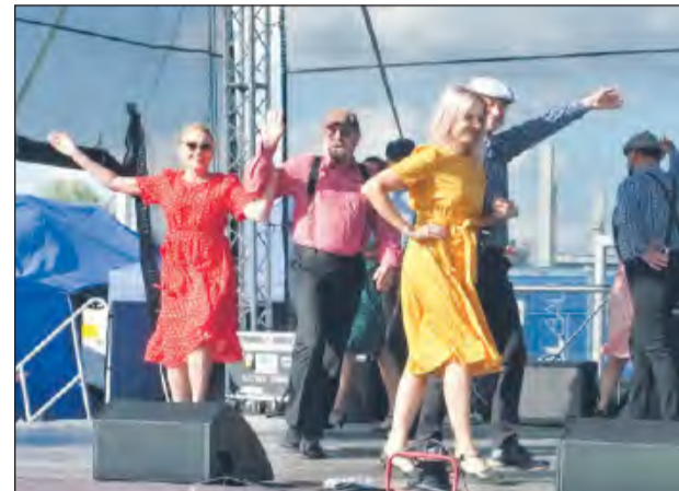
♣ Złożony z par małżeńskich zespół „Dębliniaczy” zaprezentował kilka układów tanecznych