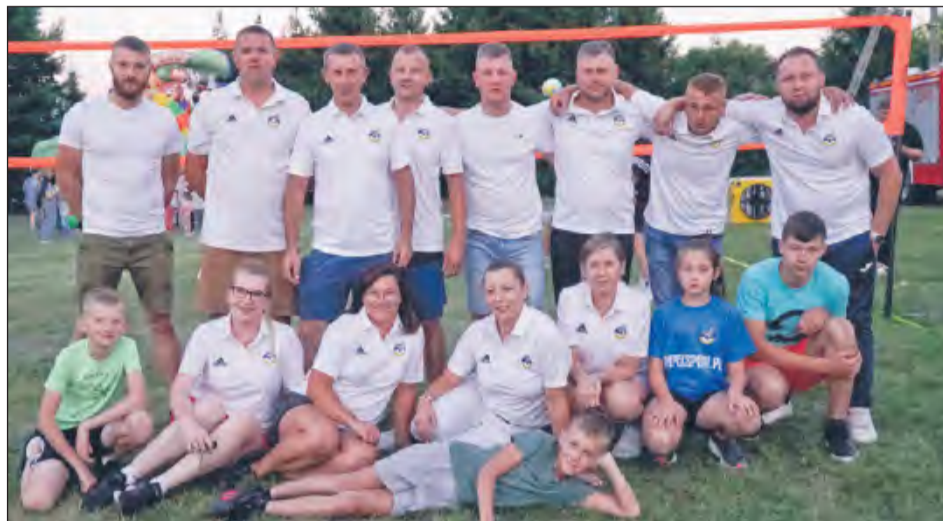
☛ Działacze i sympatycy klubu „Orleńca” Nowodwór w doskonałych humorach bawili się na pikniku

Tegoroczne wakacje powoli stają się już tylko wspomnieniem. W Nowodworze, na ich radosne zakończenie mieszkańców, zaprosili strażacy z miejscowej OSP. Było mnóstwo śmiechu, zabawy i... piany