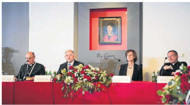
Colloquium Charitativum Novum nawiązuje do tego z 1645 kiedy w Toruniu podjęto próbę dialogu między przedstawicielami różnych wyznań chrześcijańskich

Jako zwieńczenie toruńskich uroczystości zaplanowano uroczyste wręczenie Nagrody Mikołaja Kopernika Fides et Ratio prof. Marcie Cartabii w Pałacu Dąbskich. To trzecie przyznanie wyróżnienia ustanowionego przez samorząd województwa kujawsko-pomorskiego. W poprzednich latach otrzymali je kard. Grzegorz Ryś oraz Joseph Weiler. Tegoroczna laureatka należy do najbardziej wpływowych europejskich konstytucjonalistów. ©