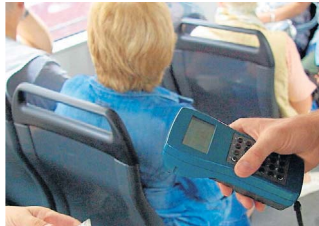
W 2025 r. przeprowadzono łącznie 156 810 kontroli biletów

- Nieoficjalnie wiem, że Państwowa Inspekcja Pracy nałożyła jakąś karę i zaproponowała przeniesienie „zleceniowców” na etaty. Nie było na to jednak pieniędzy, więc ich zwolniono - dodaje.