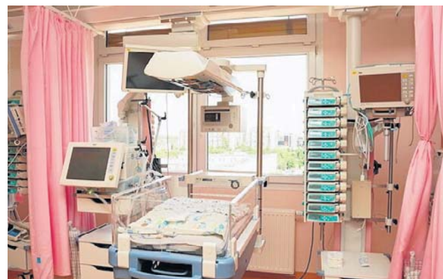
Centrum Urazowe funkcjonuje jako wyodrębniona część szpitala, integrująca Szpitalny Oddział Ratunkowy z kluczowymi klinikami specjalistycznymi

Centrum Urazowe dla Dzieci zostało uwzględnione w Wojewódzkim Planie Działania Sys-