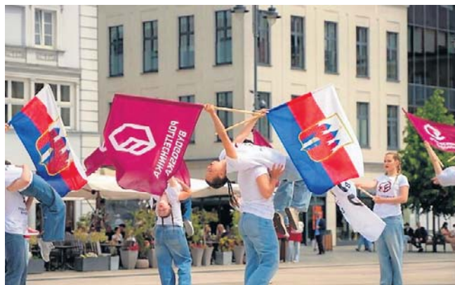
Płyta Starego Rynku była miejscem jubileuszowego flashmobu, przygotowanego przez Zespół Tańca BRAX i studentów Politechniki Bydgoskiej

Z kolei 17 czerwca w fordońskim kampusie uczelni odbędzie się uroczyste Otwarte Posiedzenie Senatu Uczelni z udziałem wspólnoty akademickiej i zaproszonych gości. ©©