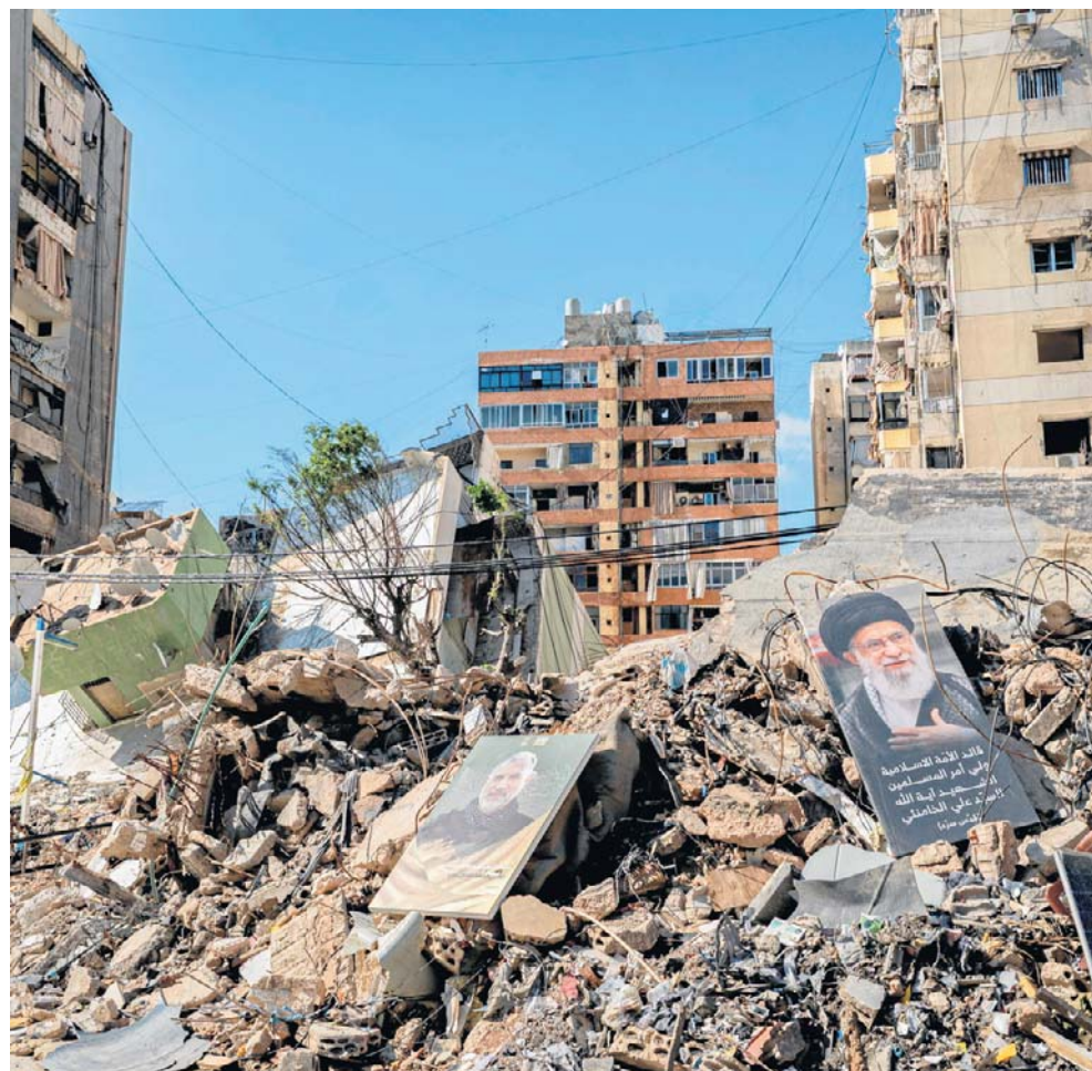
Zniszczone budynki na południowych przedmieściach Bejrutu. Tysiące mieszkańców po atakach trwających od marca zostało zmuszonych do opuszczenia swoich domów

Dotychczas w starciach po stronie Libanu zginęło ponad 3,3 tys. osób. Po stronie izraelskiej poległo 24 żołnierzy i czterech cywilów. Dziesiątki tysięcy Izraelczyków musiały