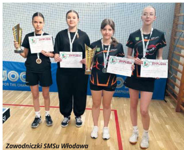
Zawodniczki SMSu Włodawa

Udział w Mistrzostwach Województwa Lubelskiego w Niedźwiadzie do udanych za-