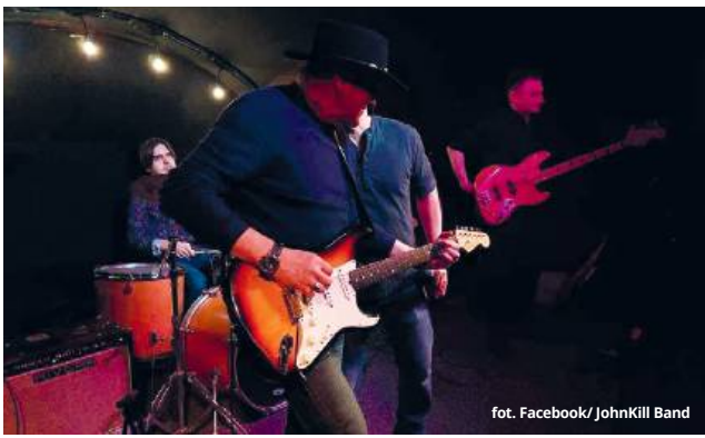
fol. Facebook/ JohnKill Band